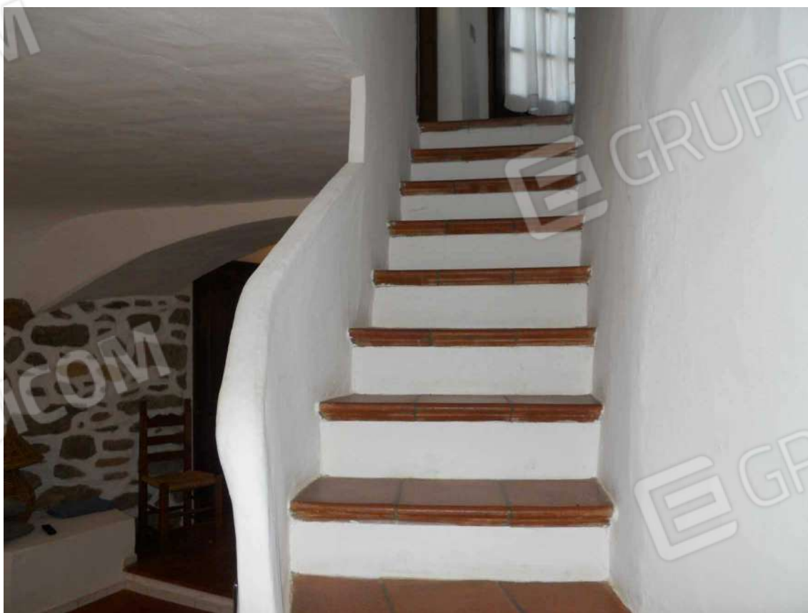
Foto 14: vista particolare delle scale che portano alla zona notte.