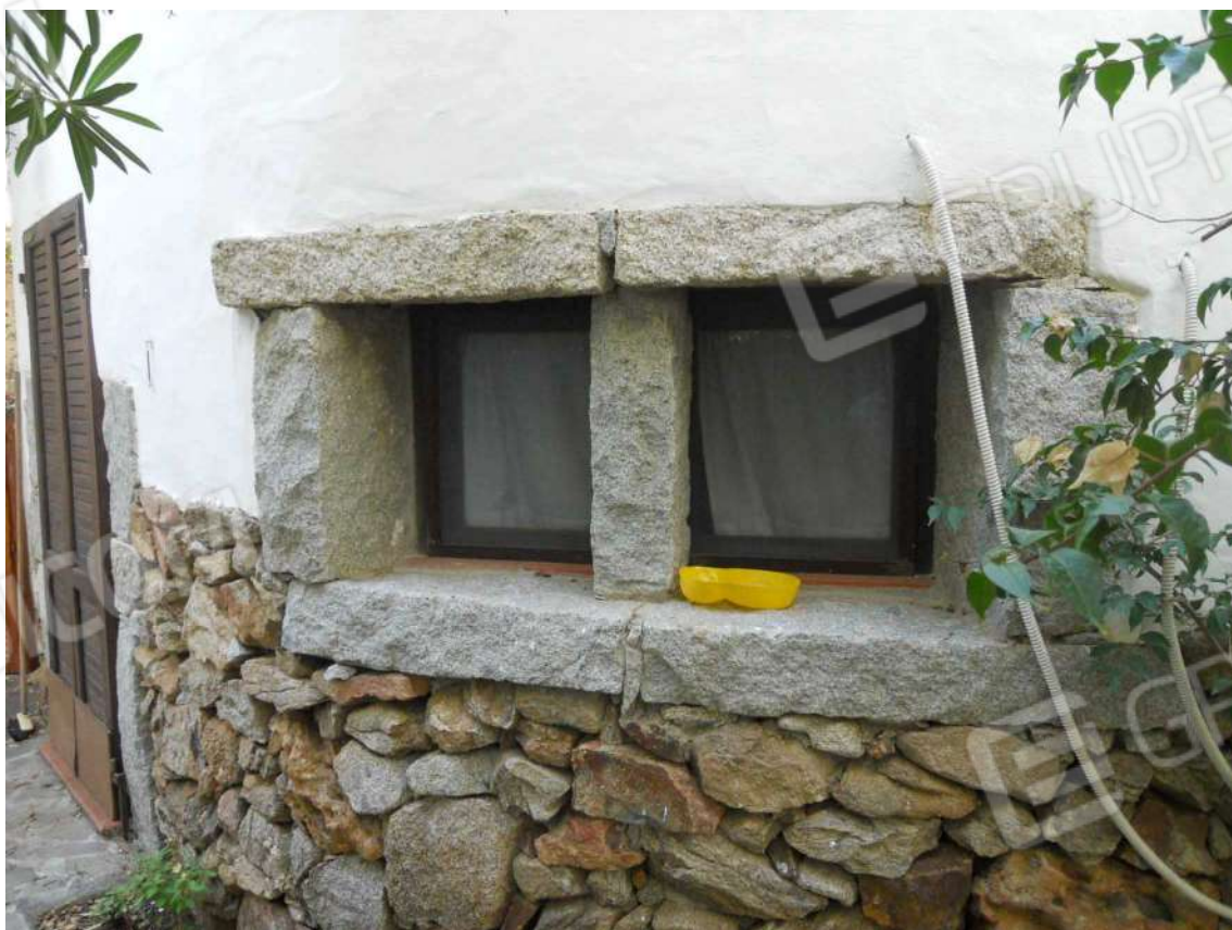
Foto 8: vista di dettaglio delle finiture esterne e riquadri aperture.