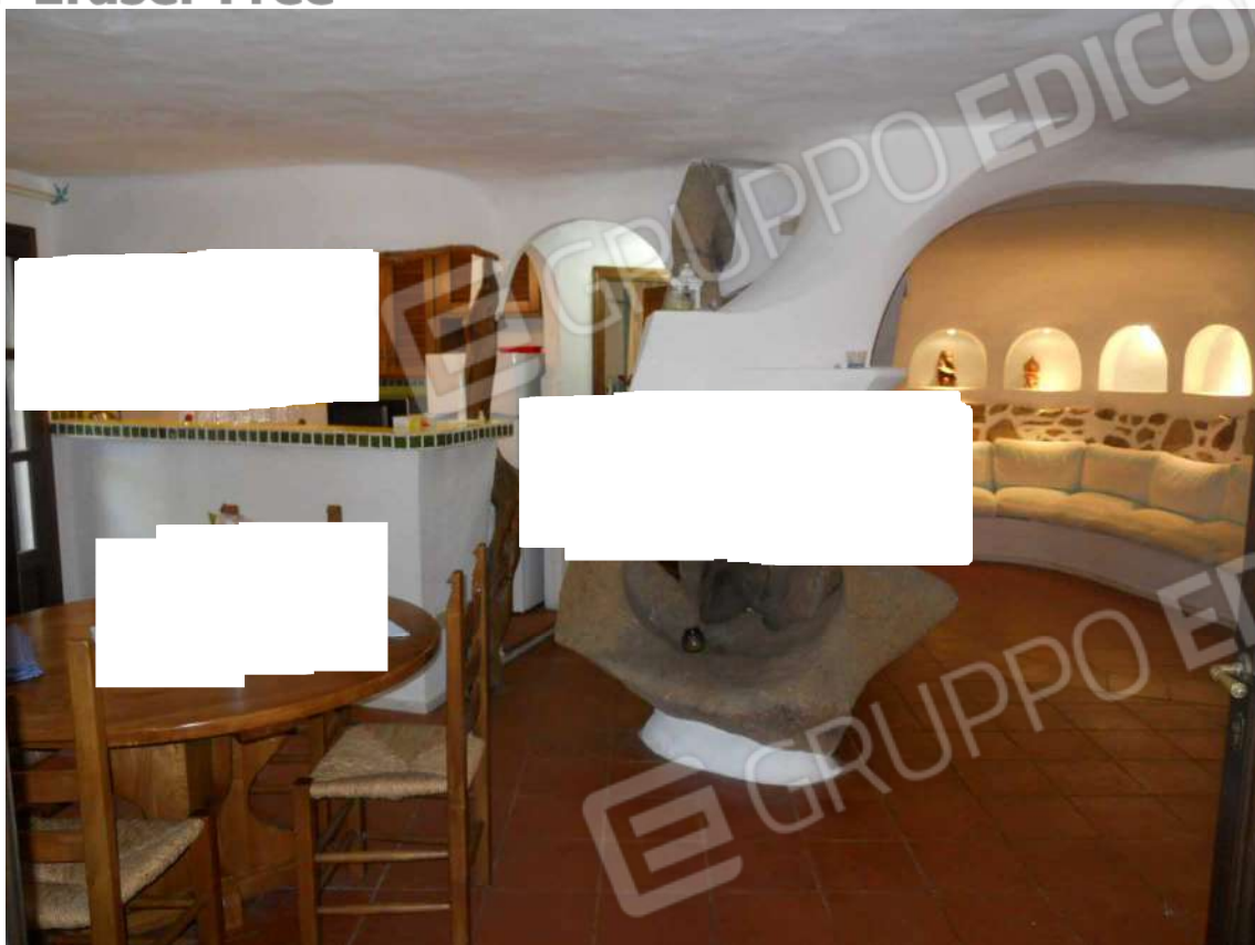
Foto 11: vista della zona giorno, al centro il camino realizzato con elemento lapideo naturale.