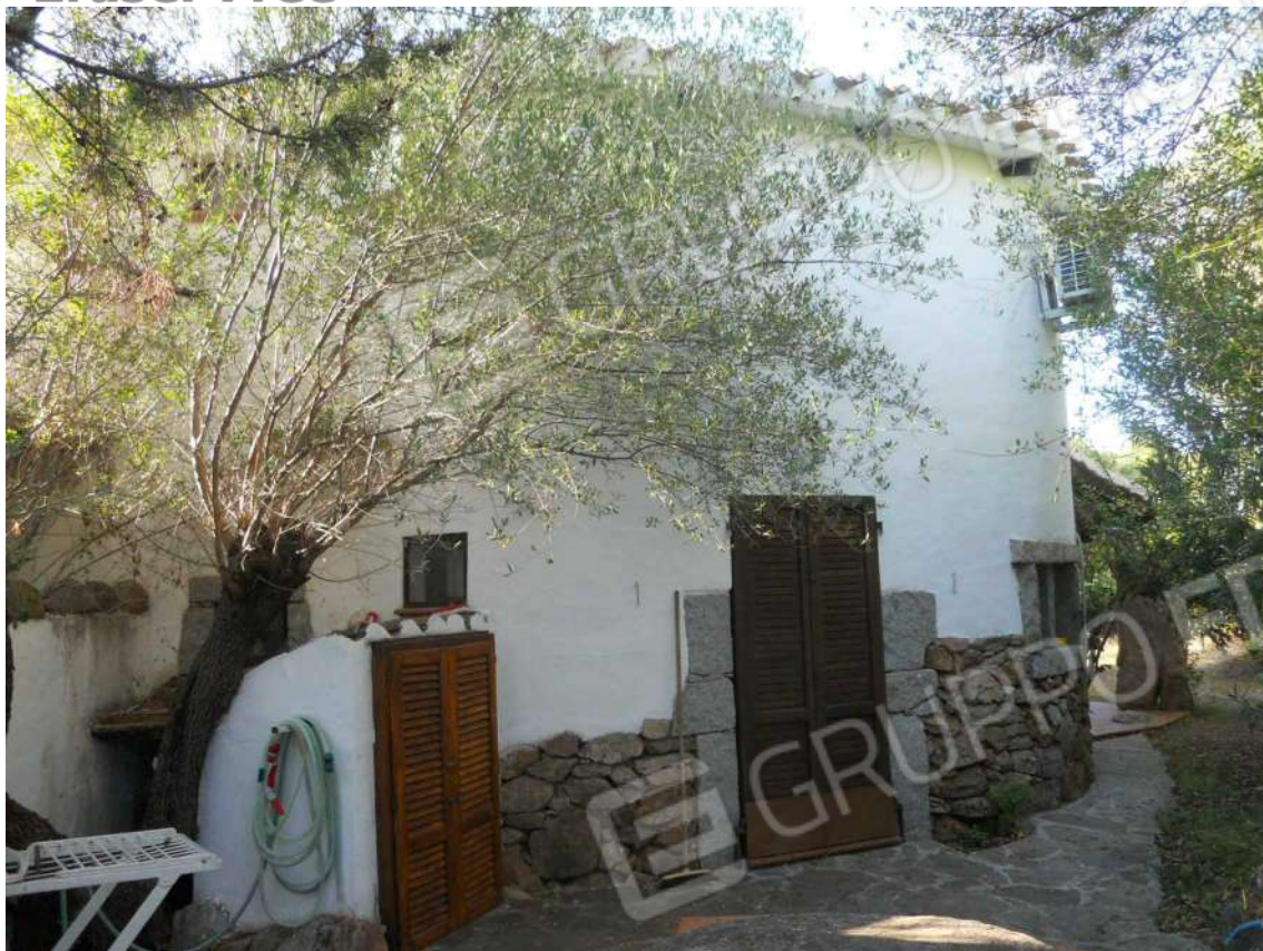
Foto 7: vista dalla zona barbecue verso uscita dalla zona giorno. Sulla sinistra il piccolo ripostiglio ospita lavatrice e boiler.