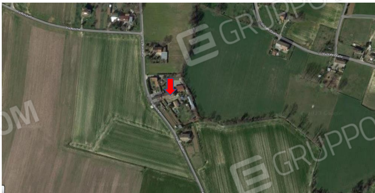
0. Ripresa satellitare