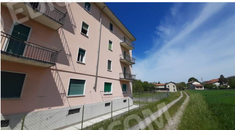
la facciata rivota a est, opposta alla ferrovia