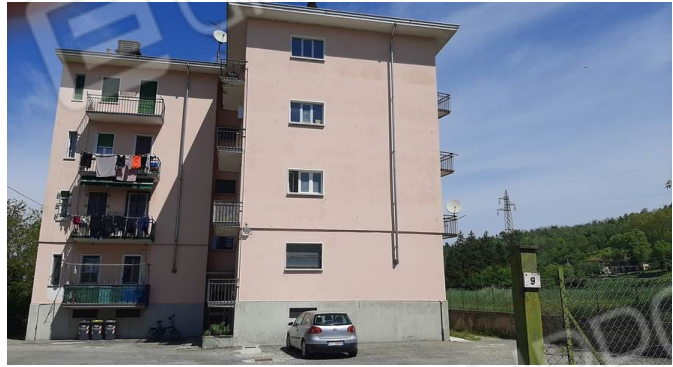
l'ingresso condominiale sul lato sud