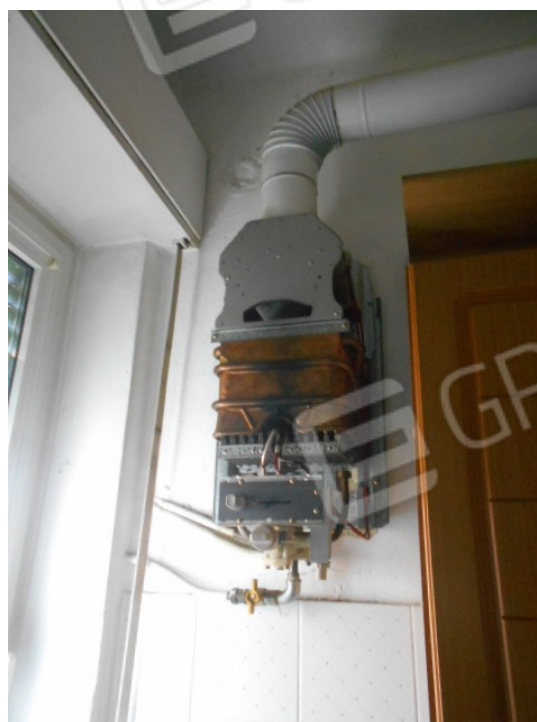
la calderina a metano