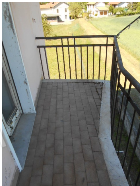
il balcone rivolto ad est