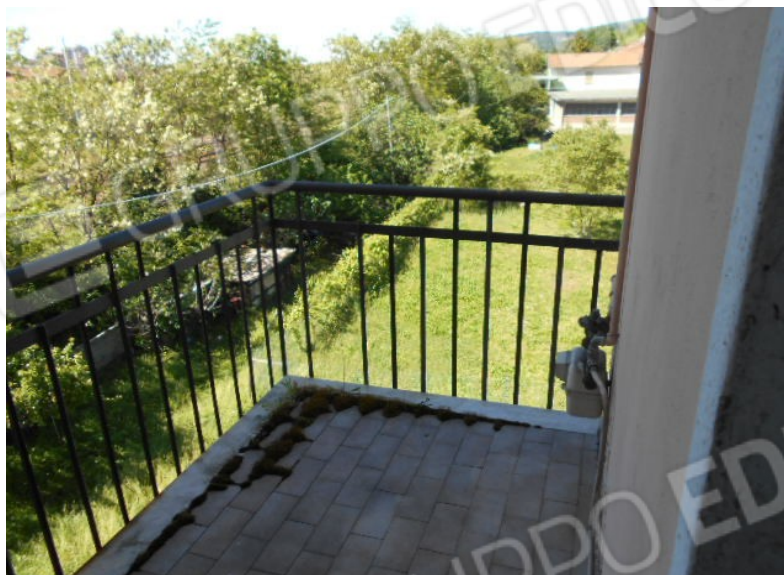
Il balcone rivolto ad ovest, verso la ferrovia