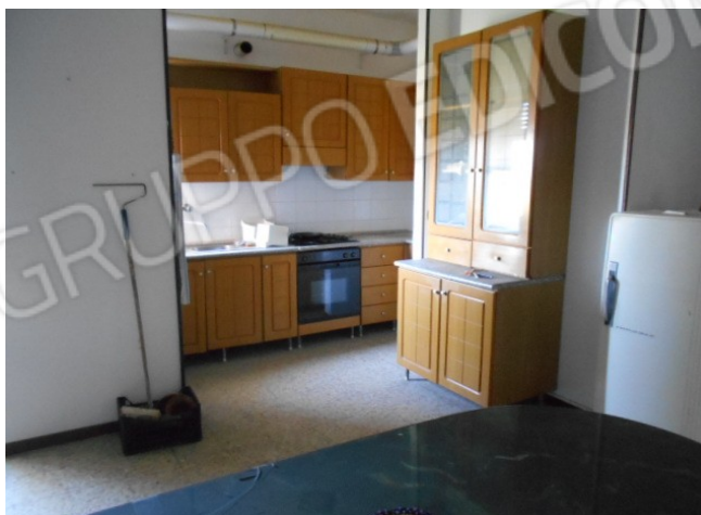
e il cucinino