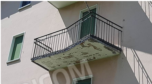
l'intradosso del balcone est