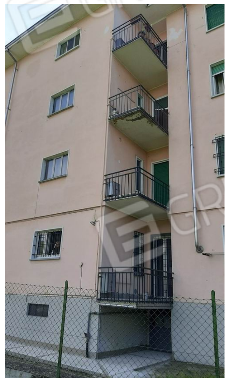
la testata nord