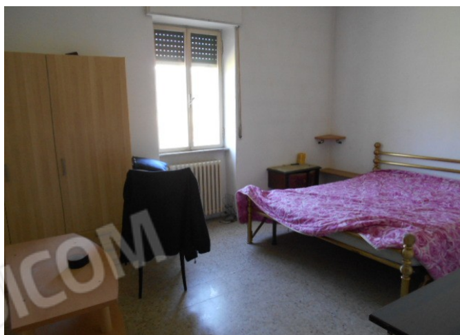
le due camere