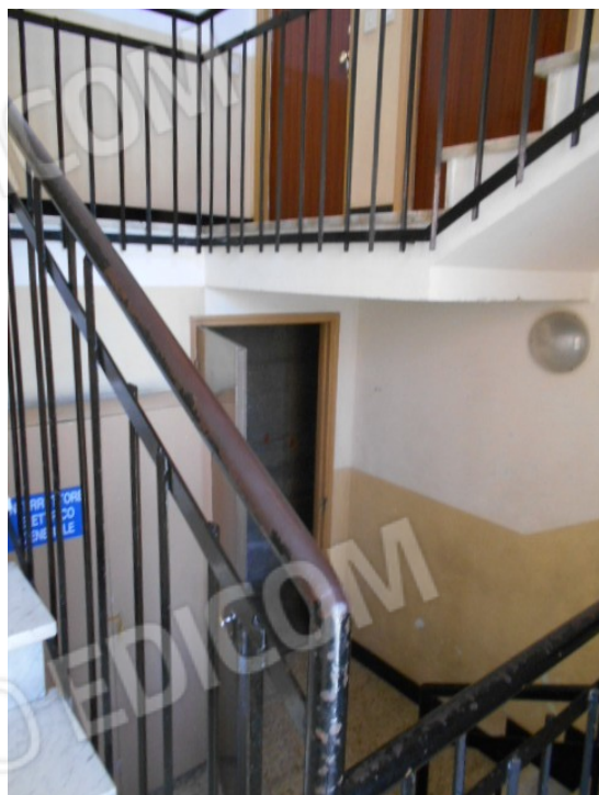
il vano scala condominiale