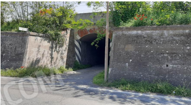
l'imbocco di via nuova Vignole dalla provinciale 143