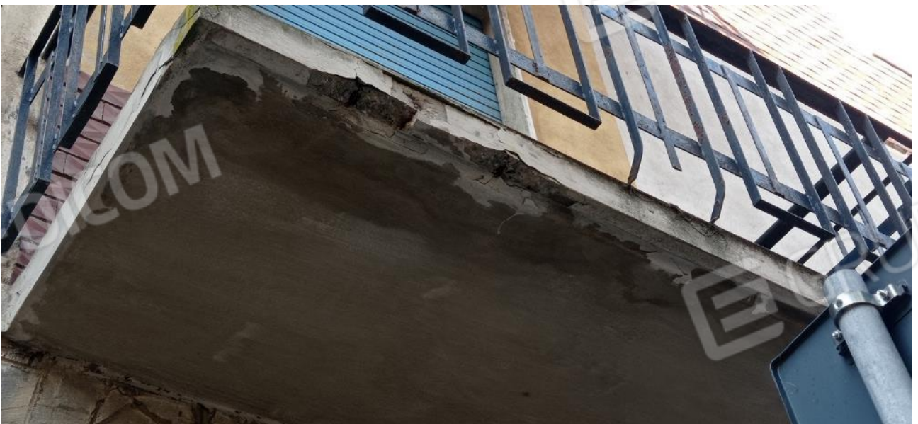
35. Dettaglio balcone su Via Fernandel