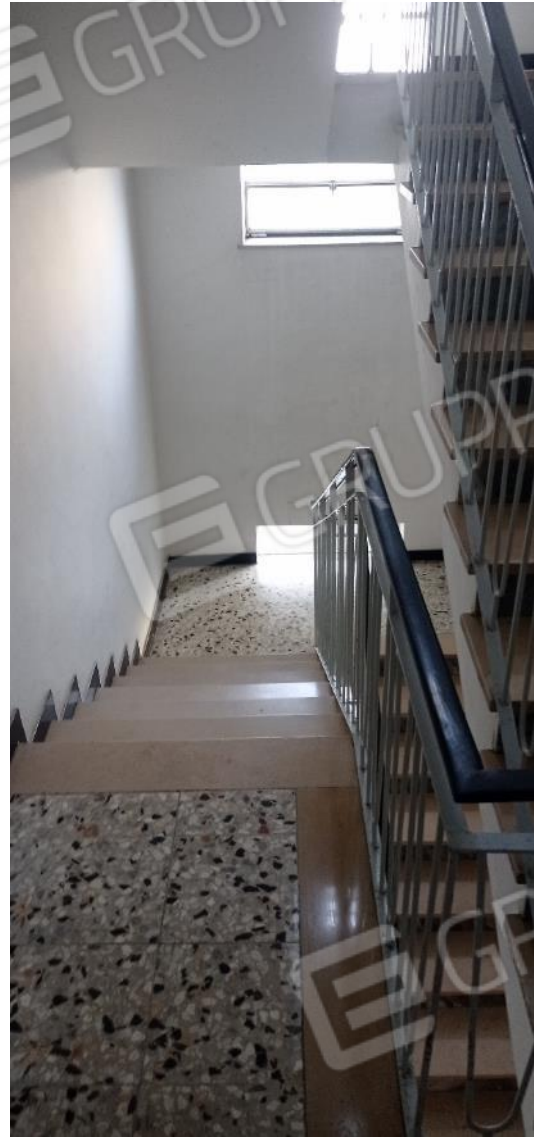
7. Vano scala condominiale