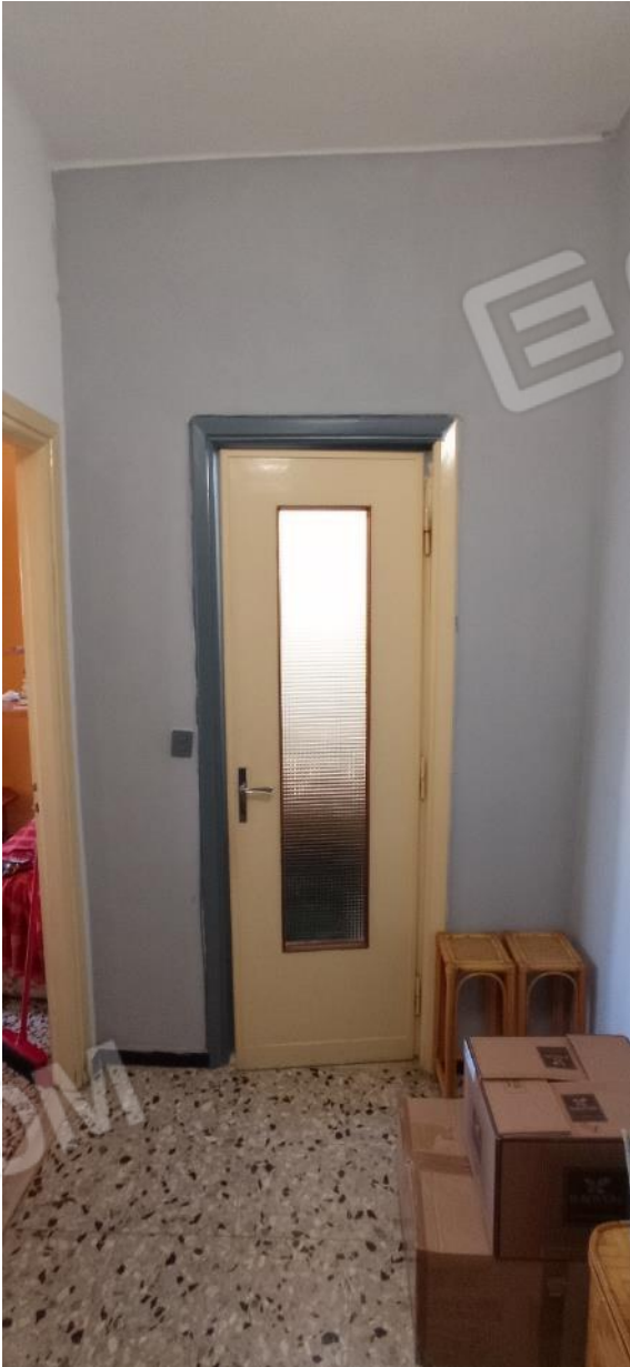
10. Corridoio e ingresso ripostiglio