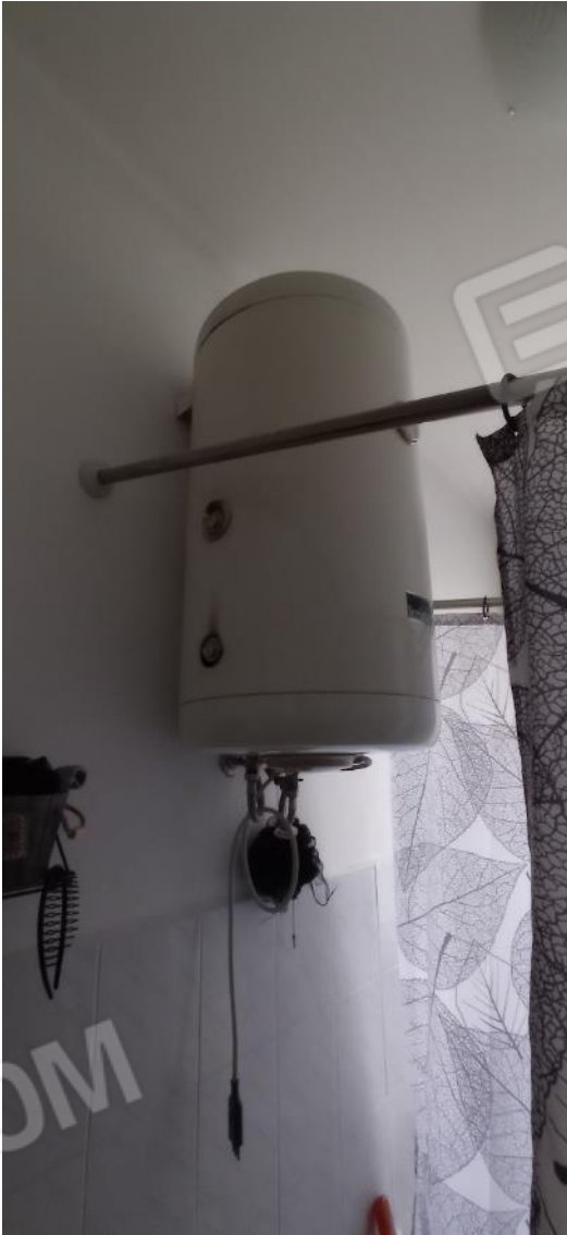
20. Bollitore acqua calda sanitaria