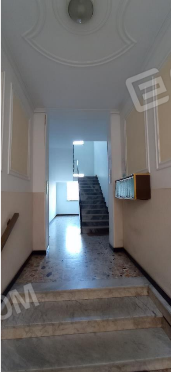
3. Vano scala condominiale