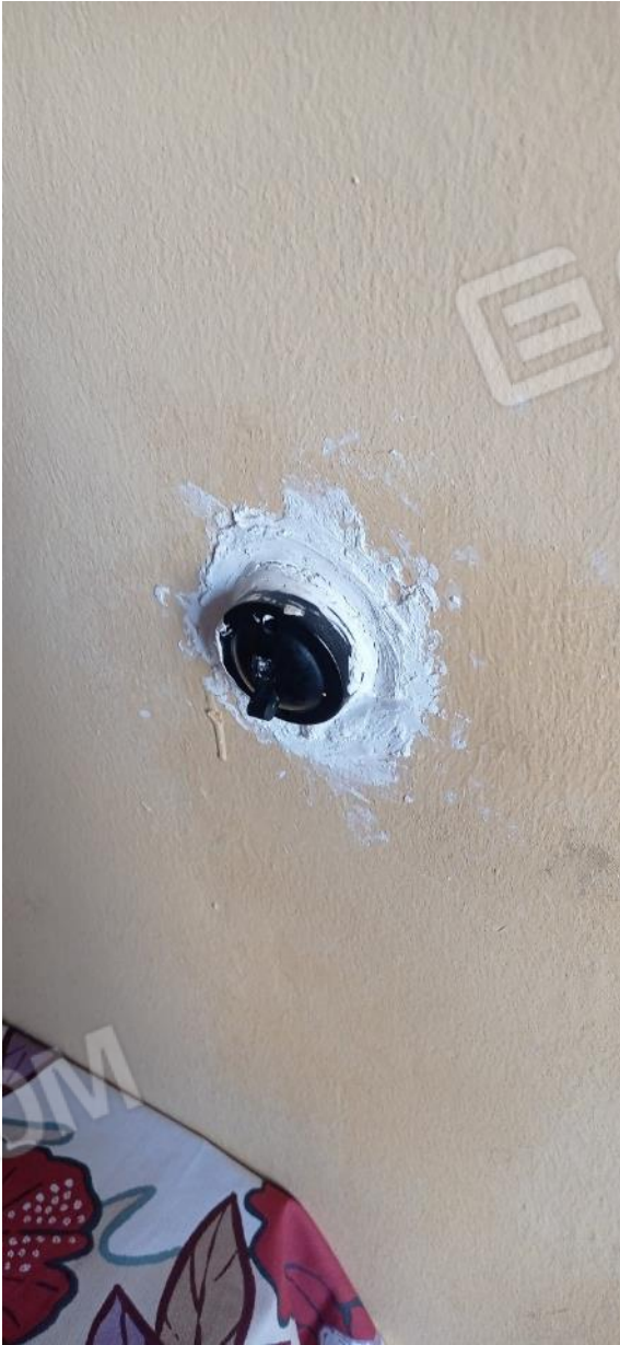
27. Dettaglio impianto elettrico