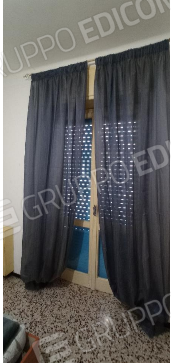
15. Serramento camera lato Via Fernandel