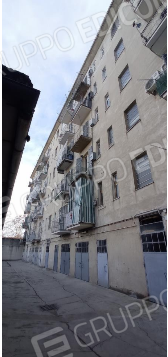
4. Prospetto su cortile interno