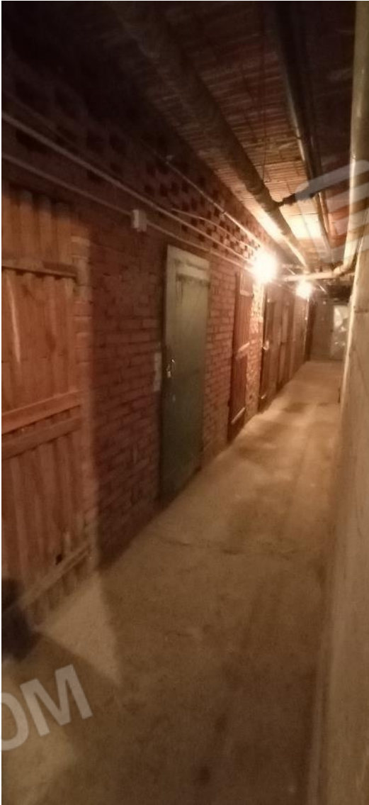
33. Piano cantine