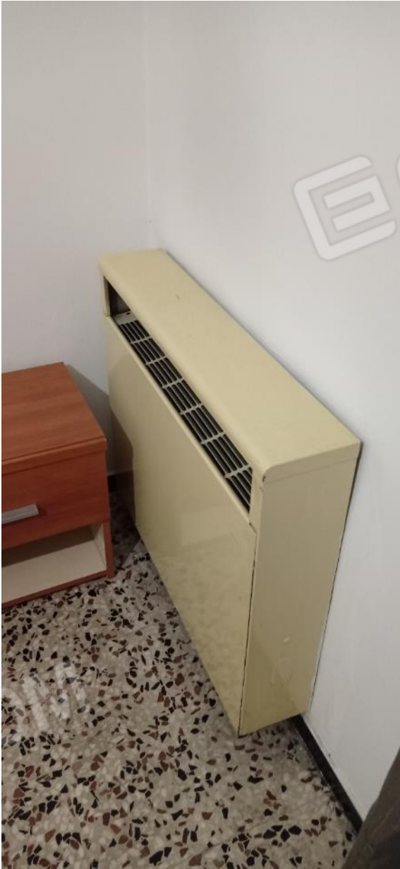
14. Dettaglio convettore