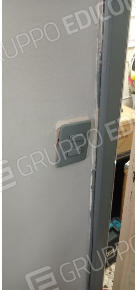
28. Dettaglio impianto elettrico