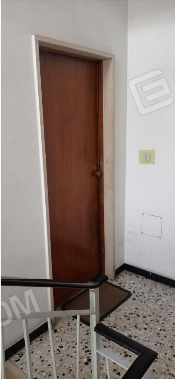
8. Ingresso unità immobiliare da vano scala