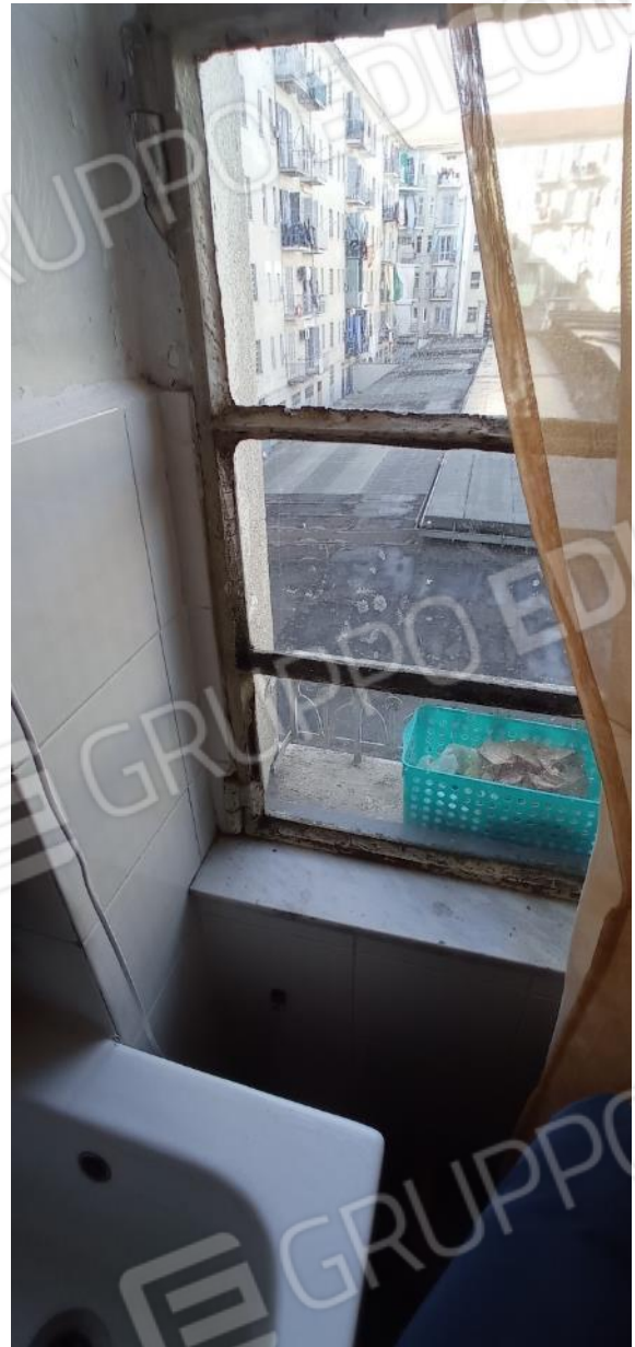
26. Dettaglio serramento cucina