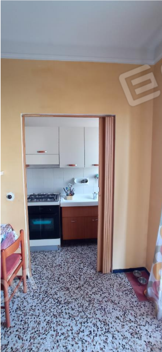
23. Tinello – vista su cucina