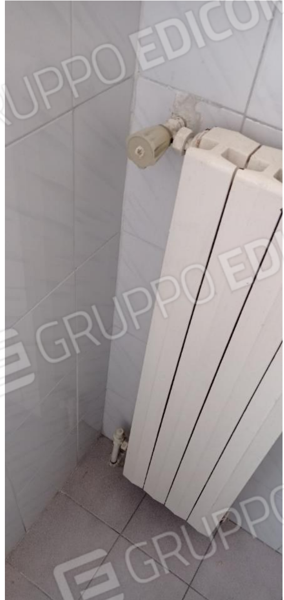
19. Dettaglio radiatore bagno