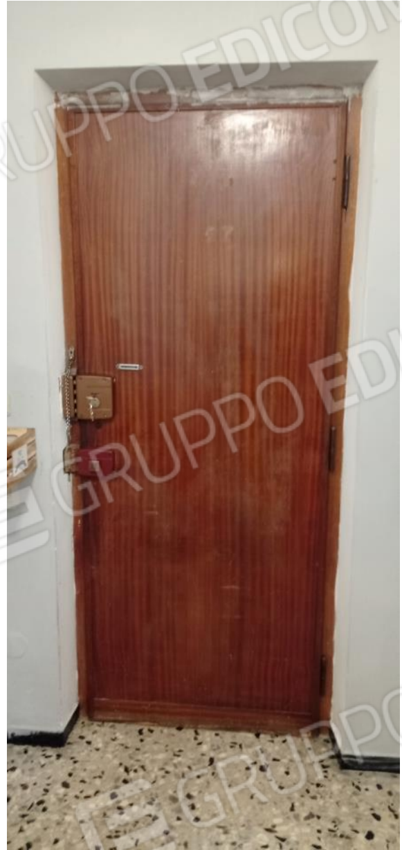
9. Ingresso unità immobiliare da corridoio