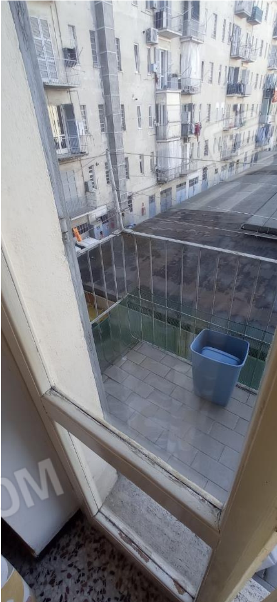
31. Dettaglio serramento lato cortile interno