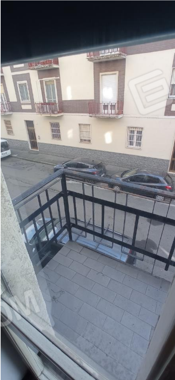
29. Balcone lato Via Fernandel