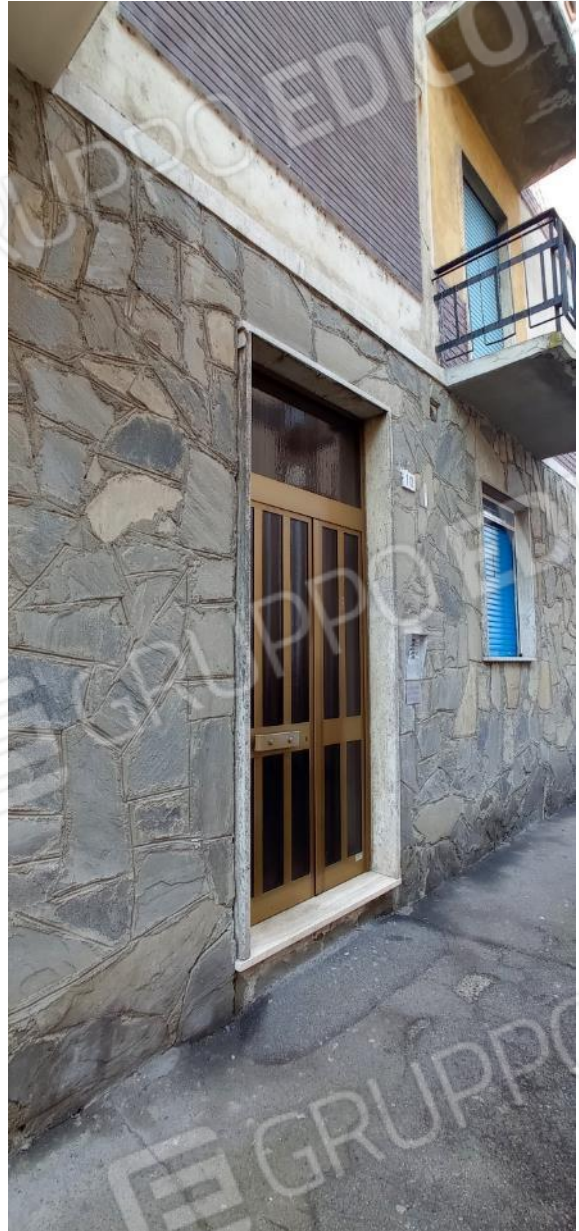
2. Portoncino di ingresso da strada