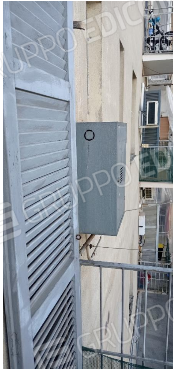
30. Balcone lato cortile interno