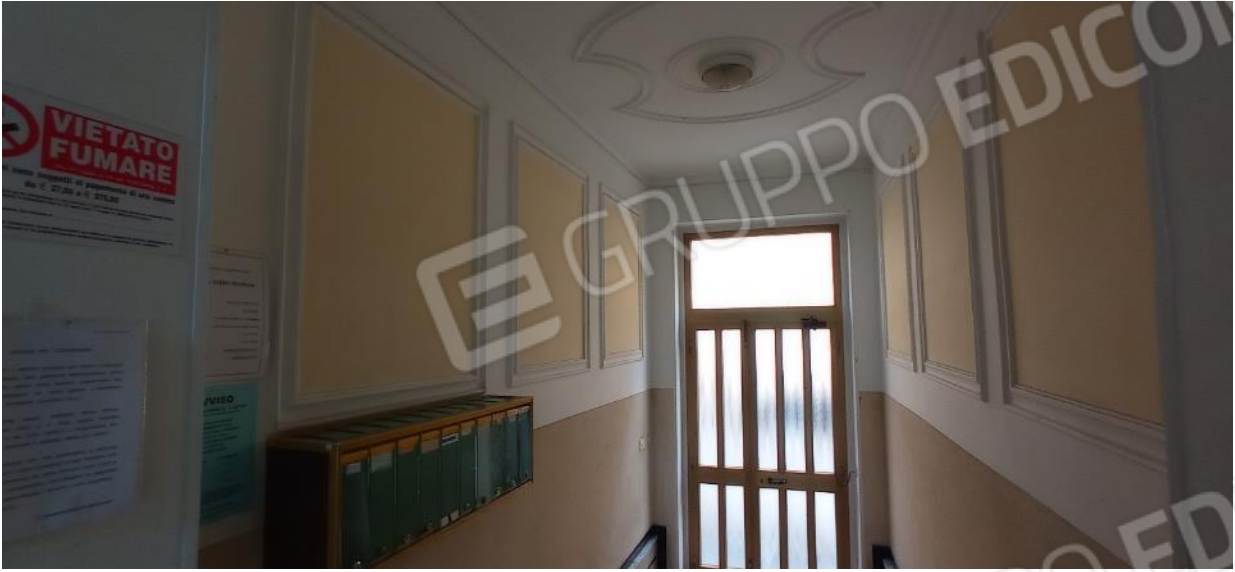
5. Vano scala condominiale