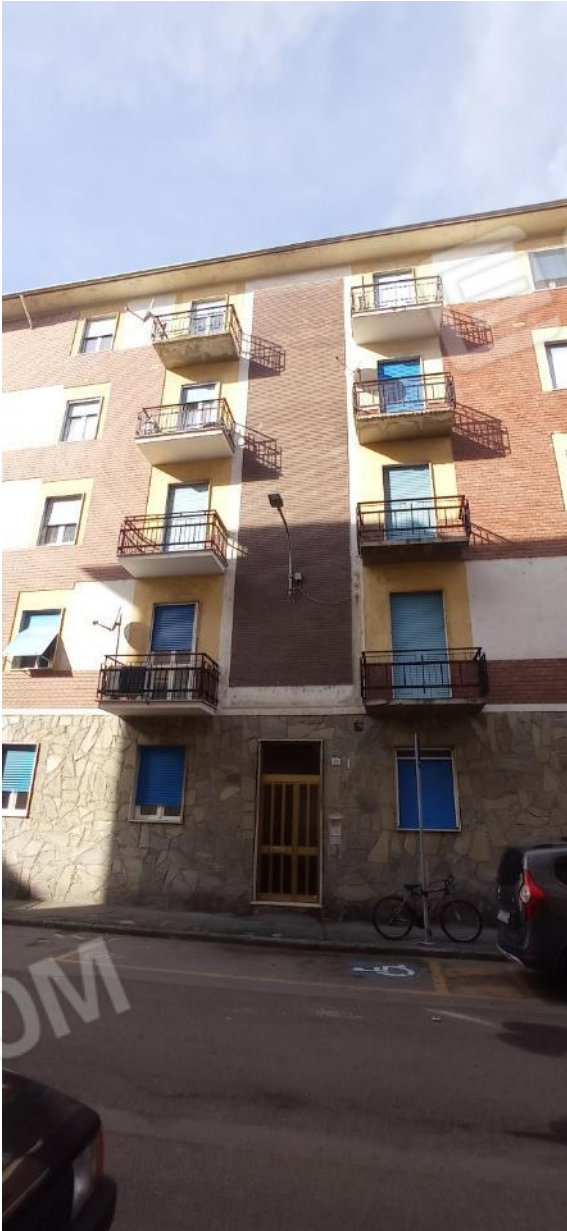
1. Prospetto su Via Fernandel