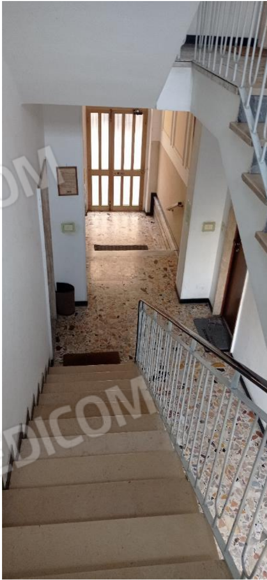
6. Vano scala condominiale