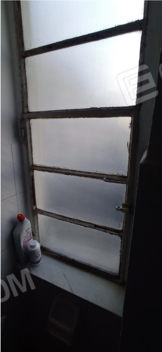
18. Dettaglio serramento bagno