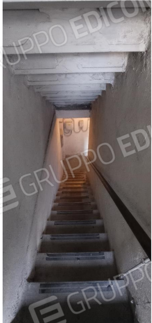
32. Scala accesso cantine