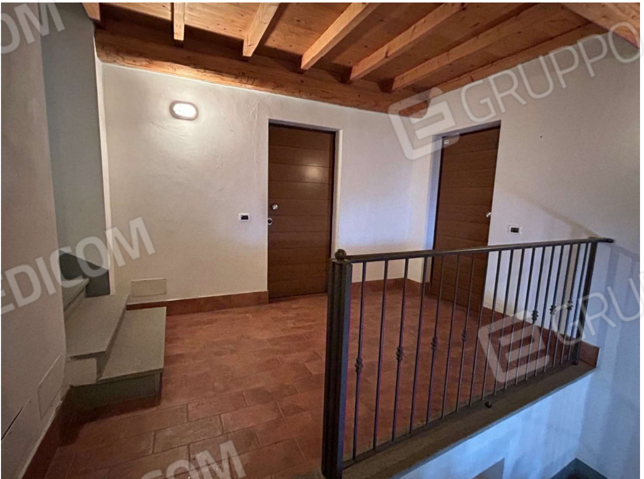
INGRESSO APPARTAMENTO AL PIANO PRIMO