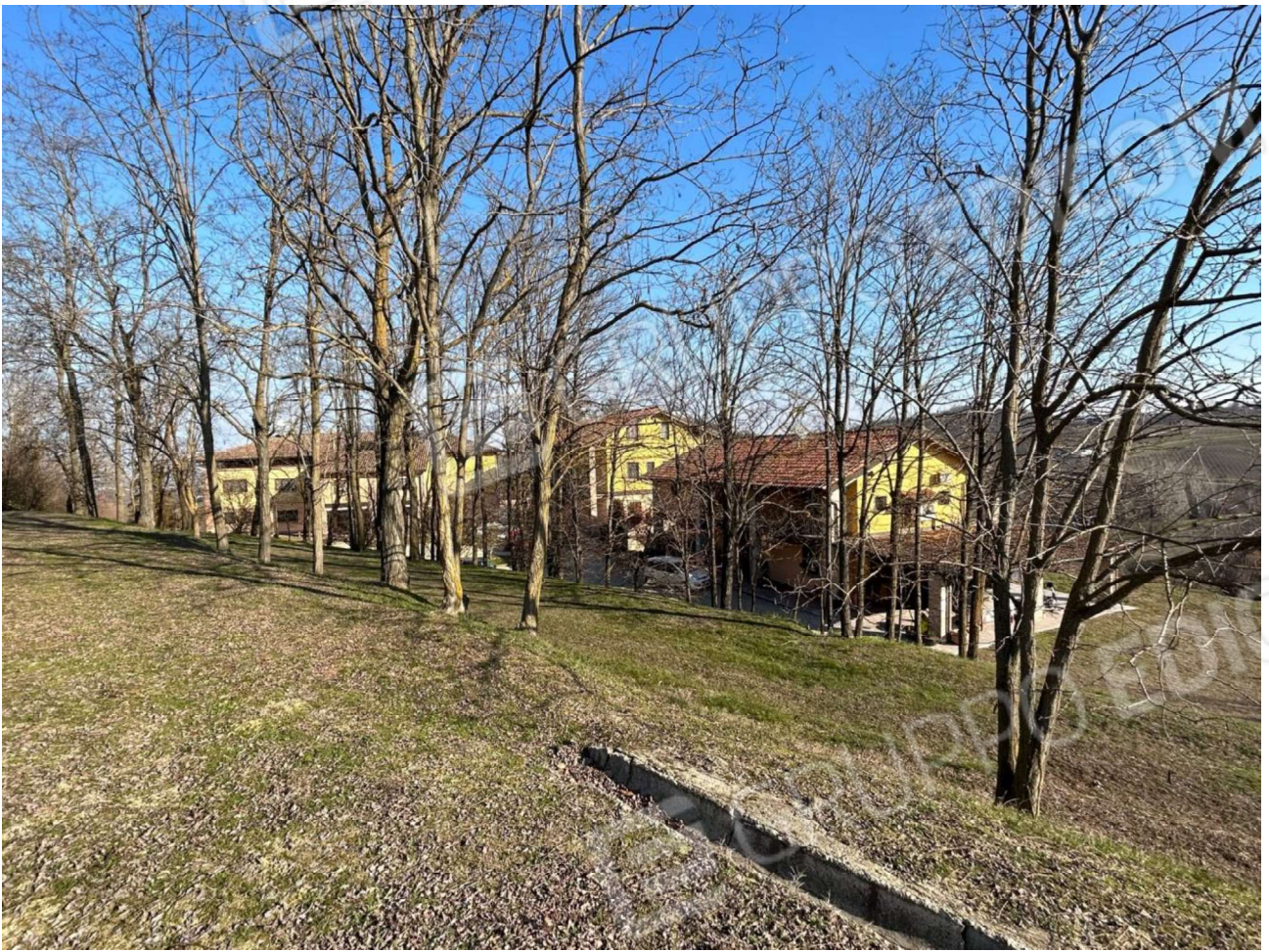
CONTESTO DELLA CASCINA RECARANO