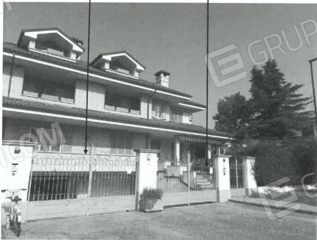
particella 317 Lotto n. 2