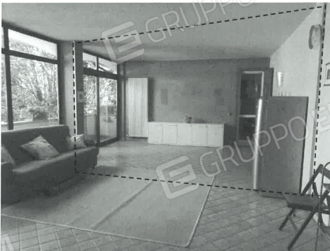
Foto n. 29_ sottotetto

Foto n. 28_Terrazzo al piano primo dove è necessario rimuovere le vetrate e costruire la tramezza a divisione tra la particella 315 Lotto n. 1 e la particella 317 Lotto n. 2