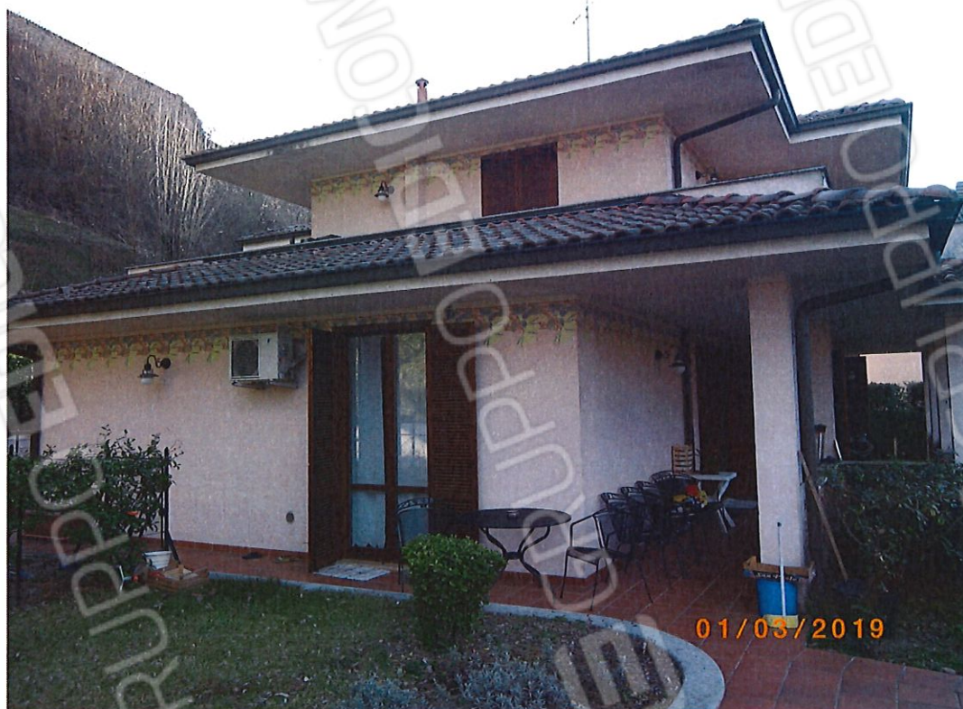
FOTO 7 Dettaglio del fronte Est della villa. Sulla destra, il porticato verso strada.