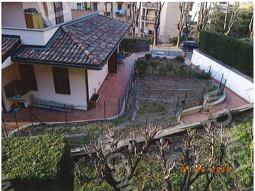
FOTO 6 Il giardino pensile soprastante il garage e' circondato da un percorso pedonale pavimentato in cotto.