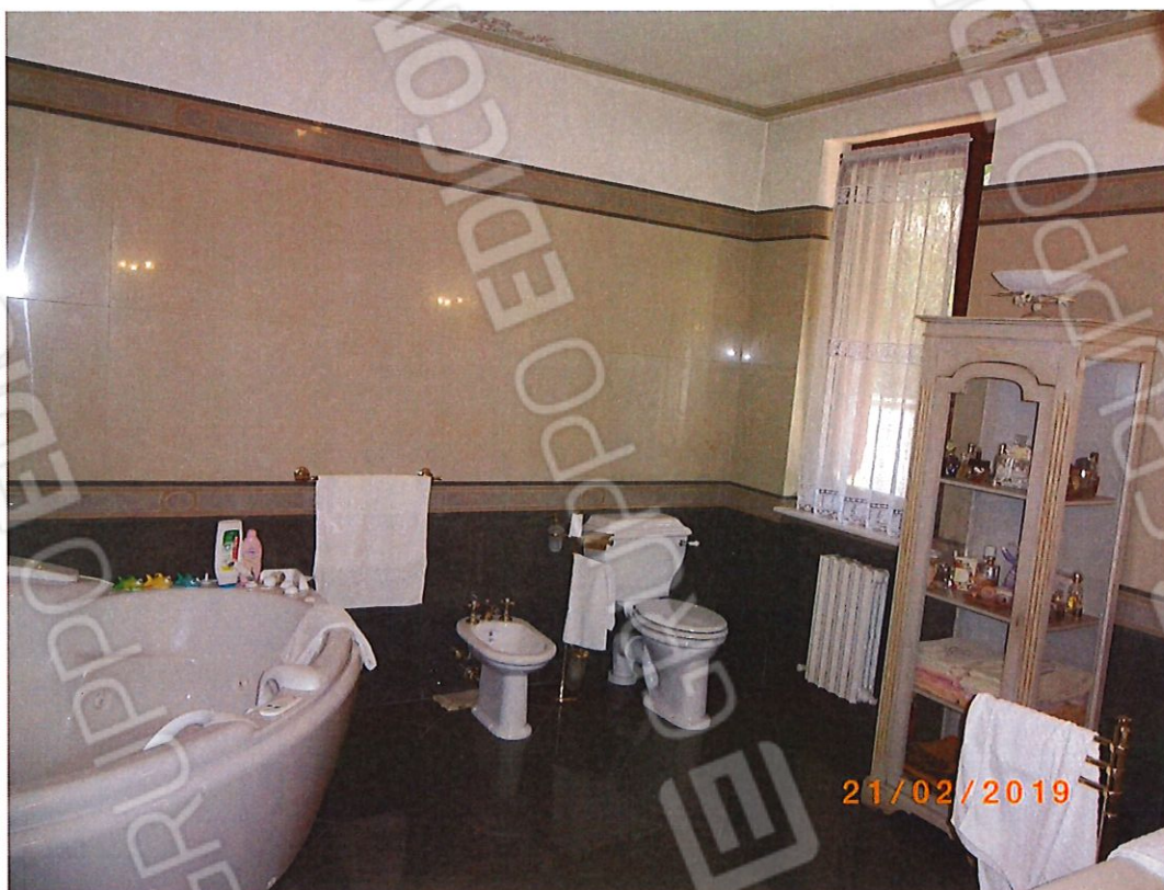
FOTO 13 Scorcio della “sala” da bagno, ottimamente rifinita, al piano terra della villa.