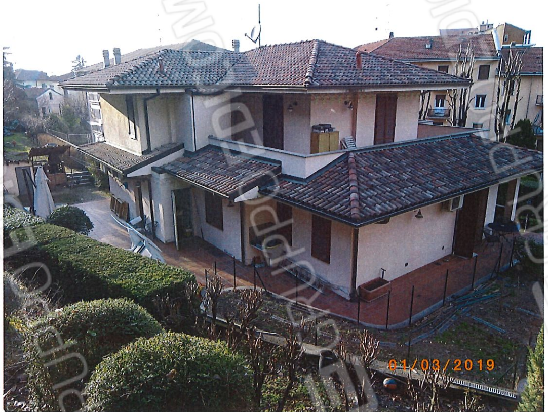
FOTO 5 Vista dell'angolo Sud-Est.