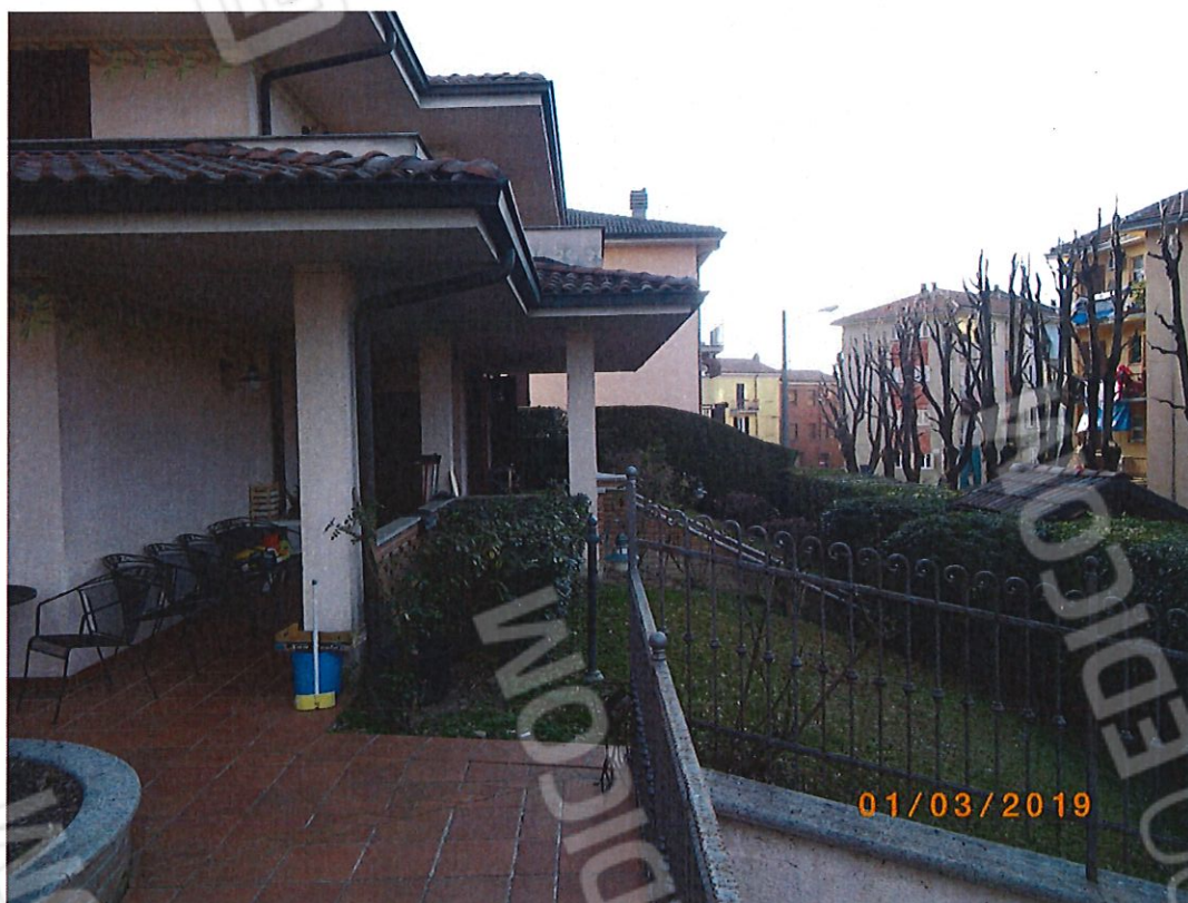
FOTO 8 L'area verde tra il porticato e la recinzione sulla pubblica strada. Il portoncino di ingresso alla villa si affaccia sul porticato.