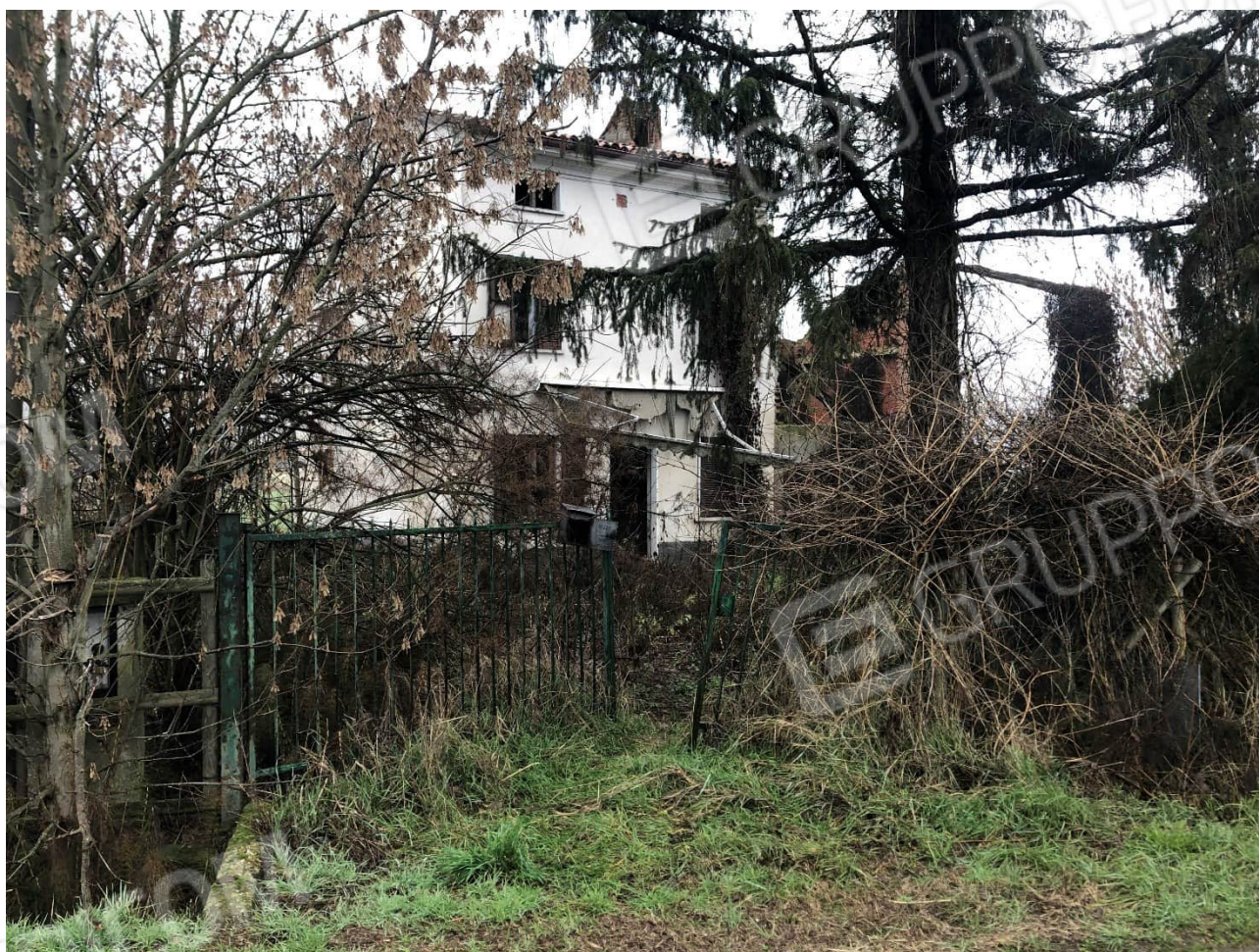
Foto n. 1 – Immobili oggetto di procedura, vista da strada pubblica

Immobile ubicato in Comune di Sale Via Alessandria, 79