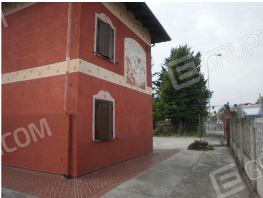
Vista dei corpi accessori al fabbricato principale di civile abitazione