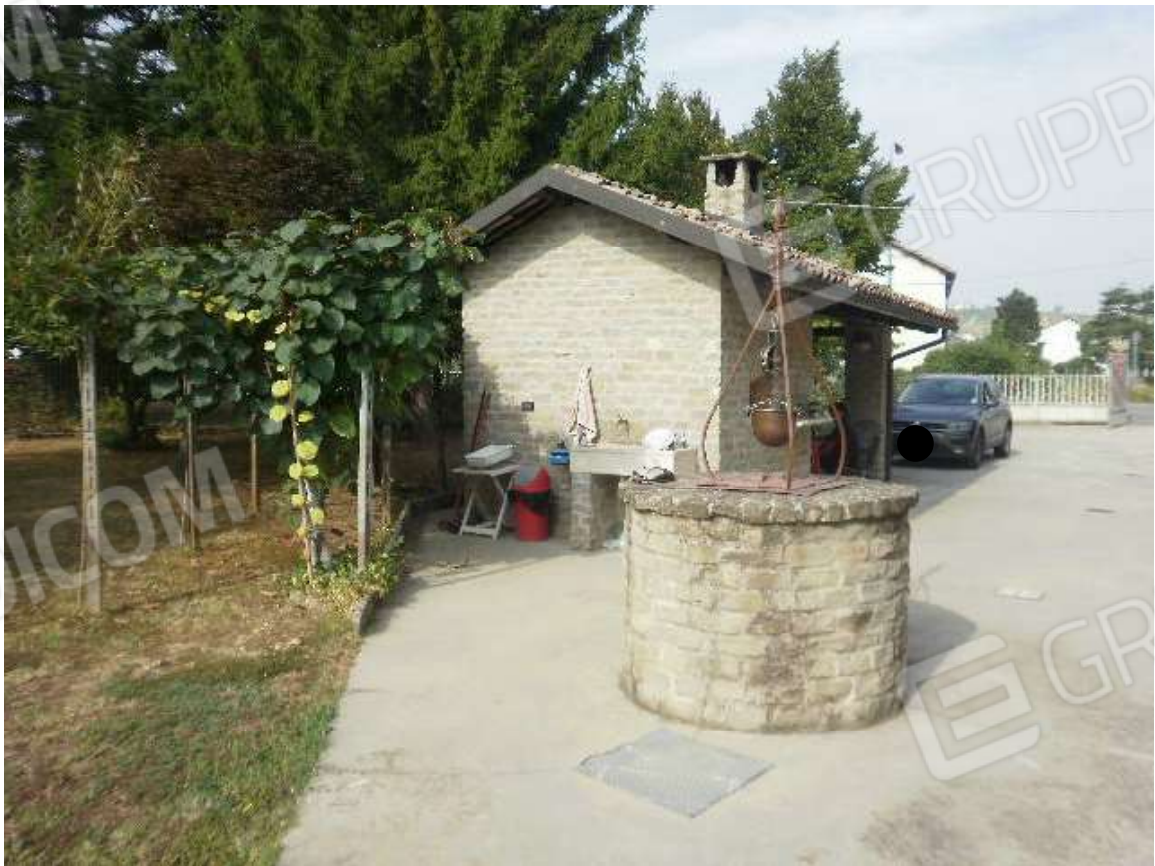
Vista fabbricato accessorio destinato a porticato con forno familiare