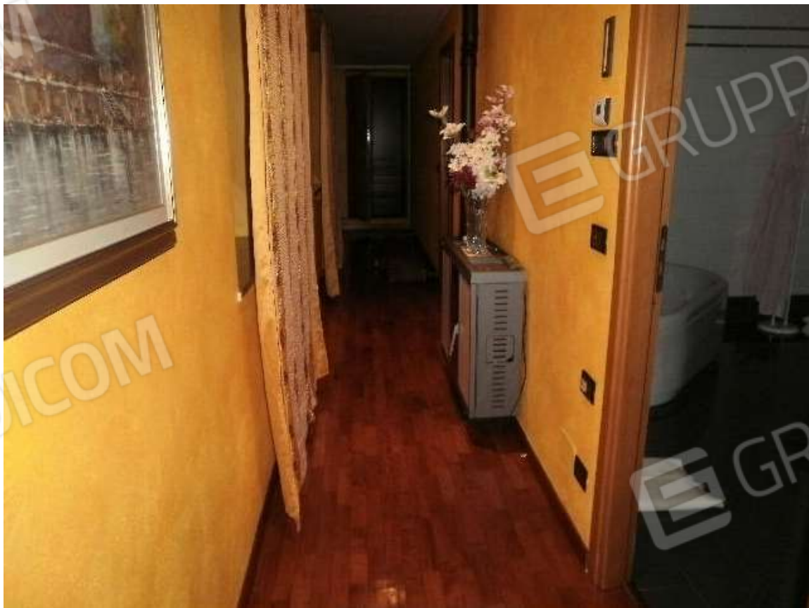
Vista interna tipologie rifiniture locali residenziali posti in piano primo del fabbricato di civile abitazione