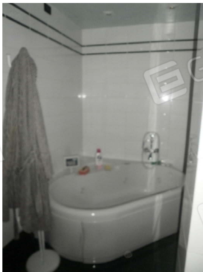
Vista interna tipologie rifiniture locale bagno posto in piano primo del fabbricato di civile abitazione