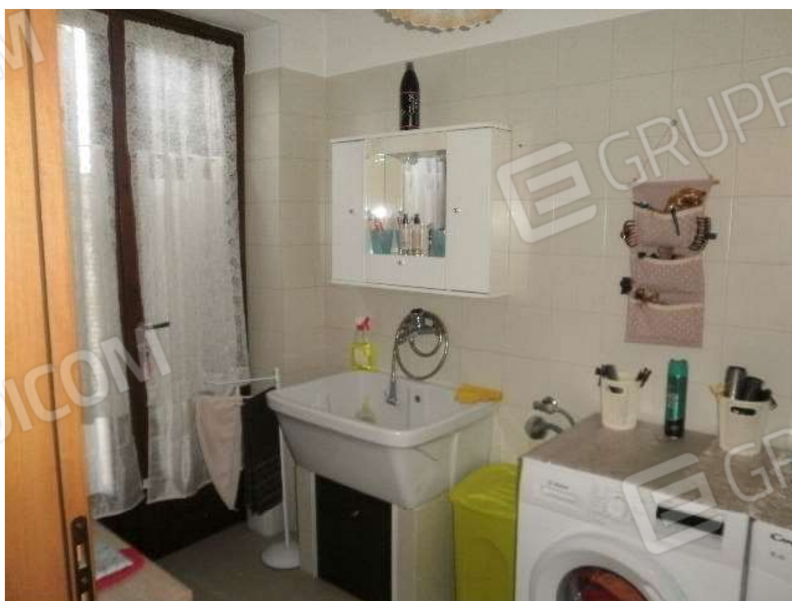
Vista interna tipologie rifiniture locale bagno posto in piano terra del fabbricato di civile abitazione