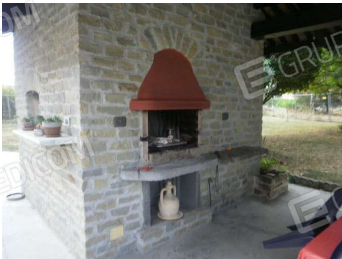
Vista fabbricato accessorio destinato a porticato con forno familiare