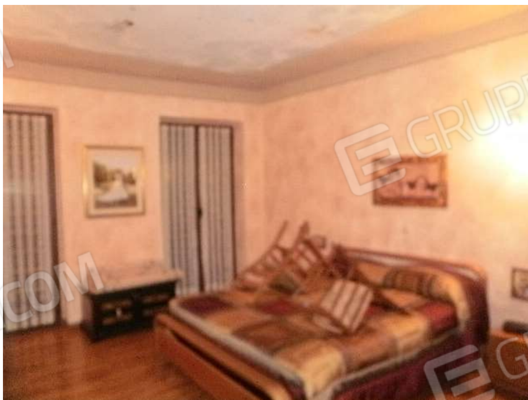
Vista interna tipologie rifiniture locali residenziali posti in piano primo del fabbricato di civile abitazione