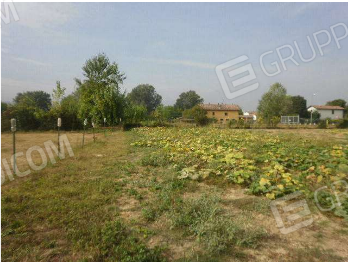
Vista giacitura terreni a destinazione agricola direttamente comunicanti con il fabbricato di civile abitazione