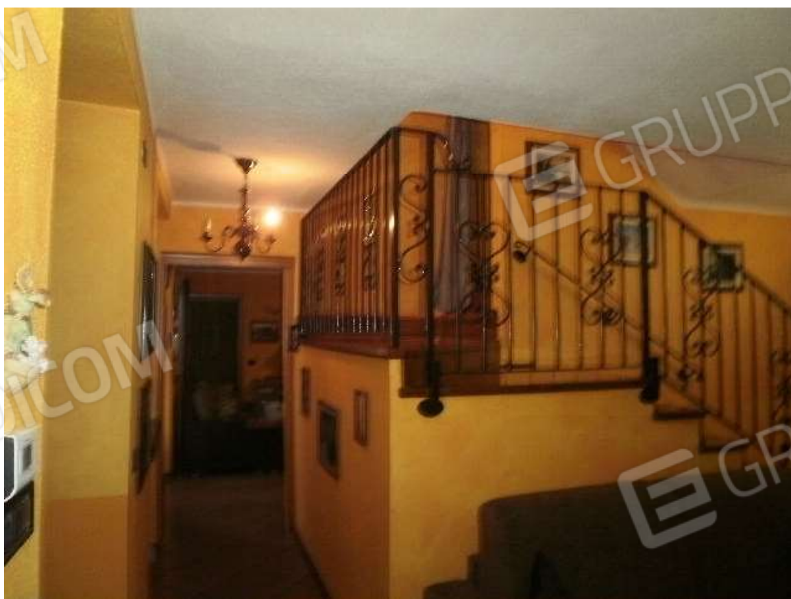
Vista interna tipologie rifiniture scala di collegamento interna del fabbricato di civile abitazione