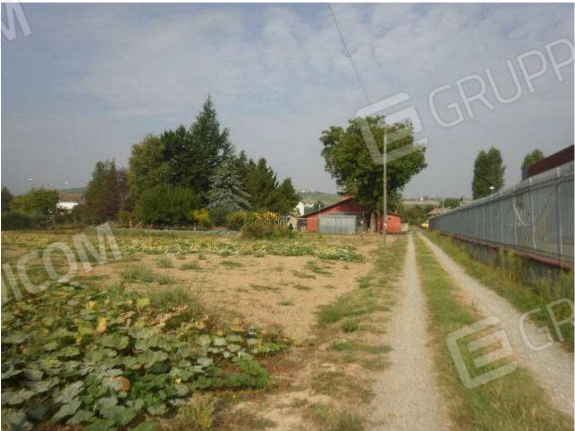
Vista giacitura terreni a destinazione agricola direttamente comunicanti con il fabbricato di civile abitazione