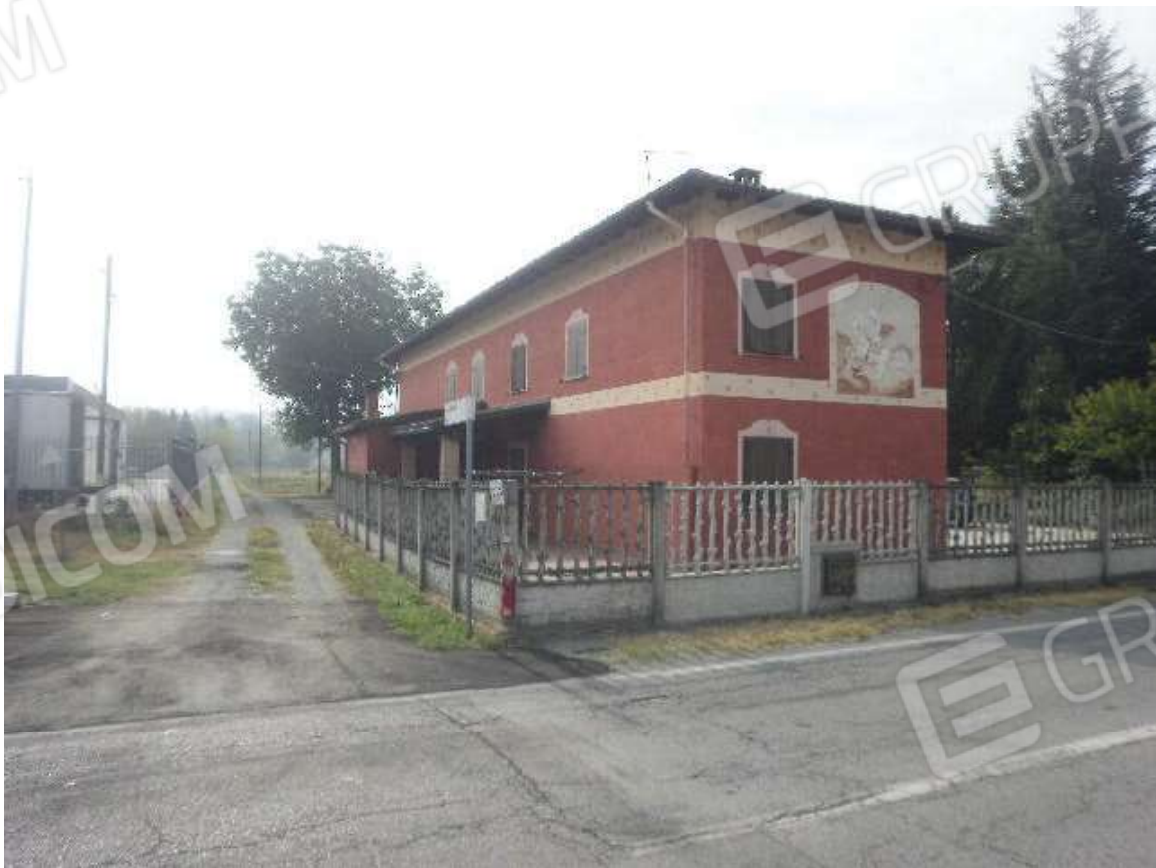
Vista dalla sede stradale pubblica del fabbricato di civile abitazione e suoi accessi