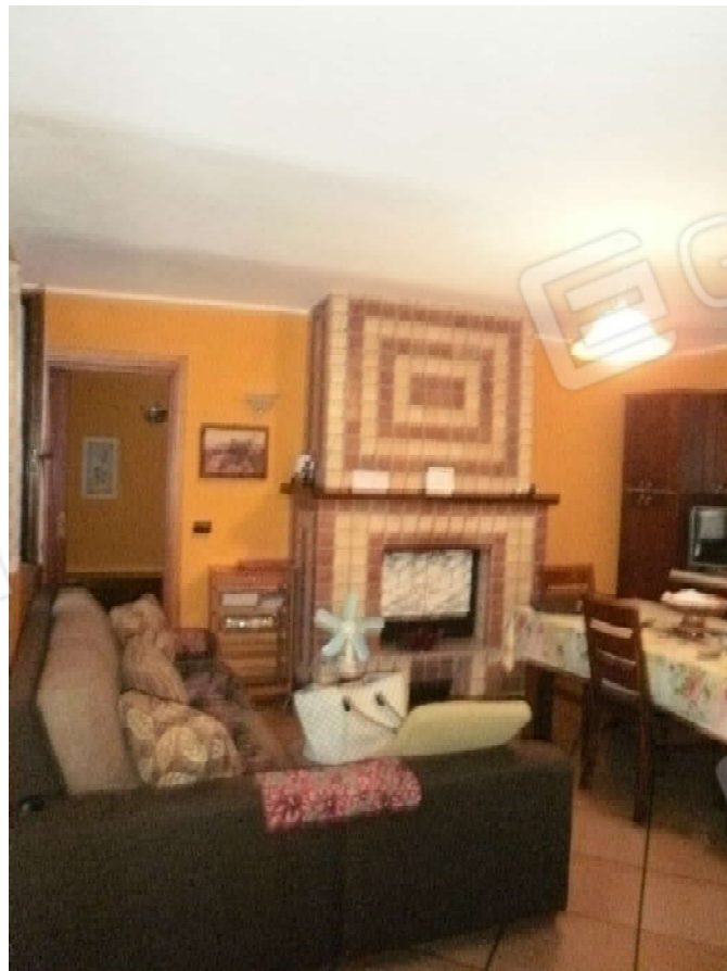
Vista interna tipologie rifiniture locali residenziali posti in piano primo del fabbricato di civile abitazione