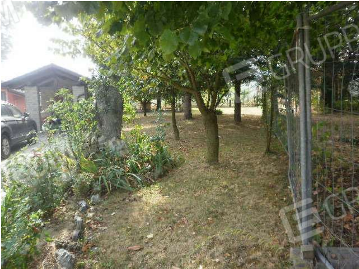
Vista area cortilizia pertinenziale destinata a verde