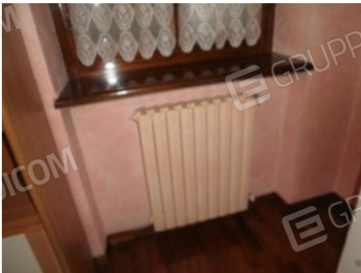
Vista tipologia generatore impianto di riscaldamento e termosifoni interni ai vani di civile abitazione