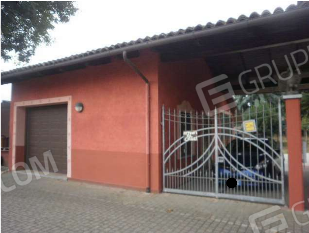
Vista dei corpi accessori al fabbricato principale di civile abitazione