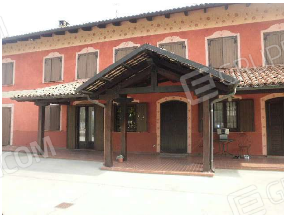
Vista dall'area cortilizia pertinenziale del fabbricato di civile abitazione