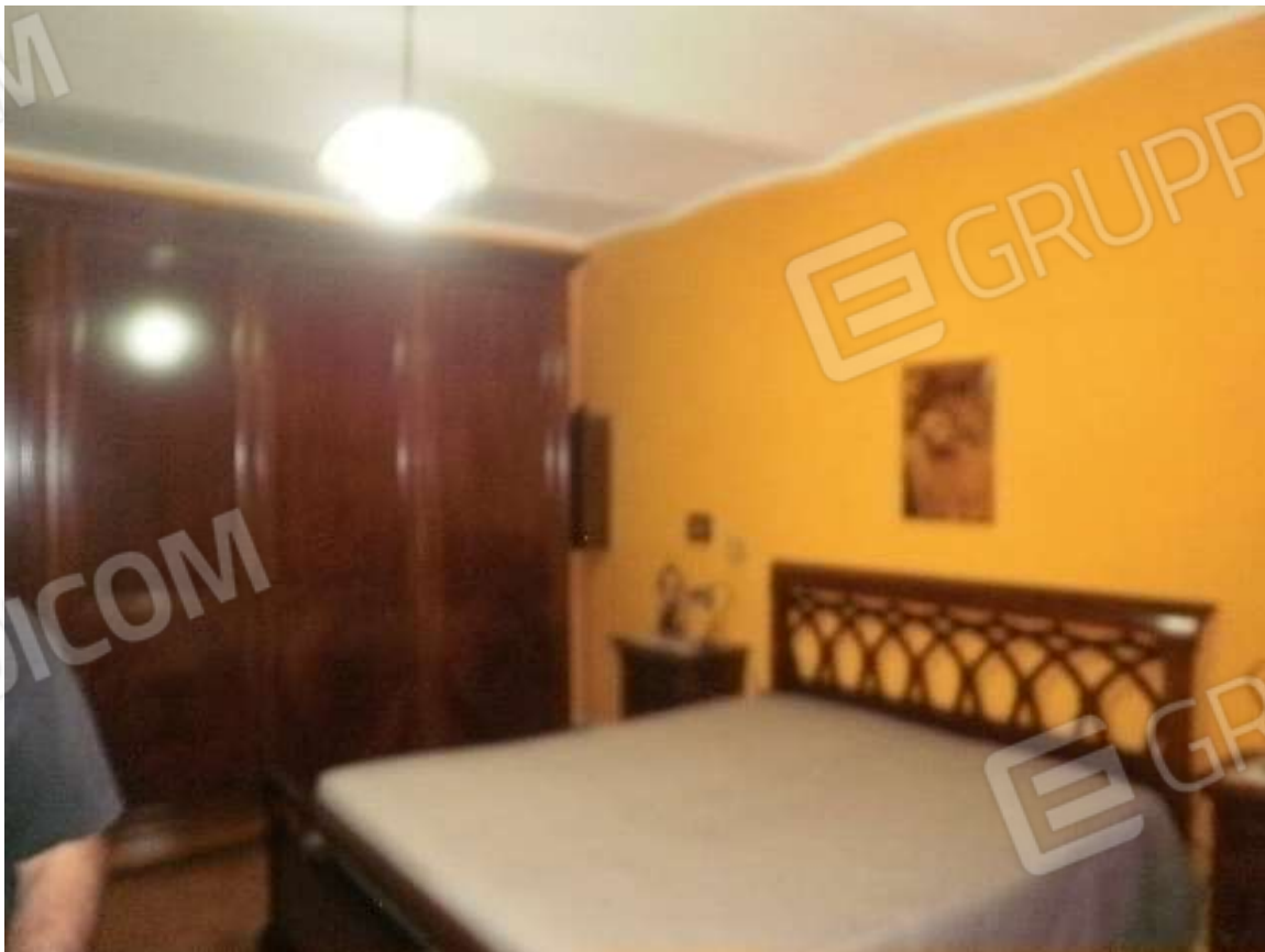
Vista interna tipologie rifiniture locali residenziali posti in piano primo del fabbricato di civile abitazione