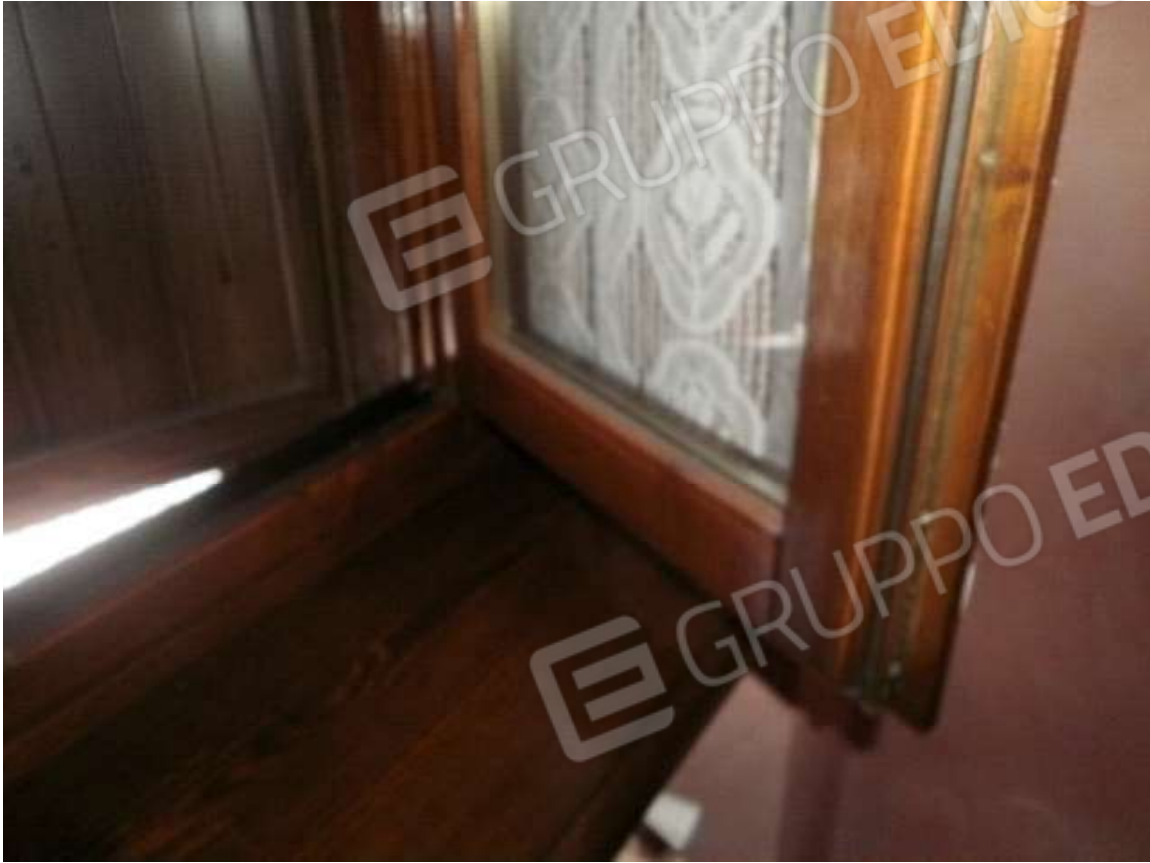
Vista tipologia serramenti esterni a servizio dei vani di abitazione