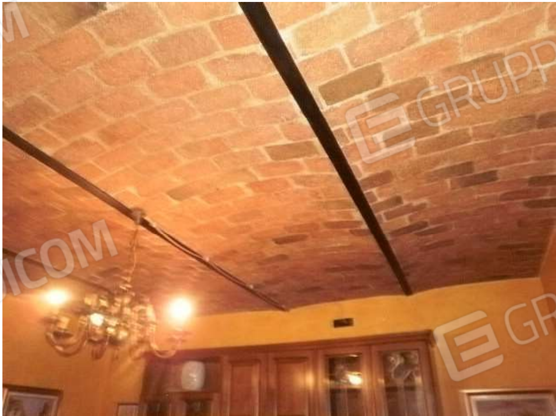
Vista interna tipologie rifiniture locali residenziali posti in piano terra del fabbricato di civile abitazione