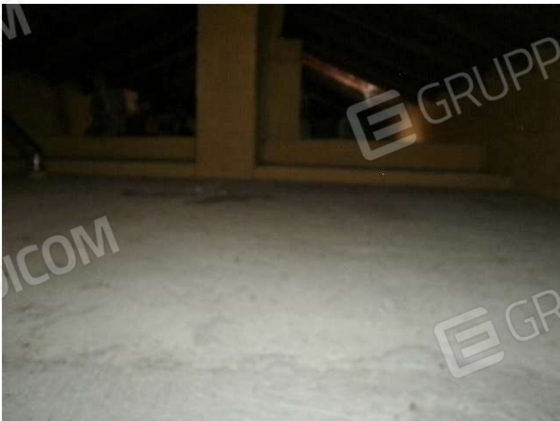
Vista interna tipologie rifiniture locale solaio posto in piano secondo al fabbricato di civile abitazione