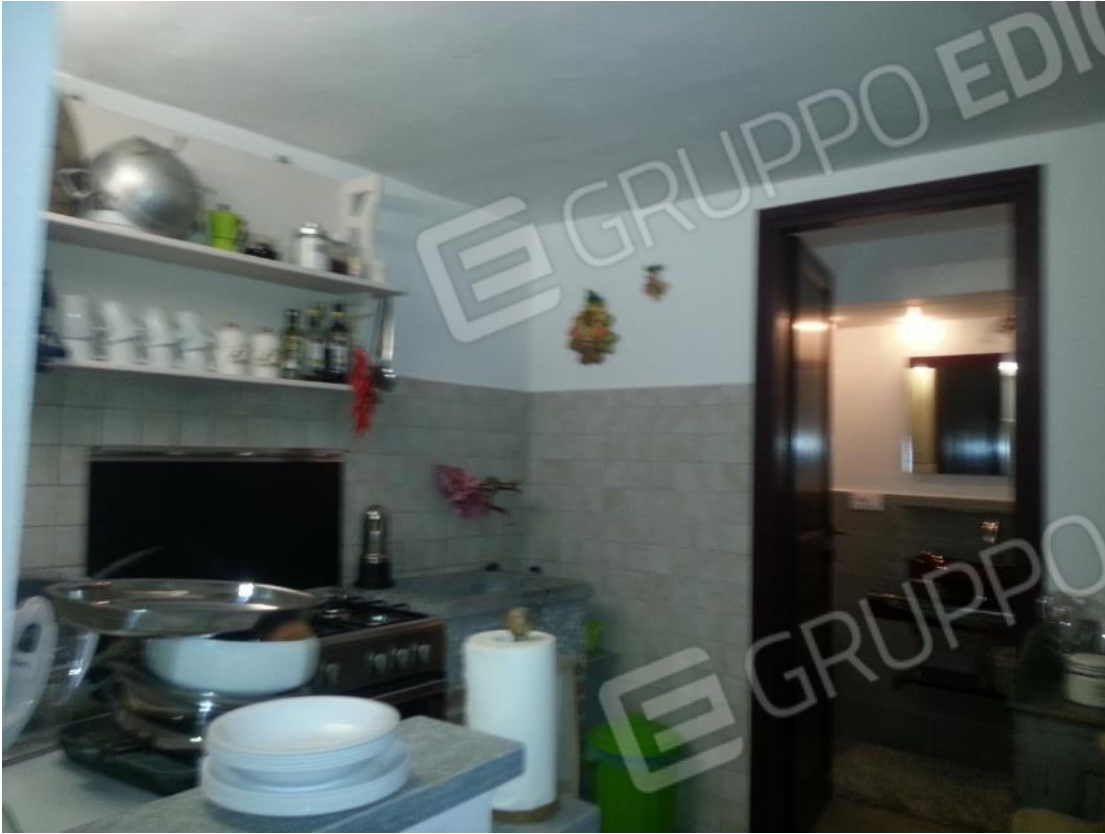
Foto 32 – Interno subalterno 16 – porzione oggetto di incongruità urbanistica