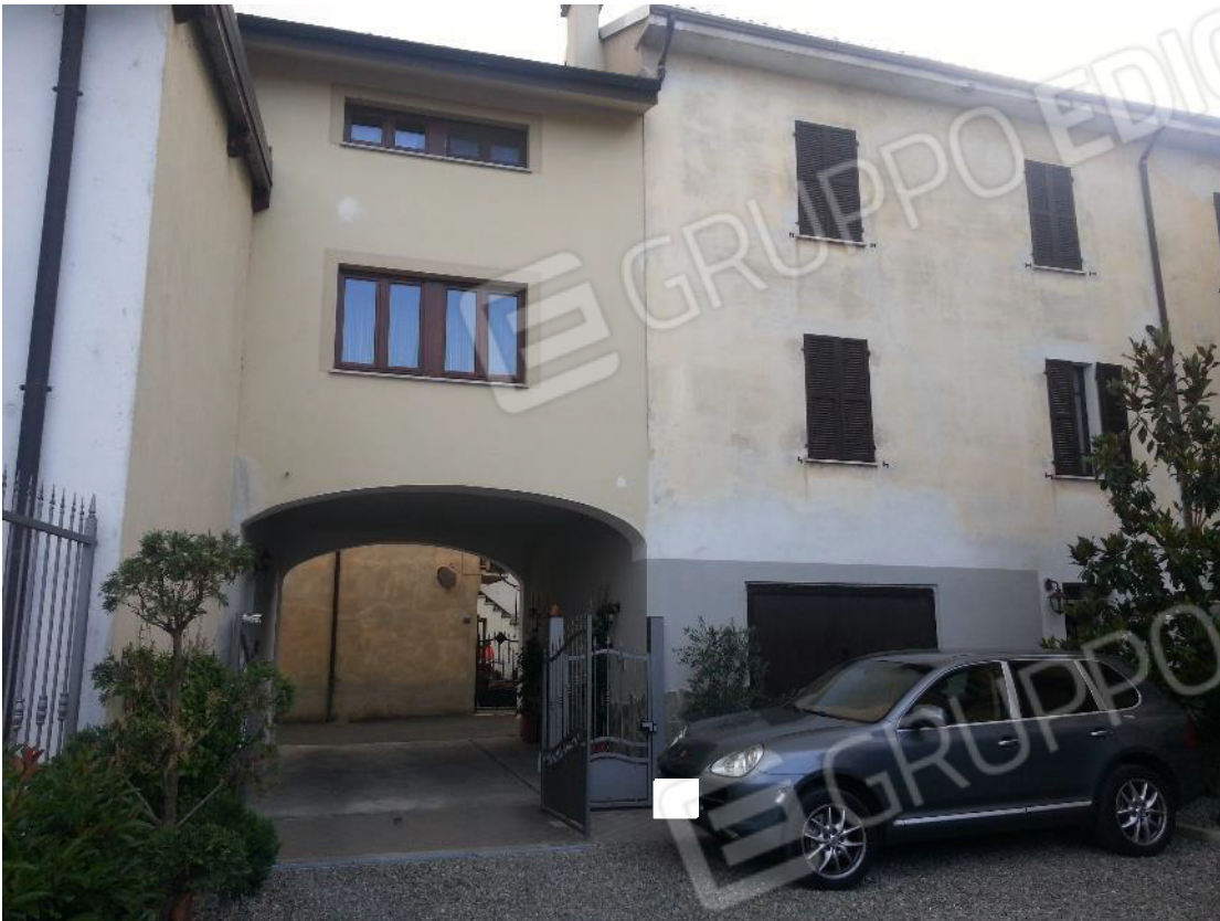
Foto 05 – Accesso carraio da Via Parsi 2 – vista da interno cortile