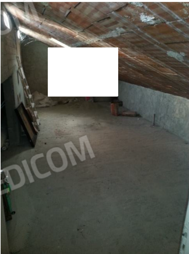
Foto 39 – Sottotetto – soffitte subalterni 12 e 17 – suddivisione interna mancante