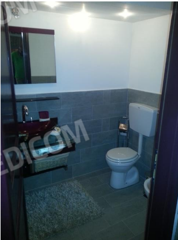
Foto 33 – Interno subalterno 16 – porzione oggetto di incongruità urbanistica