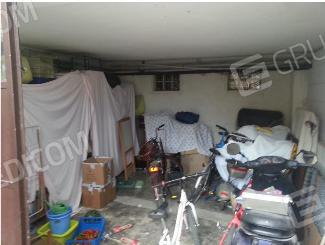
Foto 31 – Interno subalterno 16 – locale deposito con accesso da cortile