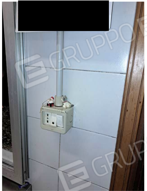
Figura 27- cucina - impianti