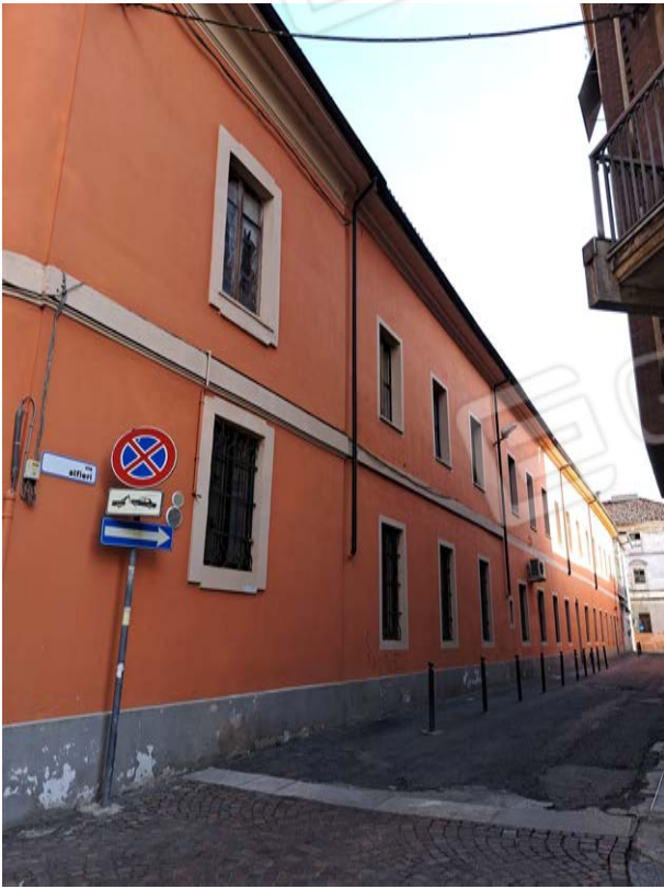
Figura 1- via Alfieri