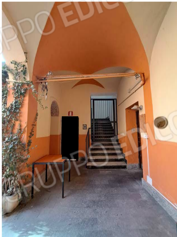
Figura 6- ingresso immobile