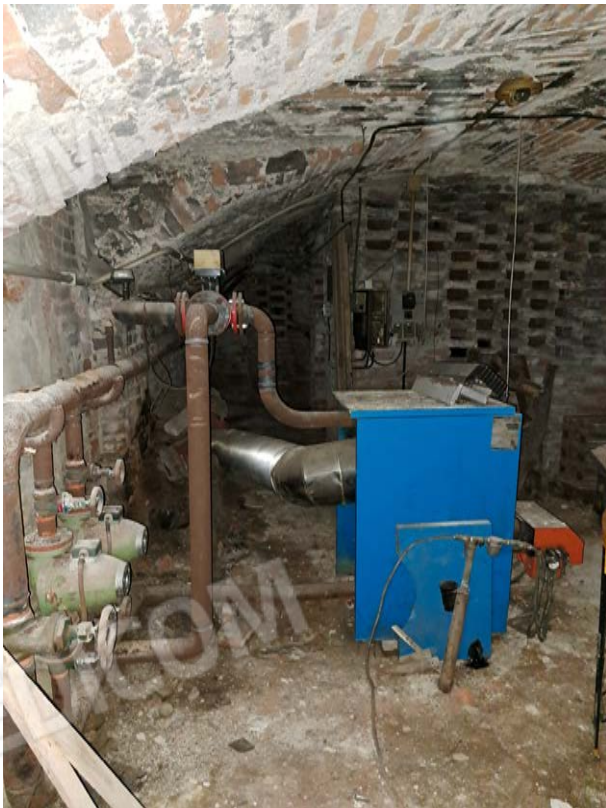
Figura 38- cantina - impianto dismesso