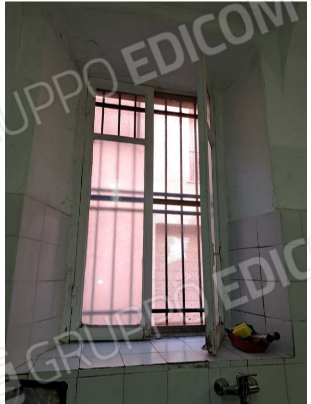
Figura 29- serramenti