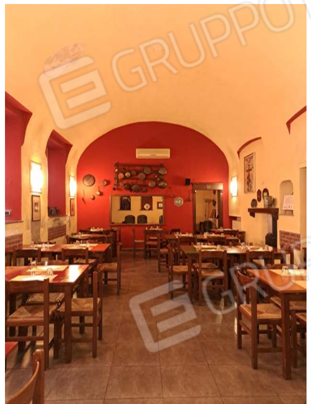
Figura 12- sala da pranzo, infiltrazioni sulle volte