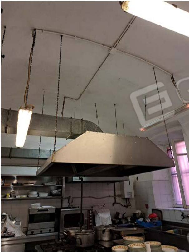
Figura 24- cucina