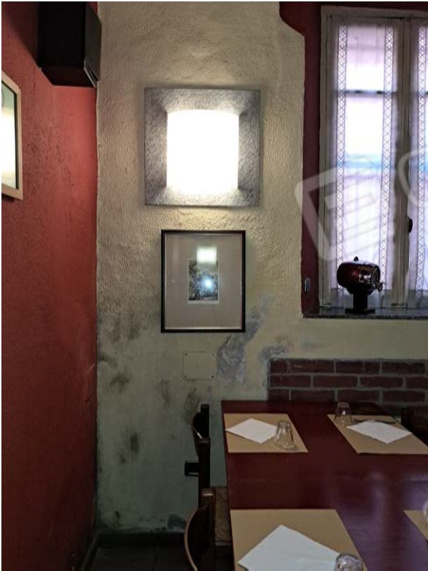
Figura 17- efflorescenze sala da pranzo