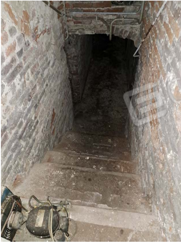
Figura 36- cantina