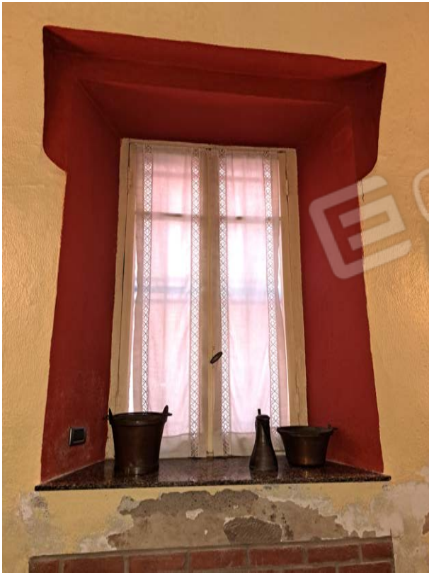
Figura 28- serramenti