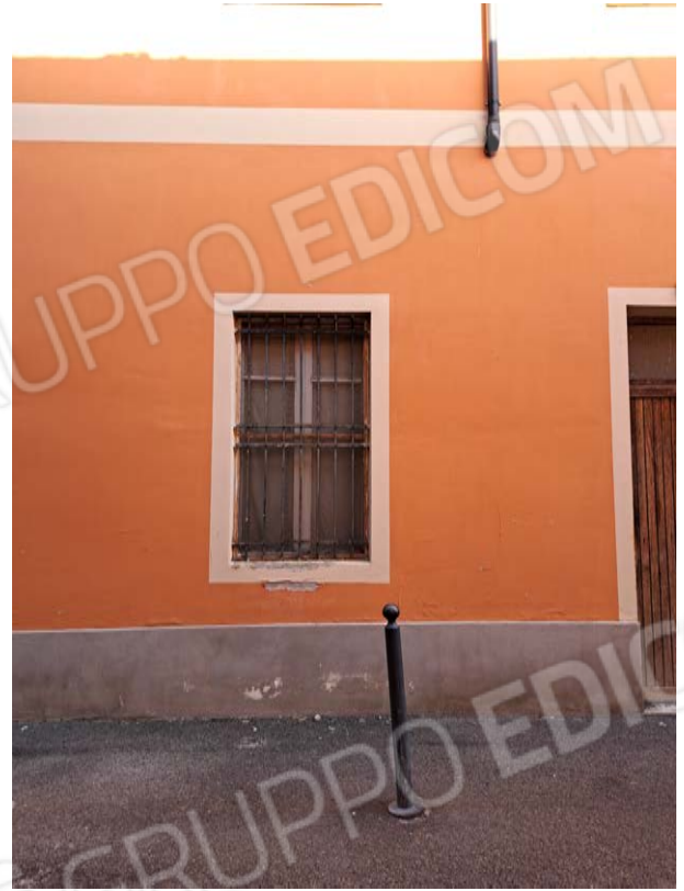
Figura 2- finestra verso via Alfieri