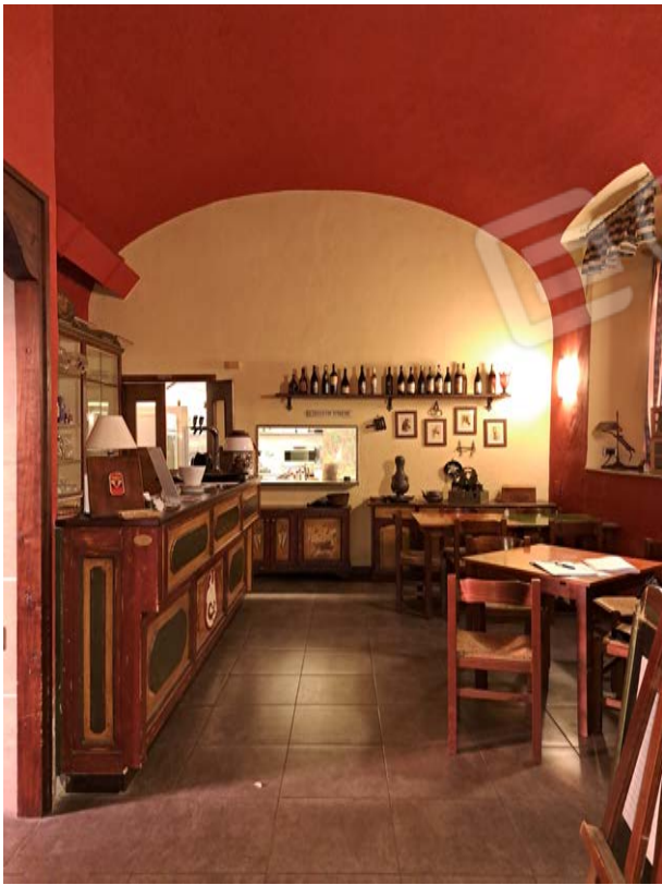
Figura 9- sala da pranzo