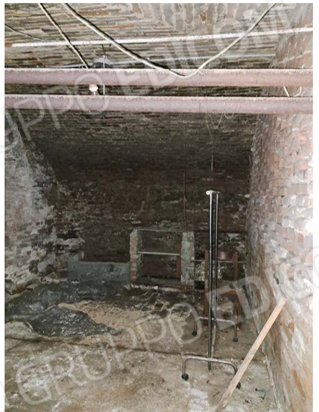
Figura 37- cantina