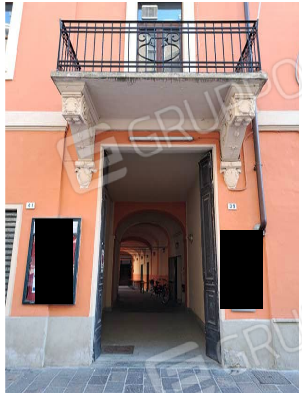
Figura 4- ingresso da via Faà di Bruno