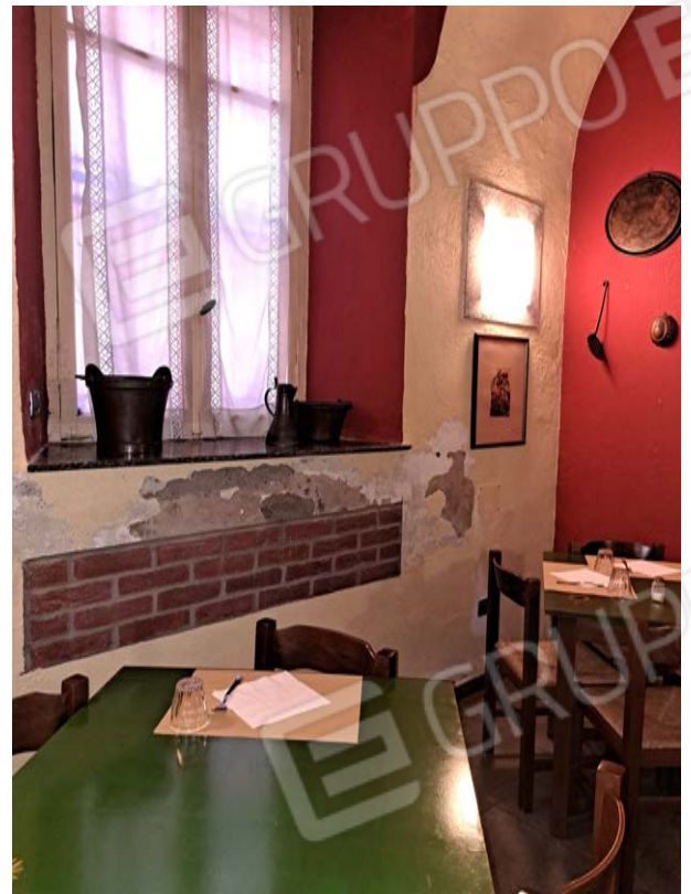
Figura 16- efflorescenze sala da pranzo