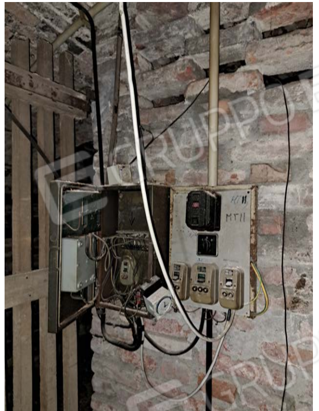
Figura 39- cantina - impianti