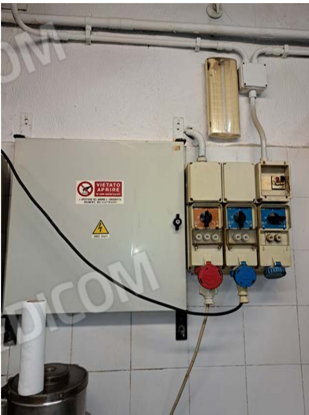
Figura 26- cucina - impianti