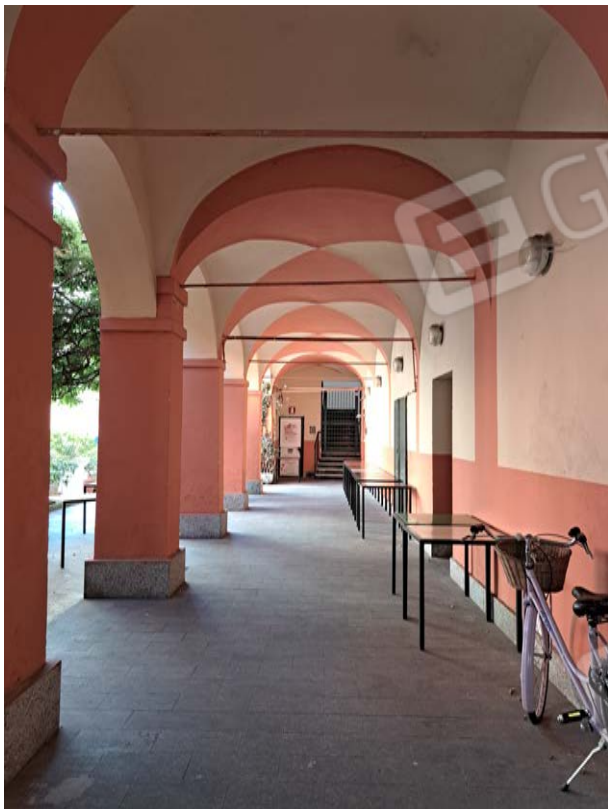
Figura 5- portico d'ingresso da via Faà di Bruno