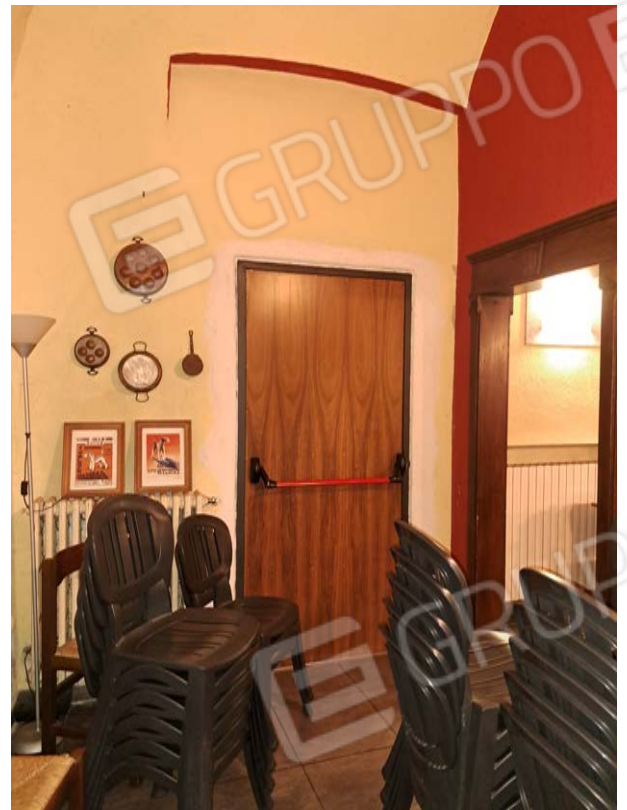
Figura 20- uscita sicurezza sala da pranzo