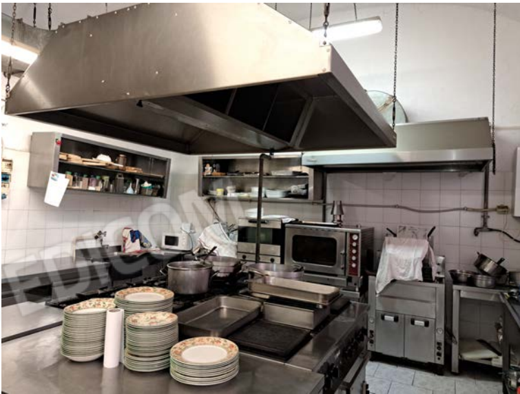
Figura 23- cucina