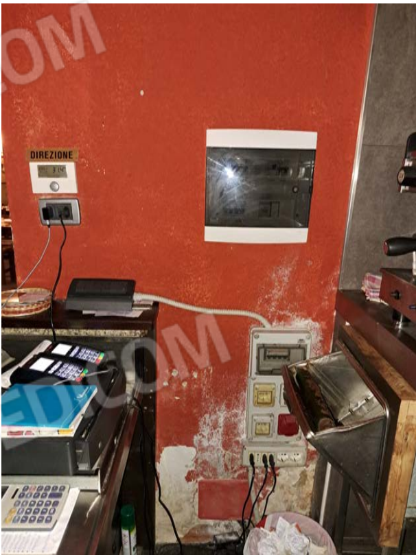
Figura 30- area ingresso bancone