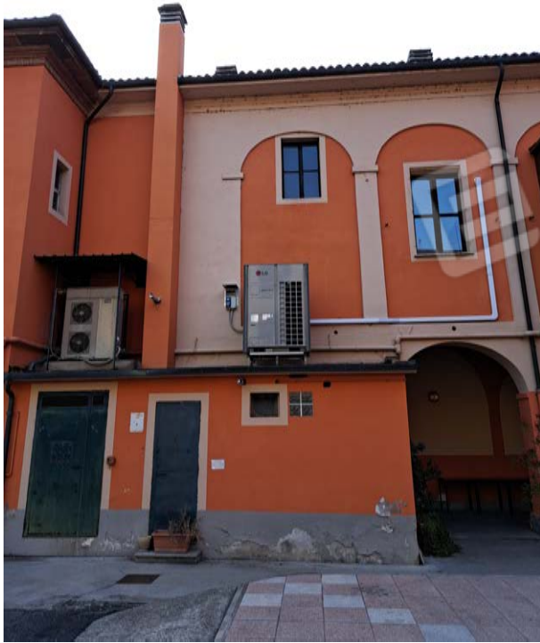
Figura 32- facciata lato cortile