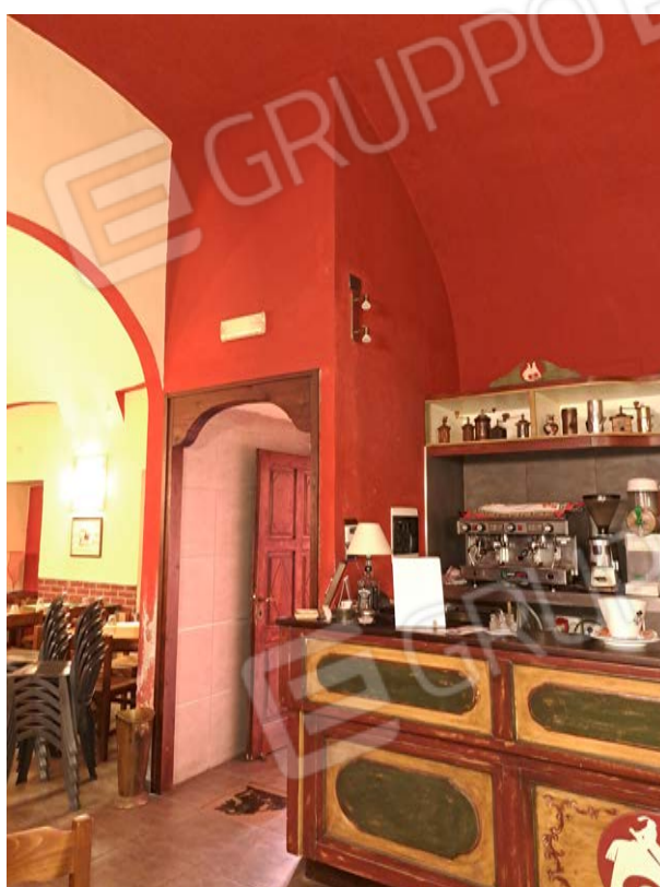
Figura 8- area ingresso salone