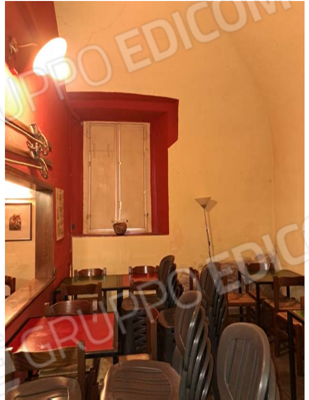
Figura 18- sala da pranzo