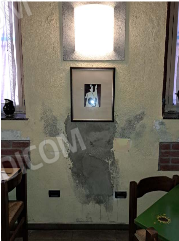
Figura 15- efflorescenze sala da pranzo