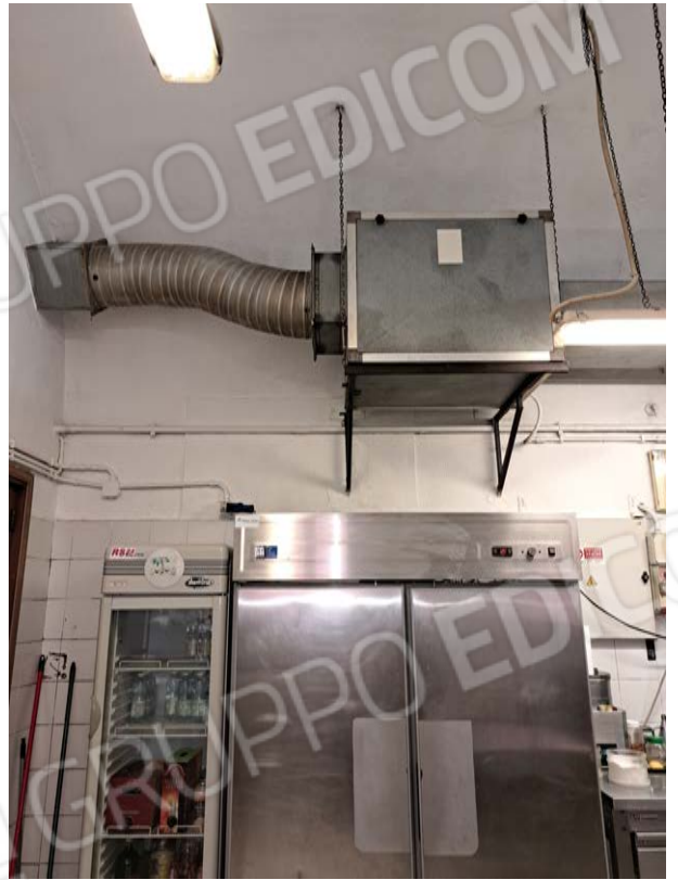
Figura 25- cucina