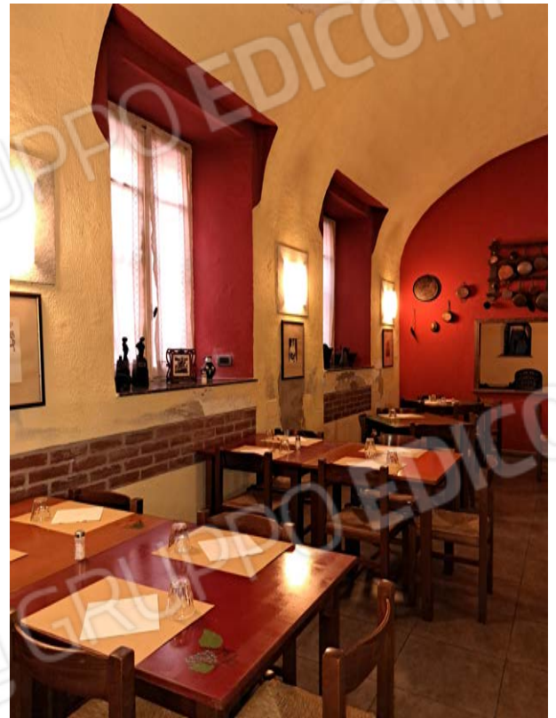
Figura 14- sala da pranzo