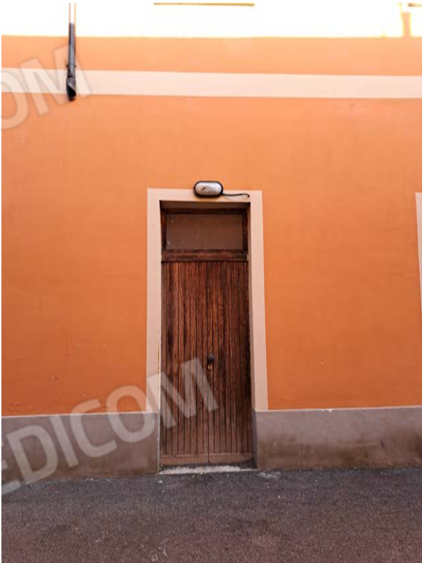
Figura 3- porta verso via Alfieri