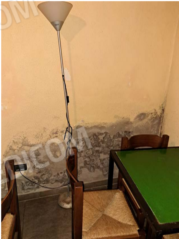
Figura 19- efflorescenze sala da pranzo