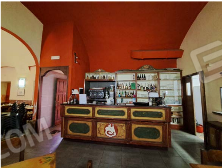
Figura 22- sala da pranzo