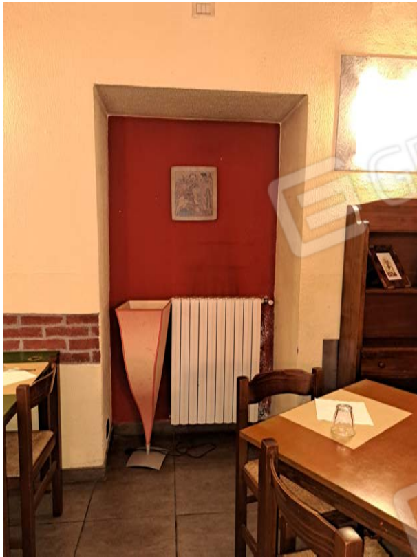
Figura 13- terminali riscaldamento