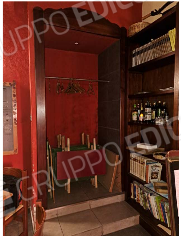
Figura 10- ingresso da via Alfieri