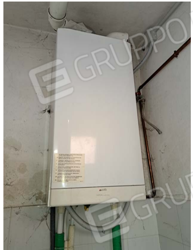
Figura 31- caldaia