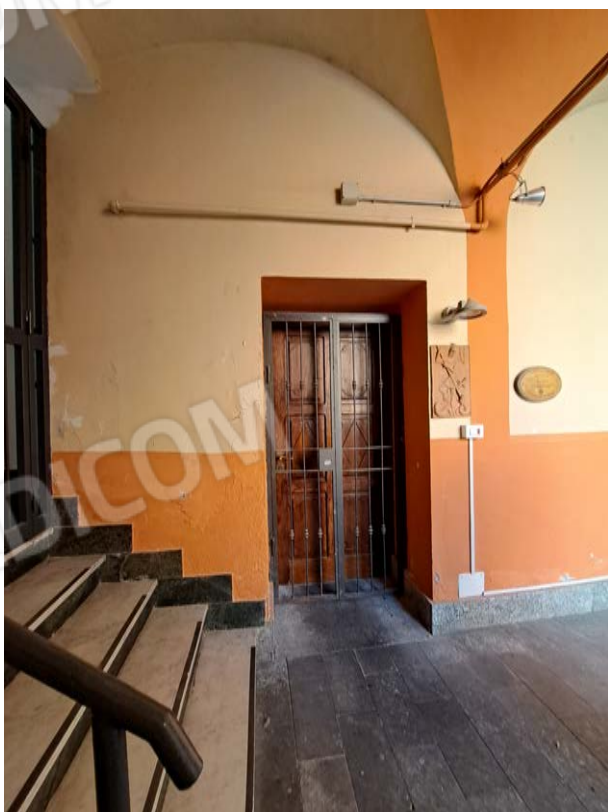
Figura 7- ingresso immobile