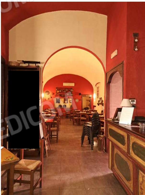
Figura 11- sala da pranzo