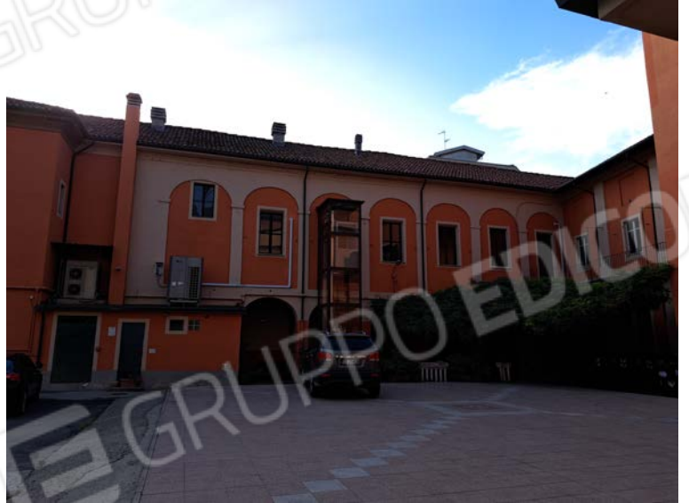
Figura 33- facciata lato cortile