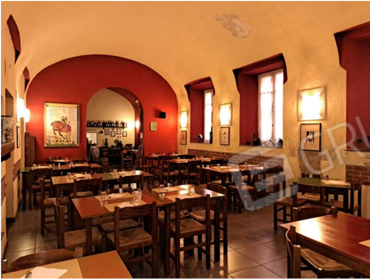
Figura 21- sala da pranzo