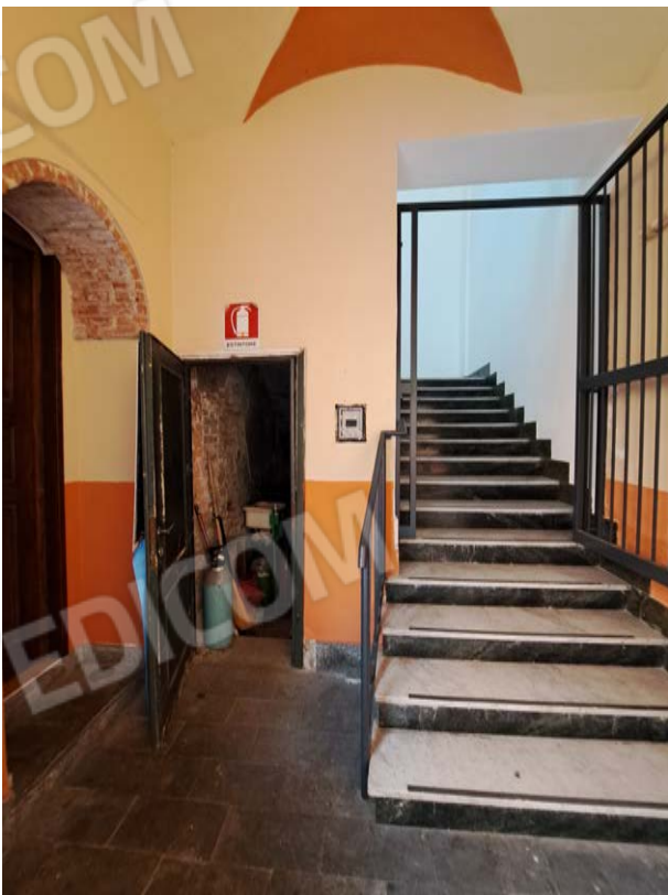
Figura 34- ingresso cantina