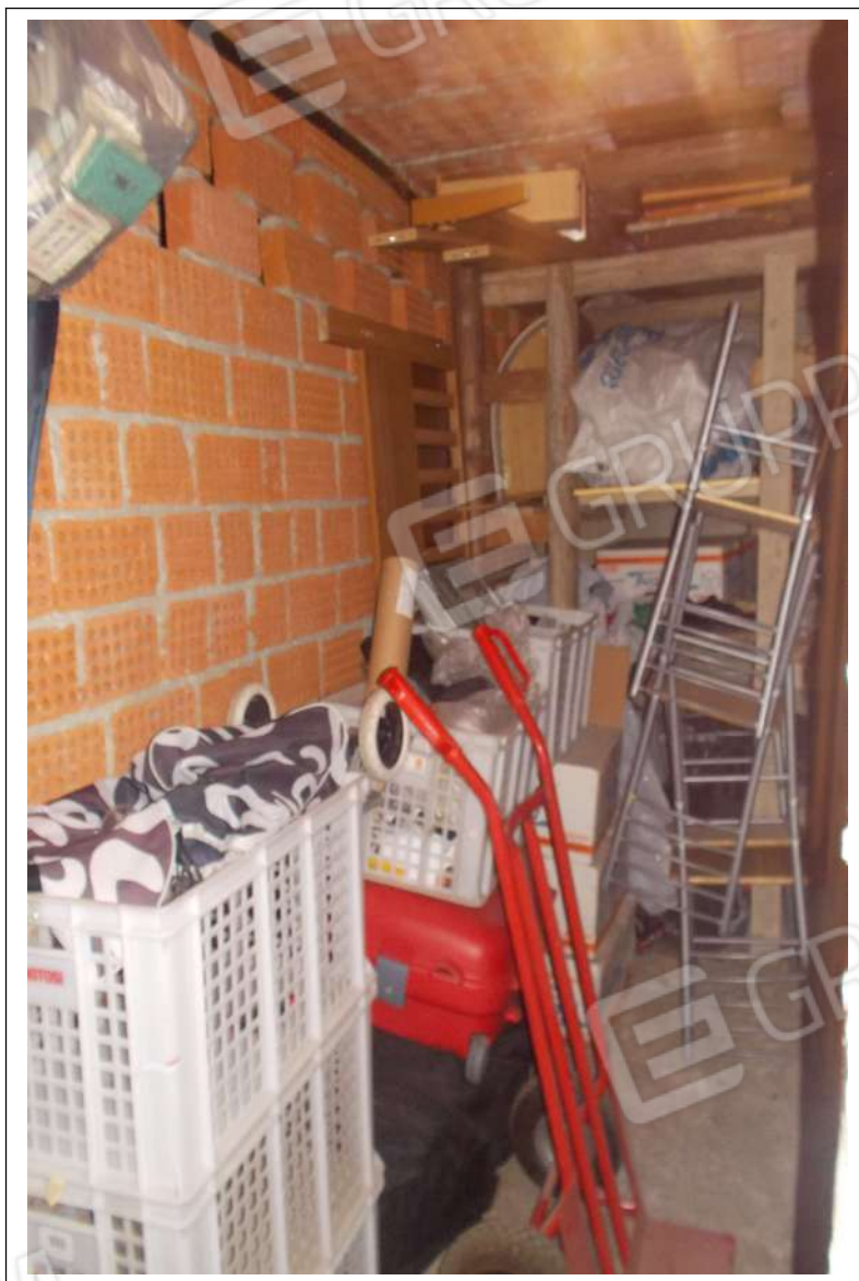
Fotografia n. 9 = Vista interna della cantina