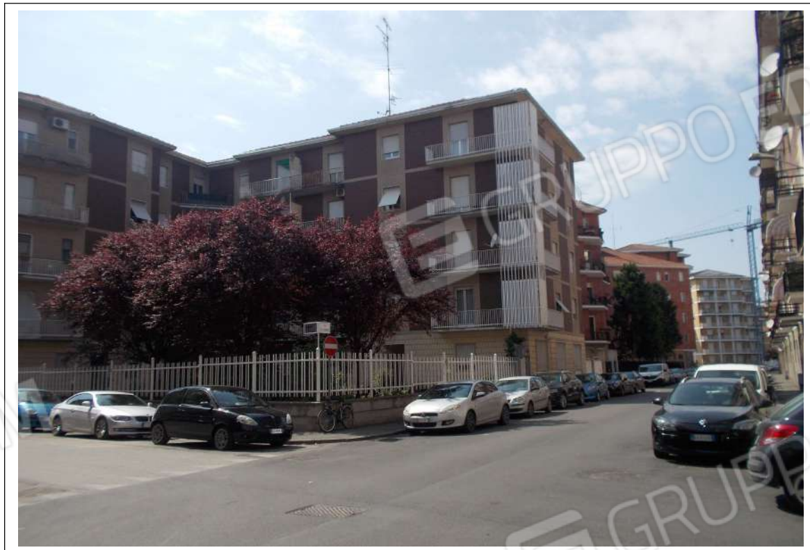
Fotografia n. 1 = Vista del Condominio Acqui III da Via Giovanni Veneri