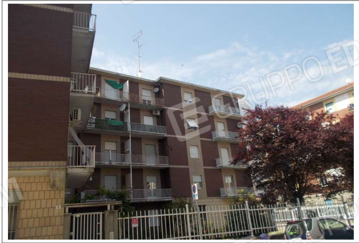
Fotografia n. 2 = Vista del Condominio Acqui III da Via Fernandel