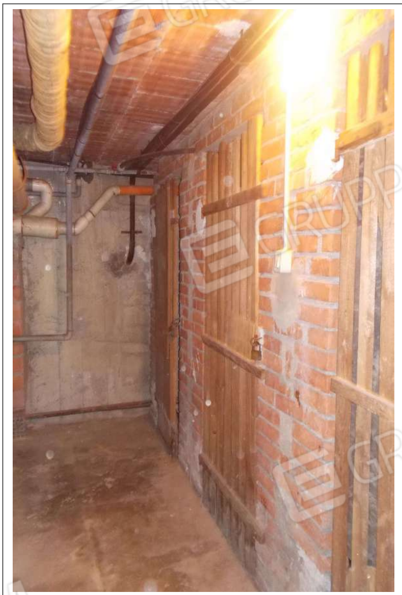
Fotografia n. 8 = Vista della porta d'accesso alla cantina