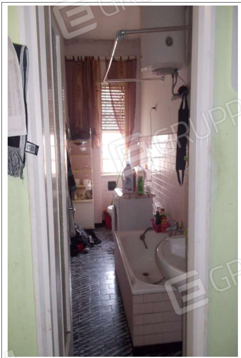
Fotografia n. 6 = Vista interna del bagno