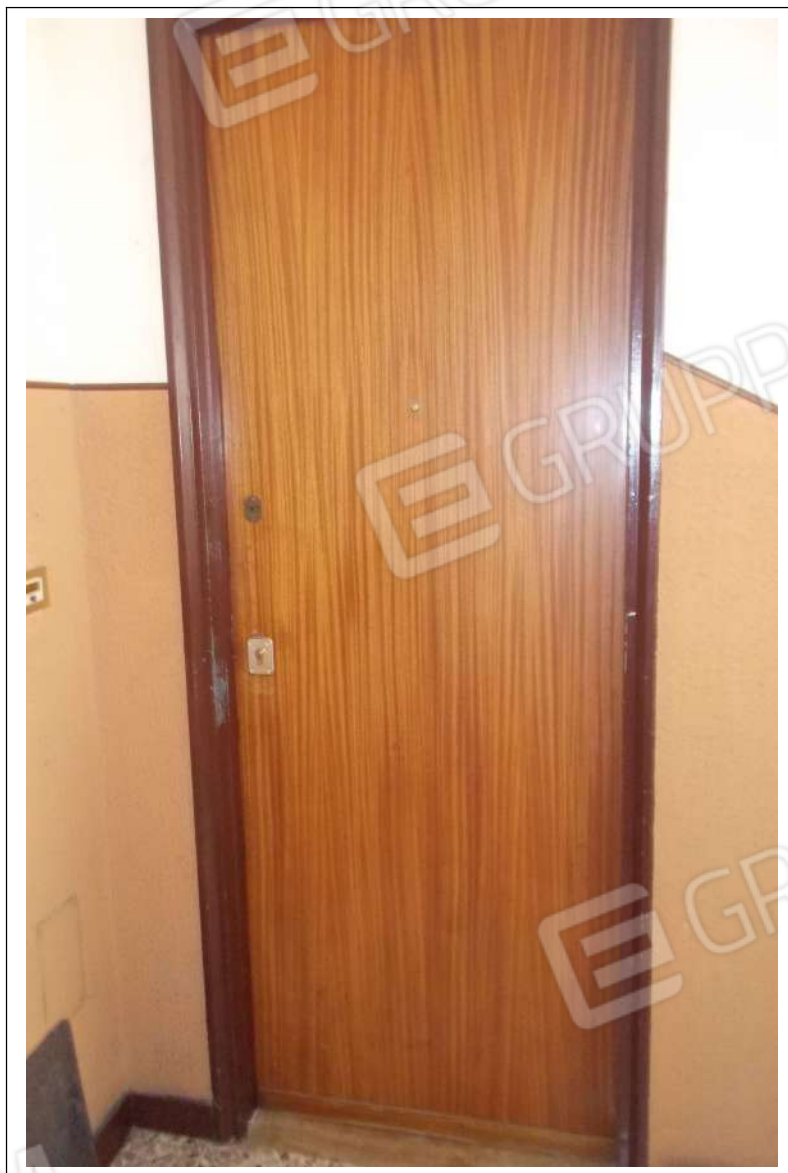
Fotografia n. 3 = Vista della porta d'ingresso dell'appartamento