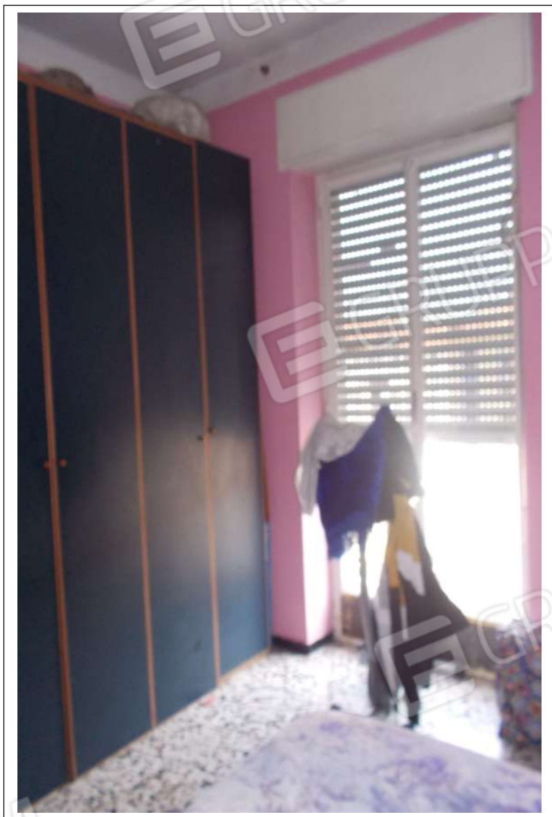
Fotografia n. 5 = Vista interna della camera