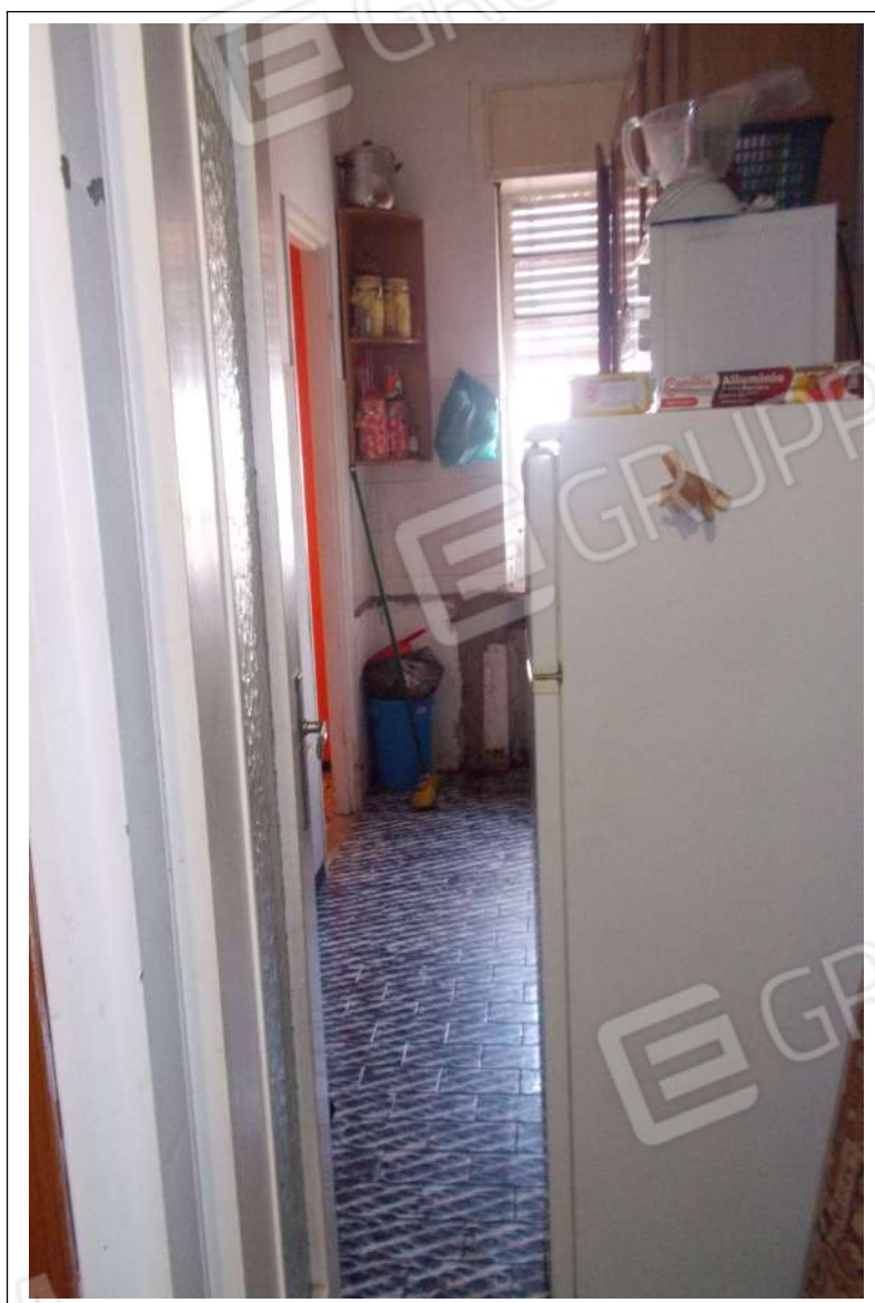
Fotografia n. 7 = Vista interna della cucina