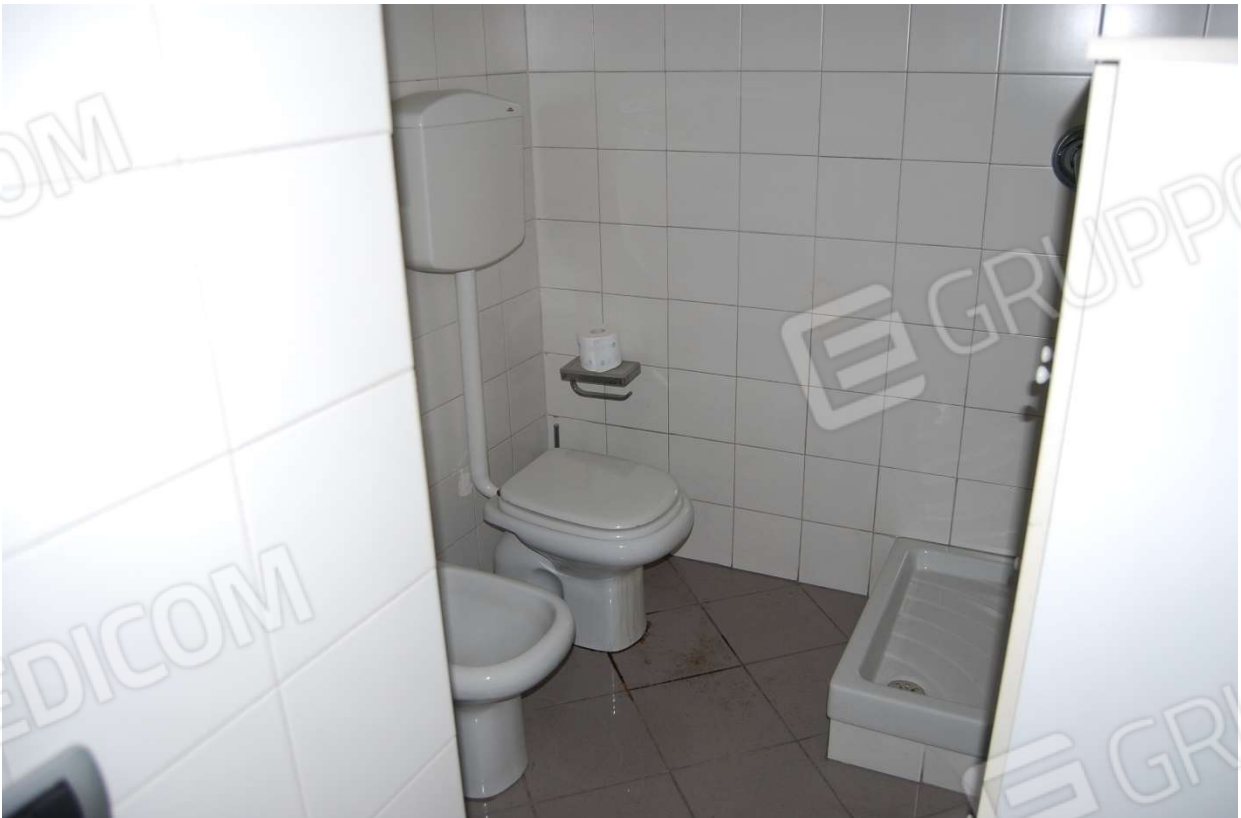
Bagno foto 15-16)