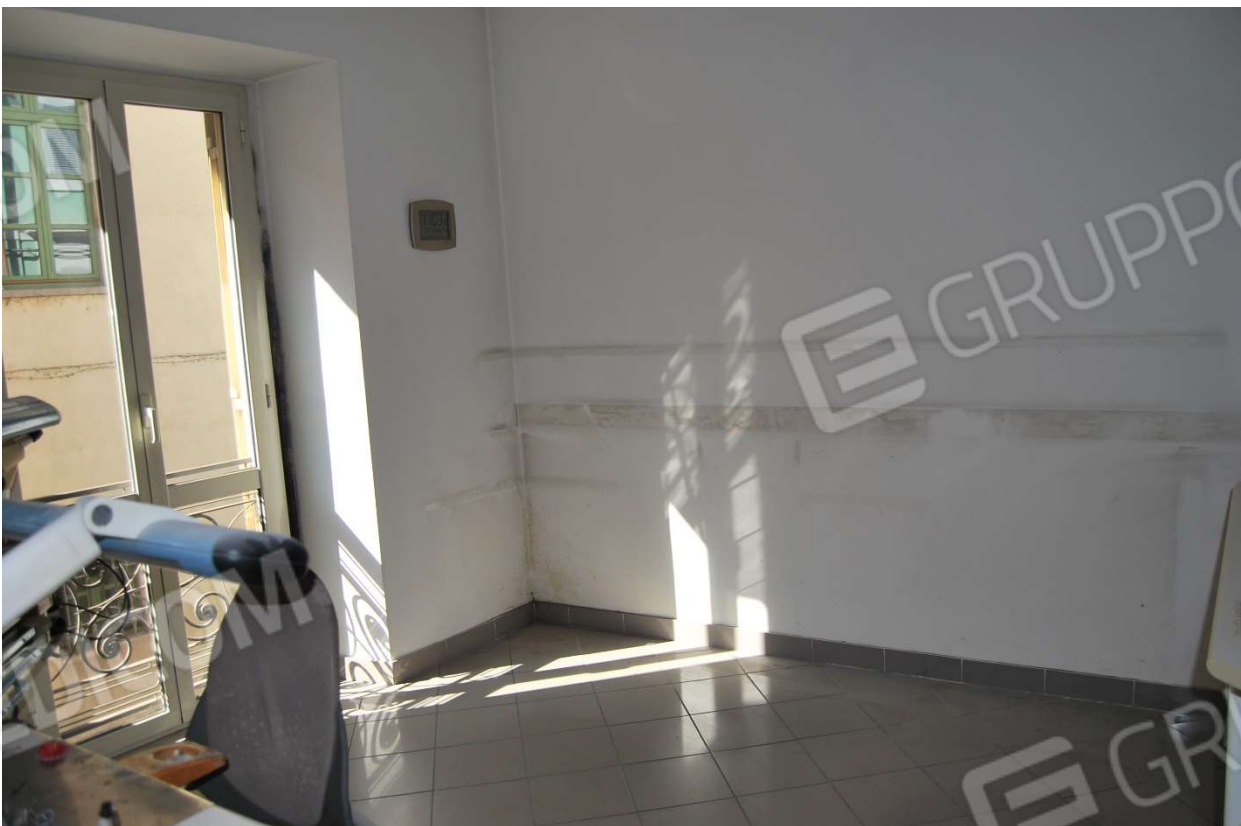
Locali laboratorio foto 11-12)