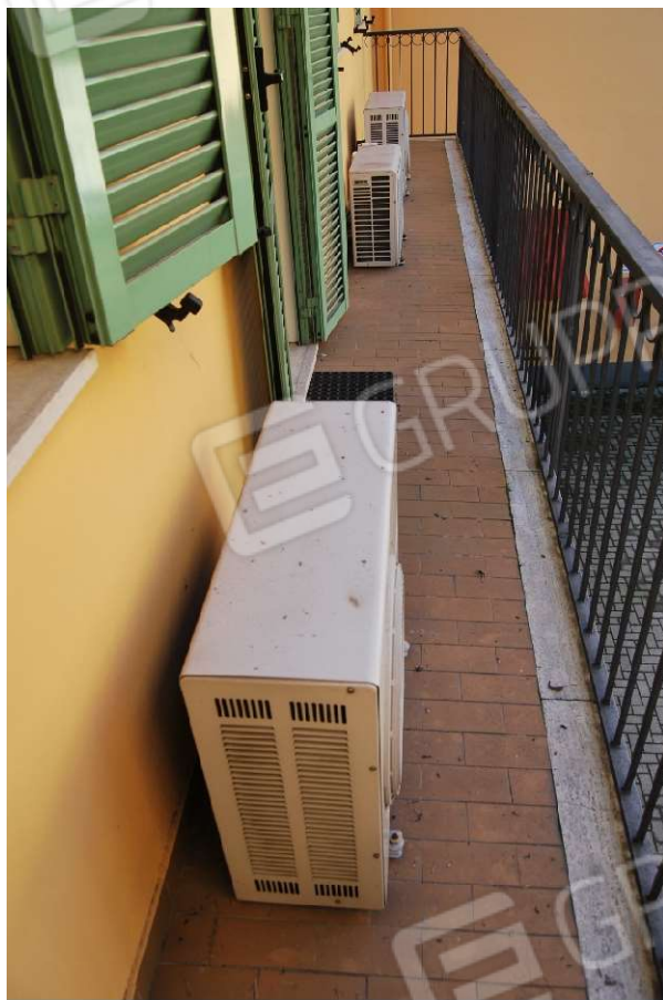
Ingresso pedonale e balcone su cortile interno foto 5-6)