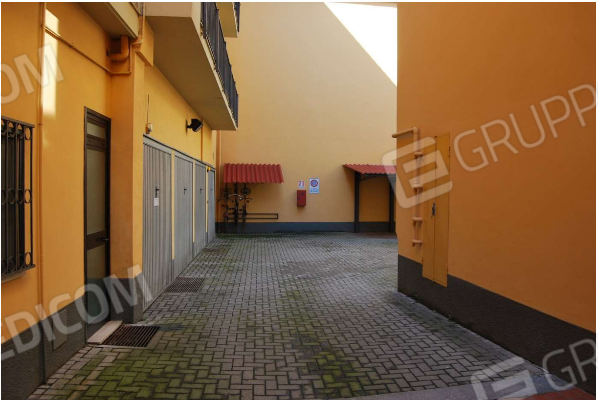
Facciate esterne su cortile interno via Pontida n 46 (AL) foto 7-8)