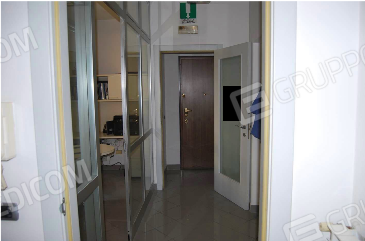
Ufficio e ingresso foto 13-14)