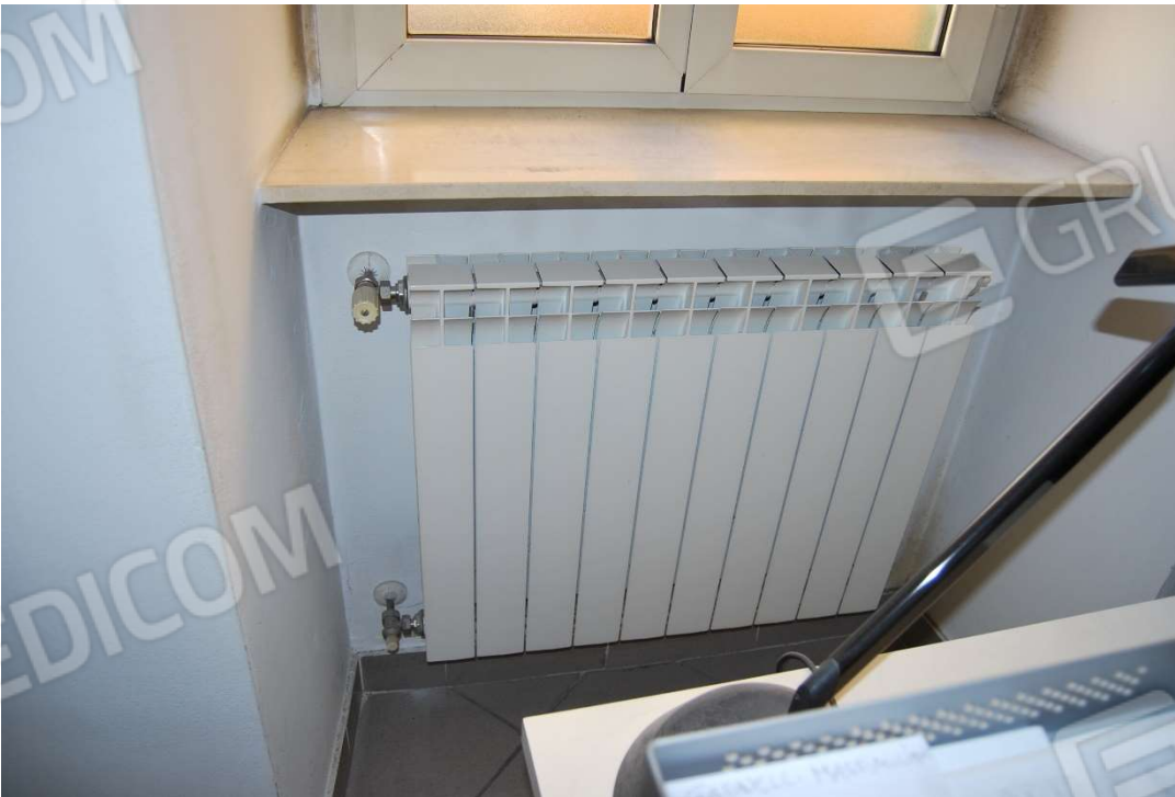
Caldaia-corpi scaldanti foto 19-20)