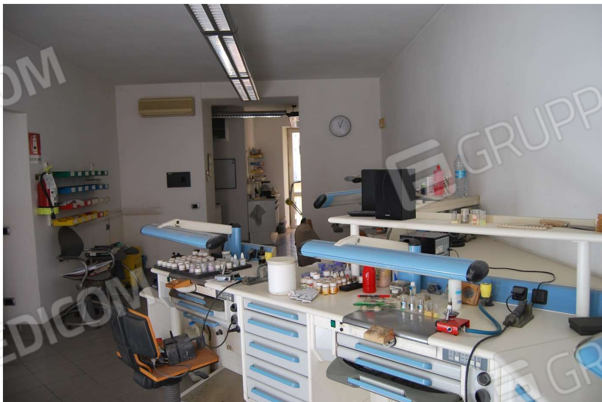
Laboratorio dentistico foto 9-10)