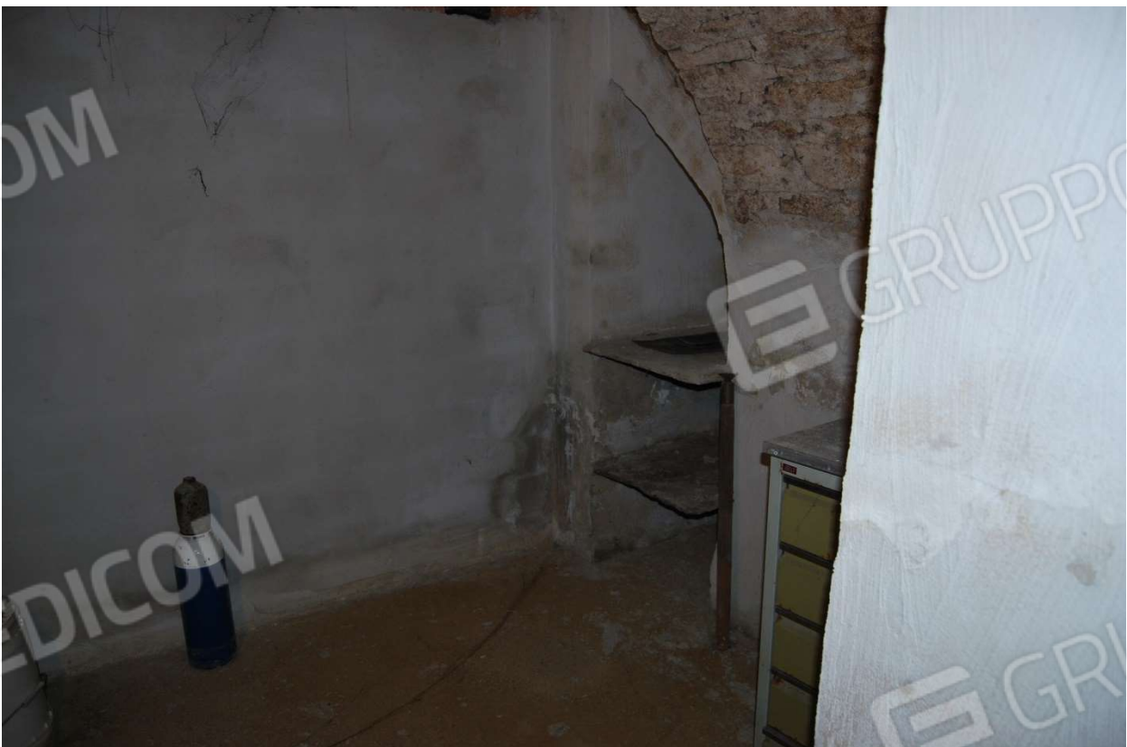
Locale cantina foto 21-22)