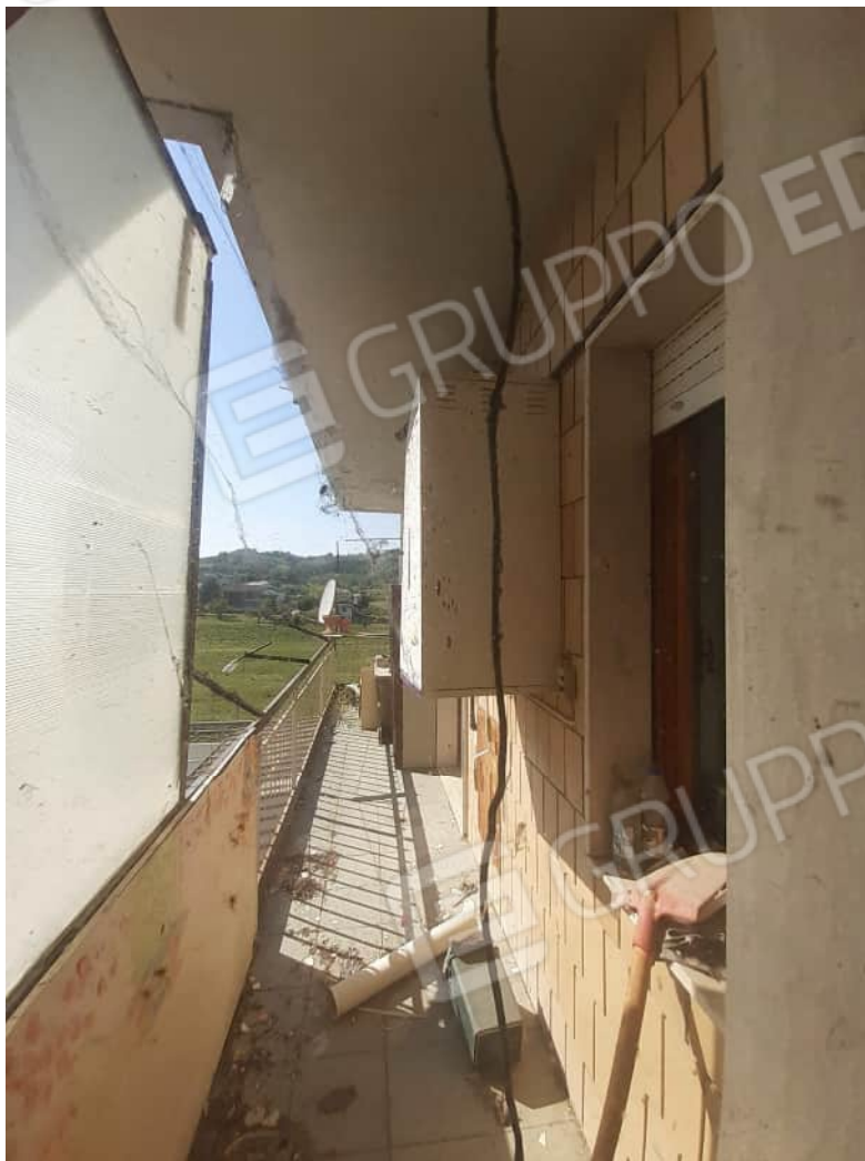
Vista particolare balcone pertinenziale posto sul fronte Sud