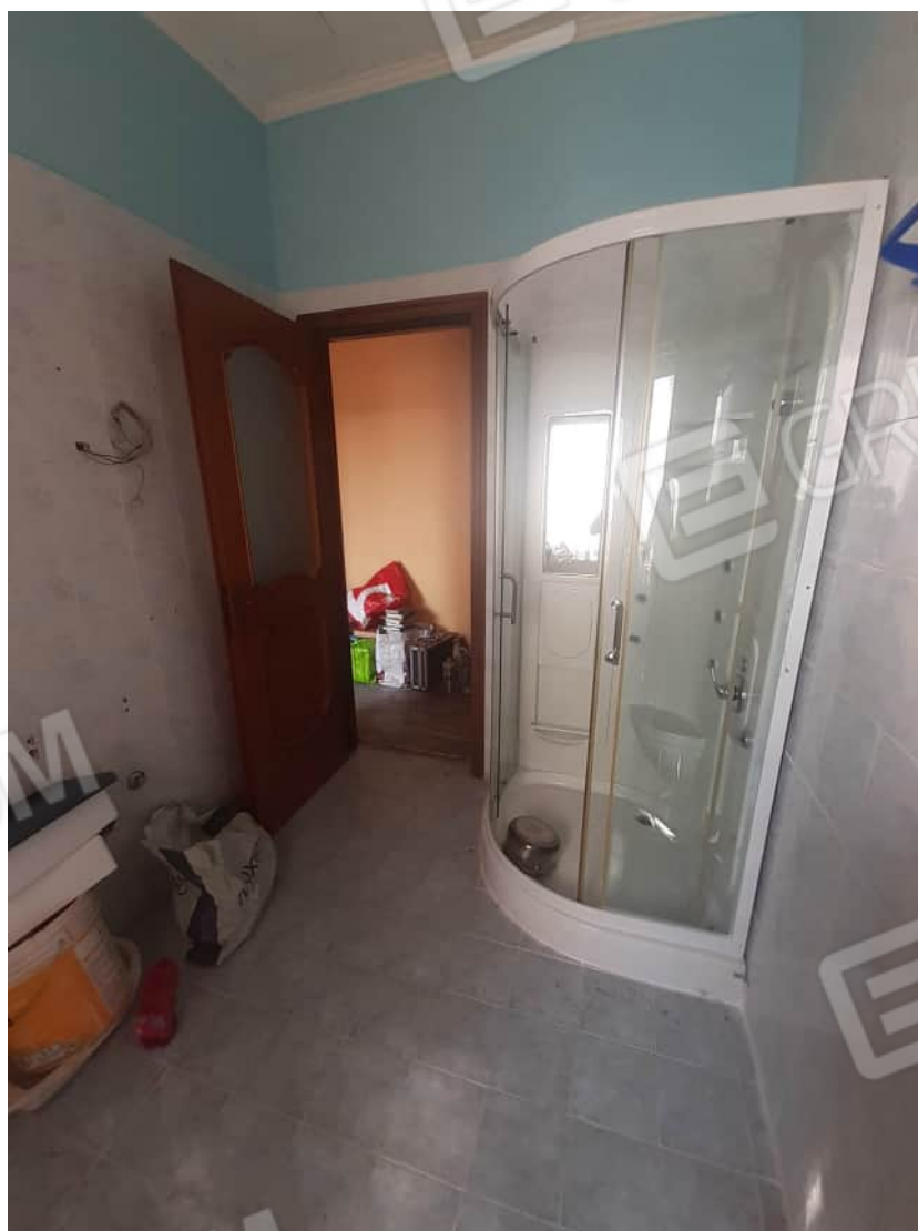
Vista particolare locale bagno e relative dotazioni