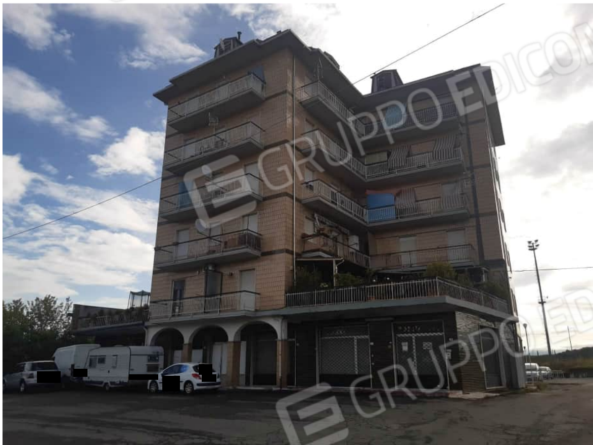
Vista da Via Alessandria – Fronte Ovest – del fabbricato condominiale “ Primavera “