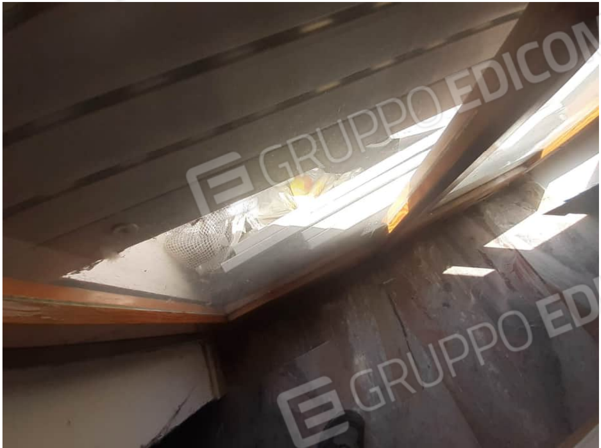
Vista particolare tipologia serramenti a servizio dei locali