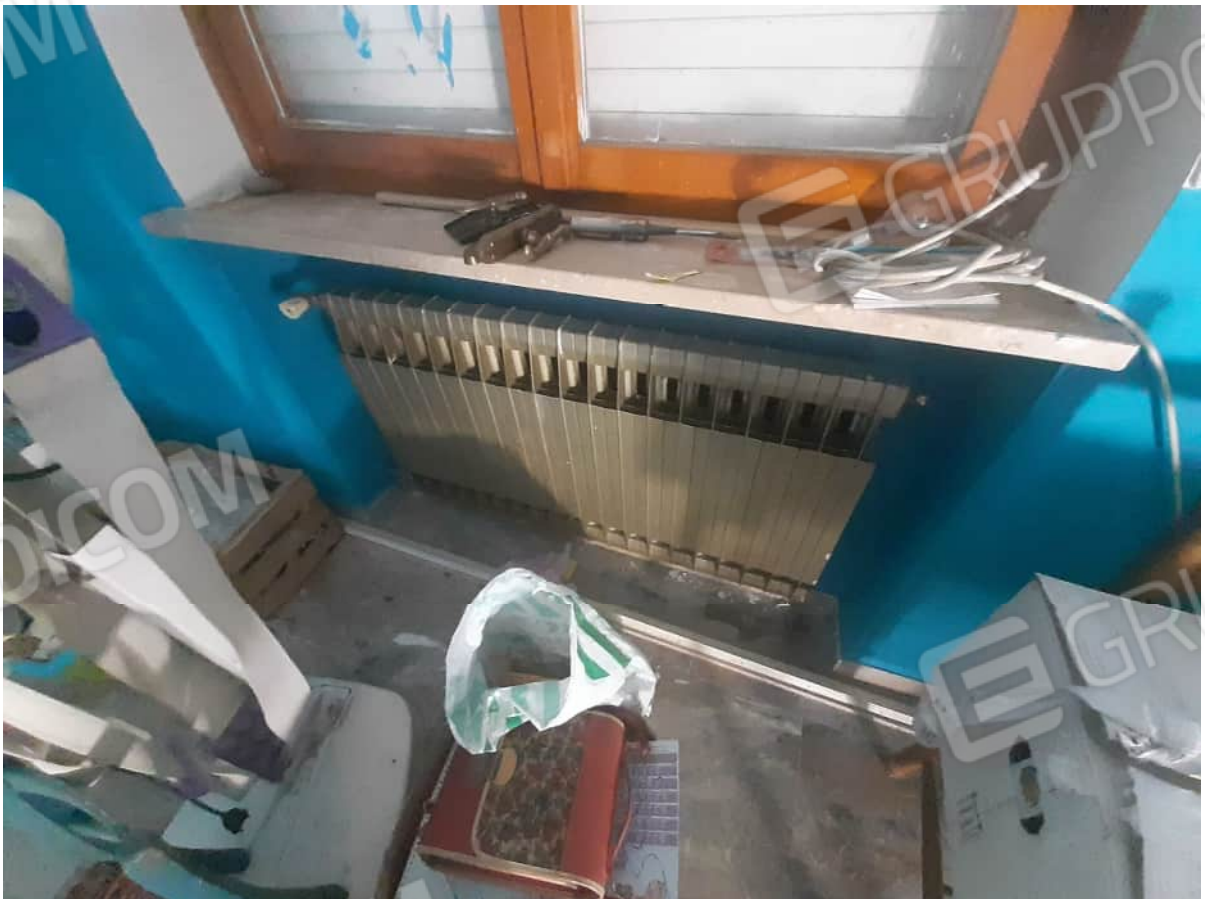
Vista particolare termosifoni a servizio dei locali