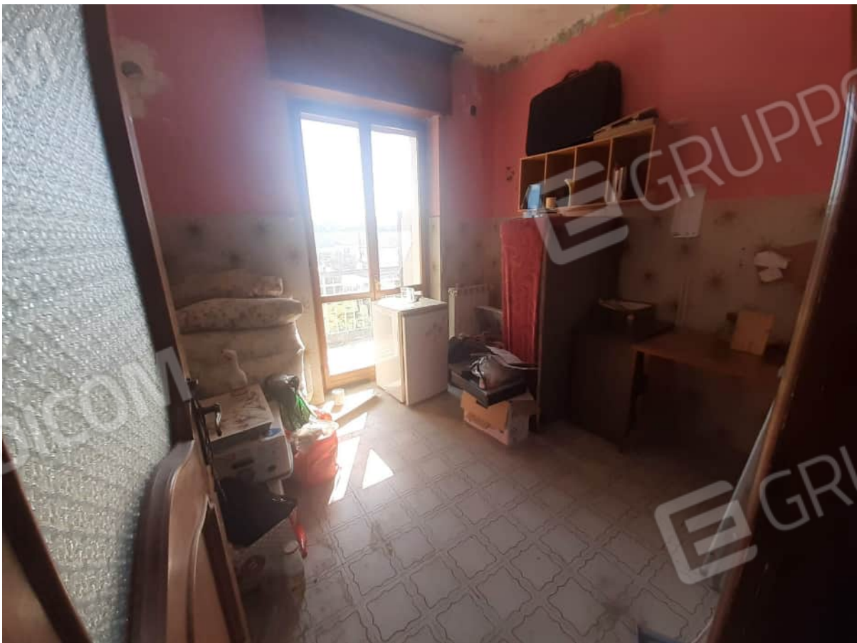
Vista particolare locali camera