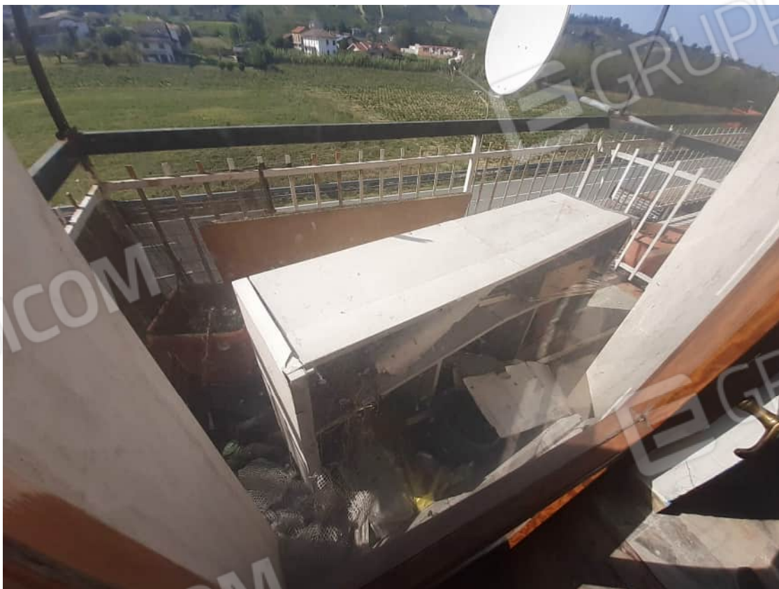
Vista particolare balcone pertinenziale posto sul fronte Ovest