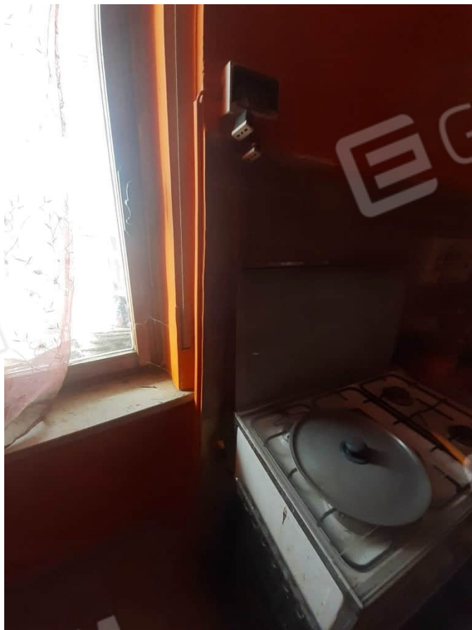
Situazione impianto elettrico