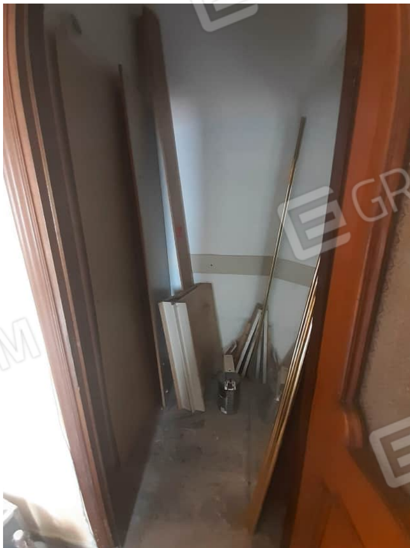
Vista particolare locale ripostiglio