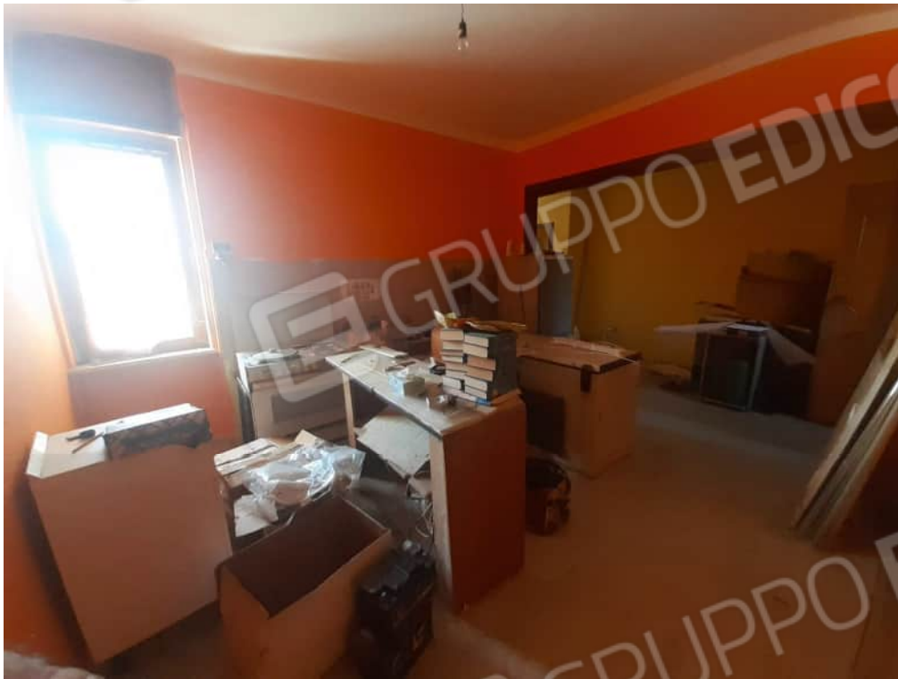
Vista particolare locale soggiorno / zona cottura