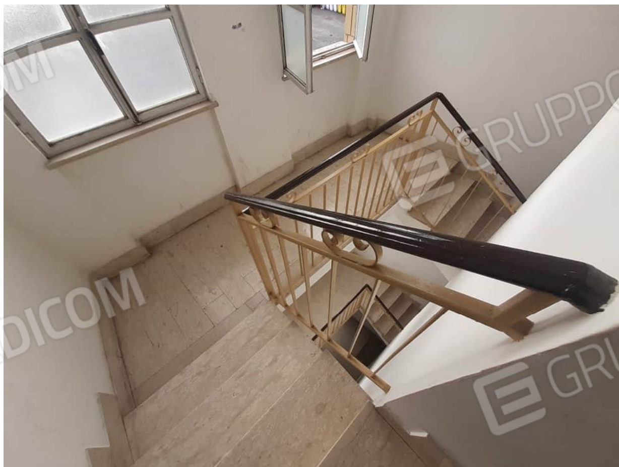
Vista particolare del portone d'ingresso all'androne condominiale e tipologia rifiniture vano scala