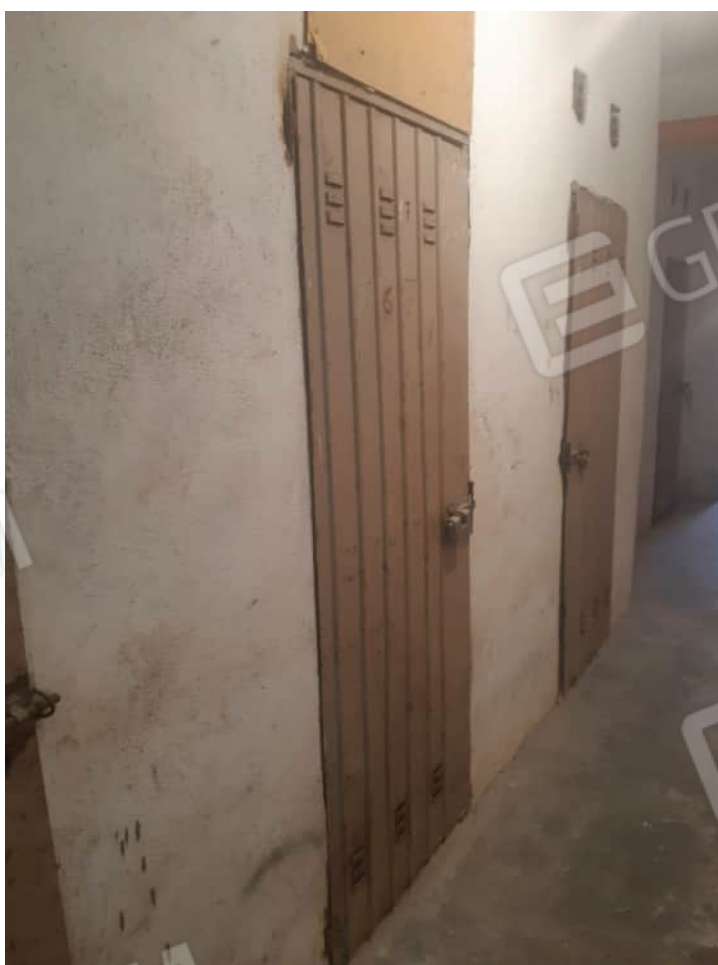
Vista particolare dal disimpegno comune del portoncino di accesso al locale cantina in piano seminterrato