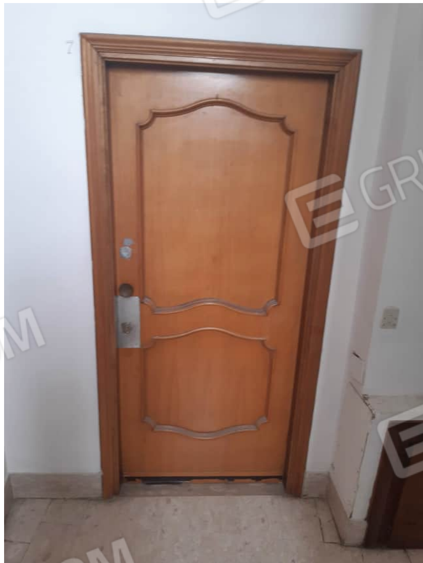
Vista particolare ubicazione e tipologia portoncino caposcala in pian secondo di accesso alla U.I.U.