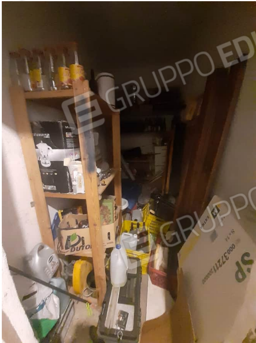
Vista interna locale cantina