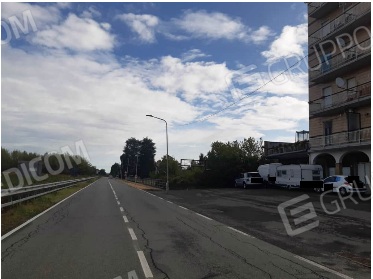
Vista d'insieme dell'ubicazione del fabbricato condominiale rispetto alla Via Alessandria