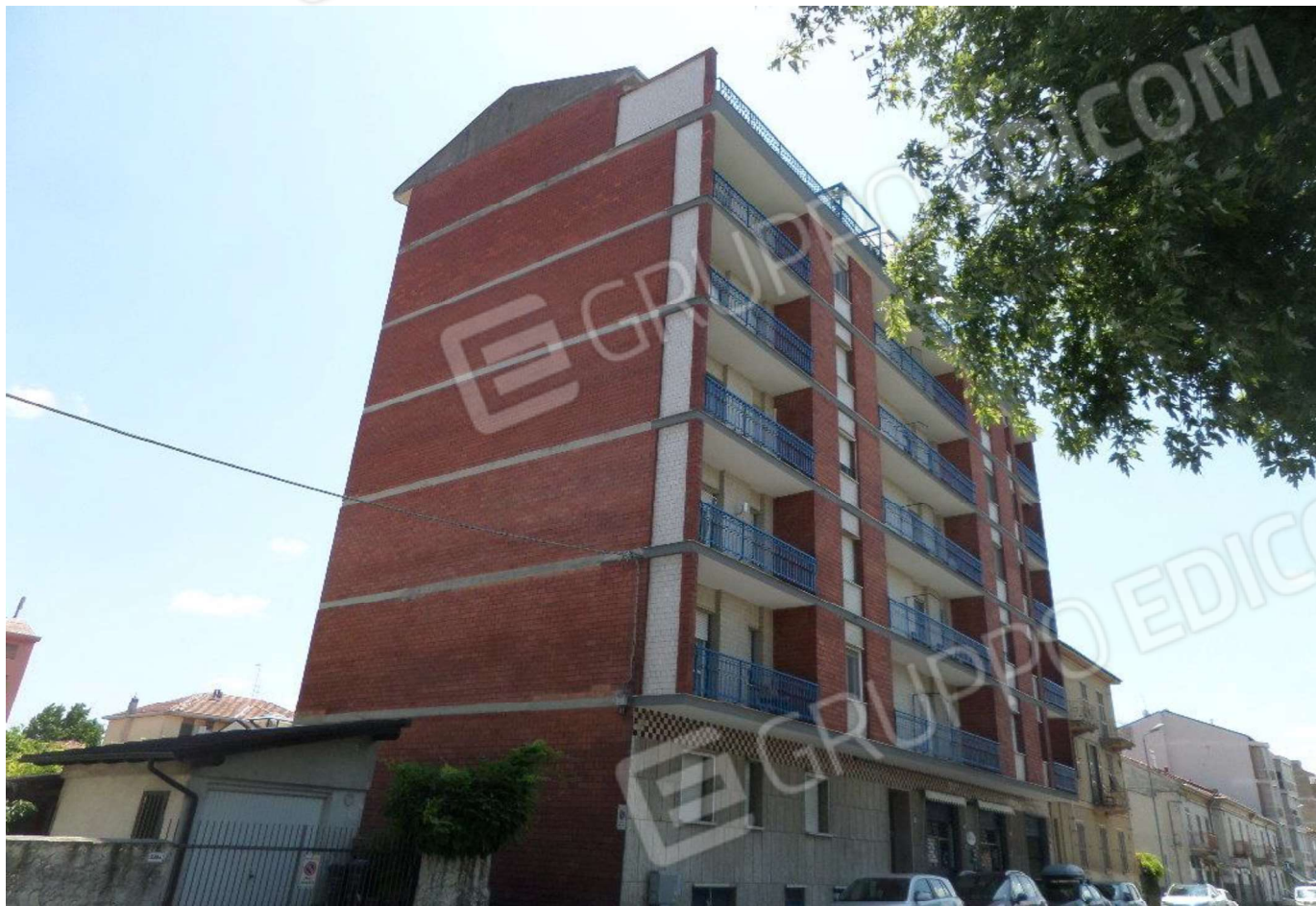
Foto n. 3 – lato strada Vista del condominio JOLLY Foto n. 4 – lato strada