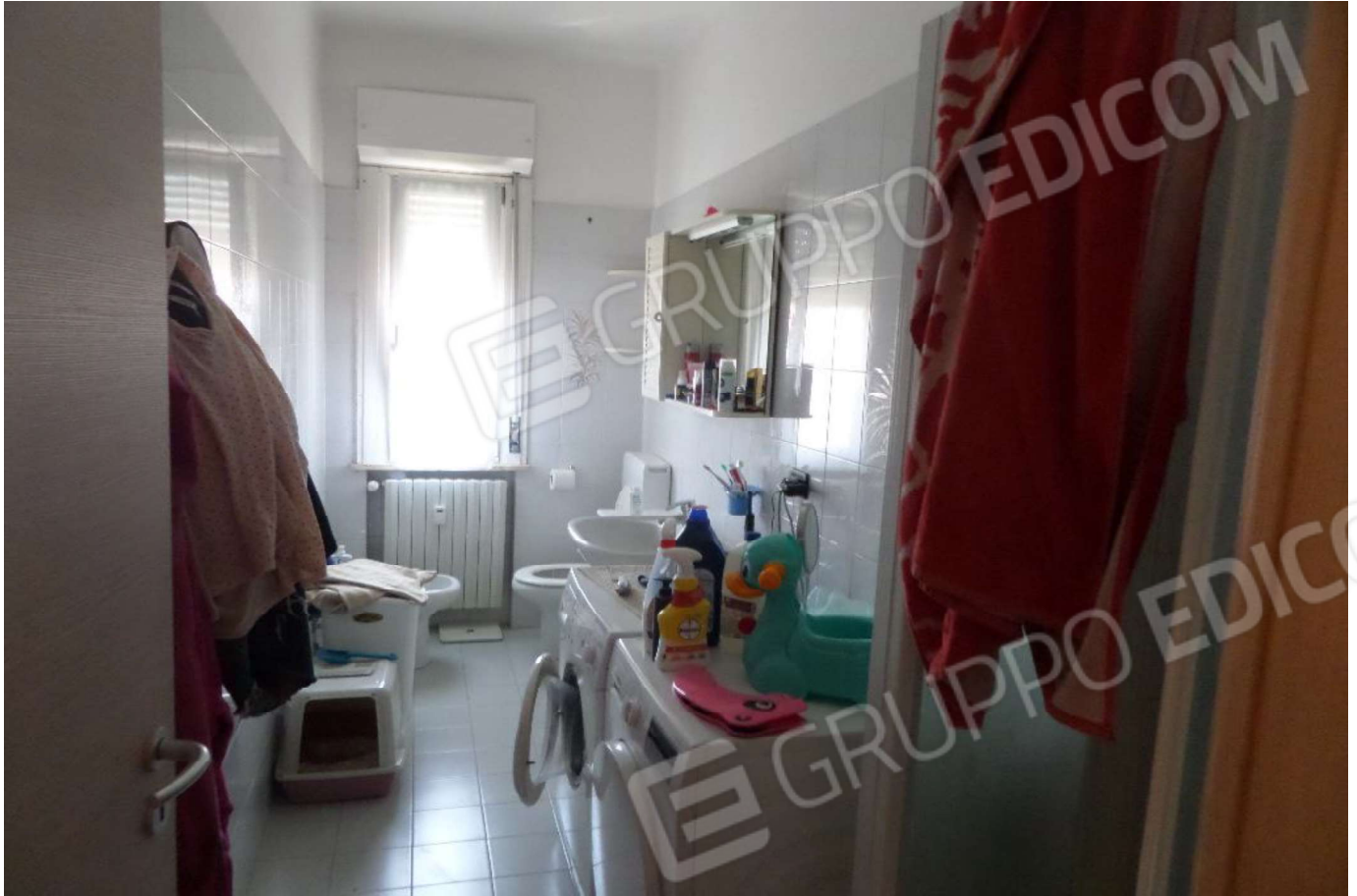
Foto n. 13 - appartamento