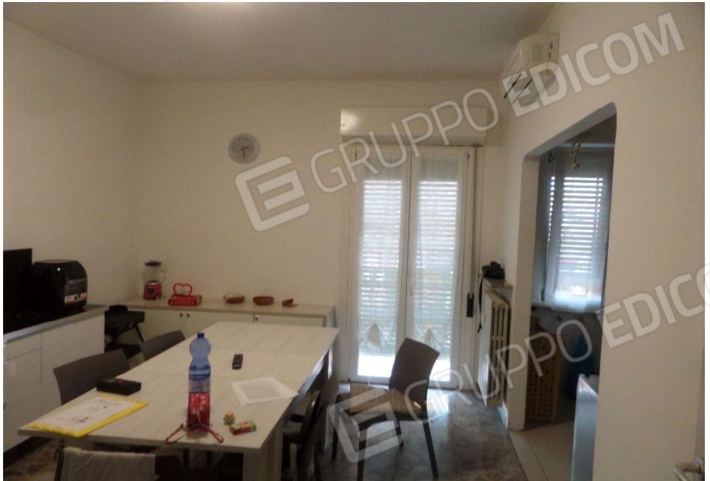
Foto n. 9 - appartamento Vista del tinello e del cucinino Foto n. 10 - appartamento