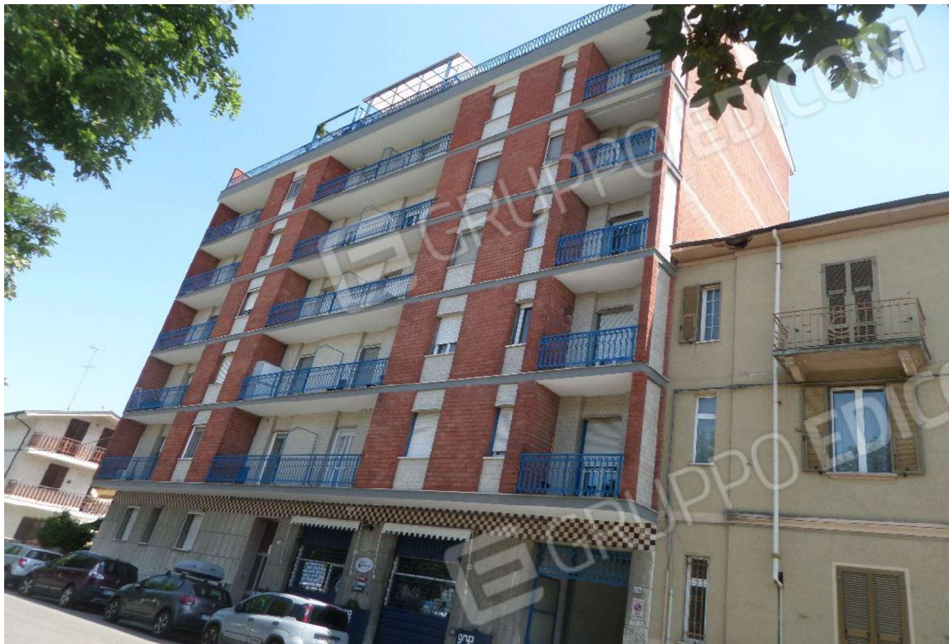
Foto n. 5 – lato strada Vista del condominio JOLLY Foto n. 6 – lato cortile