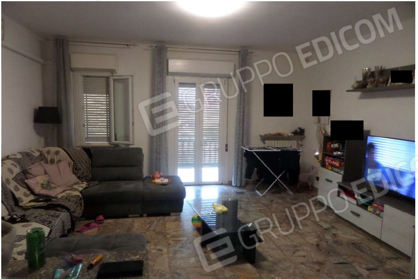
Foto n. 11 - appartamento Vista del soggiorno e dell'ingresso Foto n. 12 - appartamento