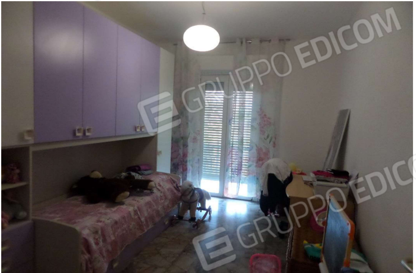
Foto n. 15 - appartamento