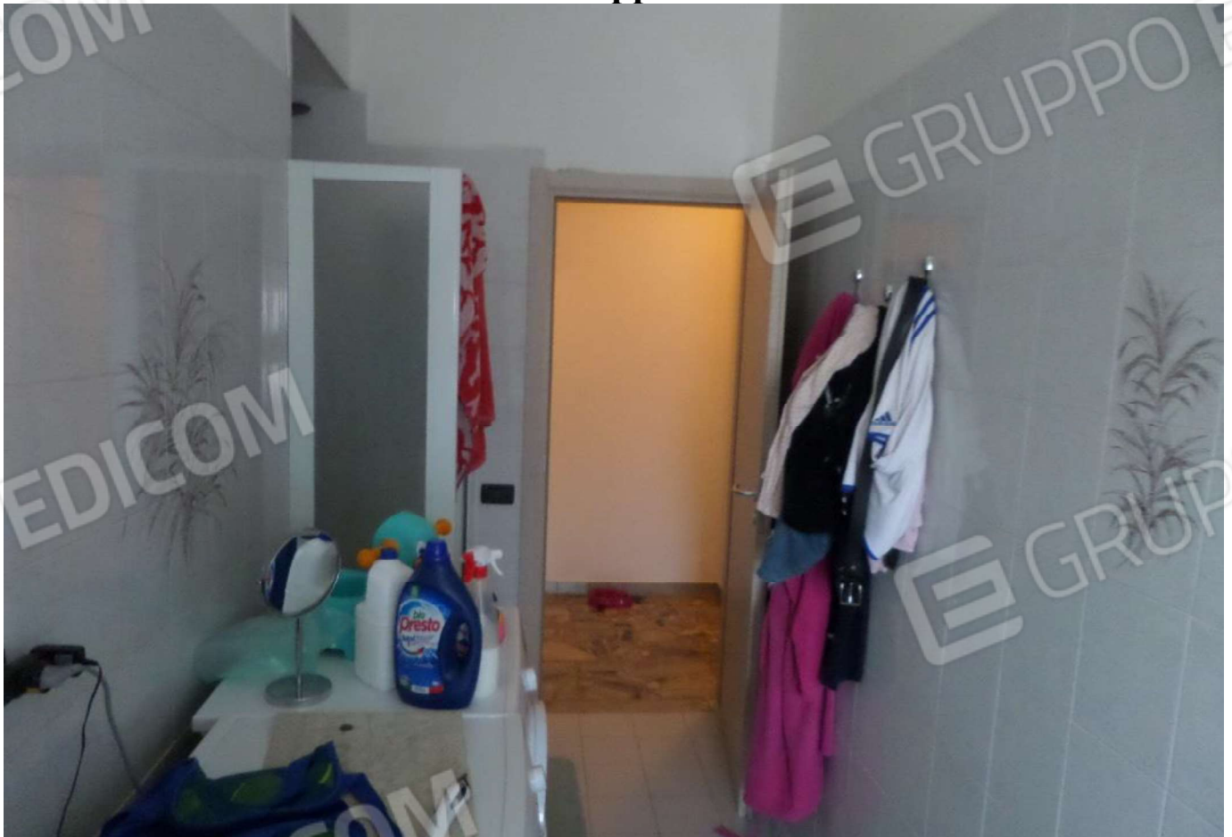
Foto n. 14 - appartamento