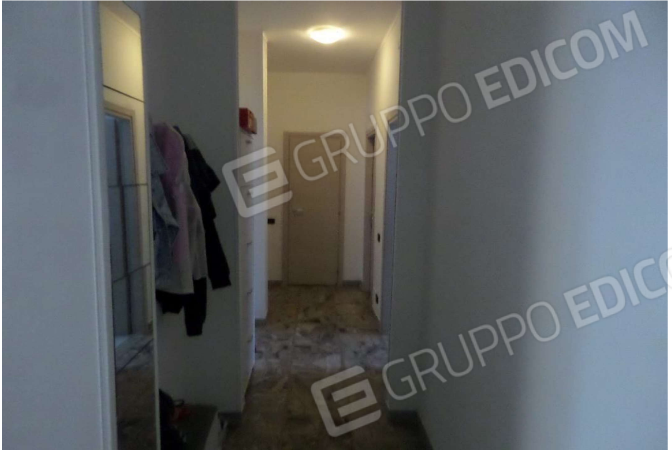
Foto n. 17 - appartamento Vista del disimpegno e del ripostiglio Foto n. 18 - appartamento