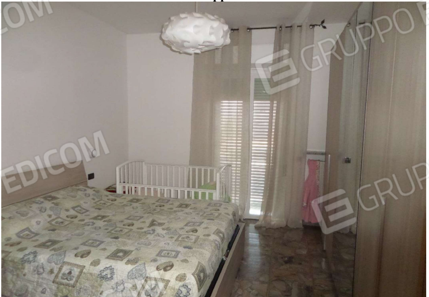
Foto n. 16 - appartamento