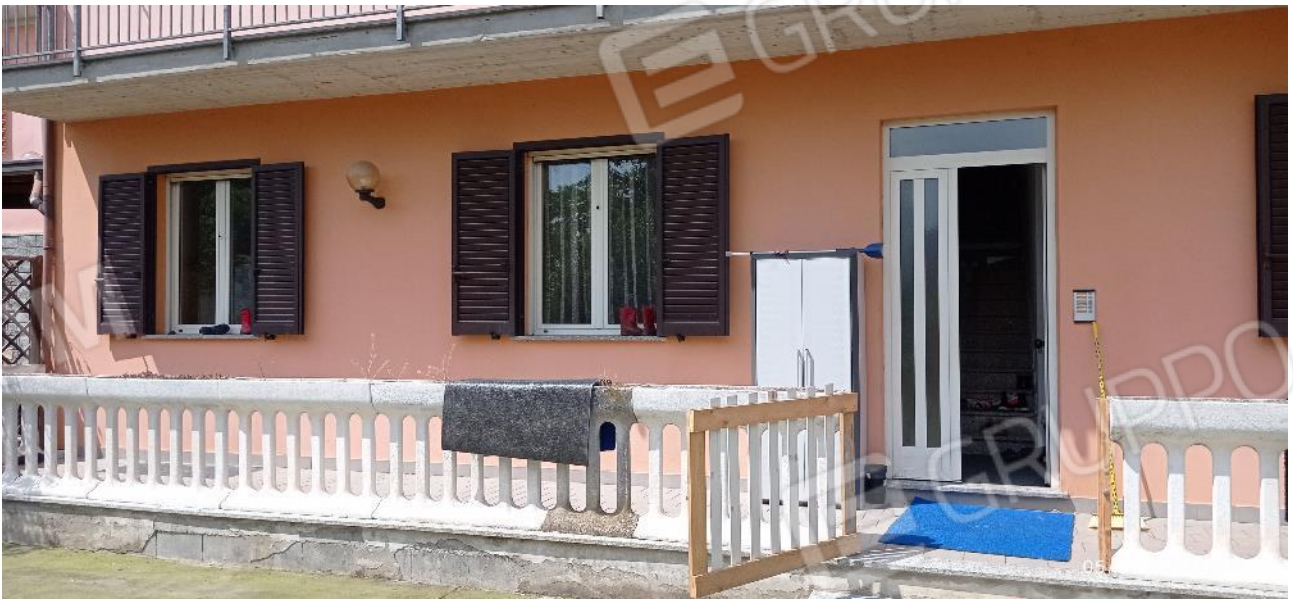
8. Ingresso secondario fabbricato