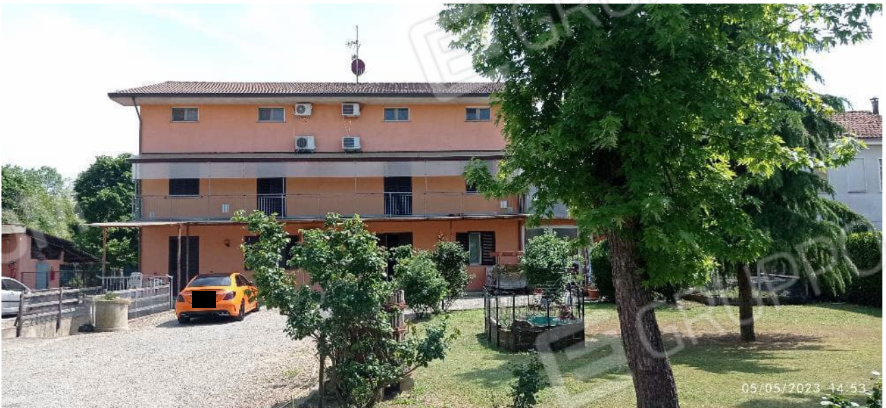
2. Prospetto principale fabbricato