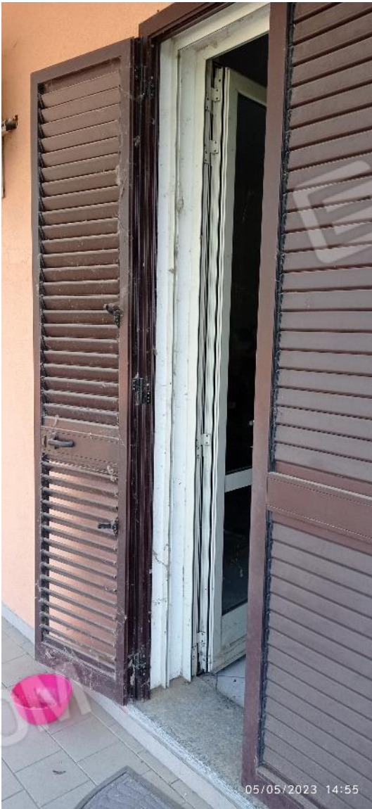
9. Serramento ingresso principale fabbricato