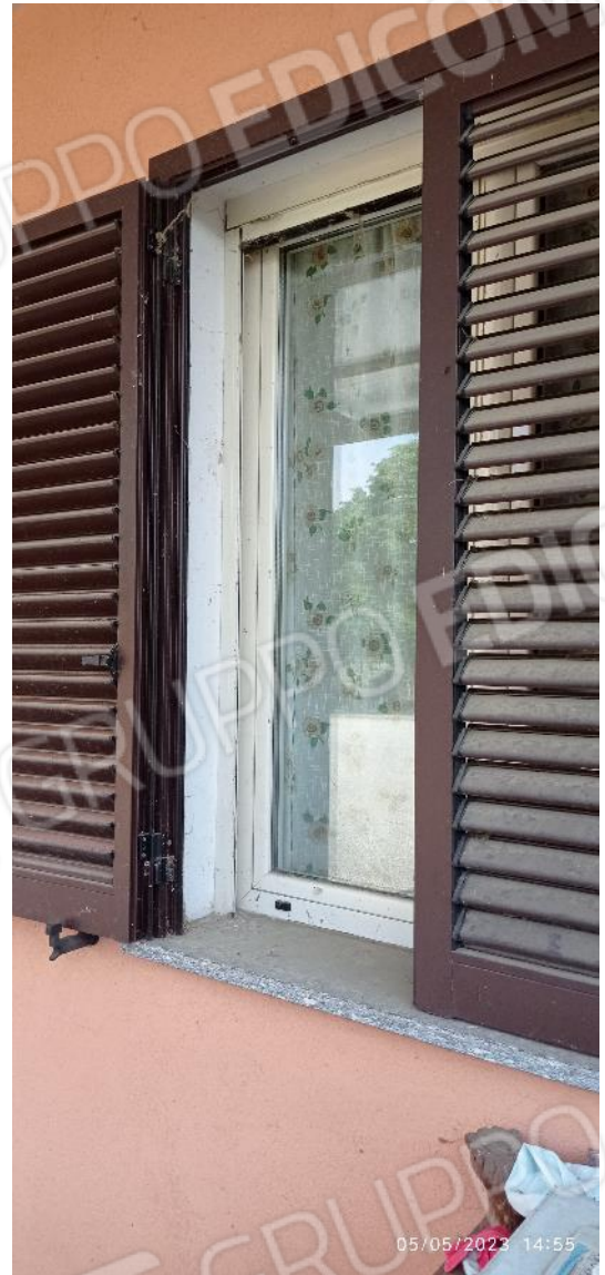
10. Dettaglio serramenti esterni