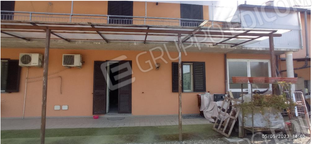
5. Prospetto principale fabbricato – accesso all'unità immobiliare