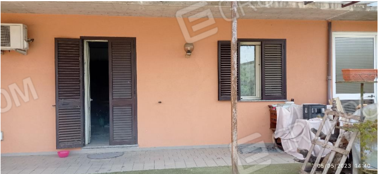
6. Prospetto principale fabbricato – accesso all'unità immobiliare