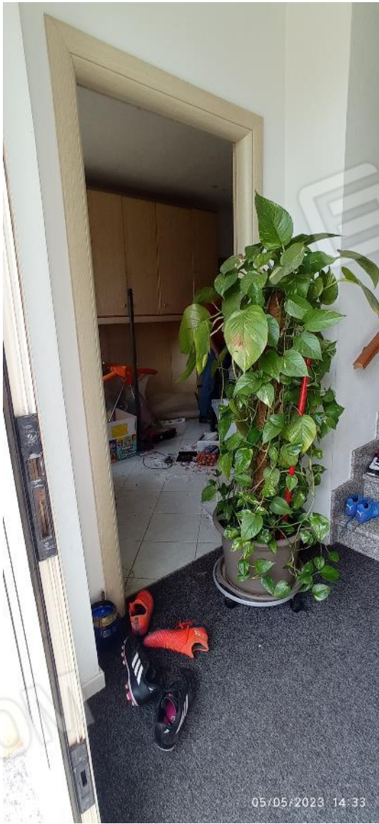
11. Ingresso secondario unità immobiliare