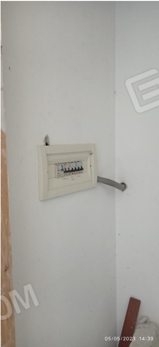
26. Dettaglio quadro elettrico