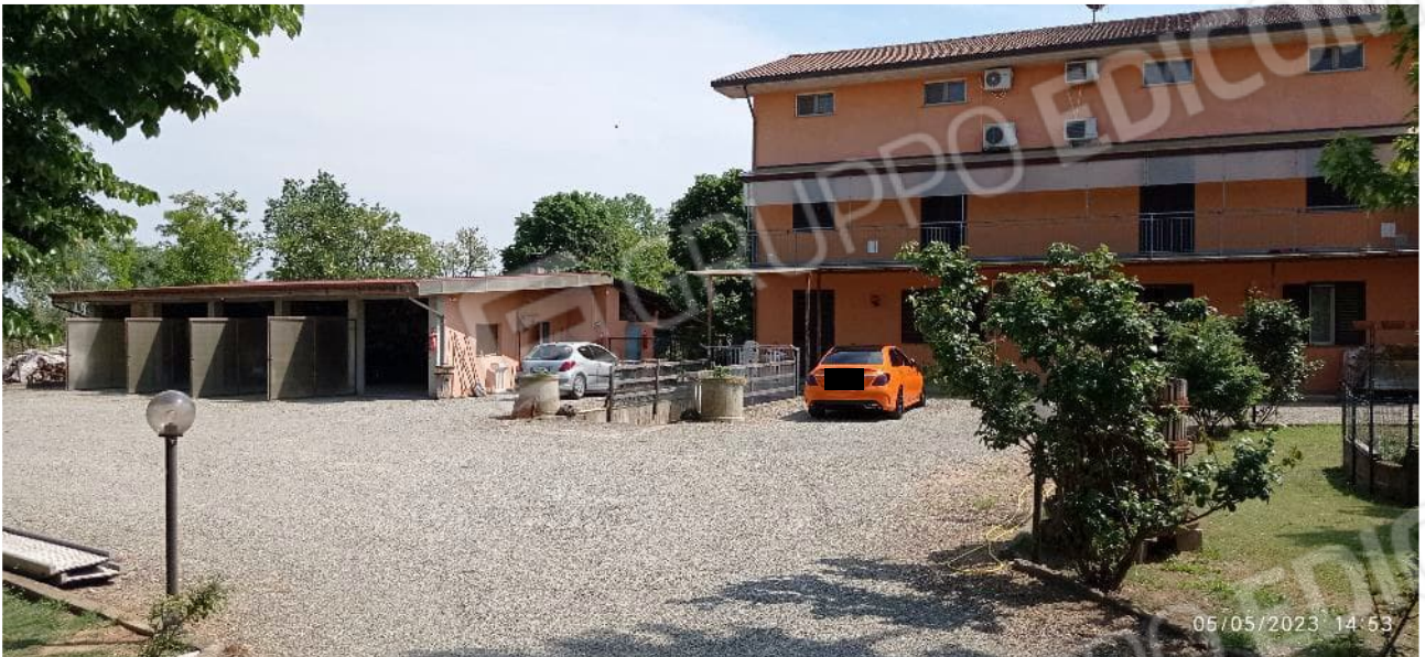
3. Prospetto principale fabbricato