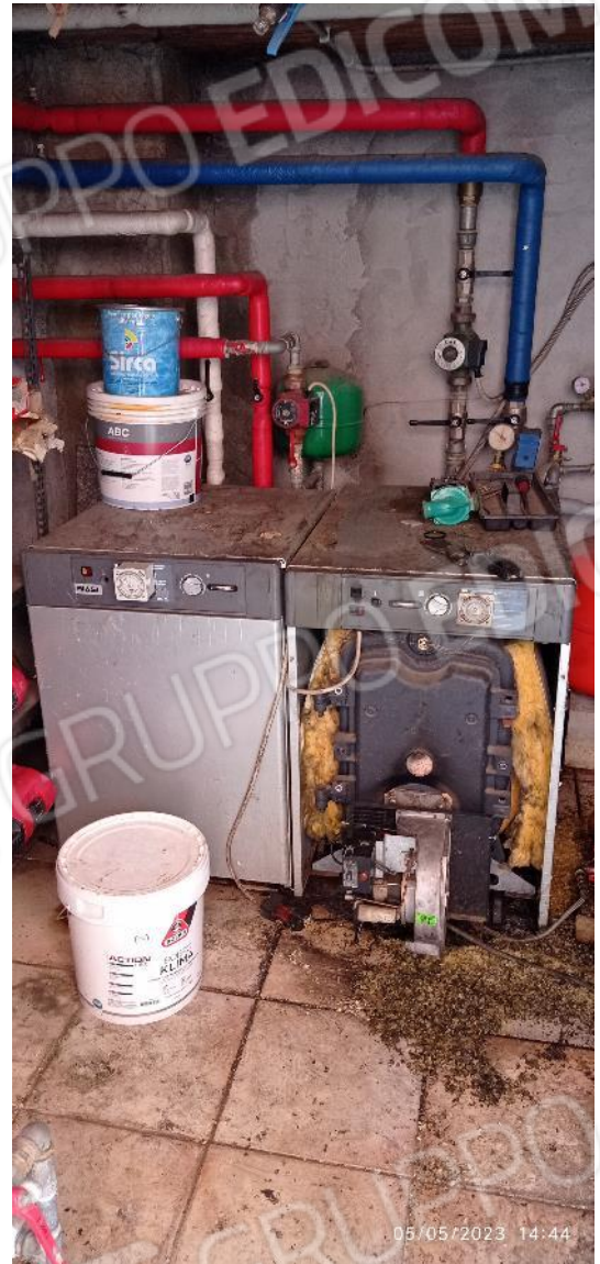
30. Caldaia centralizzata