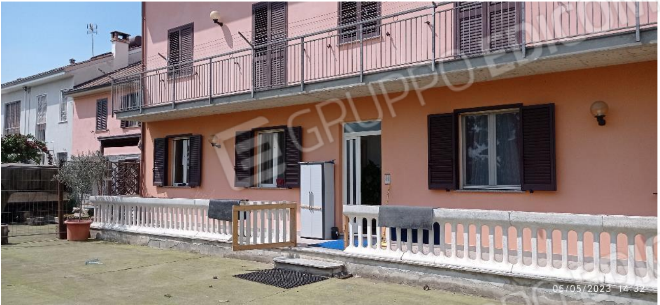
7. Ingresso secondario fabbricato