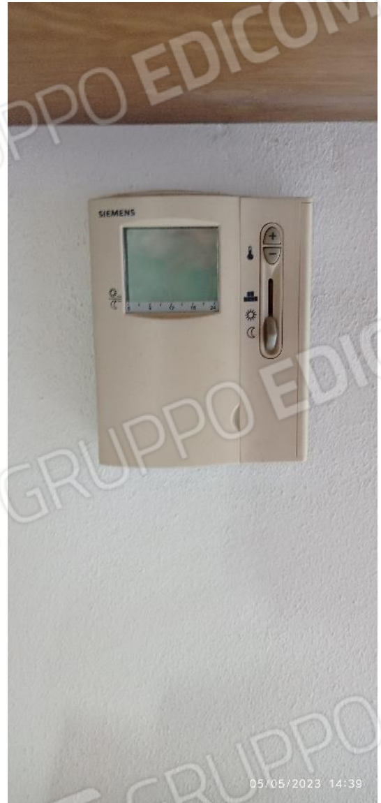
27. Dettaglio videocitofono