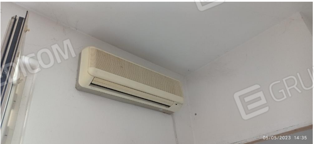
25. Unità interna pompa di calore