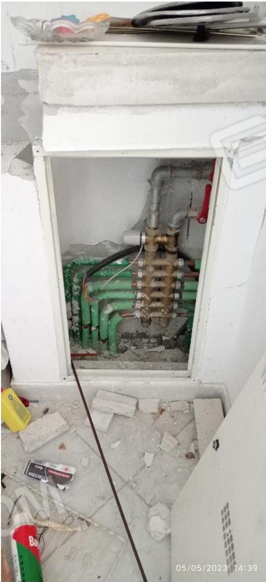
29. Dettaglio collettore di distribuzione riscaldamento