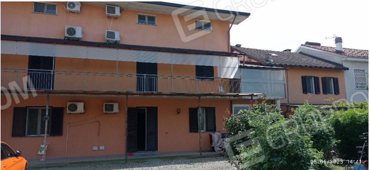
4. Prospetto principale fabbricato – accesso all'unità immobiliare