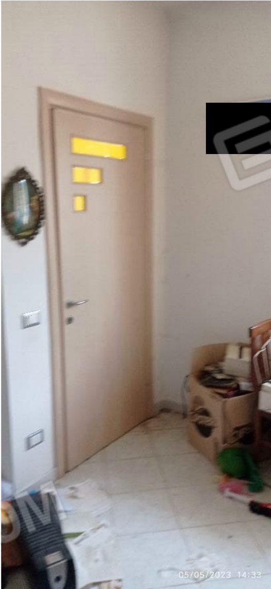
13. Ingresso secondario unità immobiliare (camera)