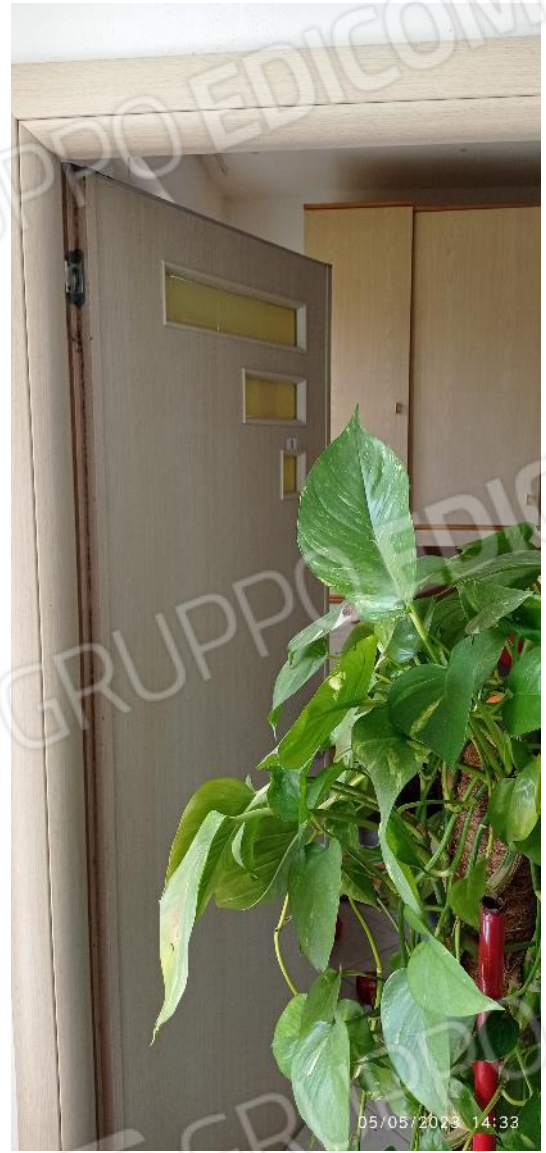
12. Ingresso secondario unità immobiliare