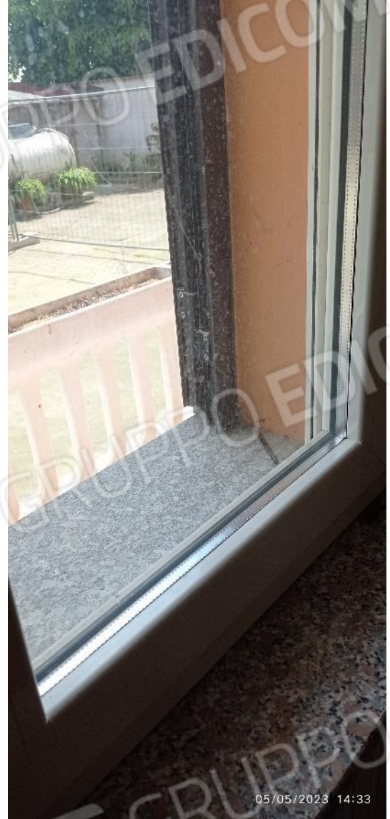
14. Dettaglio serramenti esterni