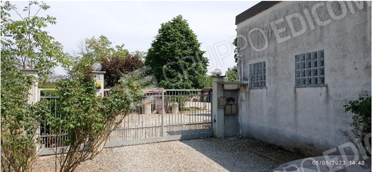
1. Accesso alla proprietà