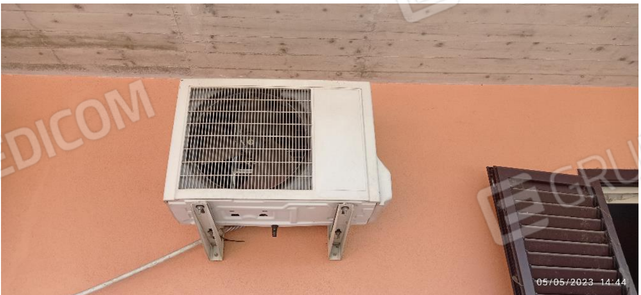
28. Motore esterno pompa di calore esistente