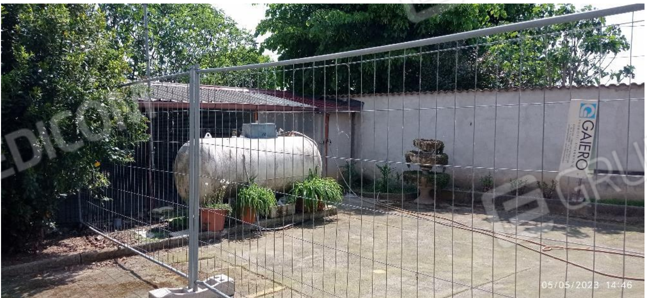
31. Cisterna GPL