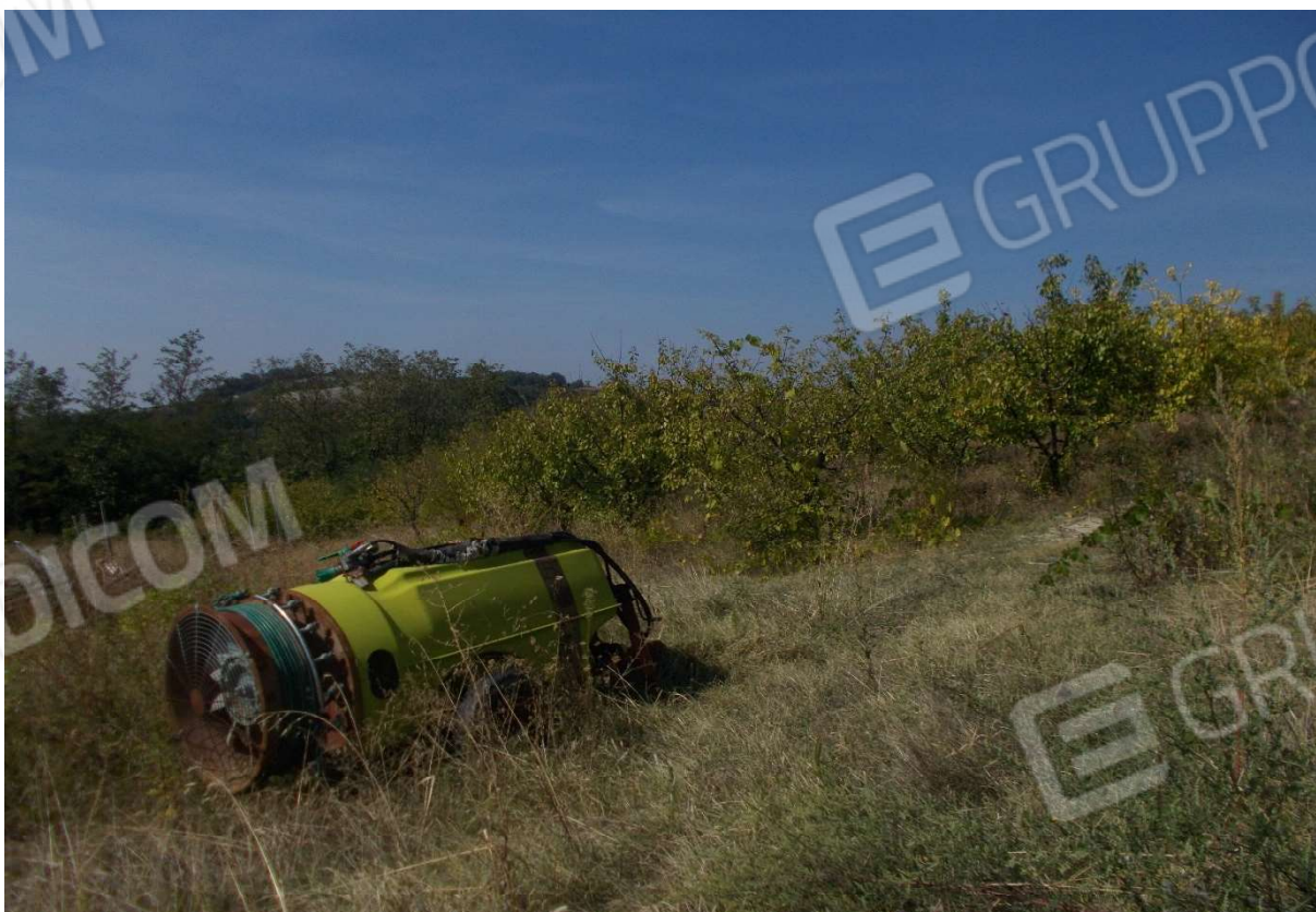
12. Particolare appezzamento di terreno descritto al mapp. 162 del foglio 9 - Comune di Monleale