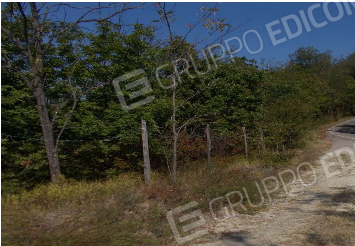
15. Particolare appezzamento di terreno descritto al mapp. 353 del foglio 9 - Comune di Monleale