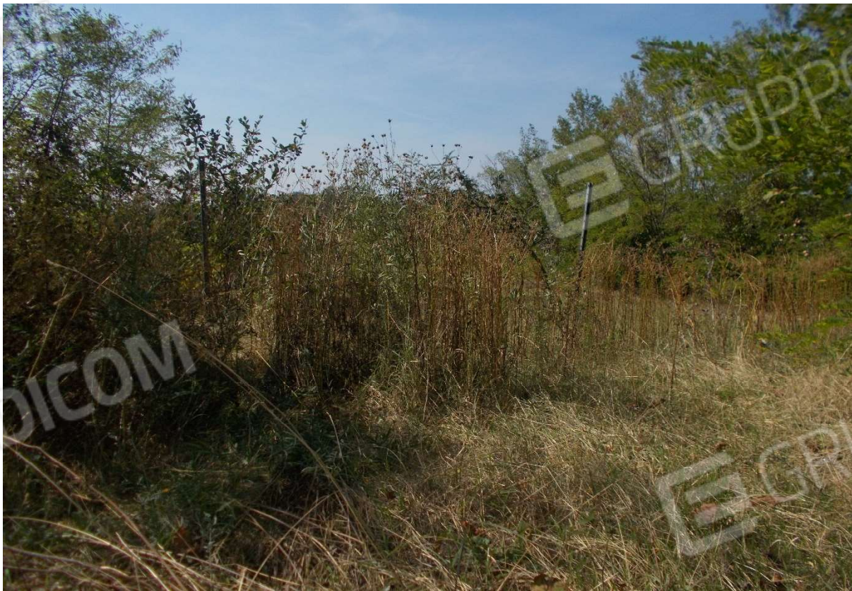
16. Particolare appezzamenti di terreno descritti ai mapp. 350 e 351 del foglio 9 - Comune di Sarezzano