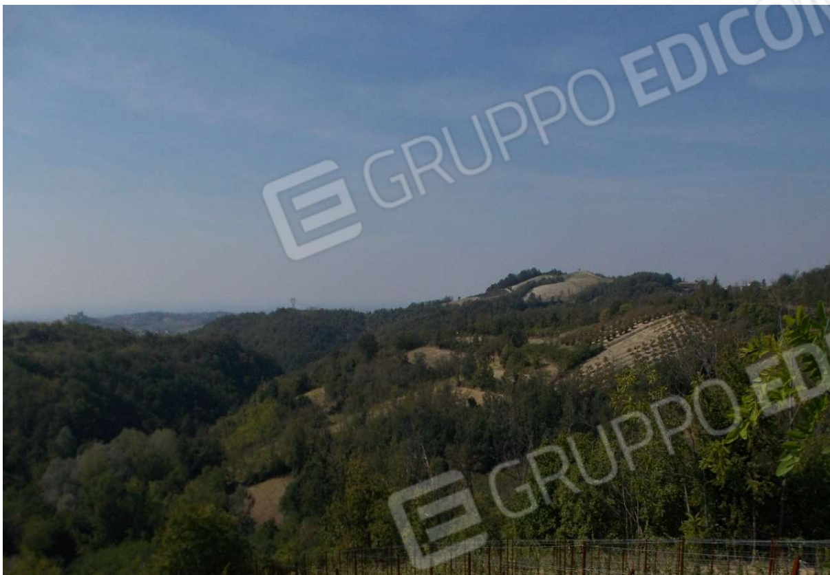
13. Particolare appezzamento di terreno descritto al mapp. 182 del foglio 9 - Comune di Monleale