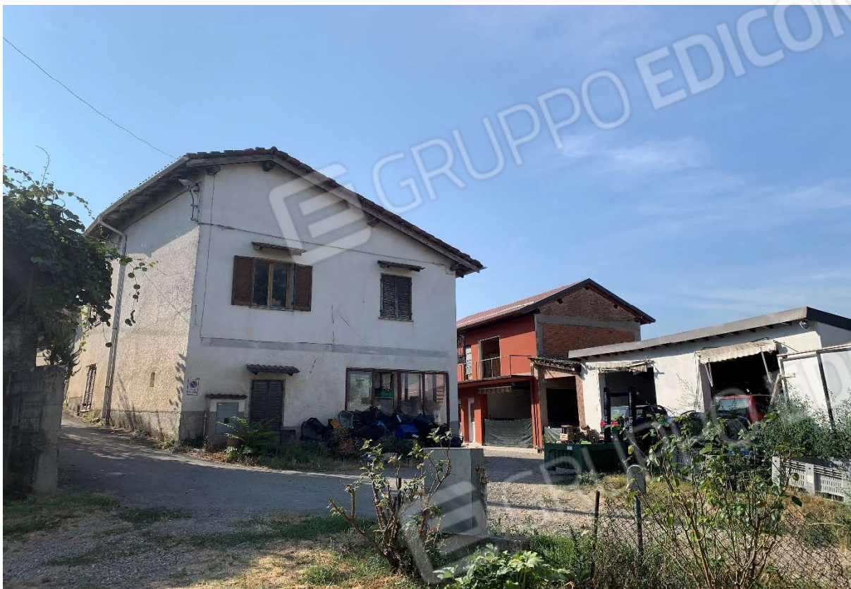
1. Fabbricato ad uso civile abitazione con locale magazzino di pertinenza oggetto della presente Esecuzione Immobiliare - particolare lato nord