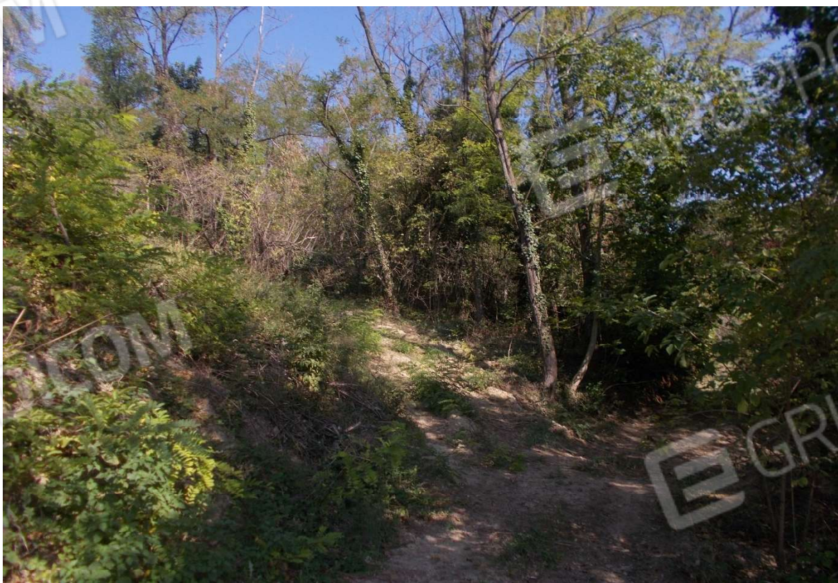
14. Particolare appezzamenti di terreno descritti ai mapp. 282 e 283 del foglio 9 - Comune di Monleale