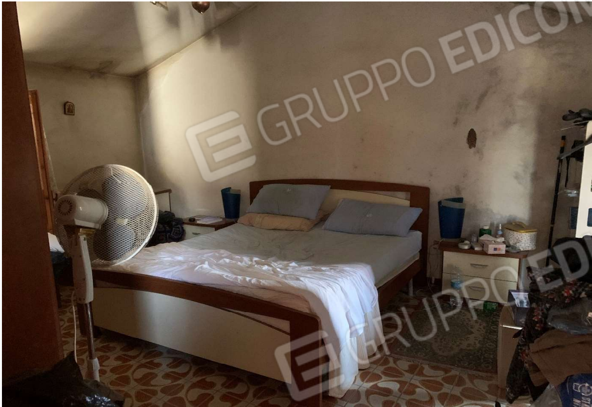
7. Particolare interno camera al piano primo