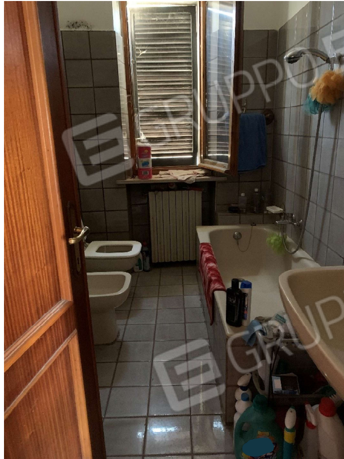
9. Particolare interno bagno al piano primo