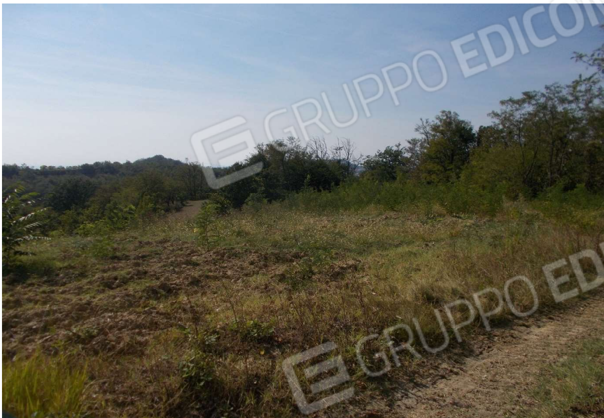
11. Particolare appezzamento di terreno descritto al mapp. 136 del foglio 9 - Comune di Monleale