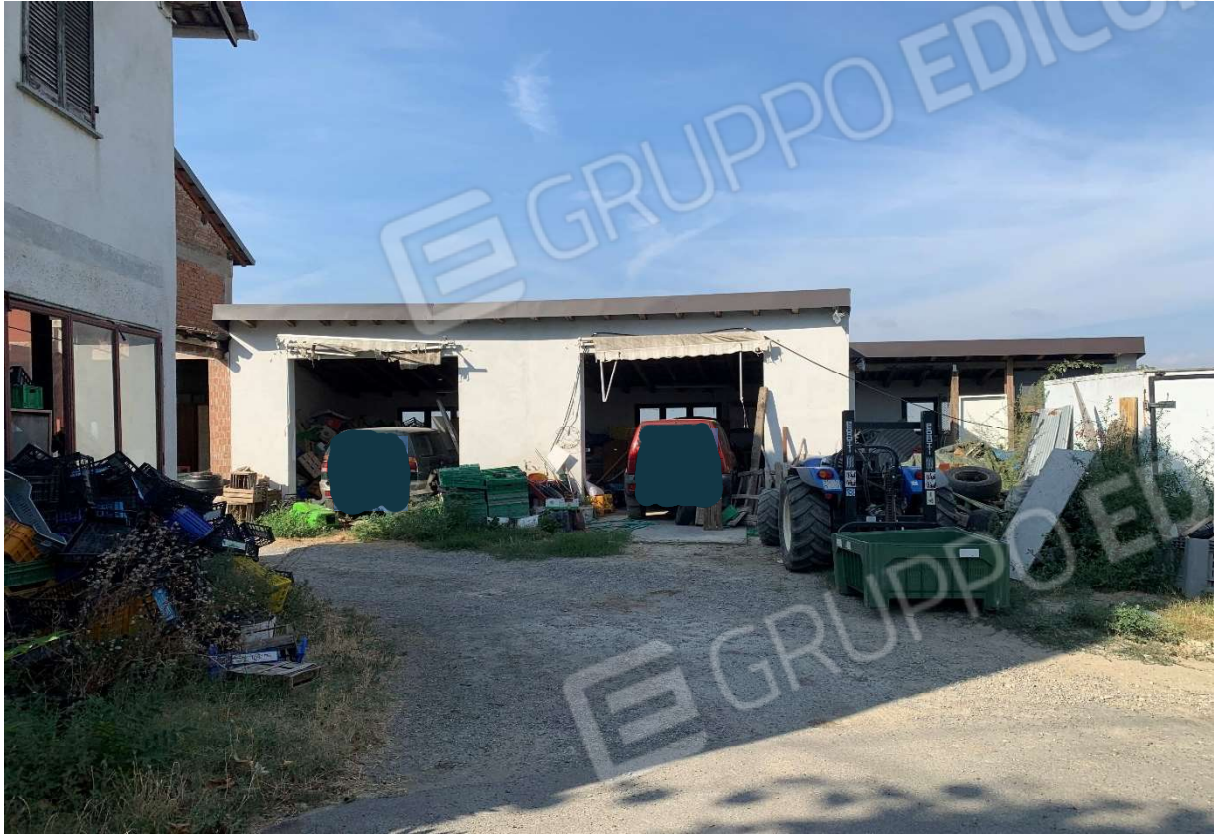
3. Locale magazzino antistante l'abitazione