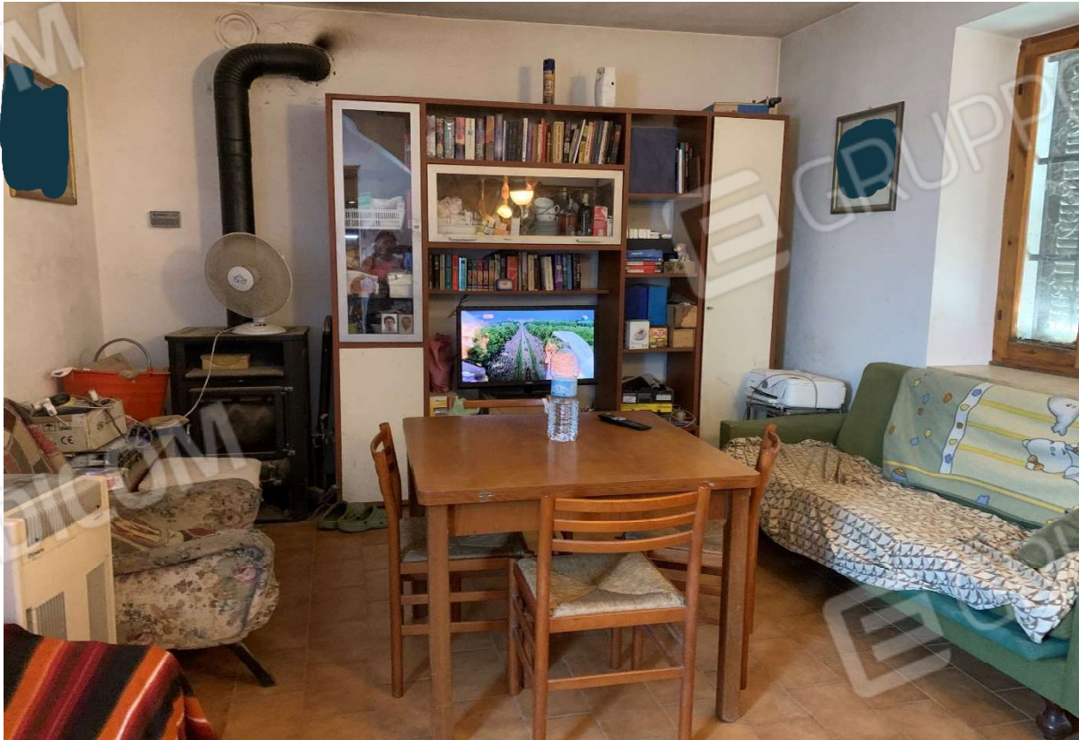
6. Particolare interno soggiorno al piano terra