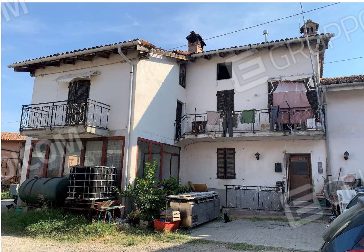
2. Prospetto principale immobile ad uso civile abitazione con antistante porzione di sedime cortilizio - particolare lato ovest