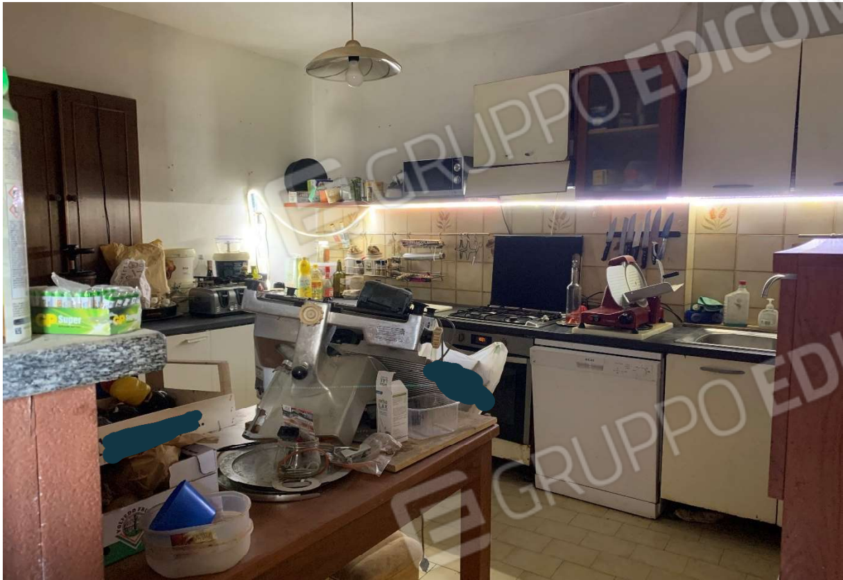
5. Particolare interno cucina al piano terra