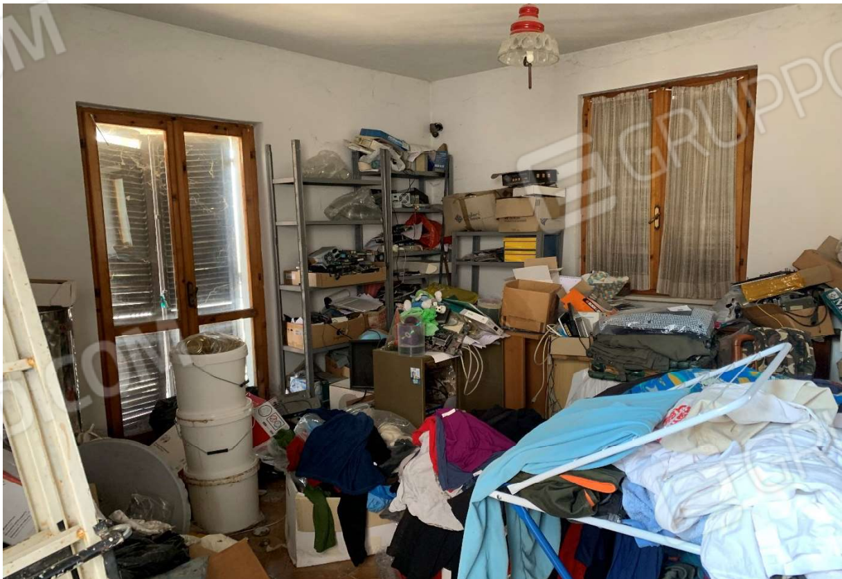
8. Particolare interno camera al piano primo