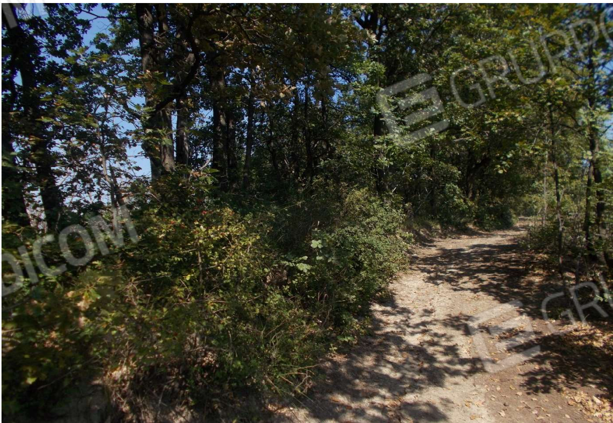
10. Particolare appezzamenti di terreno descritti ai mapp. 62 e 76 del foglio 9 - Comune di Monleale