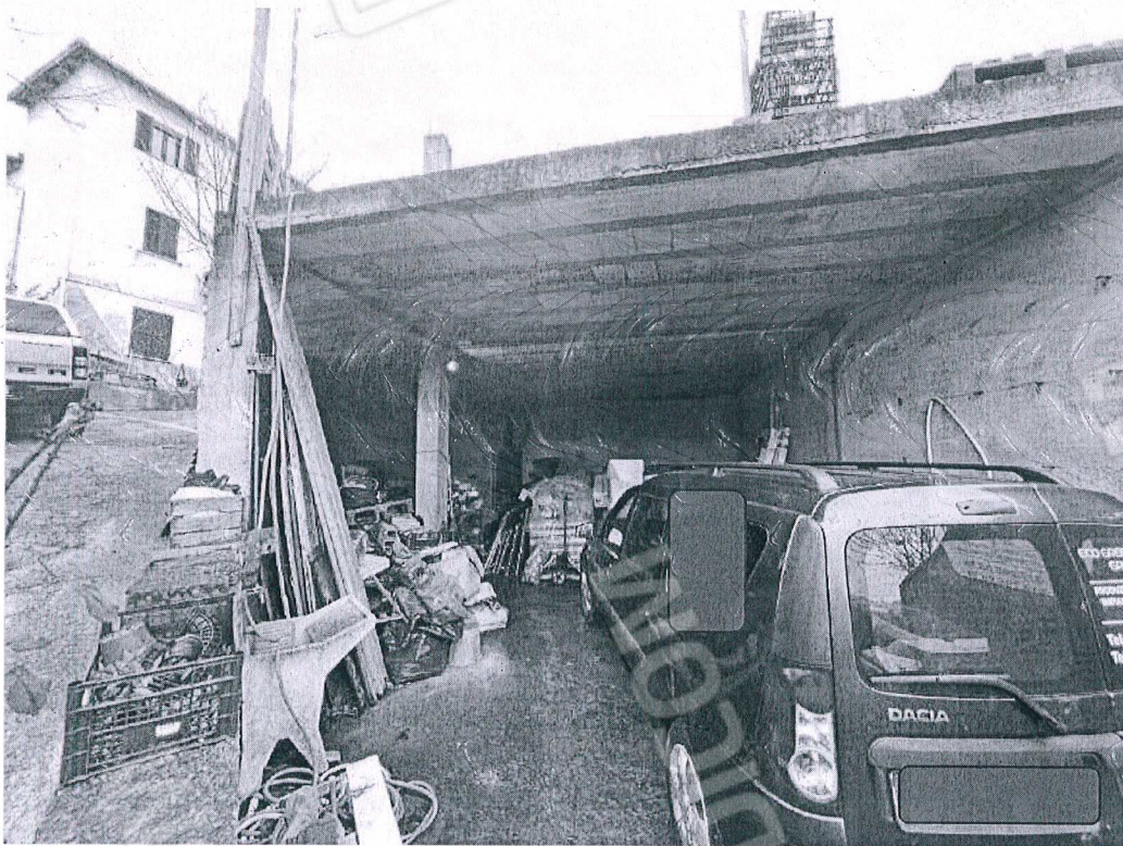
Figura 24 struttura esterna pertinenziale incompleta