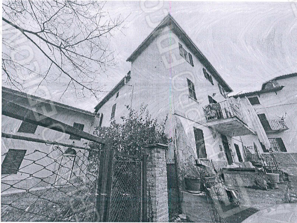
Figura 1 vista esterna abitazione