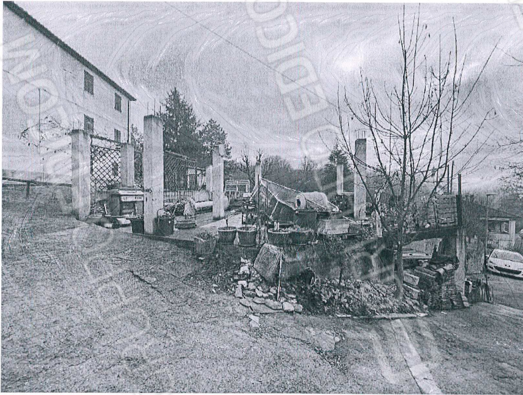
Figura 23 struttura esterna pertinenziale incompleta