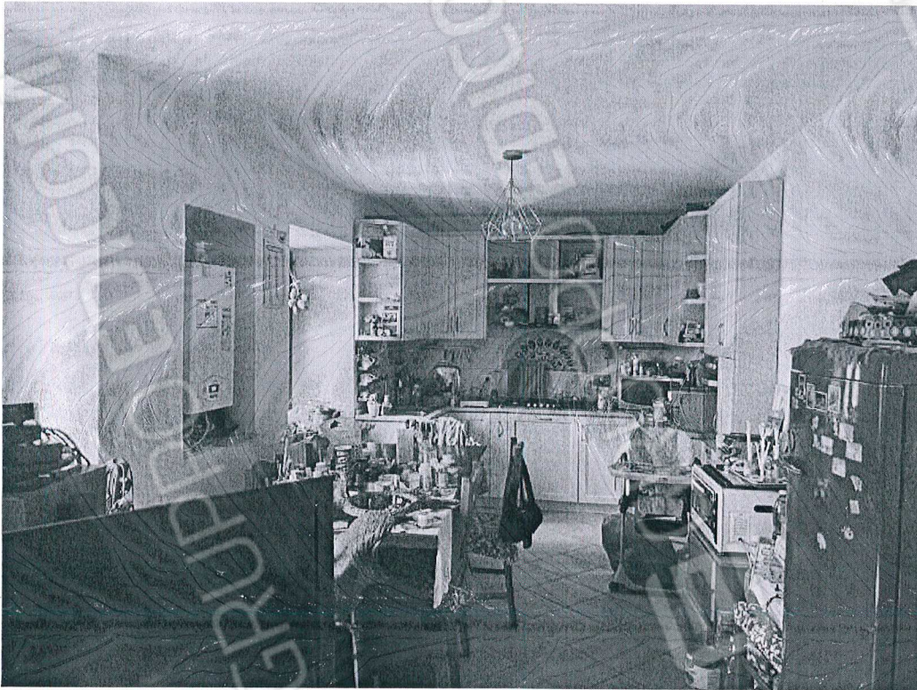
Figura 5 cucina piano terreno