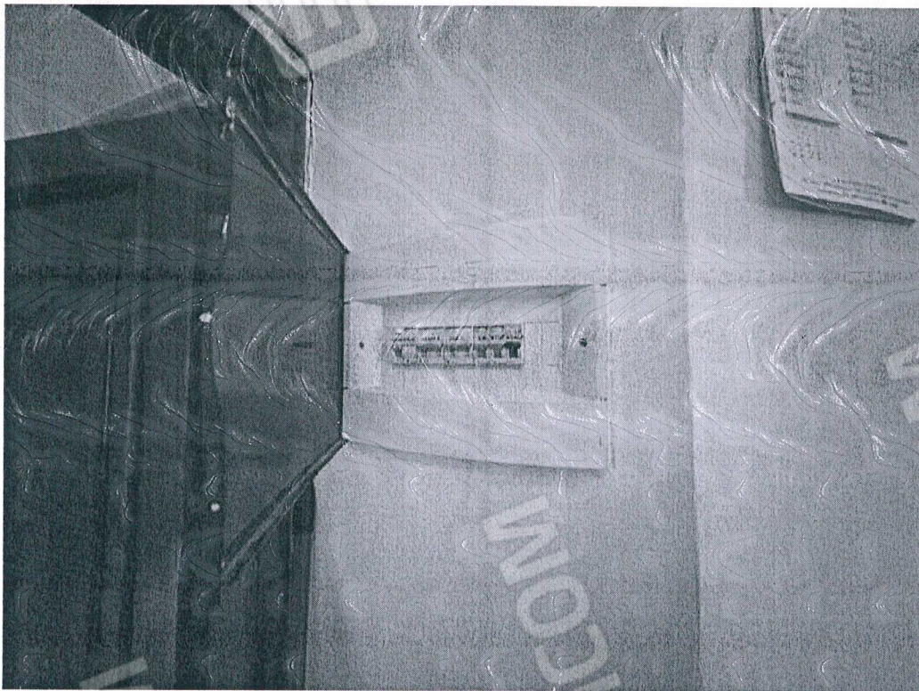
Figura 6 dettaglio impianto elettrico