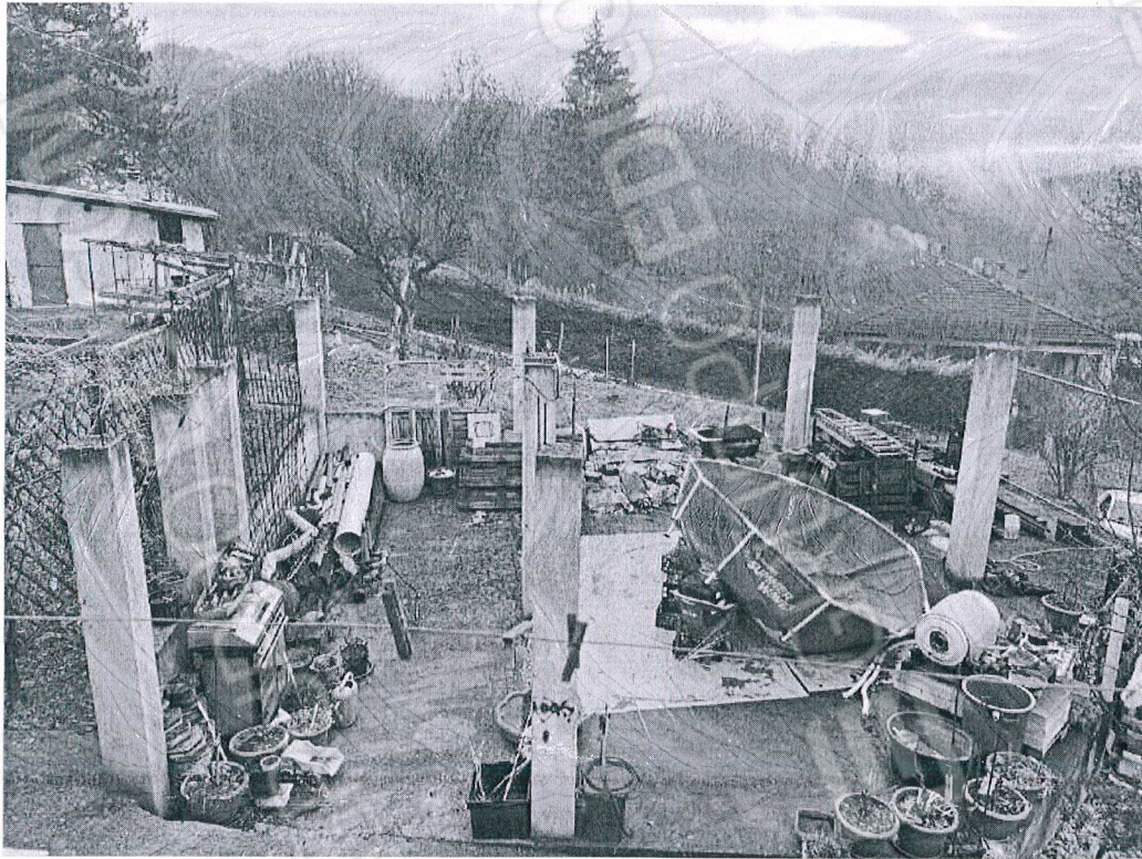
Figura 25 struttura esterna pertinenziale incompleta