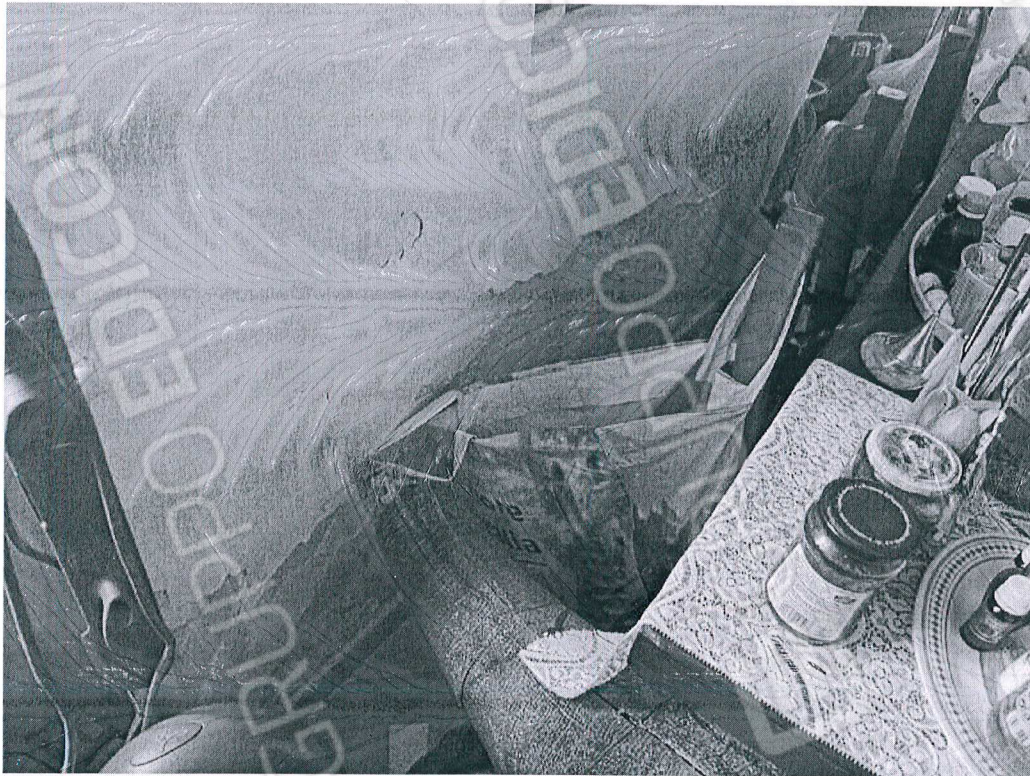
Figura 3 fenomeni di umidità da risalita