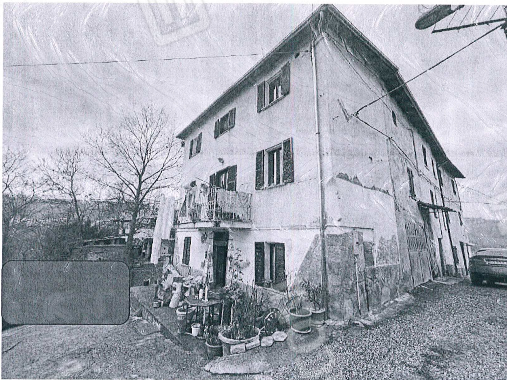
Figura 2 vista esterna abitazione