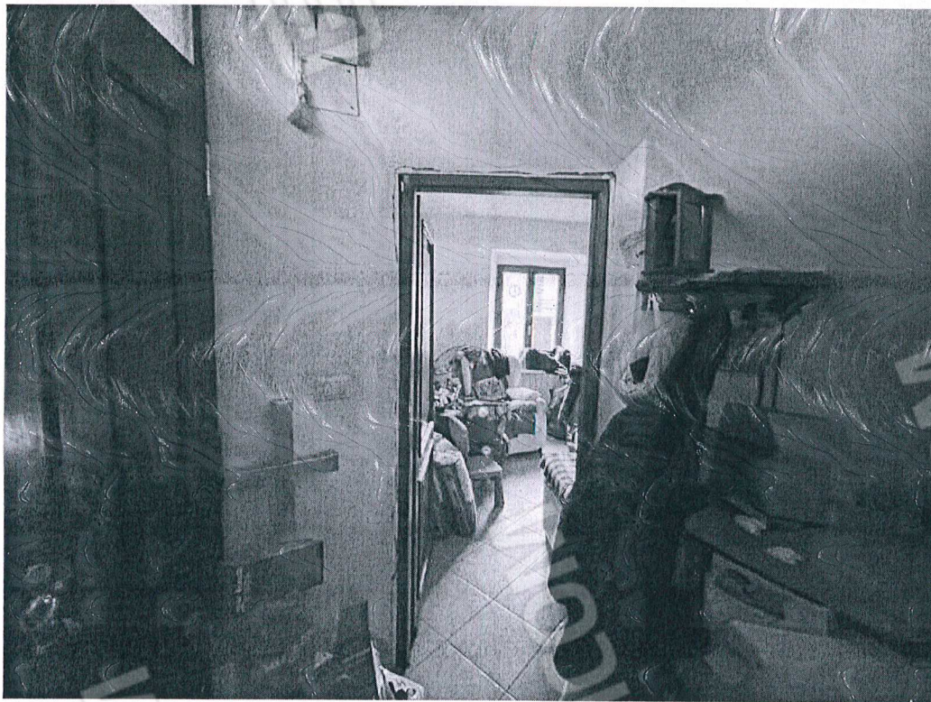
Figura 10 camera P 1