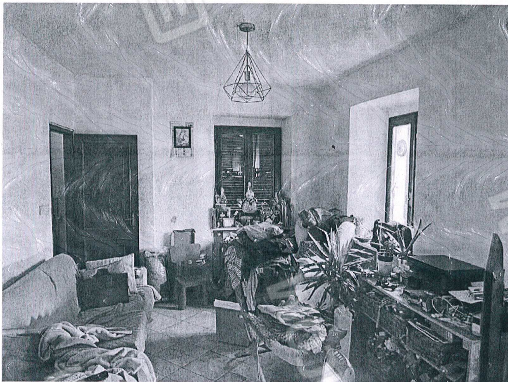
Figura 4 soggiorno piano terreno