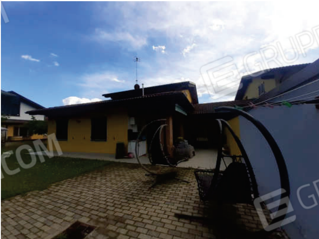
Vista prospetto fronte Nord del fabbricato oggetto di stima