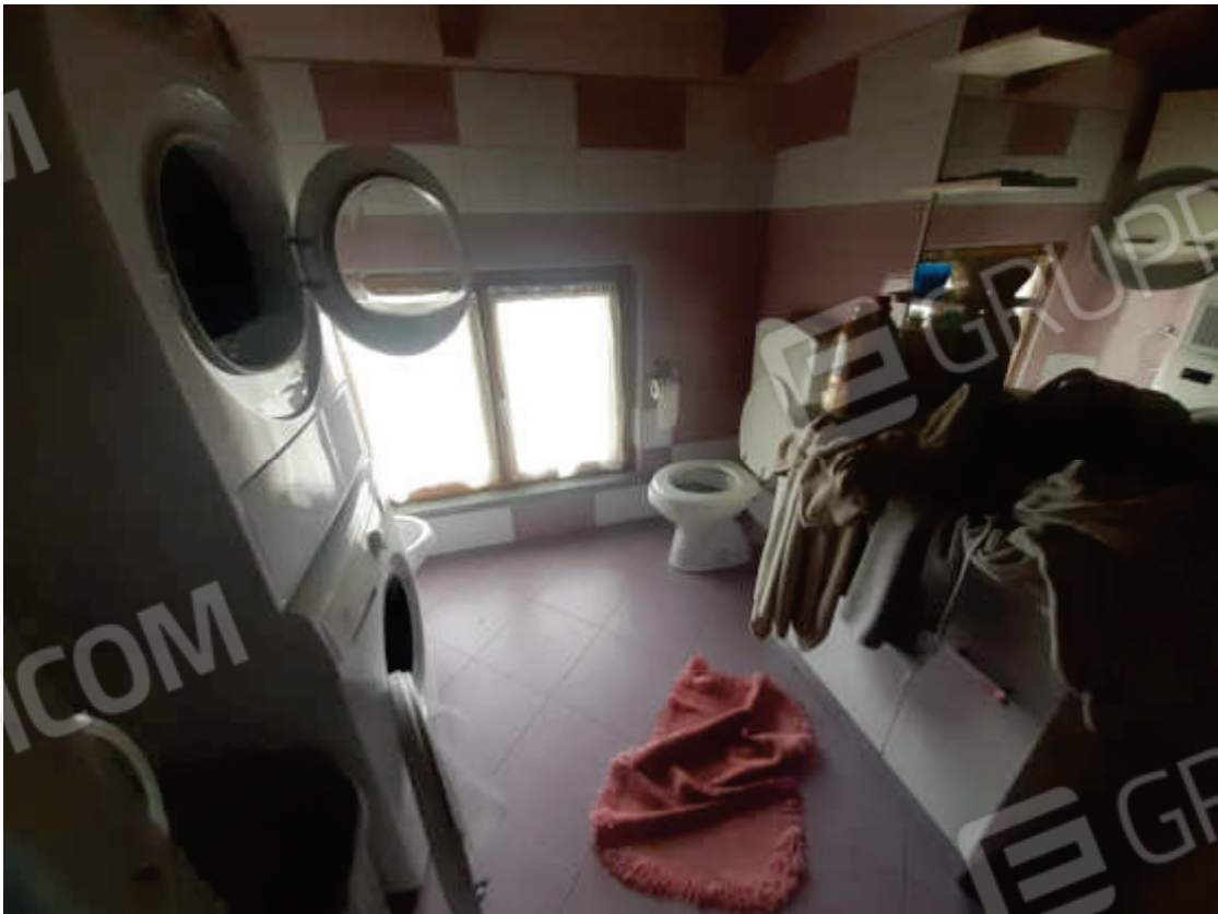
Vista interna locale bagno / lavanderia in piano primo