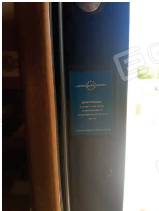
Vista del portoncino principale di accesso alla U.I.U.