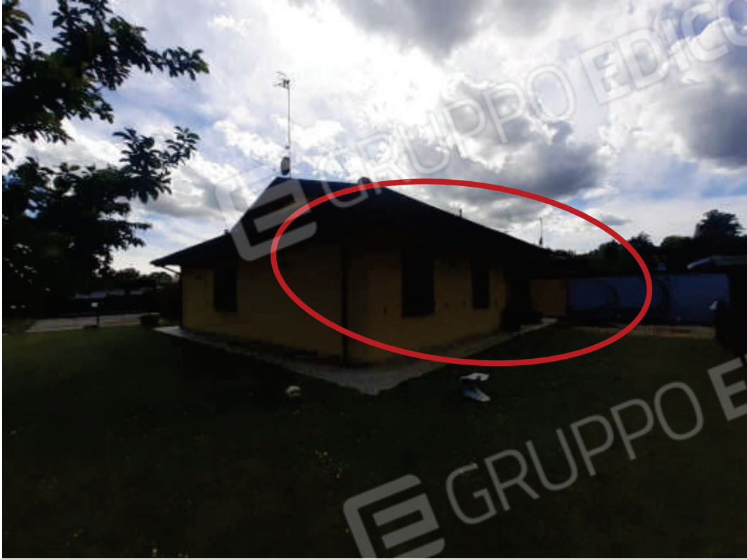
Vista prospetto fronte Est e risvolto Nord del fabbricato oggetto di stima