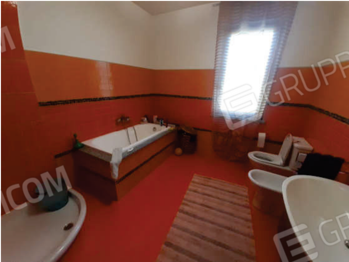
Vista interna del bagno in piano terra