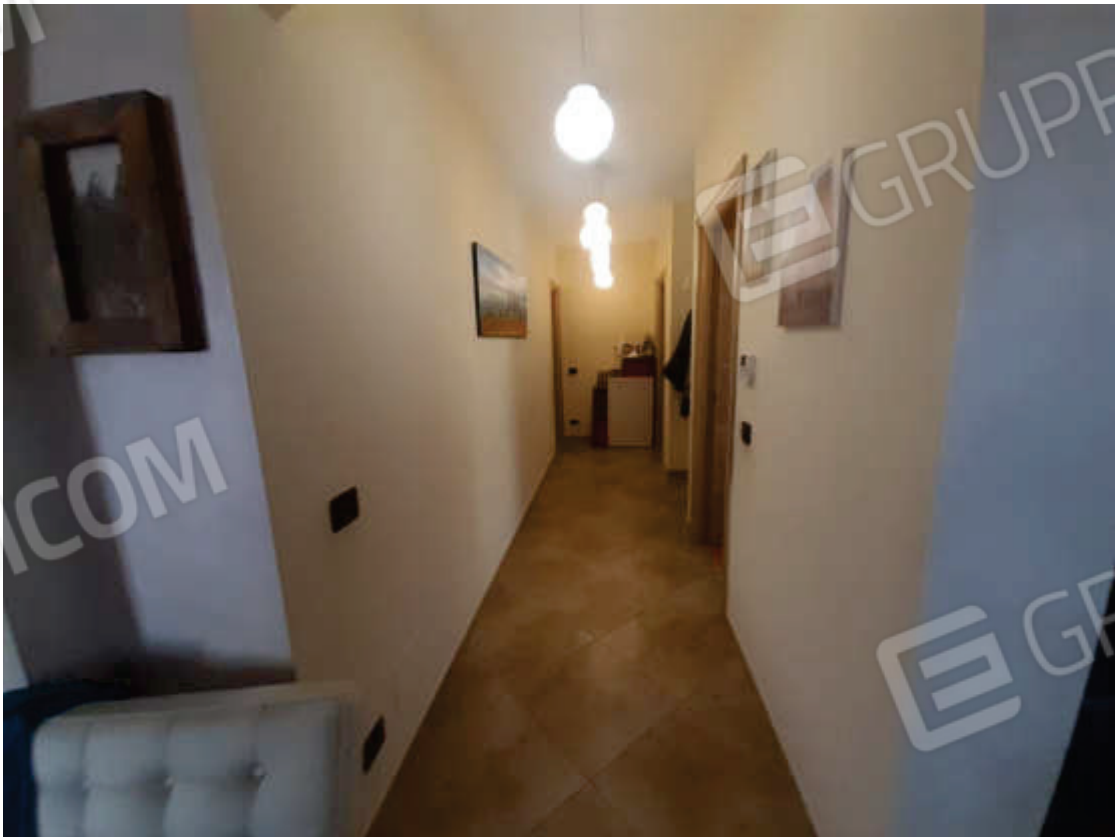
Vista interna disimpegno in piano terra