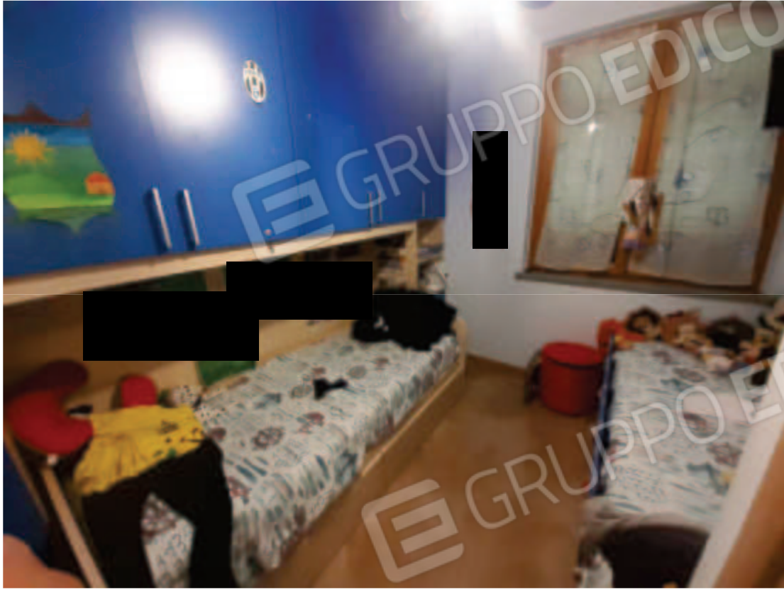
Vista interna camera letto in piano terra