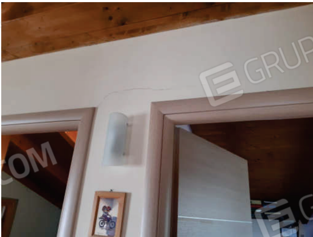
Vista particolare ammaloramenti superfici e rifiniture interne ( murature di divisione / tramezze )