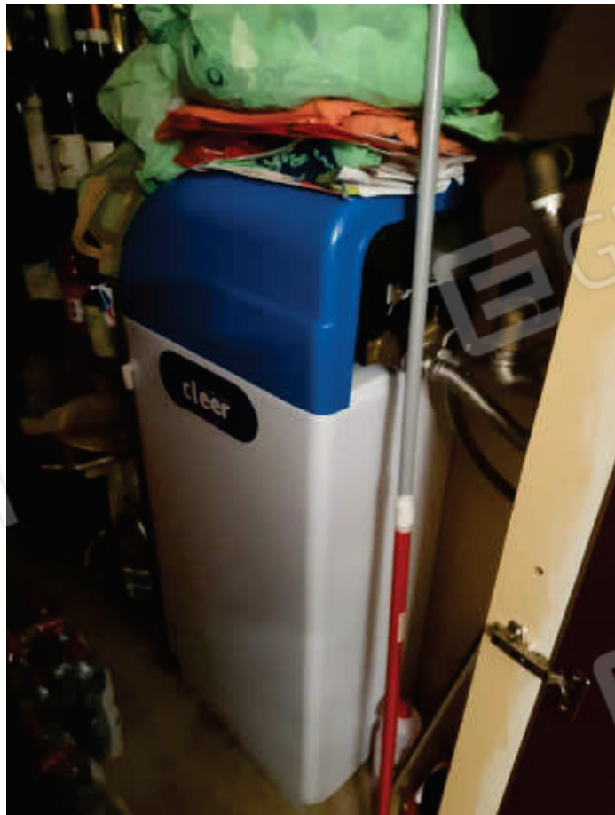
Vista interna locale sottoscala in piano terra con impianto addolcitore acque