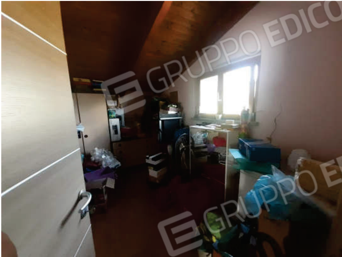
Vista interna locale ripostiglio in piano primo