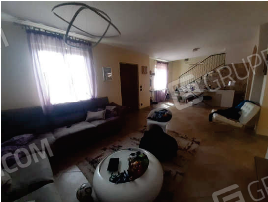
Vista interna del locale soggiorno / ingresso in piano terra