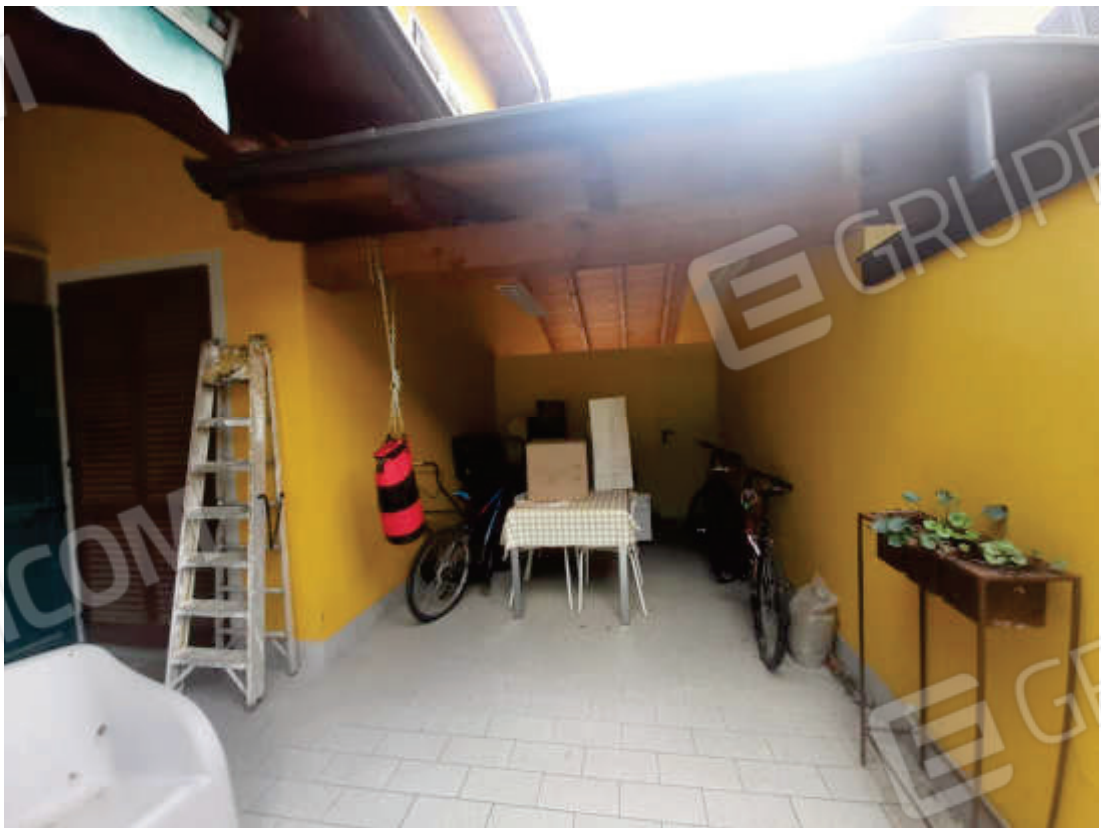
Vista esterna porticato pertinenziale