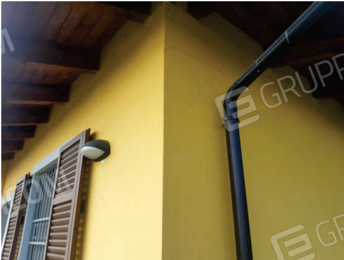
Vista particolare ammalloramenti superfici e rifiniture esterne ( muratura perimetrale fabbricato )