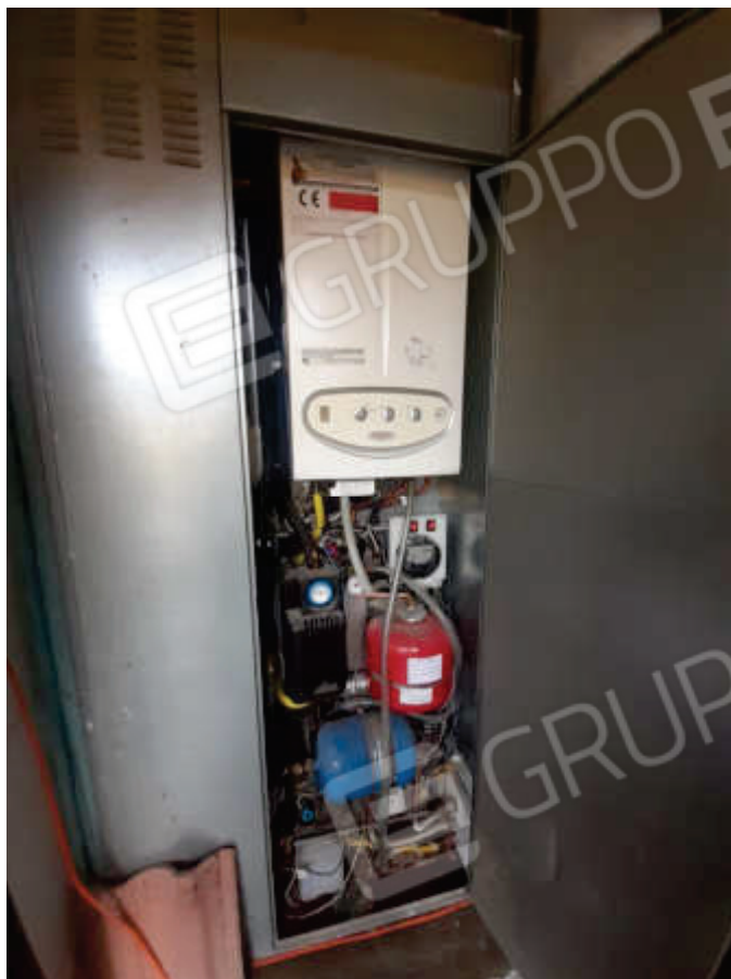
Vista particolare generatore impianto riscaldamento