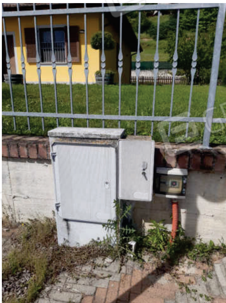
Vista da area esterna comune al complesso immobiliare, della recinzione fronte strada, armadietti contatori utenze e dell'accesso pedonale esclusivo del fabbricato