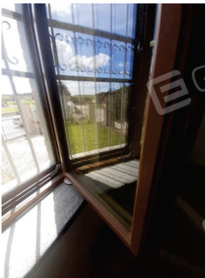
Vista particolare tipologia serramenti a servizio dei vani di abitazione