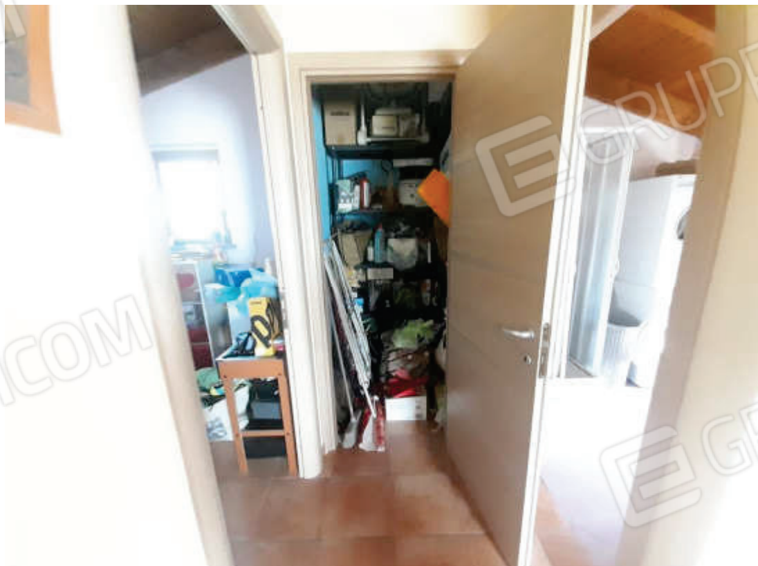
Vista interna area disimpegno piano primo