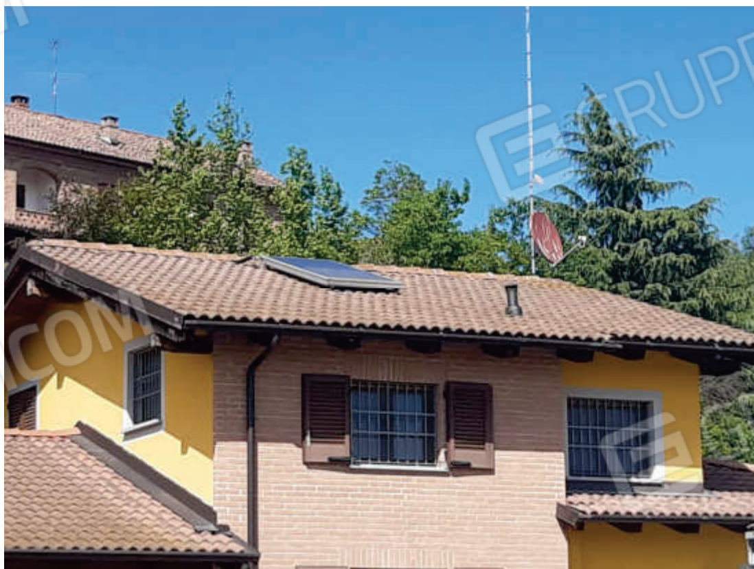
Vista particolare impianto solare termico per ACS