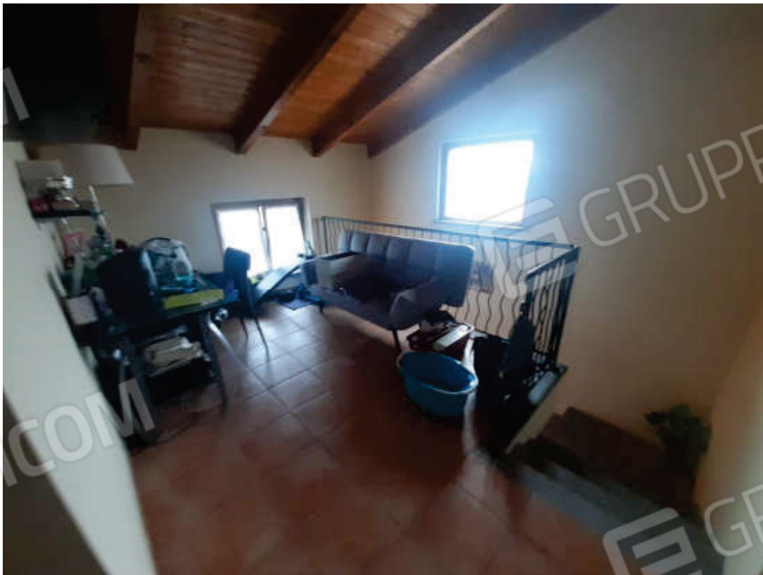
Vista interna scala di accesso piano terra / primo e disimpegno di sbarco piano primo