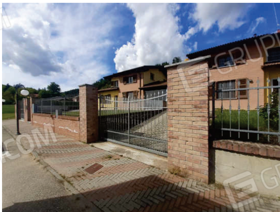
Vista da area esterna comune al complesso immobiliare, della recinzione fronte strada e dell'accesso carraio esclusivo del fabbricato