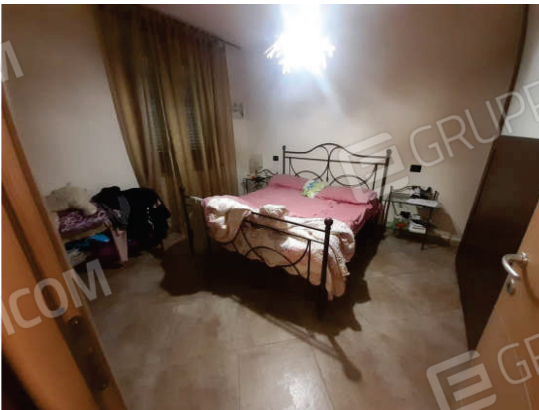
Vista interna camera letto matrimoniale in piano terra