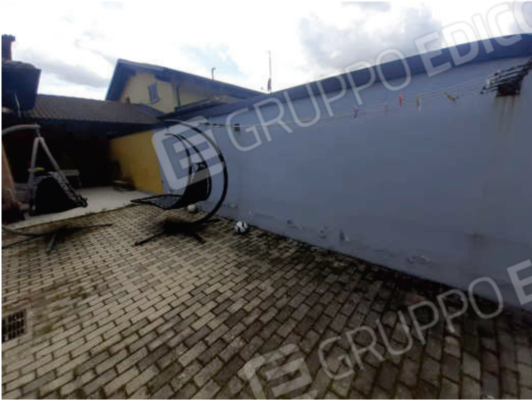
Vista particolare ammaloramenti superfici e rifiniture esterne ( muratura di divisione e cinta area pertinenziale )