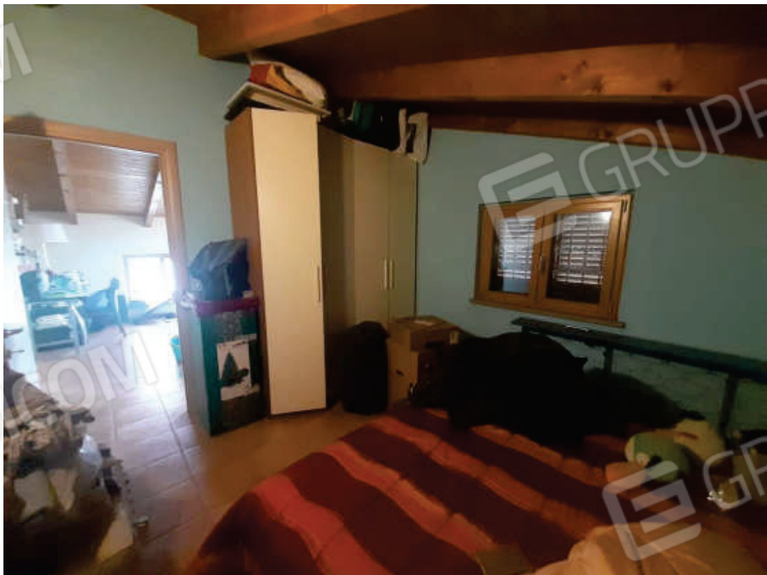
Vista interna locale ripostiglio letto in piano primo