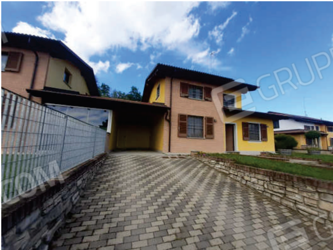
Vista prospetto Sud e risvolto fronte Est fabbricato oggetto di stima