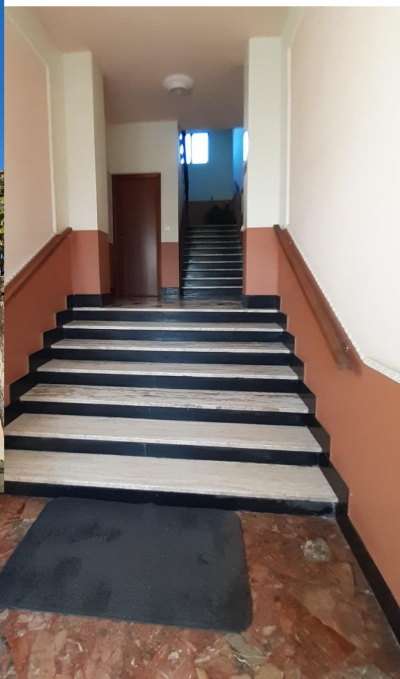
Androne d'ingresso del condominio