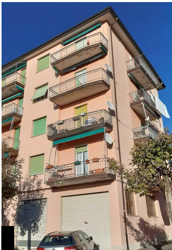
Angolo del fabbricato su cui insiste l'alloggio oggetto di esecuzione al P1