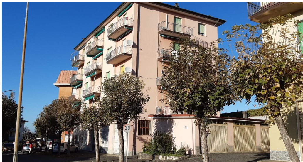
Vista principale del fabbricato