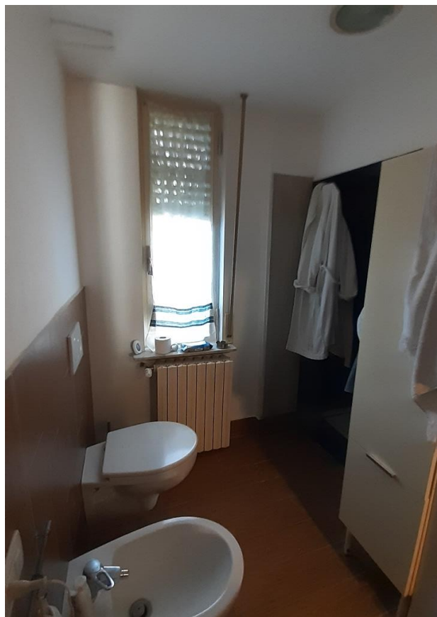
Doccia ricavata sul lato destro