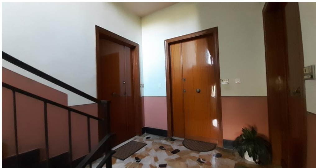
Pianerottolo di sbarco al P1