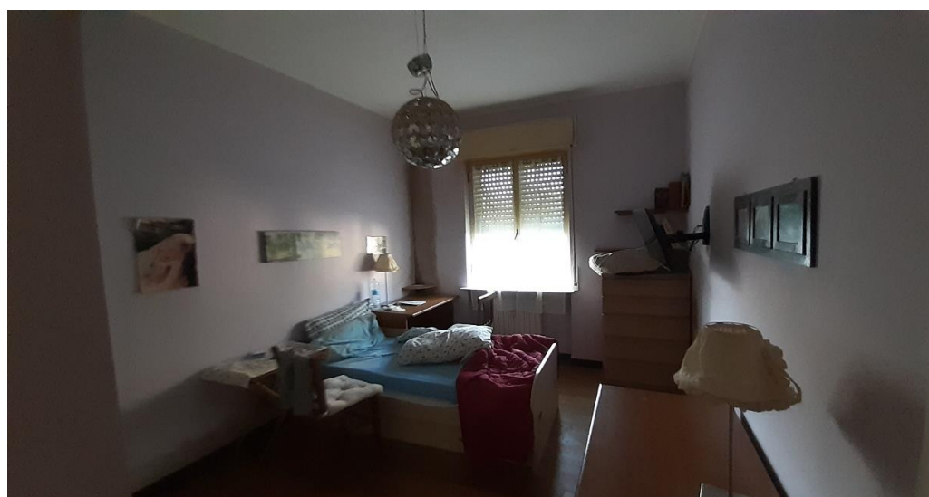
Seconda camera da letto