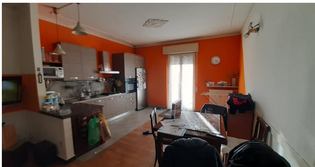
Zona Cucina-Pranzo-soggiorno (attualmente unico locale diversamente da quanto riportato sulle planimetrie catastali)