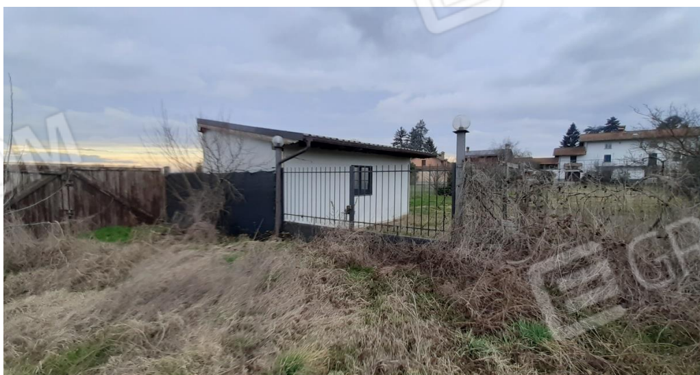
Recinzione sul fondo della particella 373 e vista del fabbricato abusivo

PROCEDURA ESECUTIVA IMMOBILIARE n. 262/2023 R.G.E.