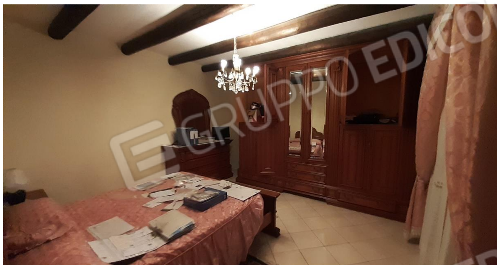
PT - Camera da letto principale