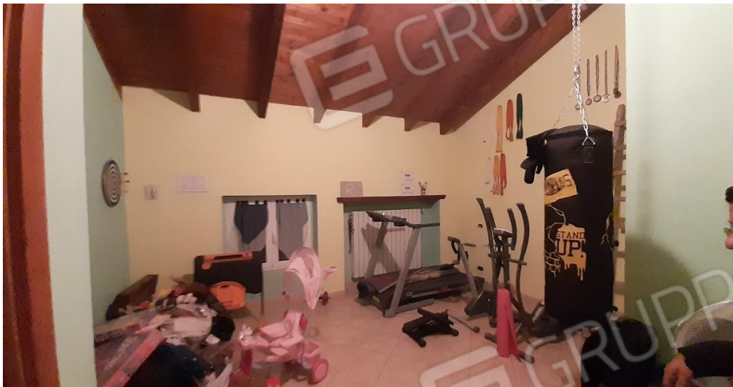
P2 - camera adibita palestra