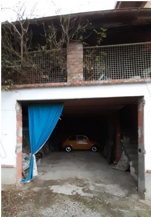
Porzioni adibite a pertinenza sul confine ovest della proprietà