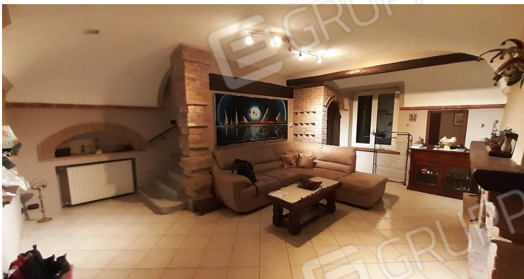
Ambiente del PT - Soggiorno/ingresso Visibile il nuovo vano scala realizzato a due rampe