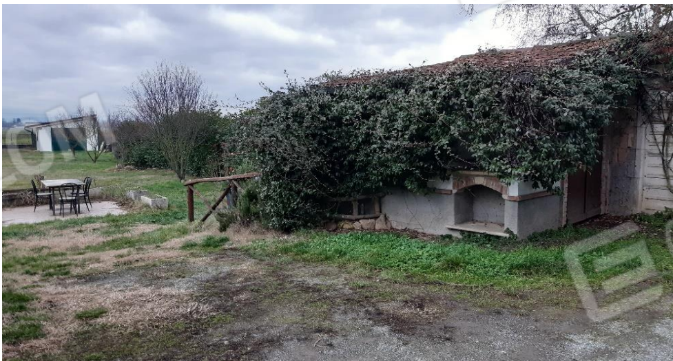
Piccola costruzione non riportata in mappa