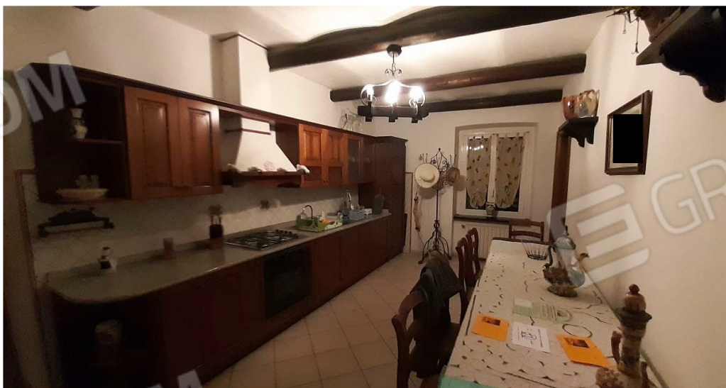
Ambiente del PT - cucina