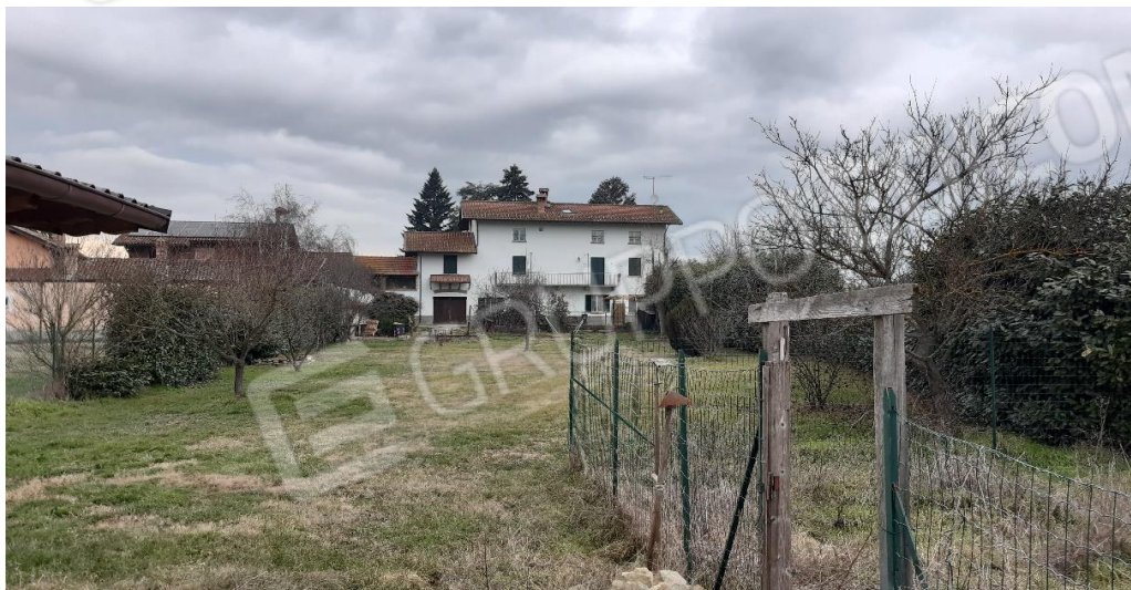
Terreni agricoli di fatto pertinenza della casa - Giardino