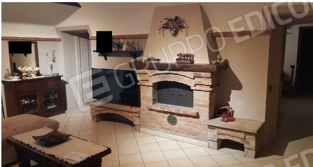
Ambiente del PT - Soggiorno/ingresso