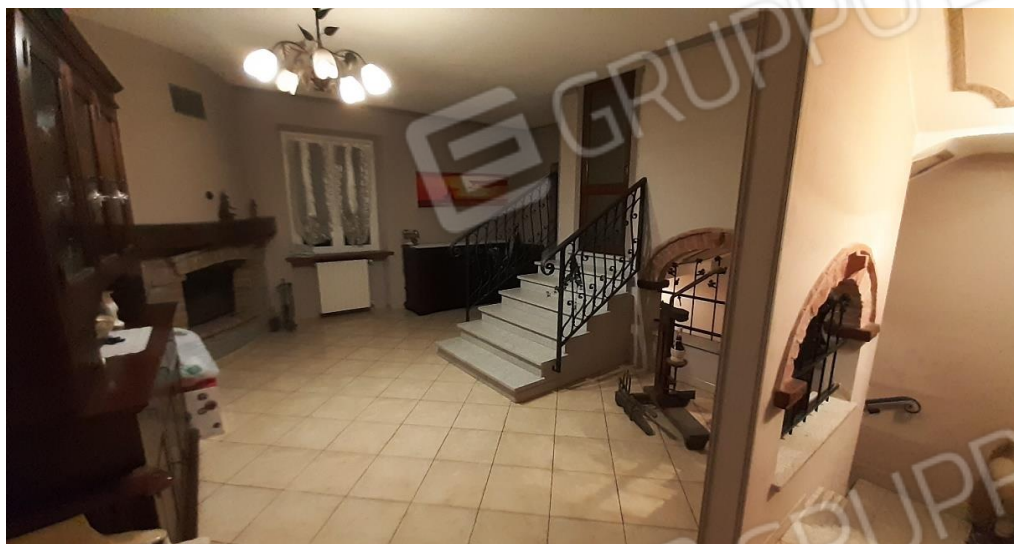
P1 - zona arrivo vano scala