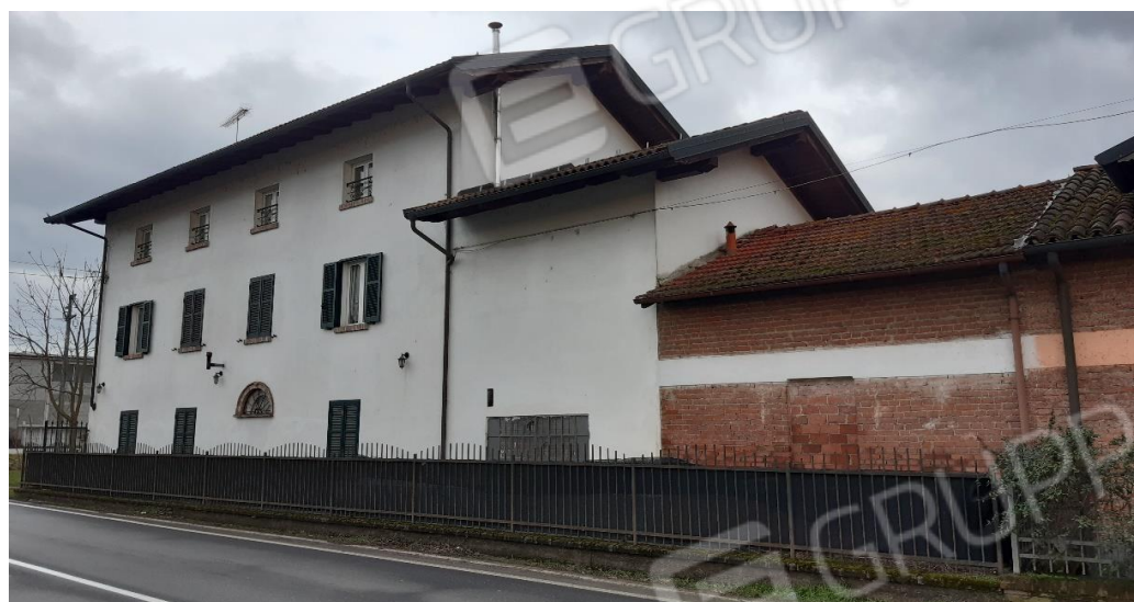
Vista generale dalla provinciale 155