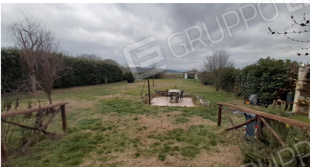
Vista del giardino dal cortile dell'abitazione