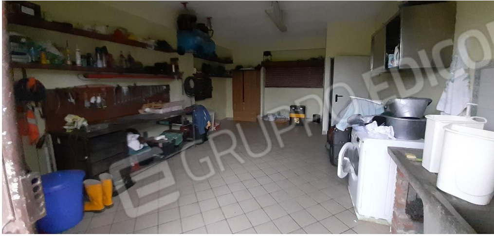
PT - vano destinato a box