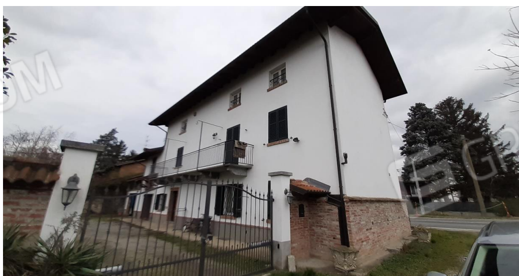
Vista generale dal cancello di ingresso sulla stradina di arrivo