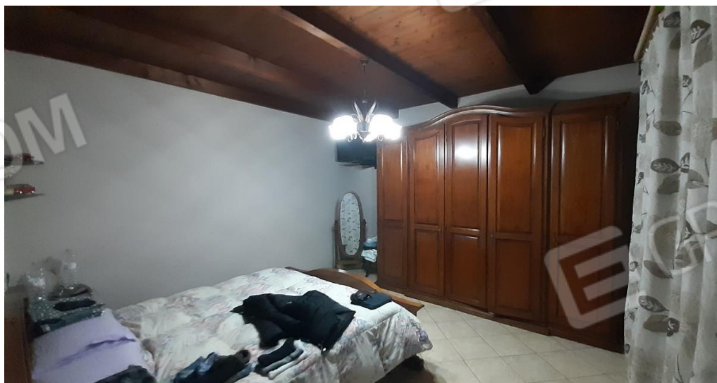
P1 - camera