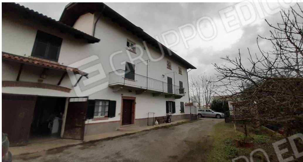
Vista principale del fabbricato