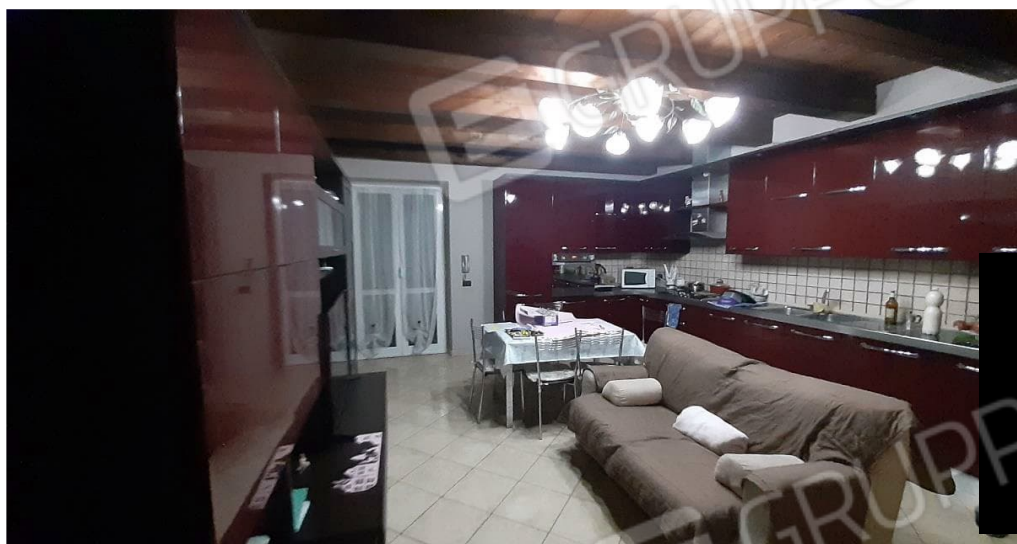
P1 - cucina