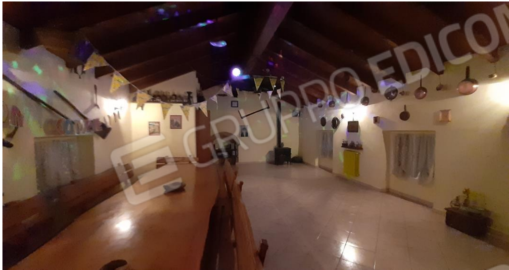
P2 - sottotetto ristrutturato E' visibile sul lato sinistro del fondo il piccolo volume in cui è stato realizzato un bagno