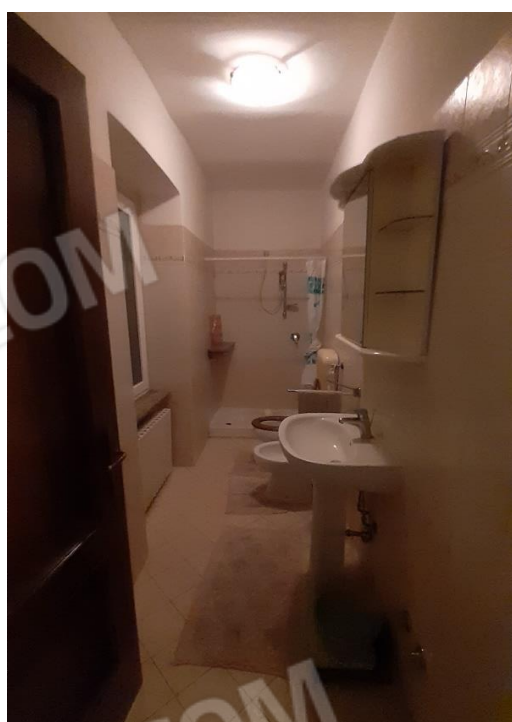
Bagno al PT