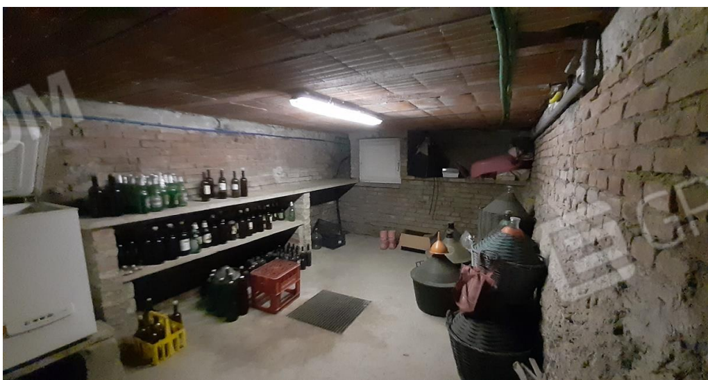
Interrato - cantina