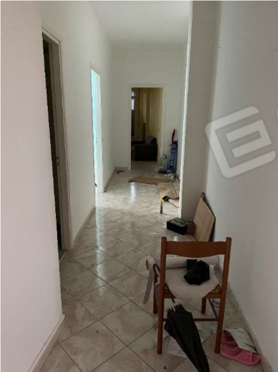
Vista su disimpegno