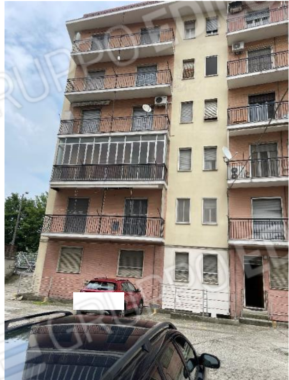
Ingresso e vista su corte