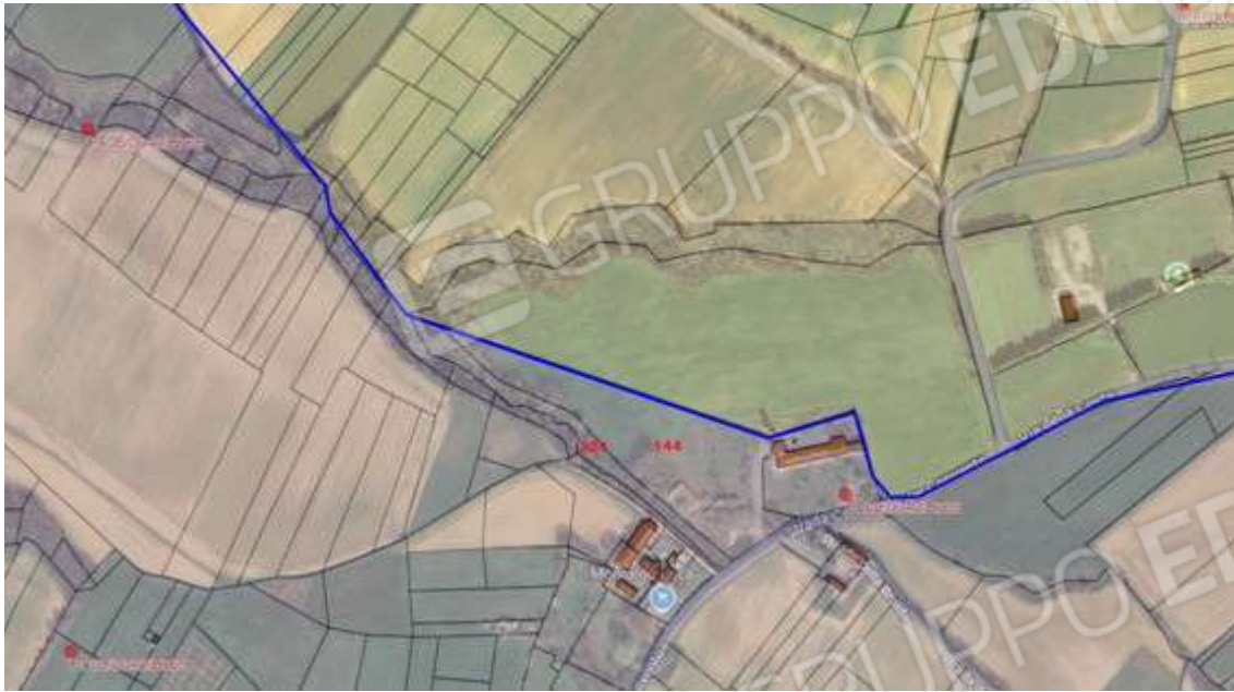
Fotografia I.9 - Carezzano fg 4 part 144-324