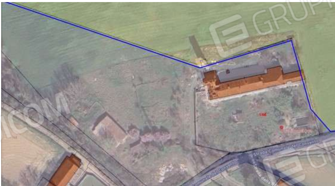
Fotografia I.10 - Carezzano fg part 146