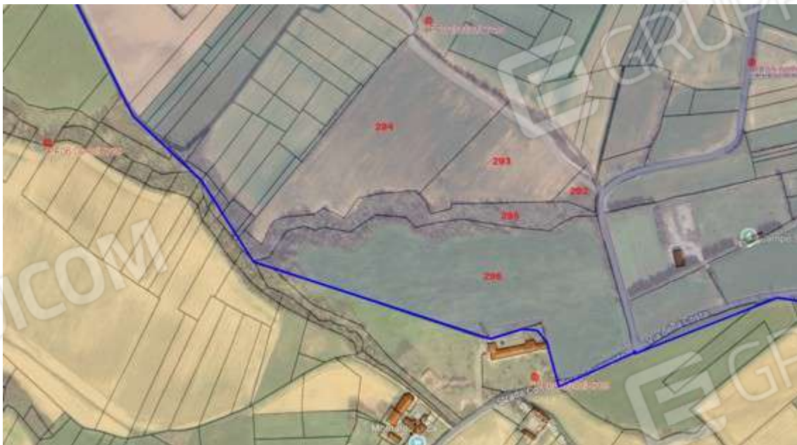
Fotografia I.8 - Paderna fg. 3 part 292-293-294-295-296