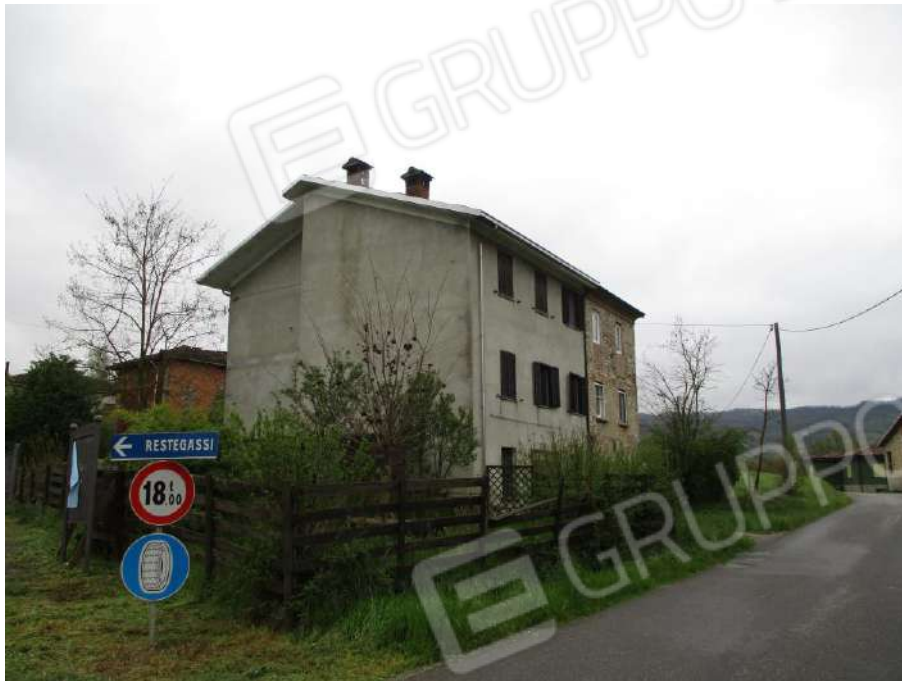
VISTA GENERALE DALLA STRADA SAN SEBASTIANO -DERNICE

LOTTO 1 - MONTACUTO Fraz. RESTEGASSI n.2