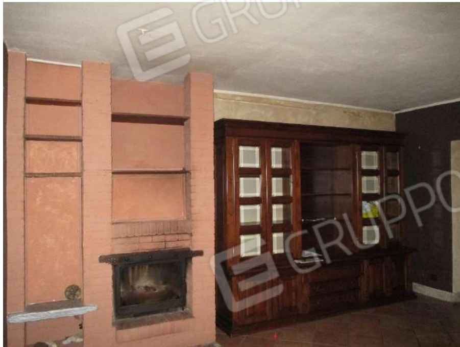
CAMERA AL PIANO PRIMO