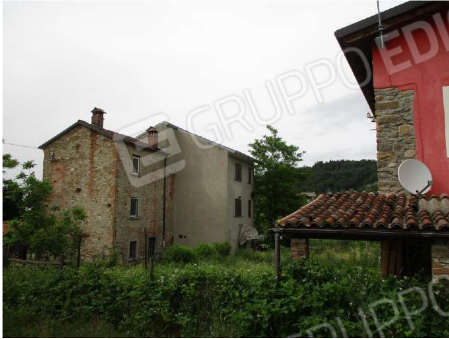
VISTA DEL FABBRICATO RESIDENZIALE E DEL RUSTICO-DEPOSITO