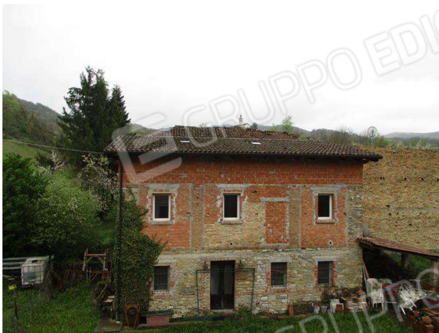
VISTA DALLA CASA DEL FABBRICATO DEPOSITO