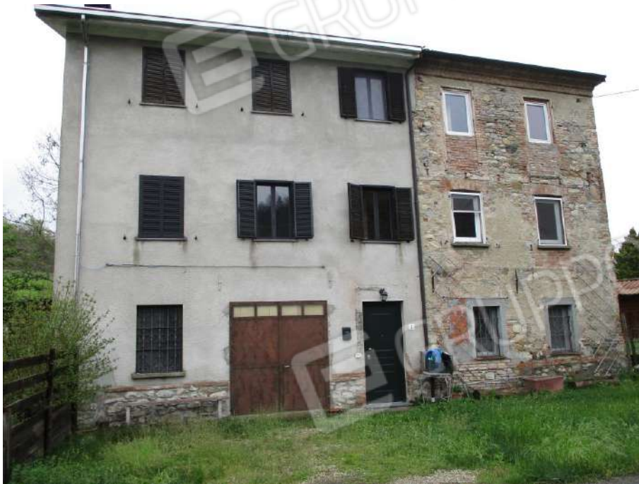
VISTA DEL PROSPETTO PRINCIPALE SU STRADA SAN SEBASTIANO- DERNICE