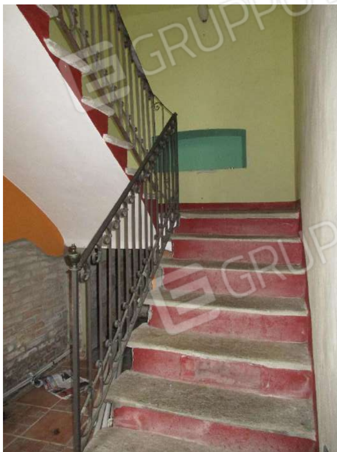
INGRESSO – VANO SCALA

LOTTO 1 - MONTACUTO Fraz. RESTEGASSI n.2 – FABBRICATO RESIDENZIALE