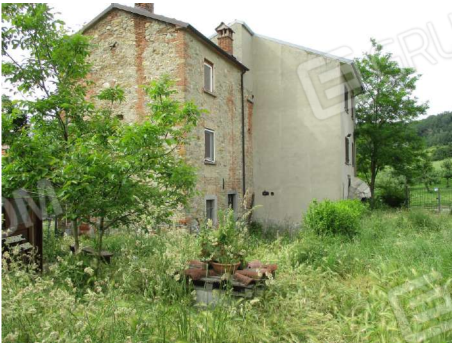
VISTA DAL TERRENO DI PERTINENZA (POZZO)