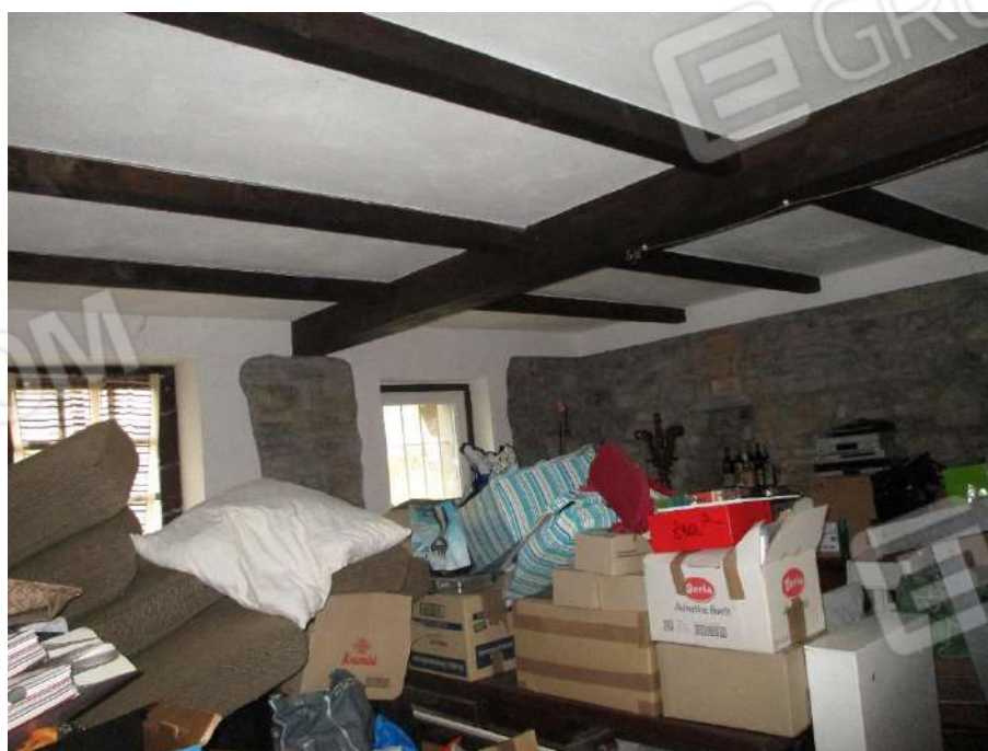
TAVERNA AL PIANO TERRENO