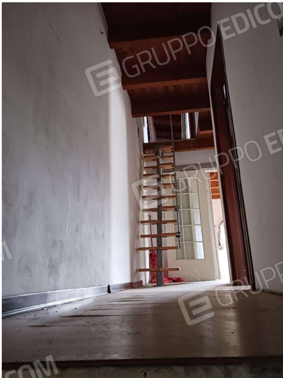
VISTA INTERNA DEL PIANO PRIMO E SOPPALCO LOCALE DEPOSITO