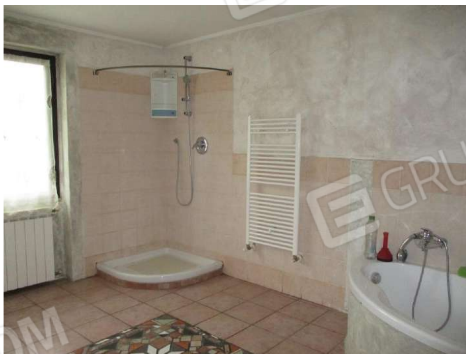
BAGNO AL PIANO SECONDO