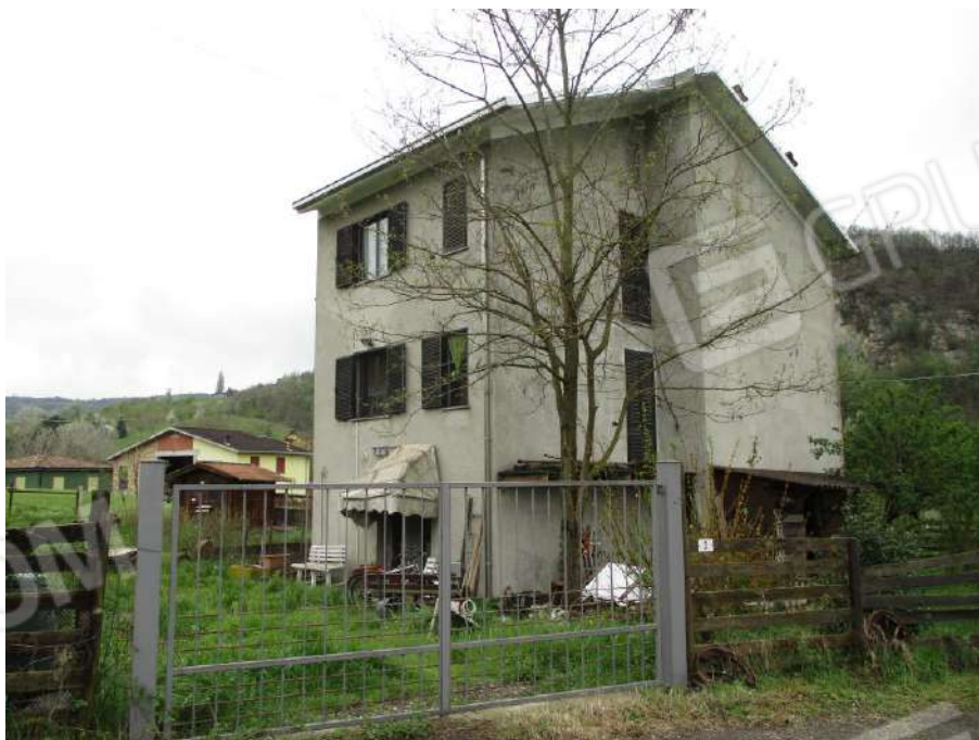
VISTA DELL'ACCESSO CARRAIO