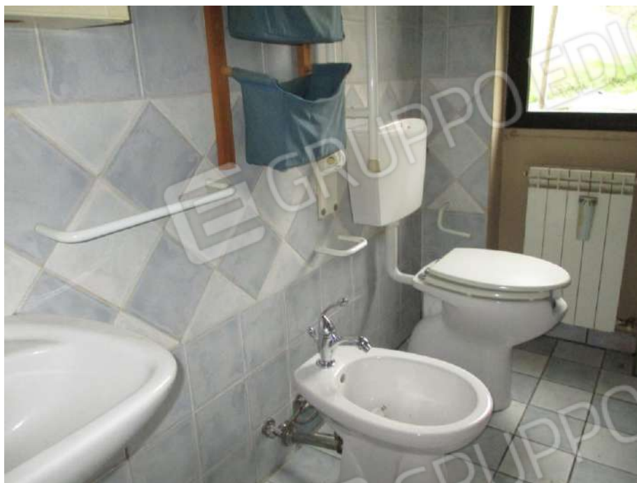
BAGNO AL PIANO PRIMO