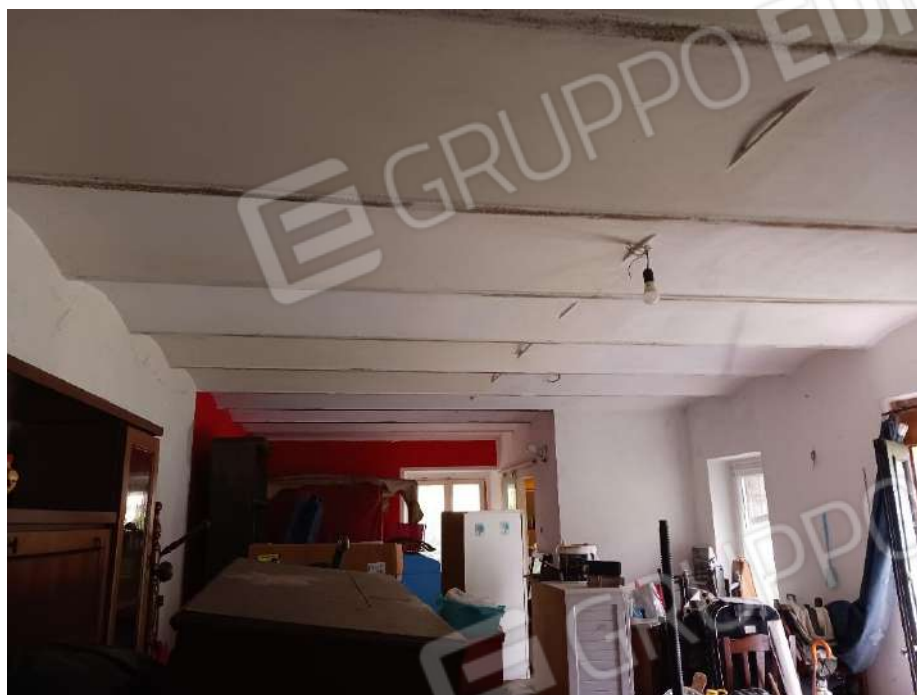
VISTA INTERNA DEL PIANO TERRENO LOCALE DEPOSITO