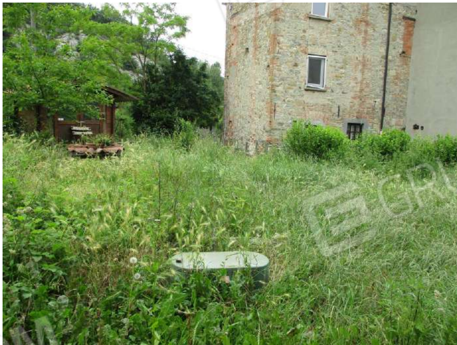
VISTA DEL TERRENO CON SERBATOIO GPL E POZZO