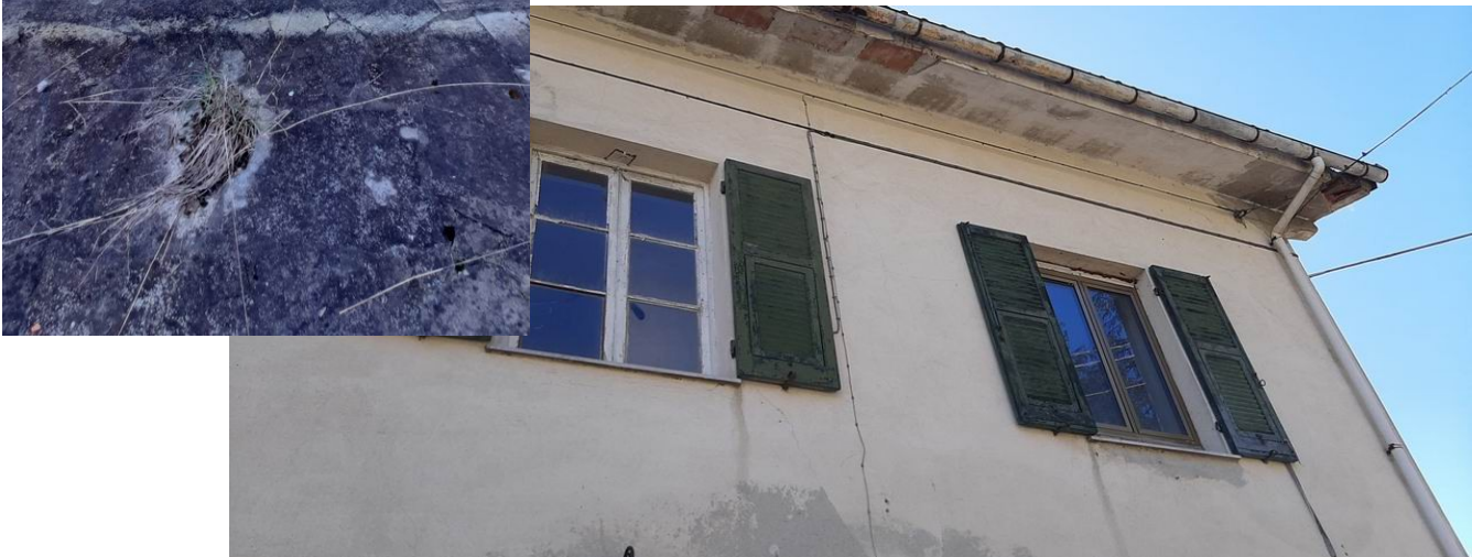
e del cornicione