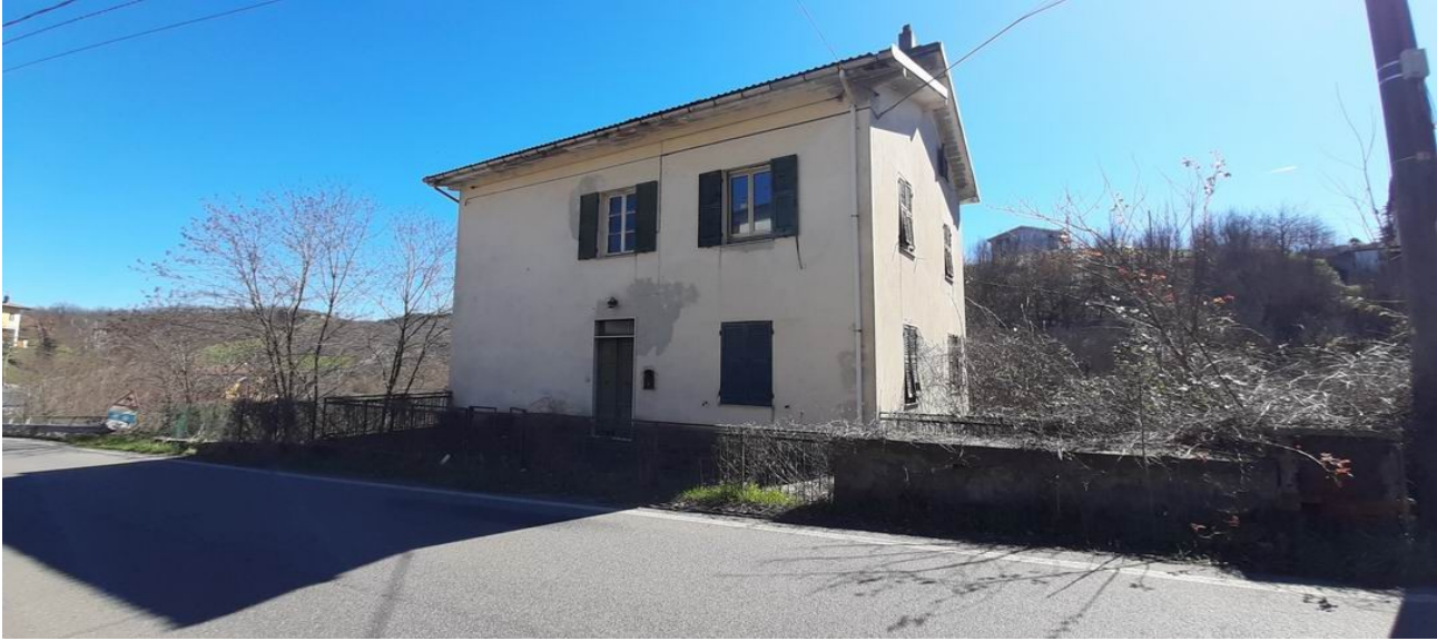
il fronte nord