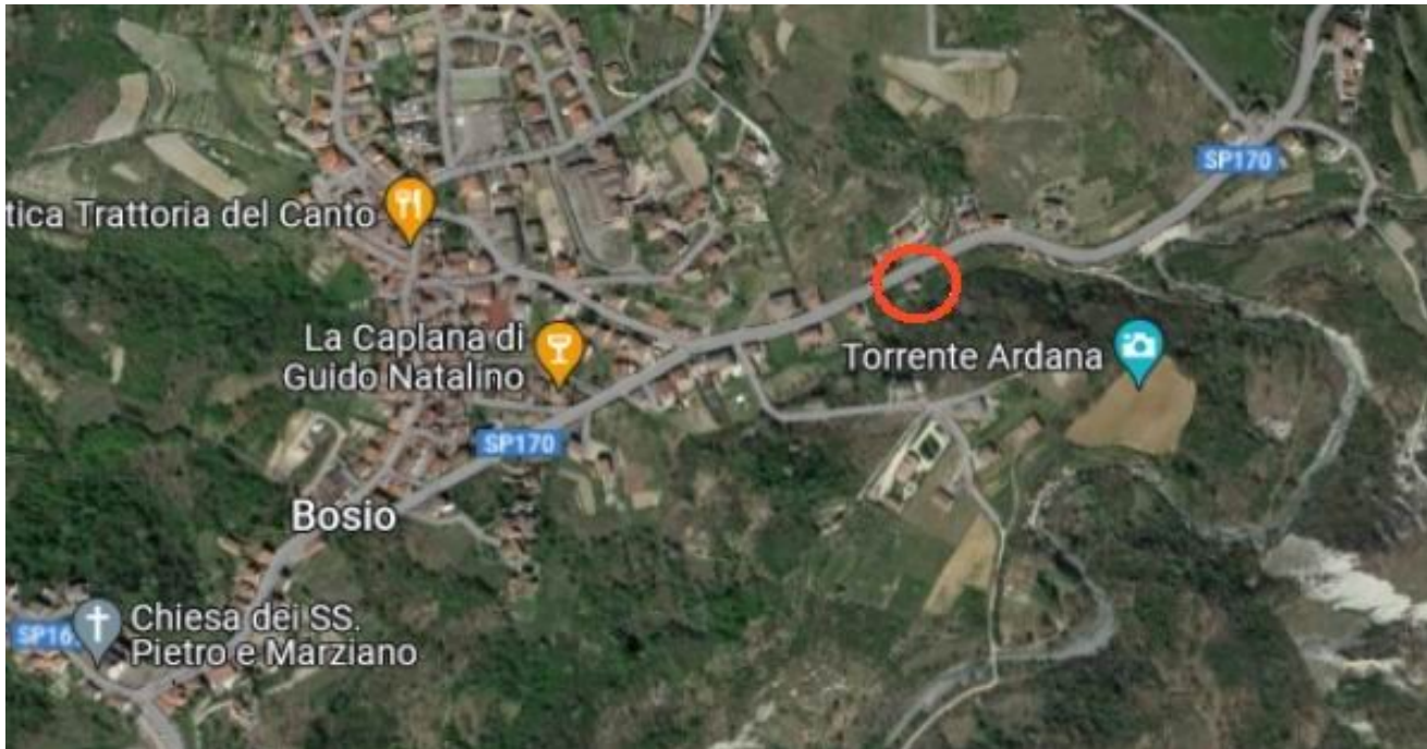
la posizione dell'immobile al limite est dell'abitato di Bosio