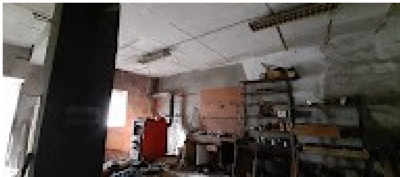
la cantina e la struttura portante il primo solaio