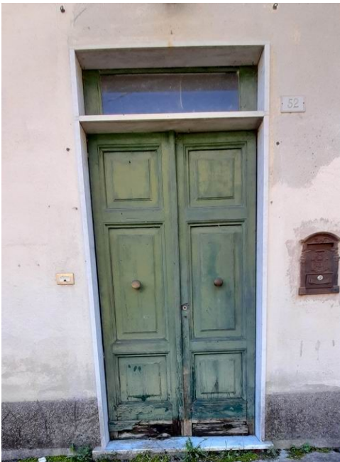
lo stato del portoncino di ingresso, dell'area davanti all'ingresso