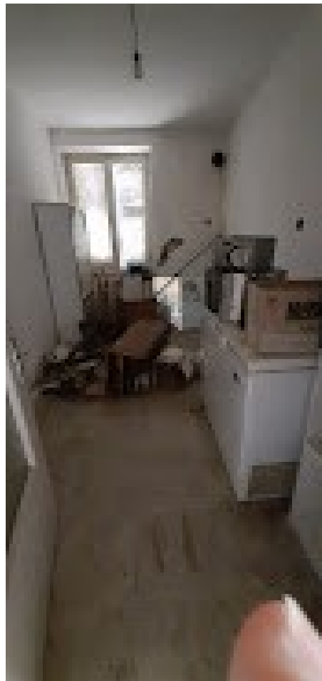
alloggio sub.3 a PT