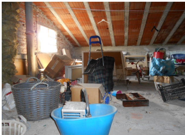
il sottotetto, privo di partizioni, e la struttura della copertura