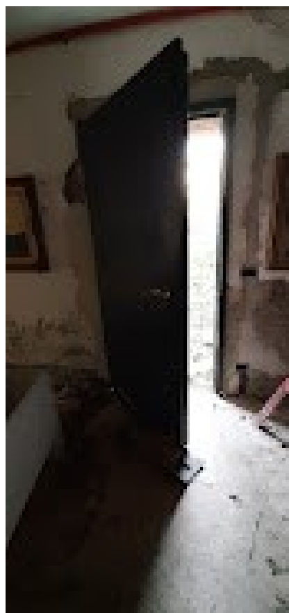
la demolizione del solaio per il collegamento dei due alloggi