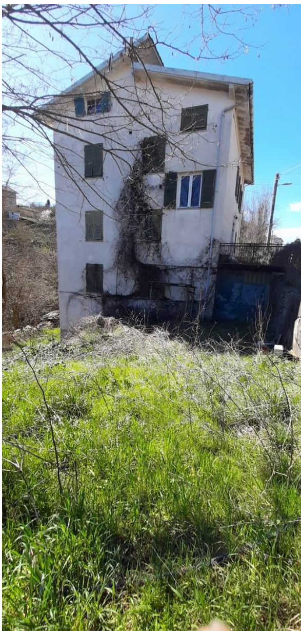
i fronti est e ovest