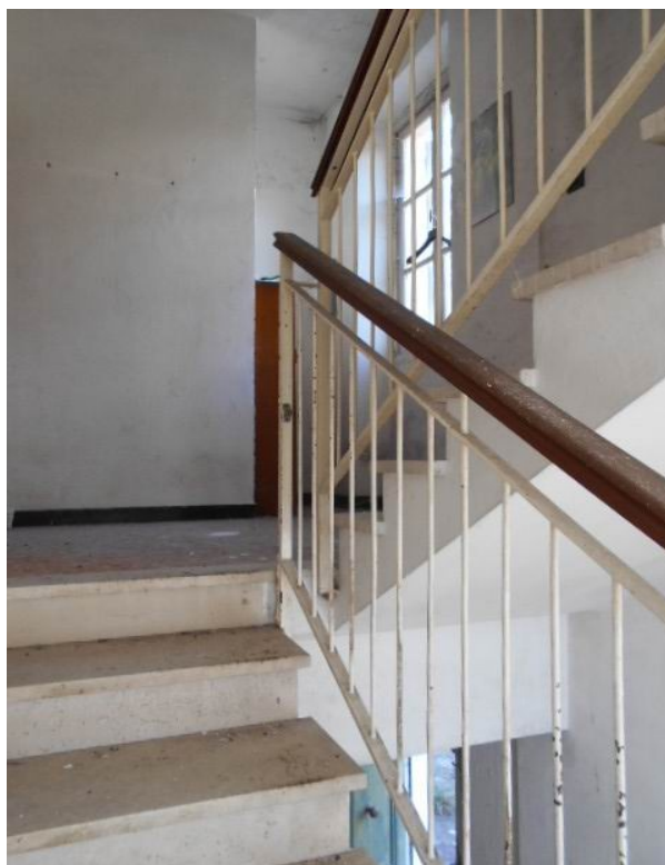
ingresso a piano terra e vano scala condominiale