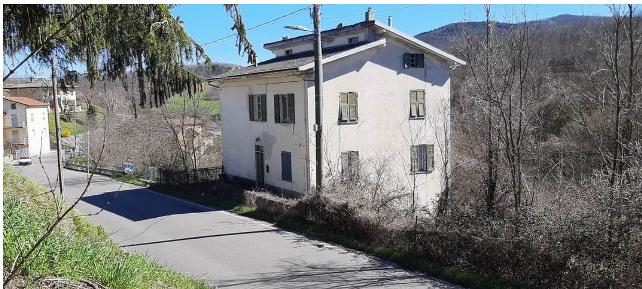
il fronte ovest e quello nord, affacciato alla provinciale per Gavi