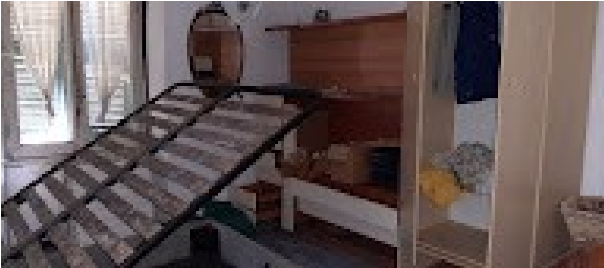
alloggio sub.3 a PT