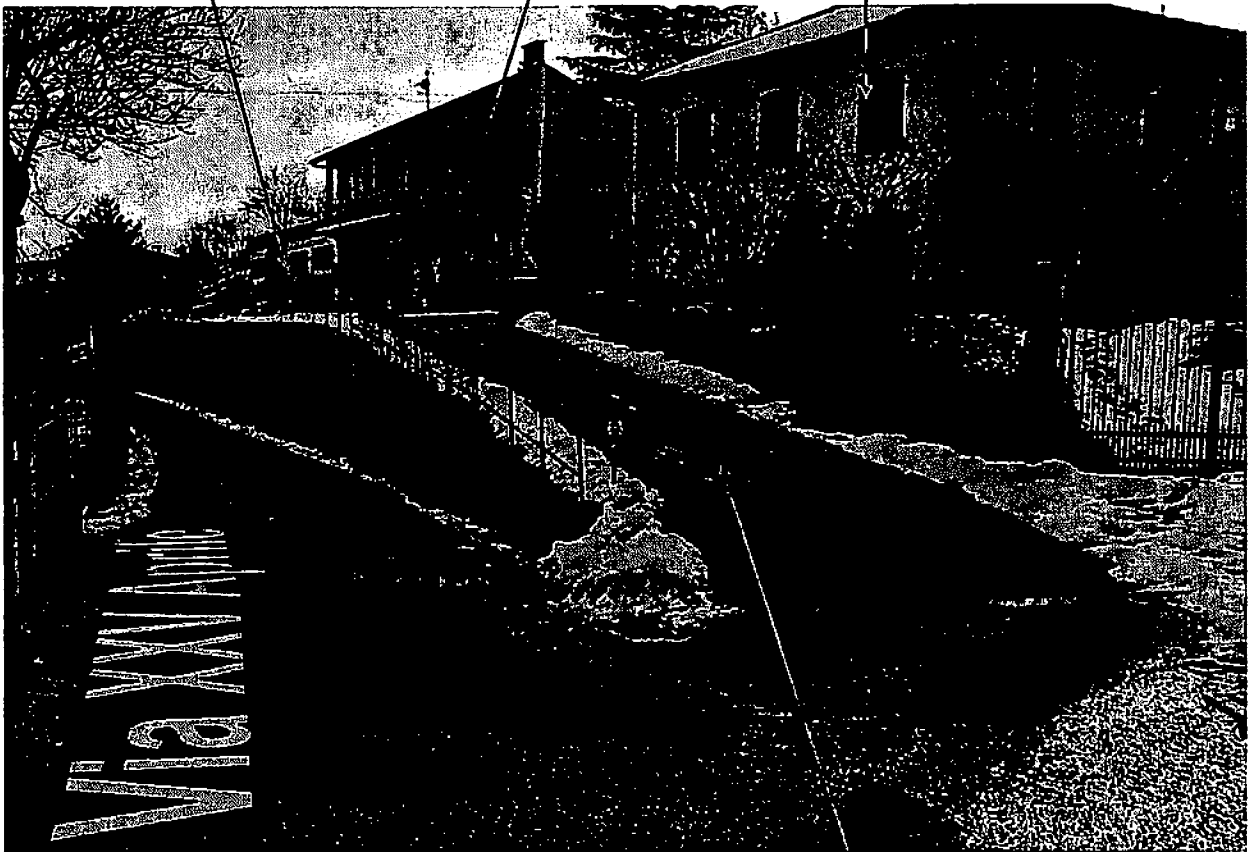
parte del mapp. 333 gravato da servitù di passaggio