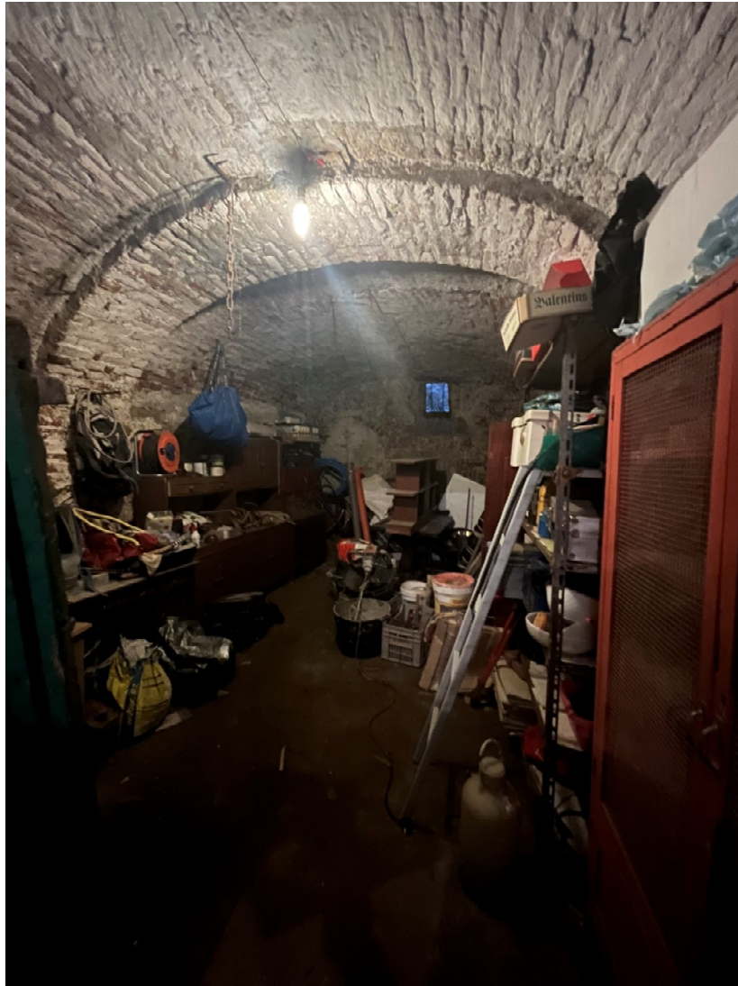
Foglio 23 mappale 92 – 93 – 183