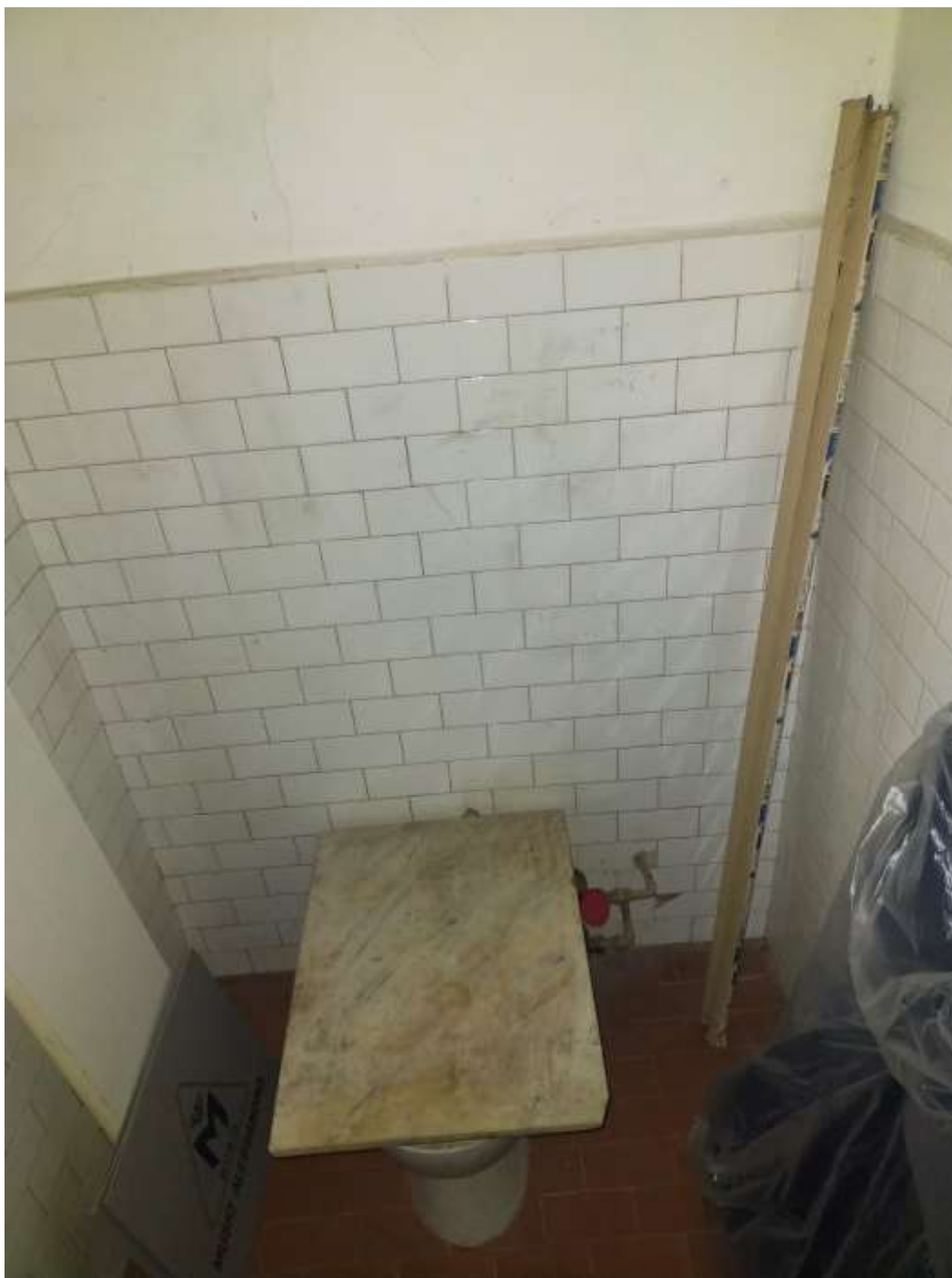
Bagno di servizio su vano scala