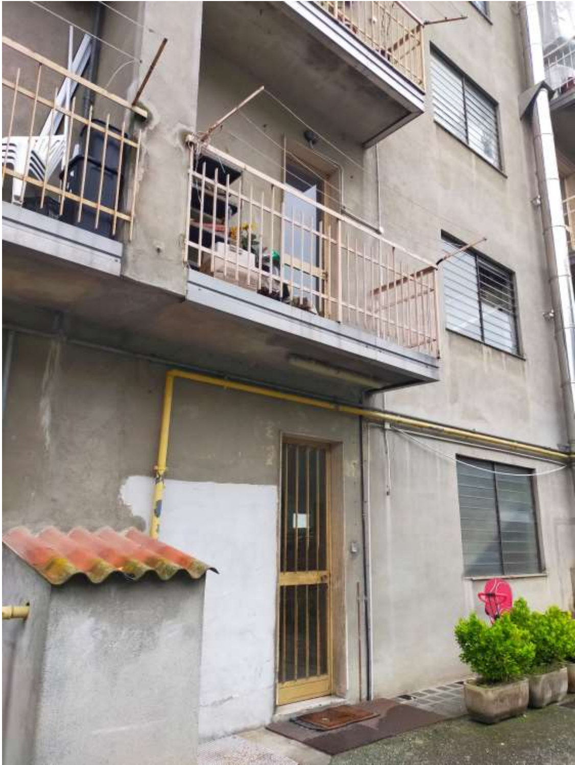
Vista da corte interna (retro)