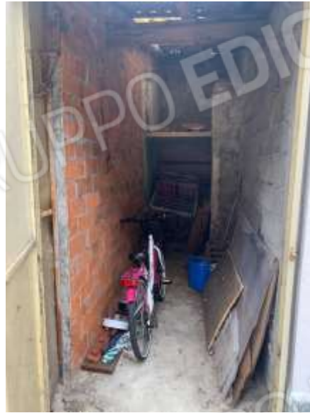
Vista locale deposito