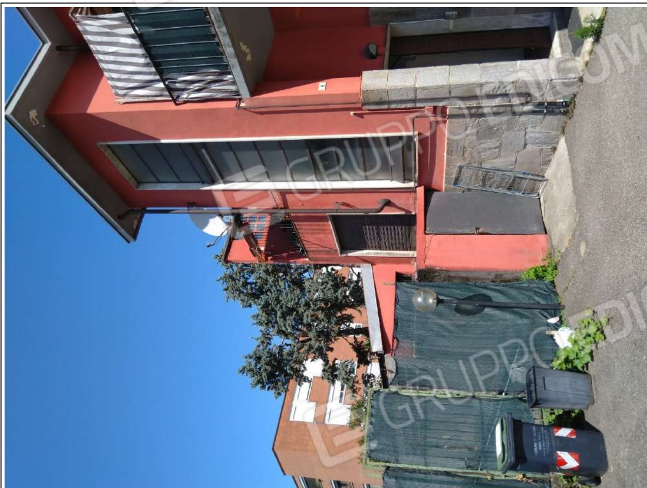
Foto3: vista esterna dalla facciata principale, sud