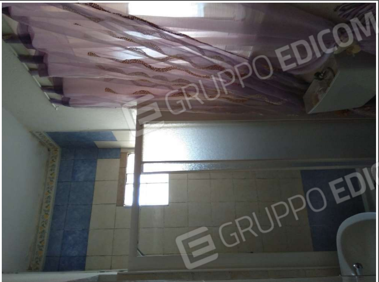
Foto7: vista interna appartamento sub.2 – bagno.