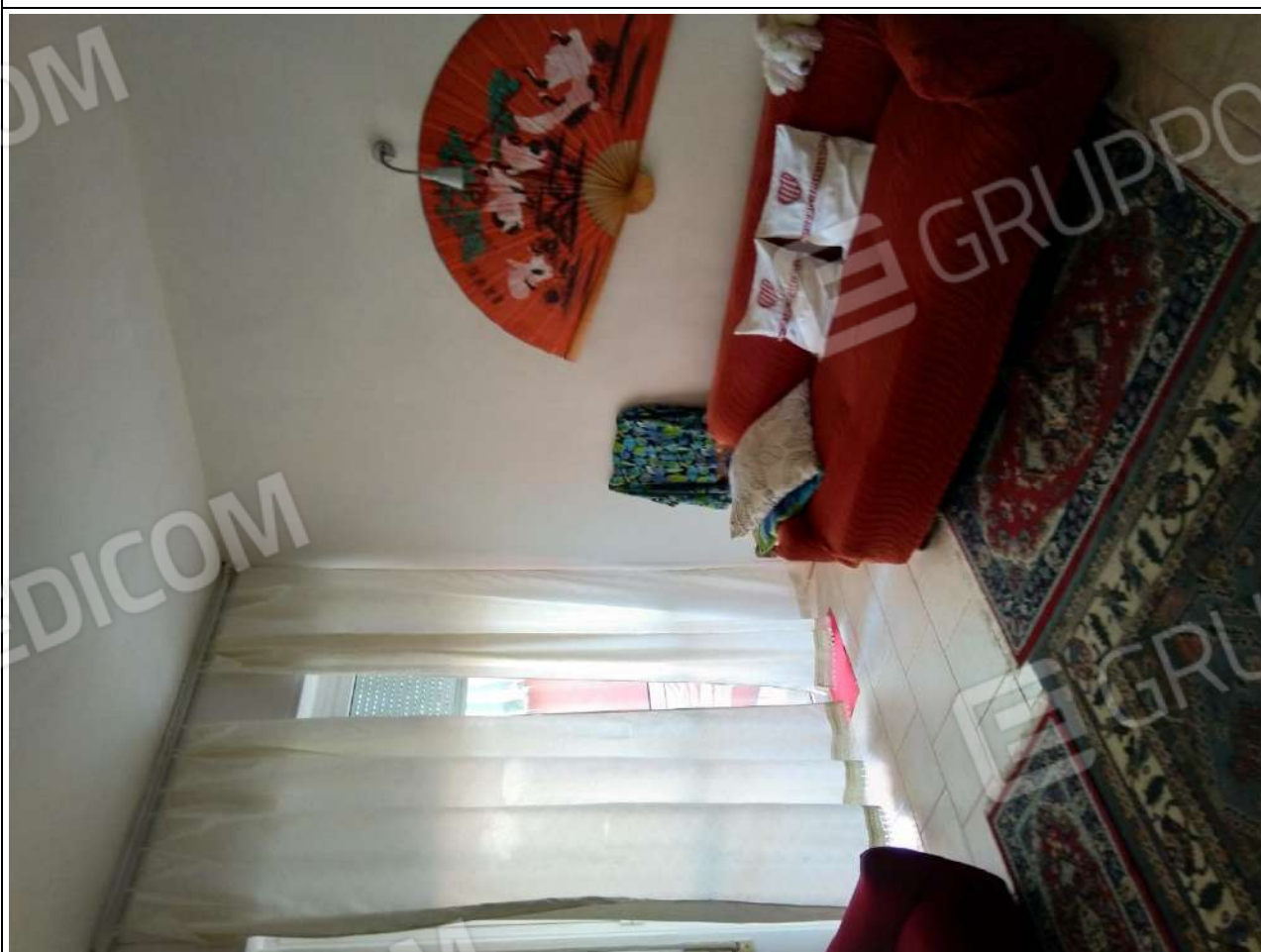
Foto4: vista interna appartamento sub.2 – ingresso soggiorno