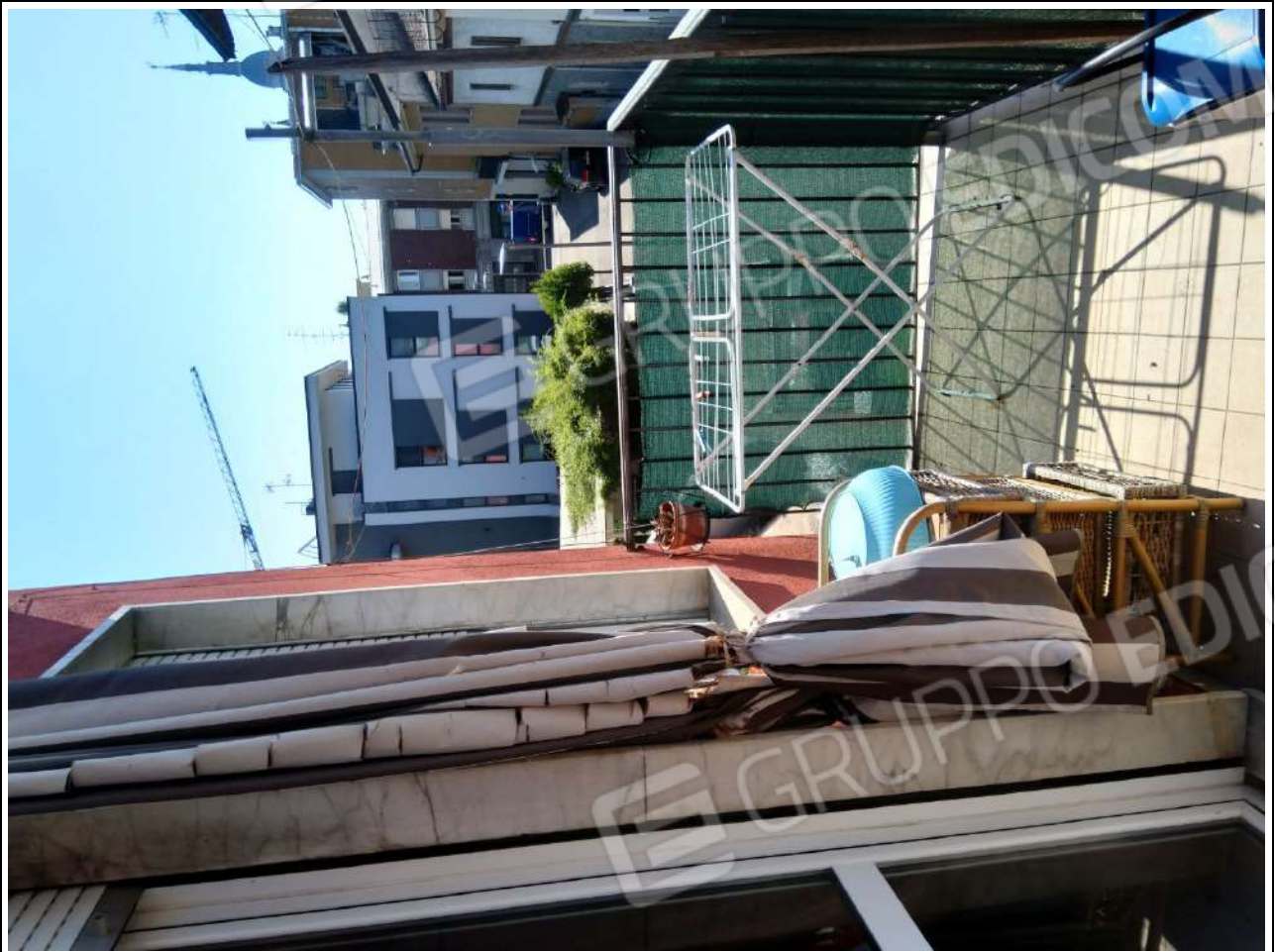
Foto15: appartamento sub.3 – balcone.