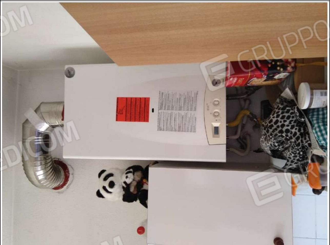
Foto16: appartamento sub.3 – caldaia.