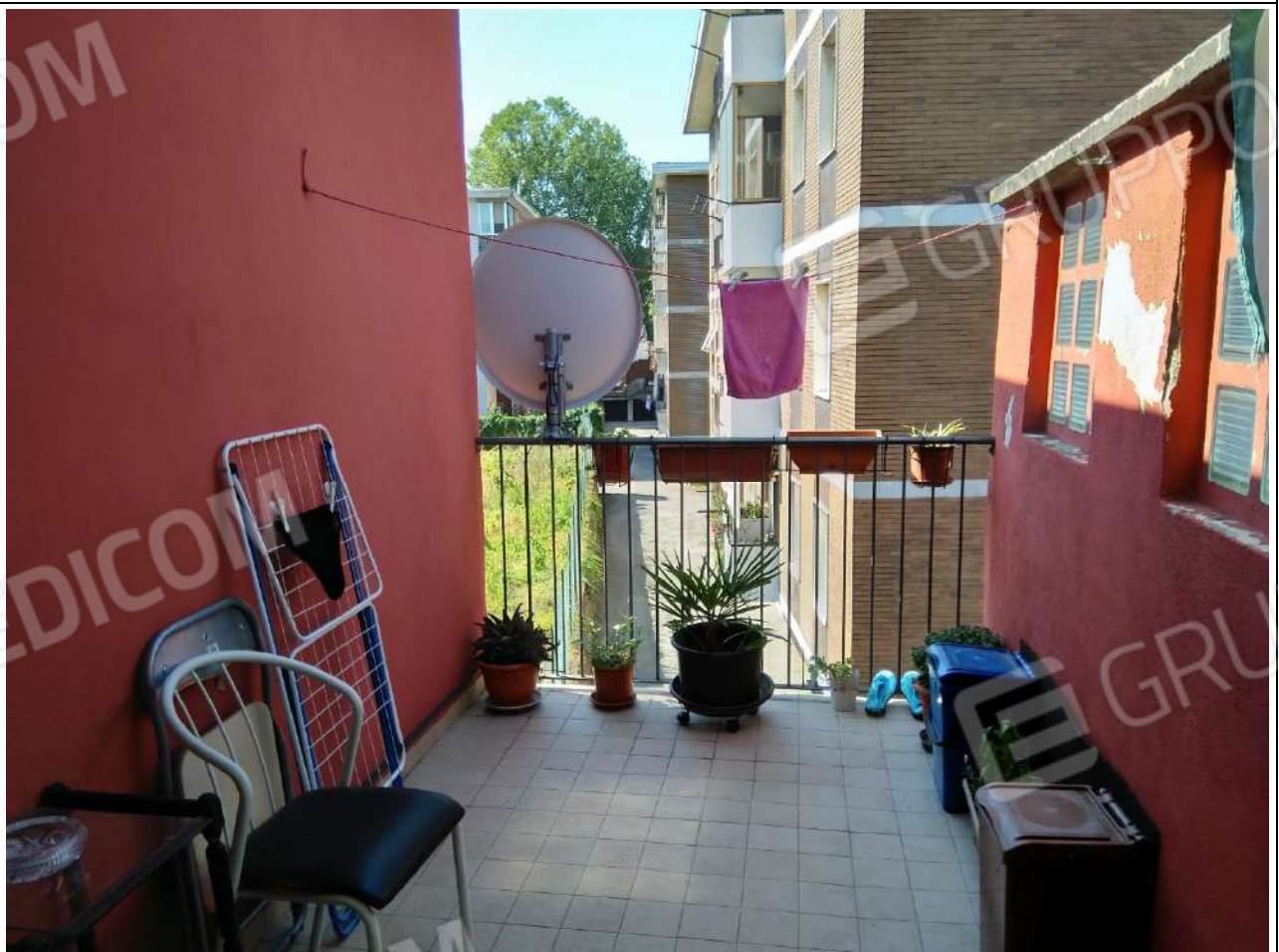
Foto8: appartamento sub.2 – terrazzo.