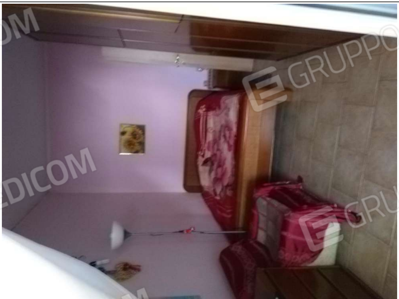
Foto12: vista interna appartamento sub.3 – camera.