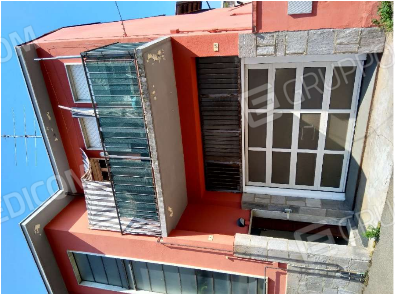
Foto n. 2 vista esterna dalla pubblica viabilità. Via Faraboni 8