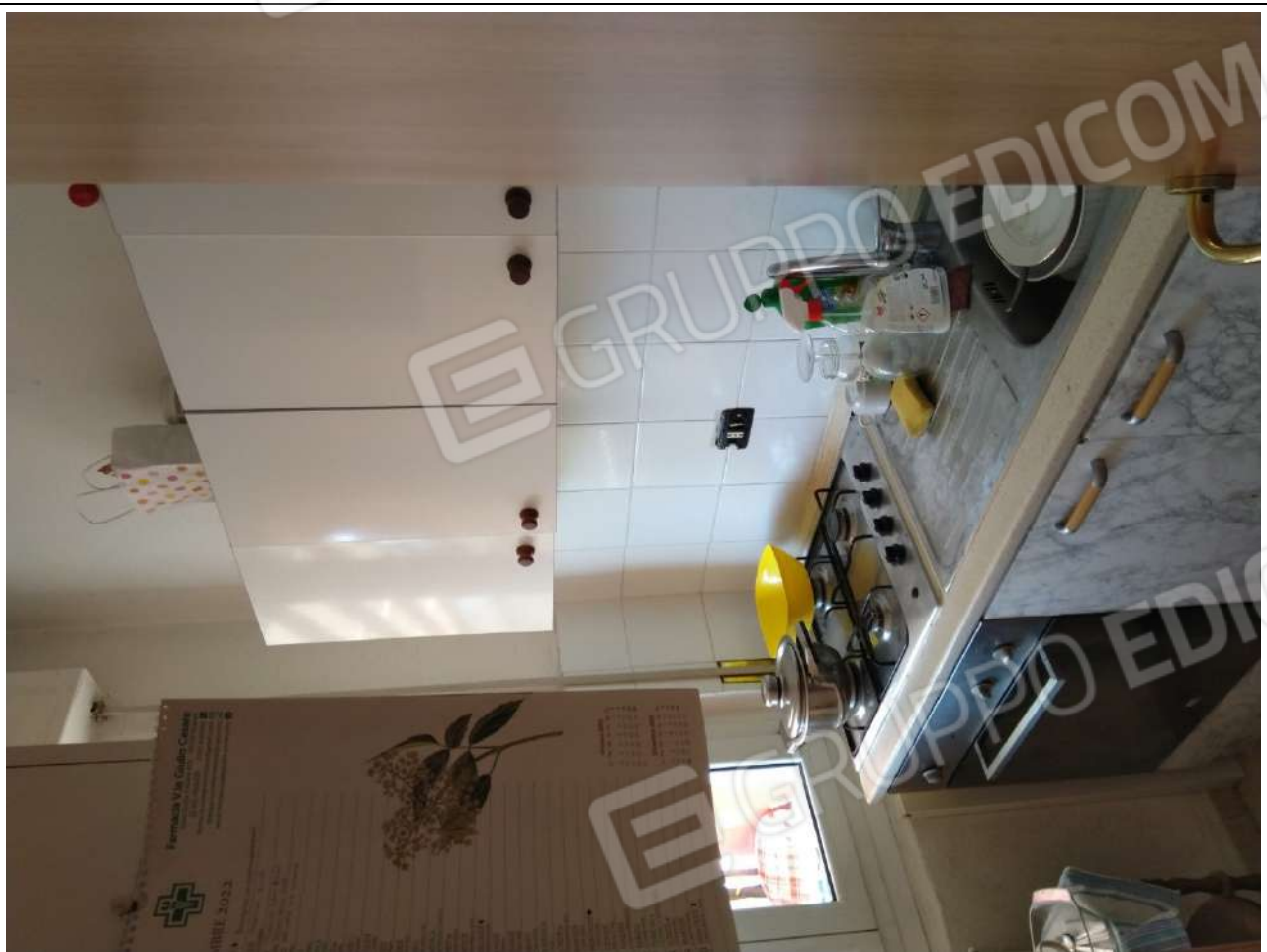
Foto11: vista interna appartamento sub.3 – cucina.