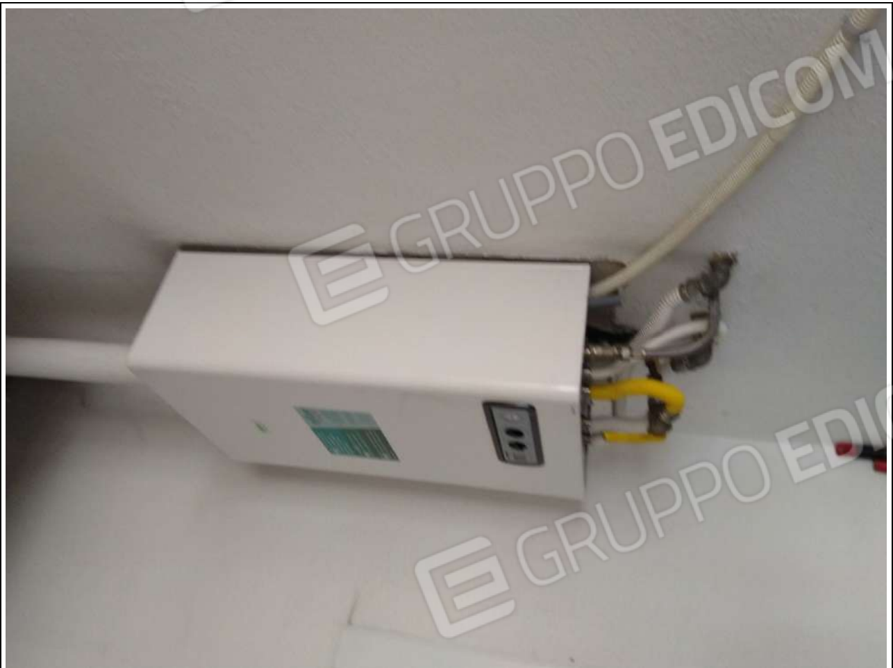
Foto9: appartamento sub.2 – caldaia.