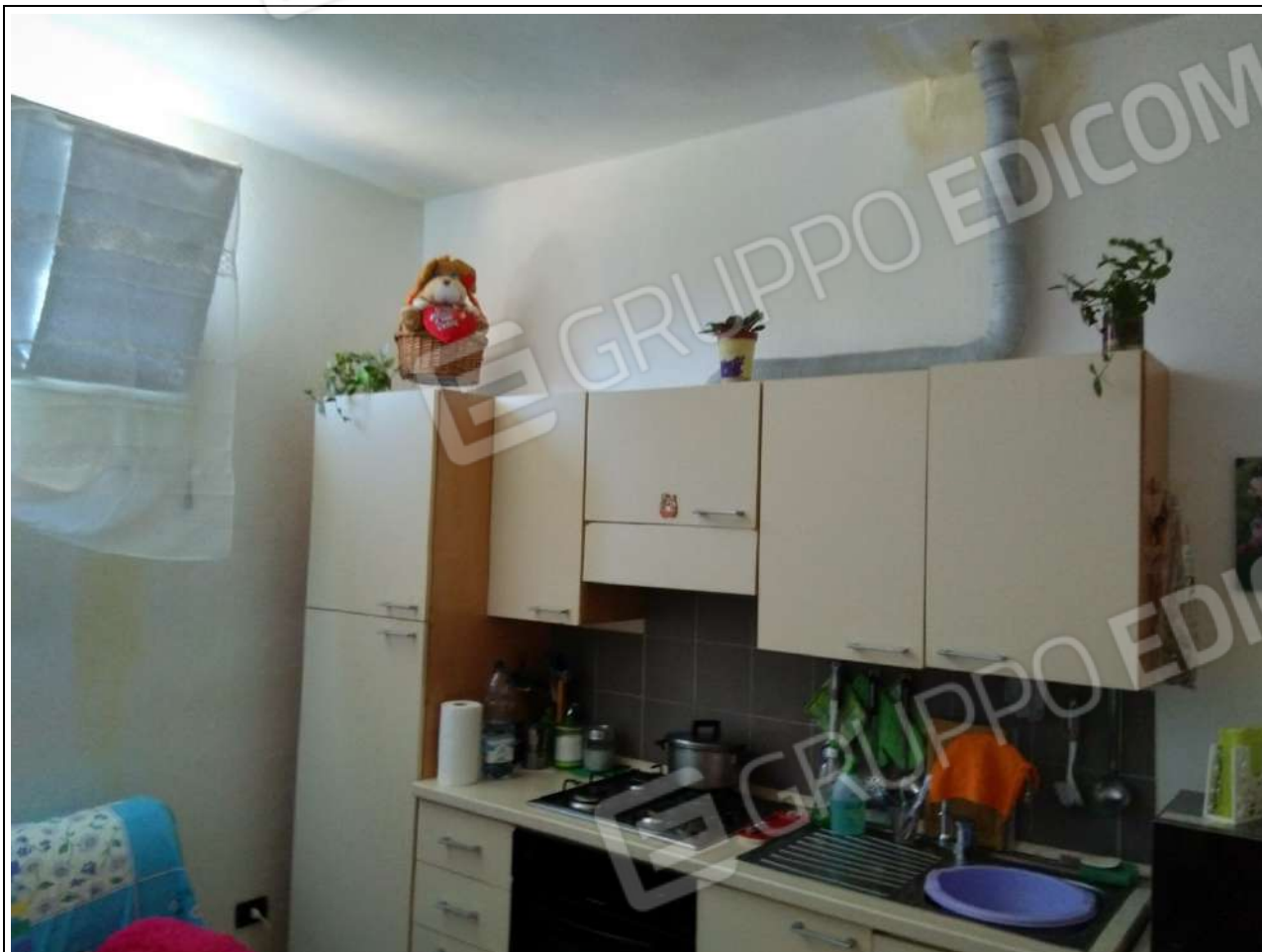
Foto5: vista interna appartamento sub.2 – cucina