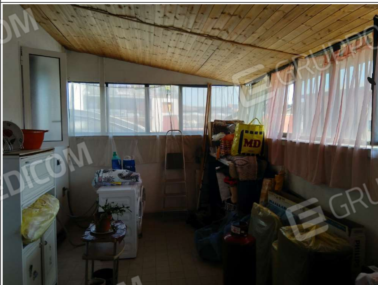
Foto14: vista interna appartamento sub.3 – lavanderia.