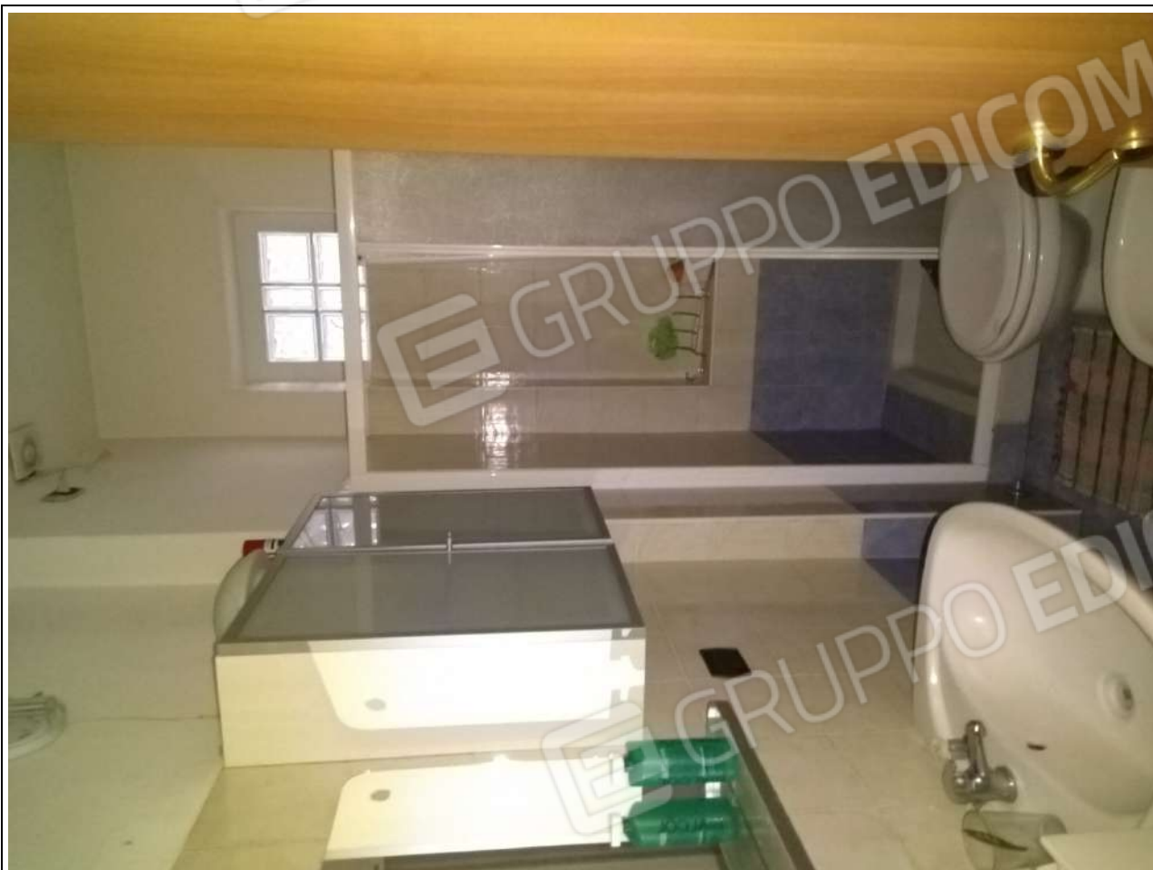
Foto13: vista interna appartamento sub.3 – bagno.