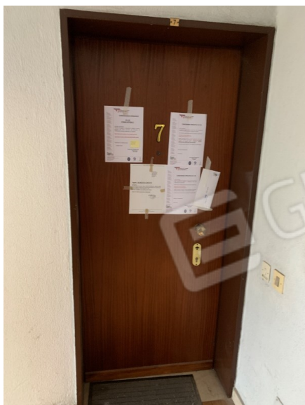
Vista porta ingresso