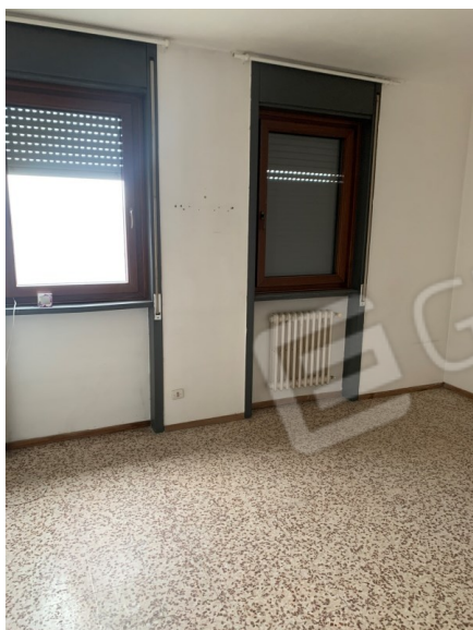
Vista camera 3