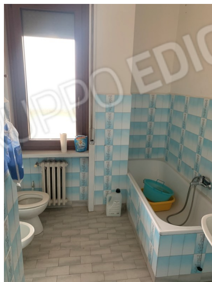
Vista bagno 1