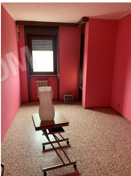
Vista camera 1