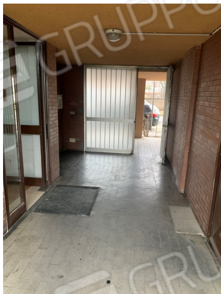
Vista ingresso comune