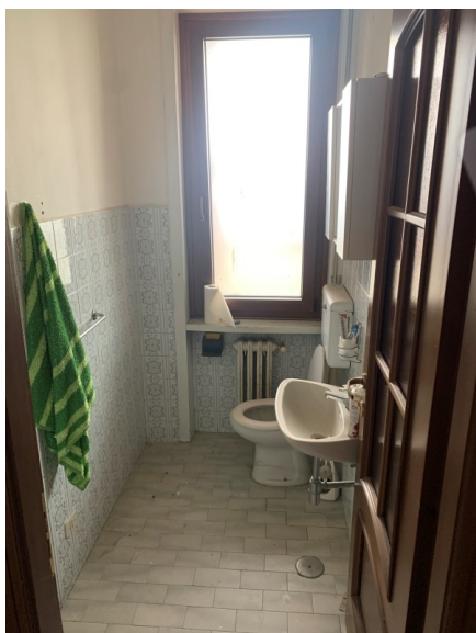
Vista bagno 2