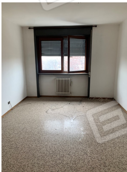
Vista camera 2