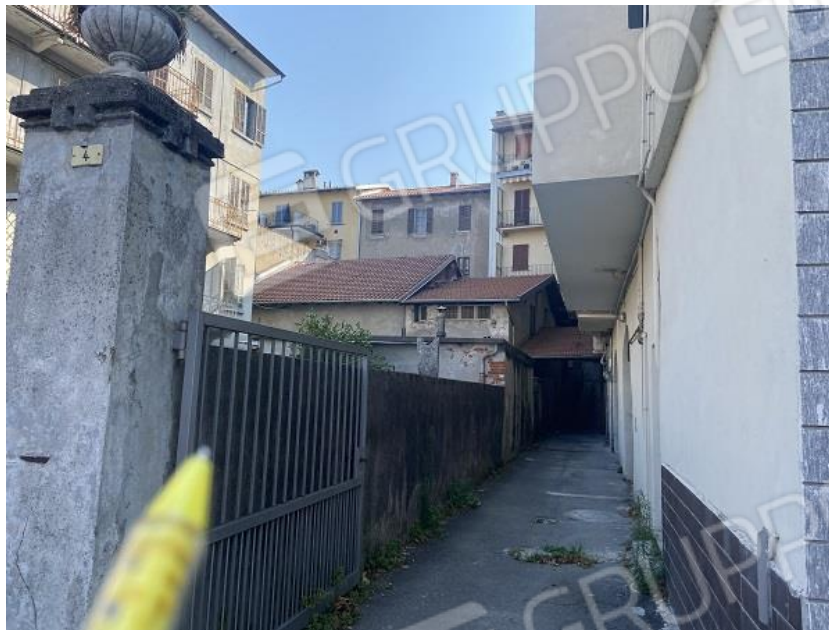
Foto 32: Passaggio retrostante le autorimesse e il cortile di pertinenza sulla sinistra.