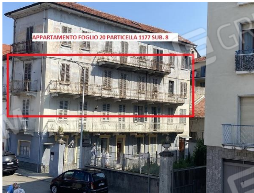
Foto 1: Prospetto sud/ovest principale sul cortile interno e su via Spianata Fiera n. 6.

N.C.E.U: Abitazione al foglio 20 particella 1177 subalterno 8 e n. 2 autorimesse al foglio 20 particella 965 subalterni 2 e 3.