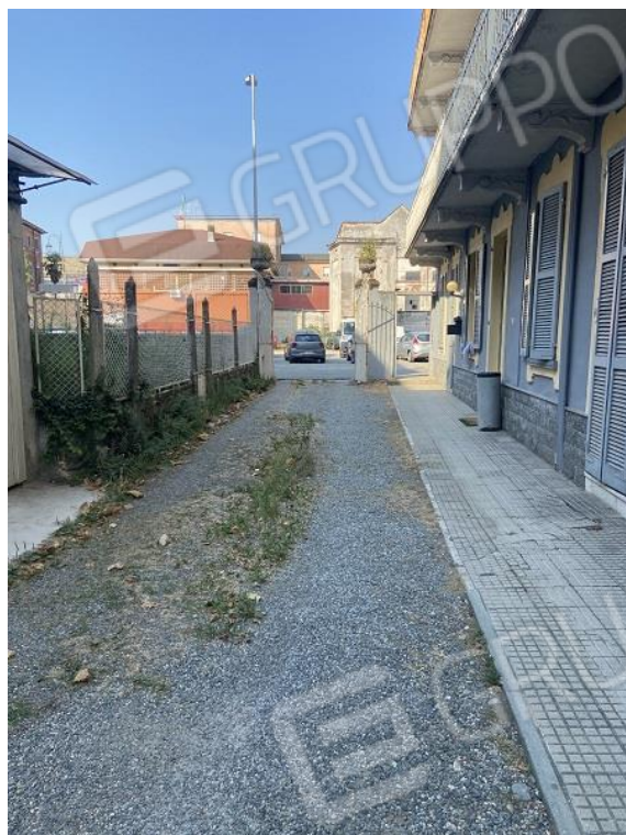
Foto 6: Cortile condominiale di accesso all'edificio ed alle autorimesse.