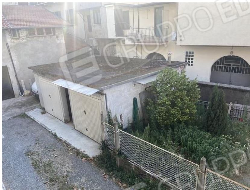
Foto 30: Autorimesse e relativo cortile di pertinenza sulla destra.