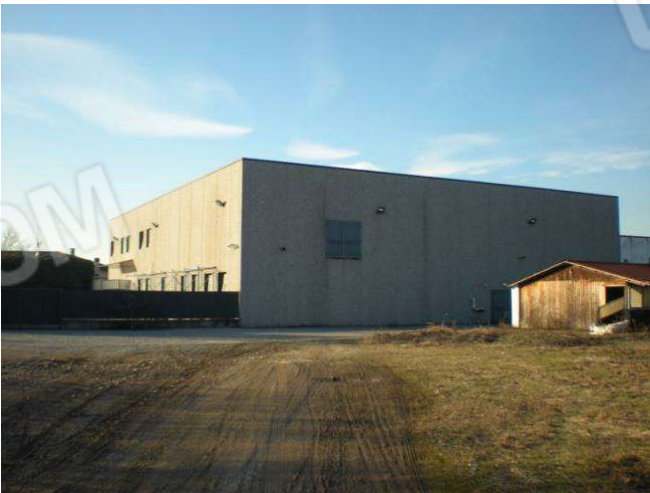
Foto 12 cabina ENEL