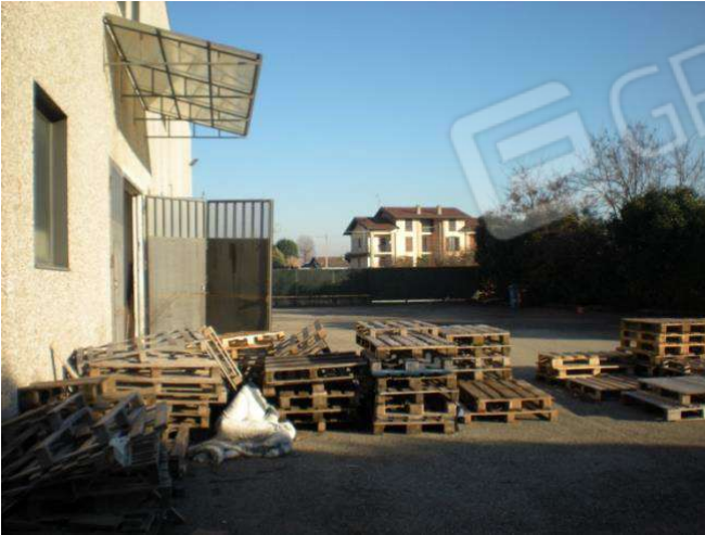
Foto 11 vista complessiva capannone lati est-sud