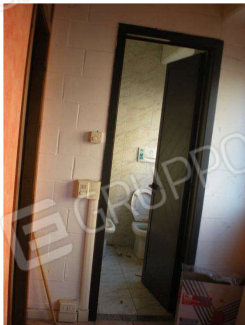
Foto 48 autorimessa