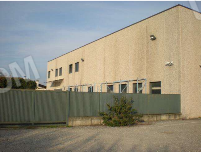
Foto 9 lato sud vista da cortile