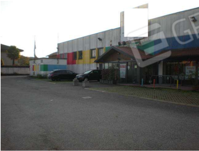
Foto 2 facciata nord