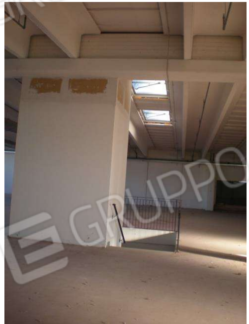
Foto 36 particolare arrivo elevatore al piano