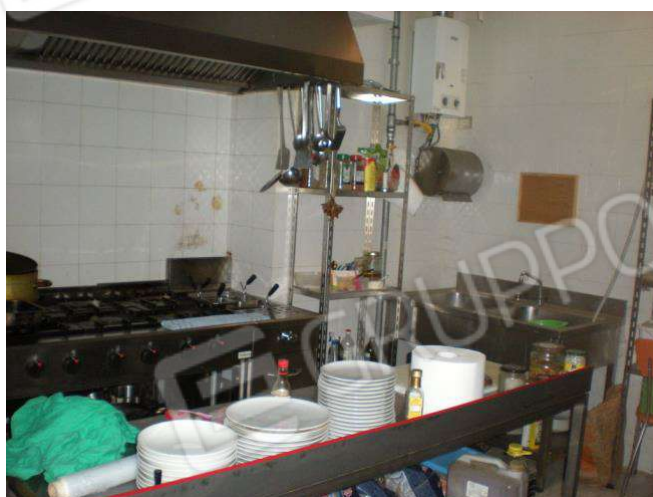
Foto 24 servizio zona bar-ristorante