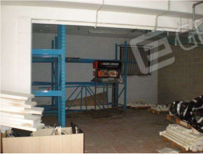
Foto 20 autorimessa magazzino