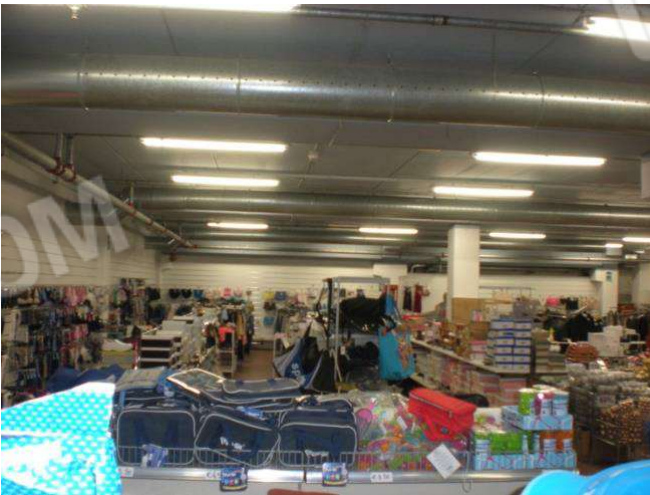
Foto 15 camerini prova