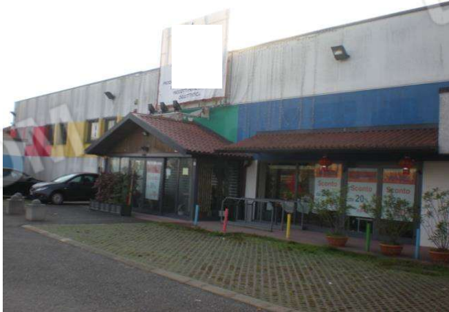
Foto 3 vetrate zona bar ristorante