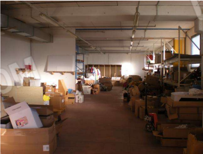
Foto 18 zona autorimessa-magazzino