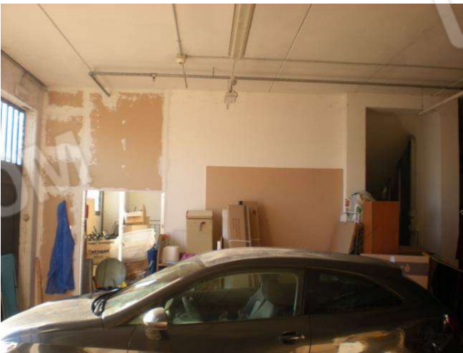
Foto 21 zona giochi bar-ristorante