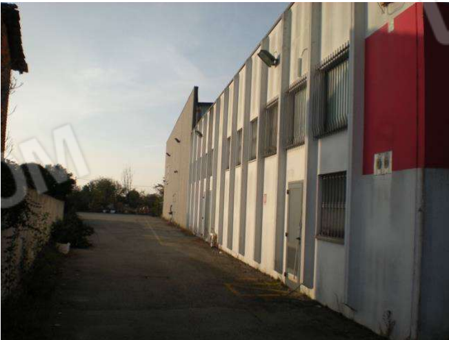
Foto 6 cabina ENEL posizione