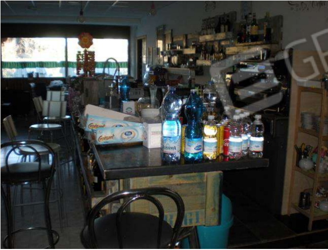
Foto 26 zona salone parrucchiera