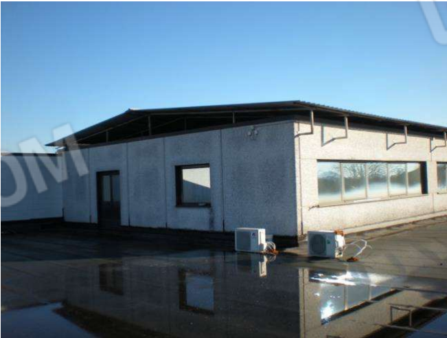
Foto 42 lato ovest deposito e adiacenze altre proprietà