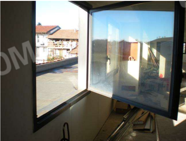
Foto 33 solaio di copertura lato ovest