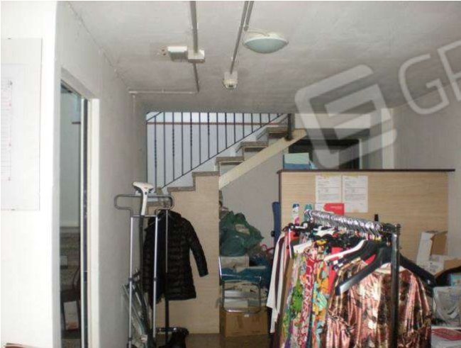
Foto 17 zona magazzini