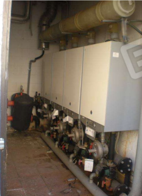
Foto 44 zona cortile abitazione-box auto-magazzino