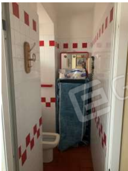
Vista servizio pt