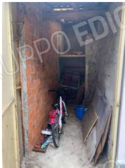
Vista locale deposito