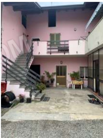
Vista corte pertinenziale