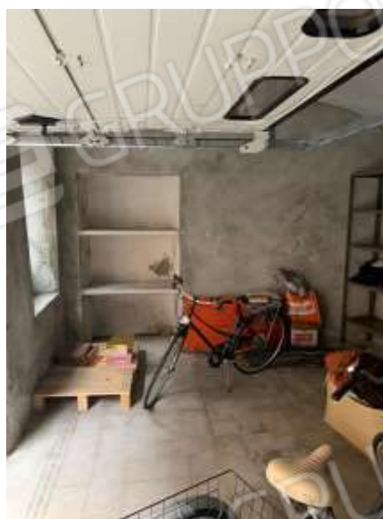
Vista interna garage