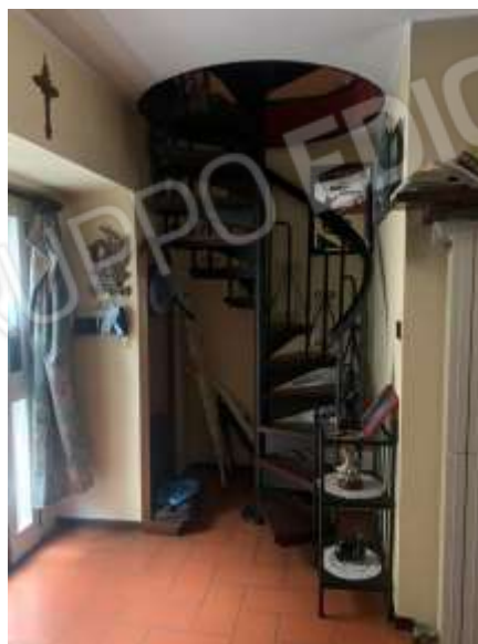
Vista scala interna