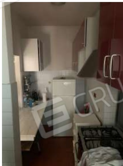
Vista angolo cottura