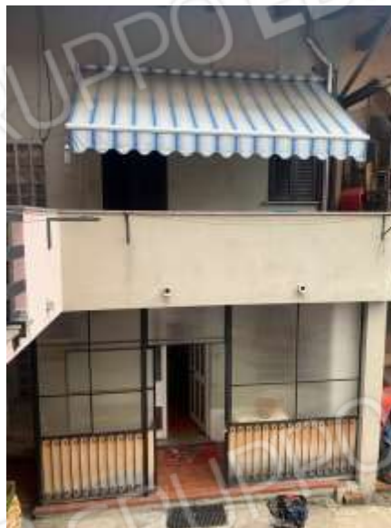
Vista generale immobile