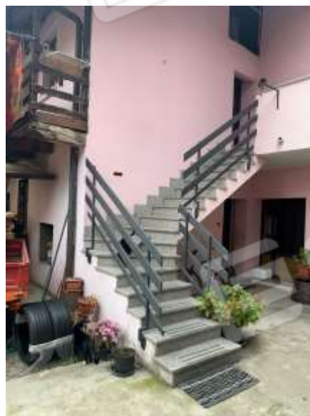
Vista scala esterna