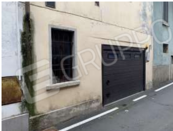
Vista generale garage