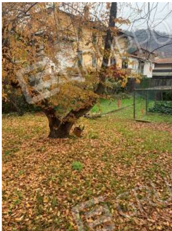
Vista generale terreno