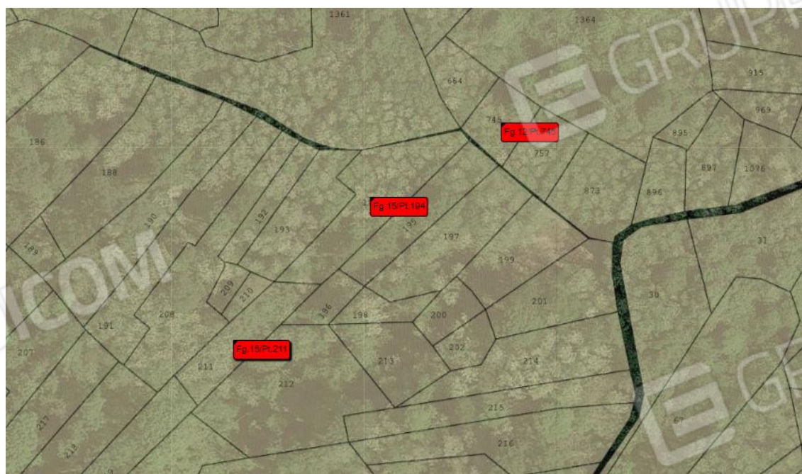
Foto 3: Vista aerea e catastale del foglio 12 mappale 745 e del foglio 15 mappali 194 e 211.