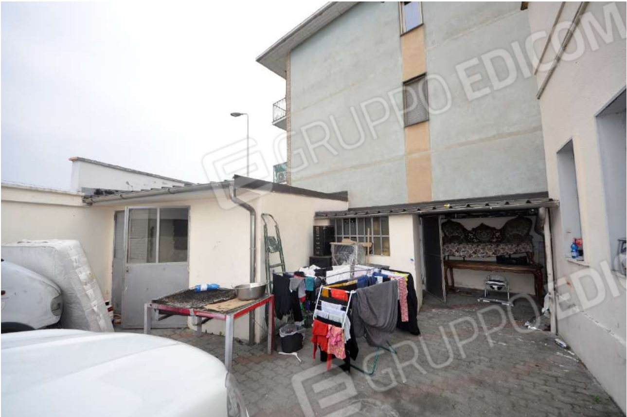
Vista dei ripostigli esterni.