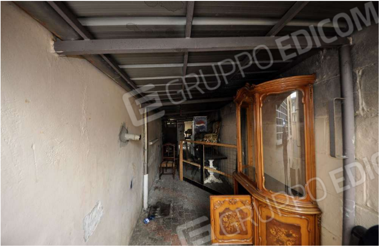
Tettoia lungo il fronte est.