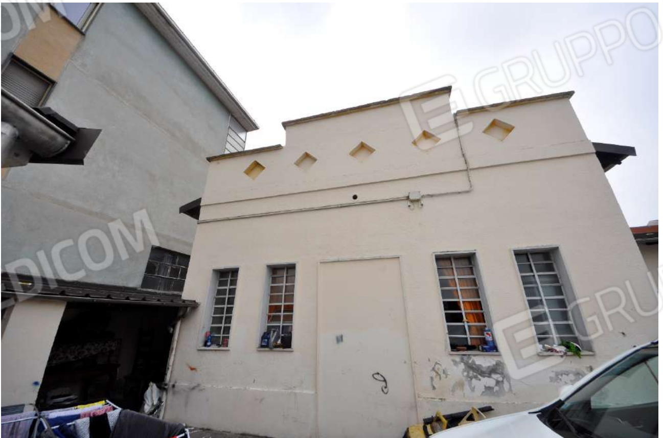
Vista del fronte nord sul cortile.