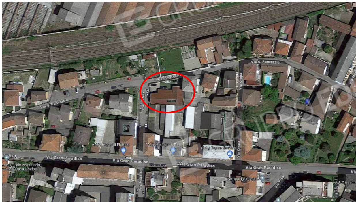
Vista satellitare