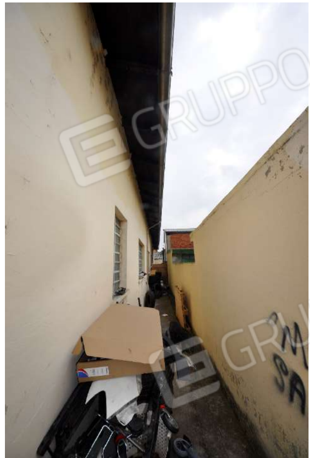
Vista del fronte sud.