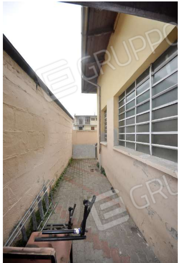
Porzione del fronte est non occupato da tettoia.