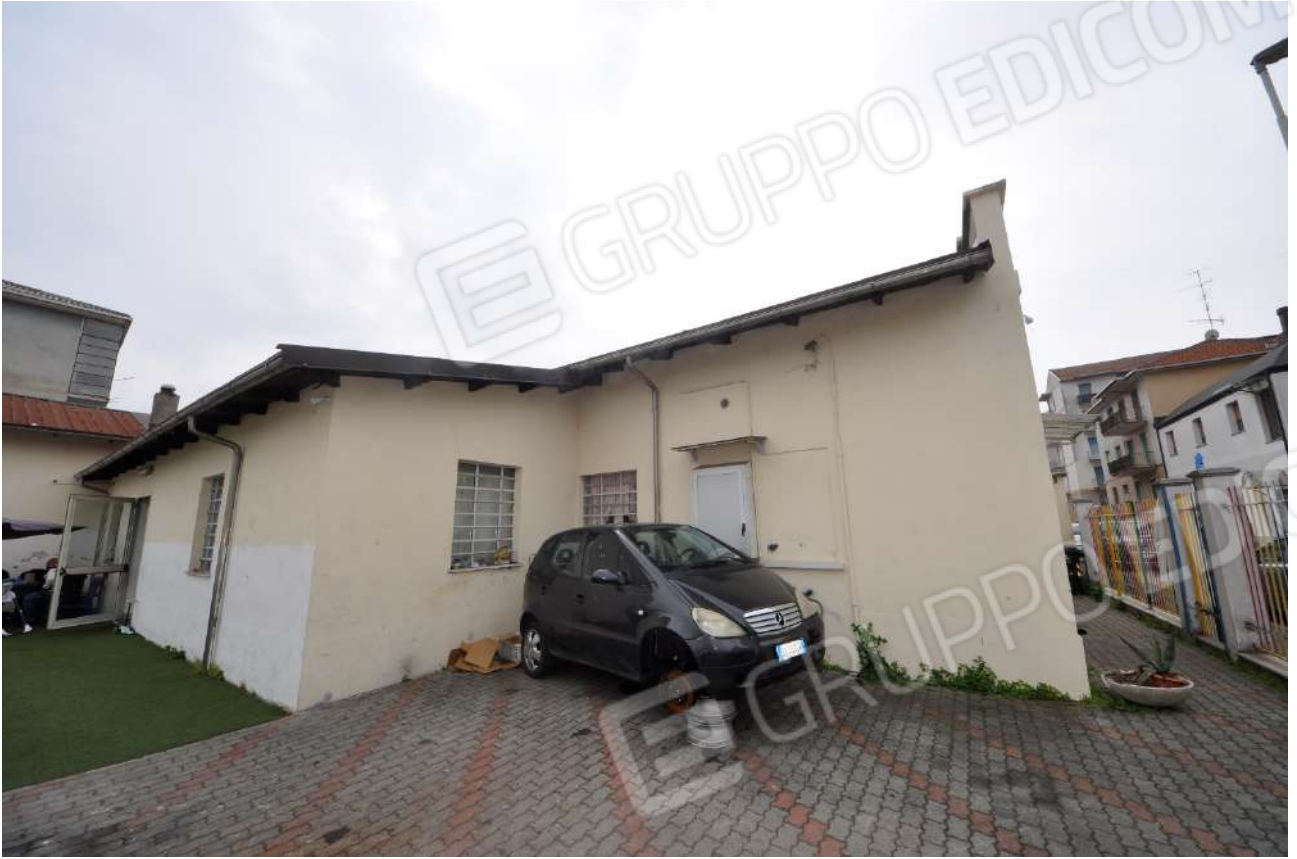
Vista del fronte nord sul cortile.