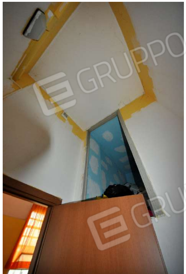
Antibagno (a destra, vista della porta del ripostiglio 3 del piano primo, raggiungibile con scala a pioli).