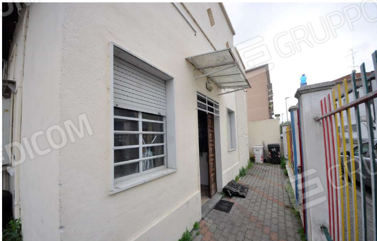
Vista del fronte ovest su via Pistoia.