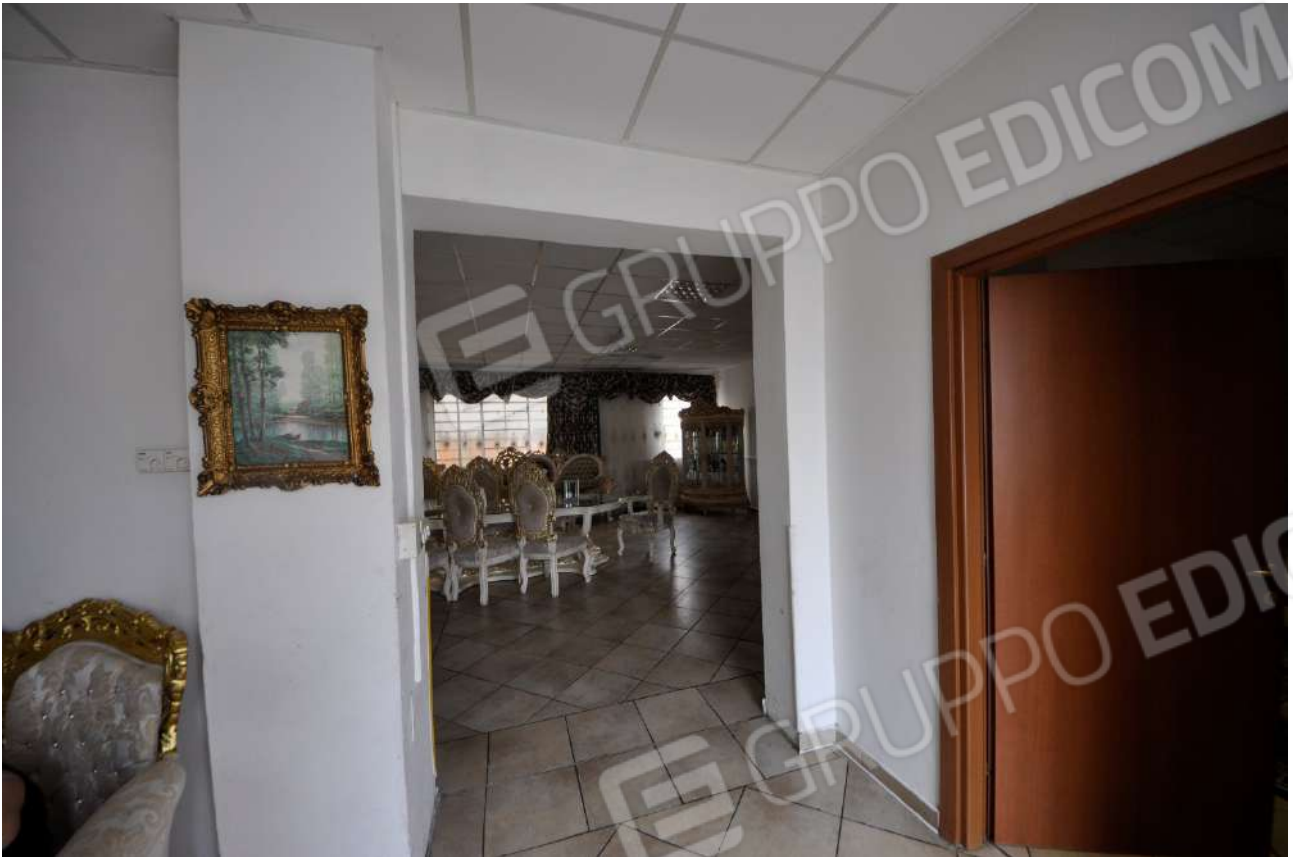
Cucina (vista verso soggiorno).