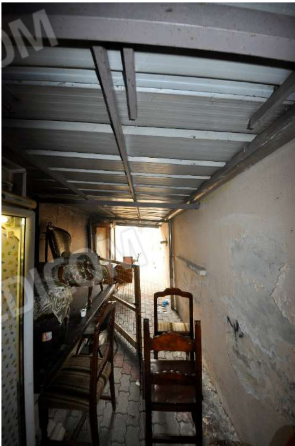
Tettoia lungo il fronte est.