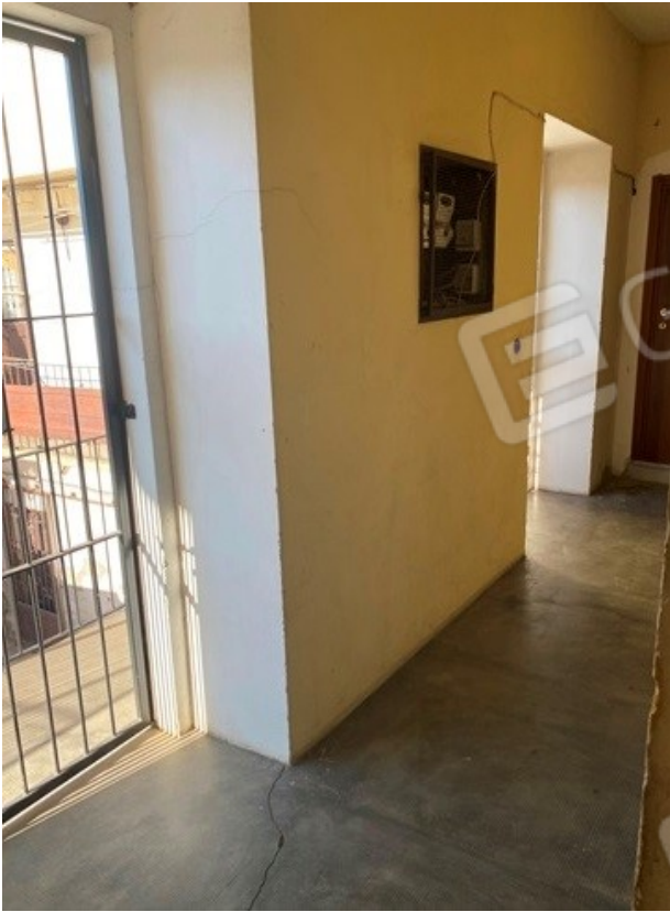
sbarco rampa scale al piano primo 13