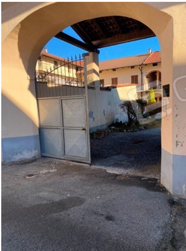
beni cd. 1 e 2