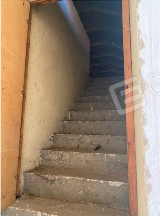
rampa scale al sottotetto 17