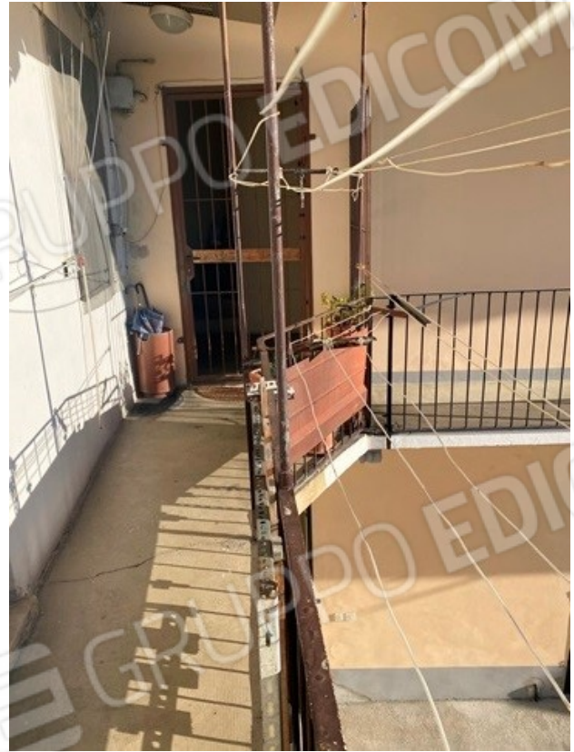
ballatoio di accesso al bene sub. 4 14