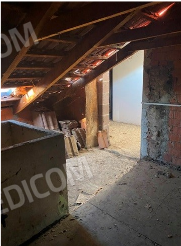
accesso alla porzione di sottotetto bene cd 4 19