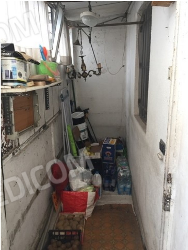
ripostiglio sul ballatoio 15