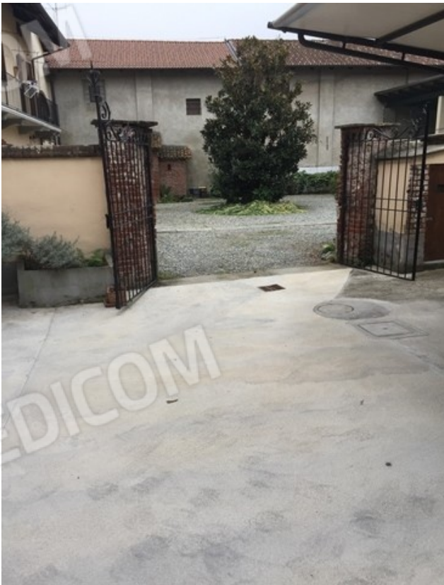
vista area servitù sul fondo mappa. 300 verso via Castelletto