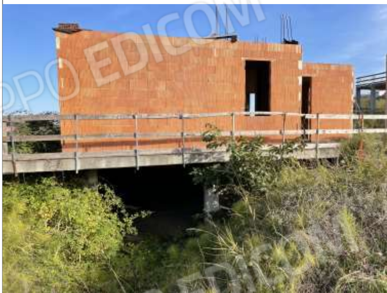
PROSPETTO OVEST - INGRESSO PIANO INTERRATO