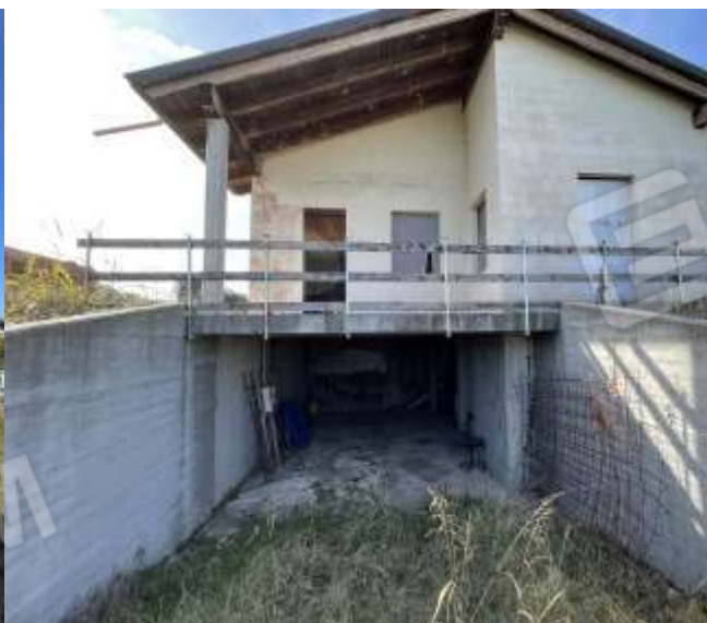
PROSPETTO EST-INGRESSO PIANO INTERRATO