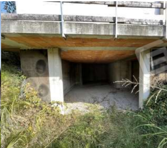
INGRESSO PIANO INTERRATO