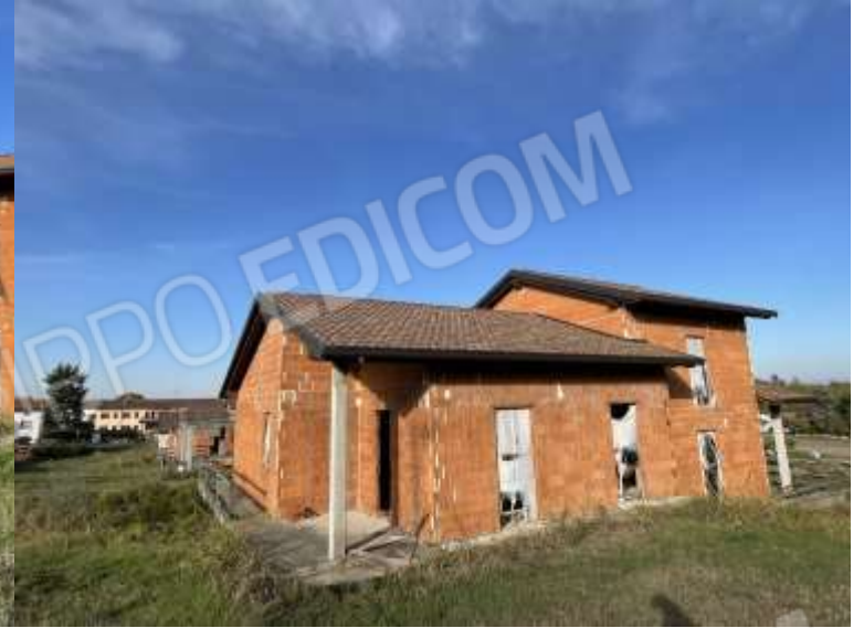
PROSPETTO SUD - OVEST