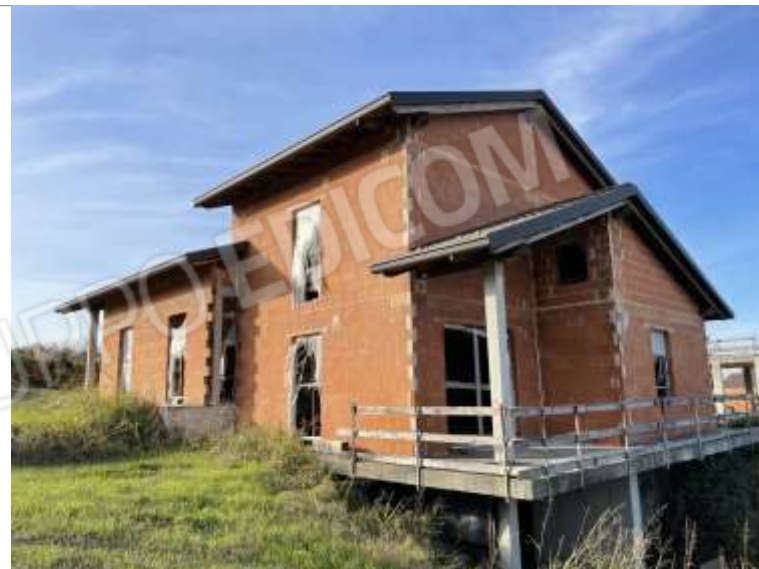
PROSPETTO SUD - EST