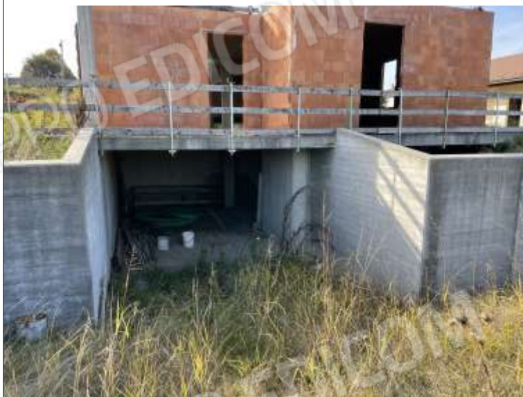
INGRESSO PIANO INTERRATO