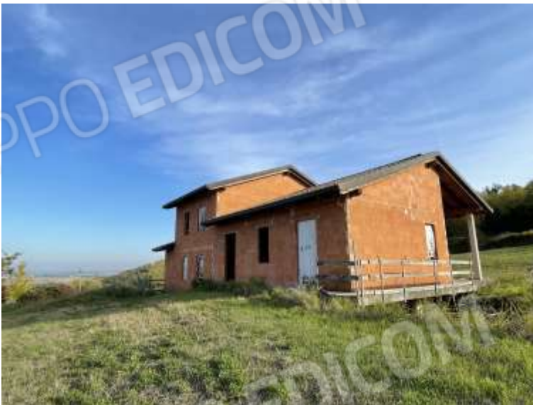
PROSPETTO NORD - OVEST