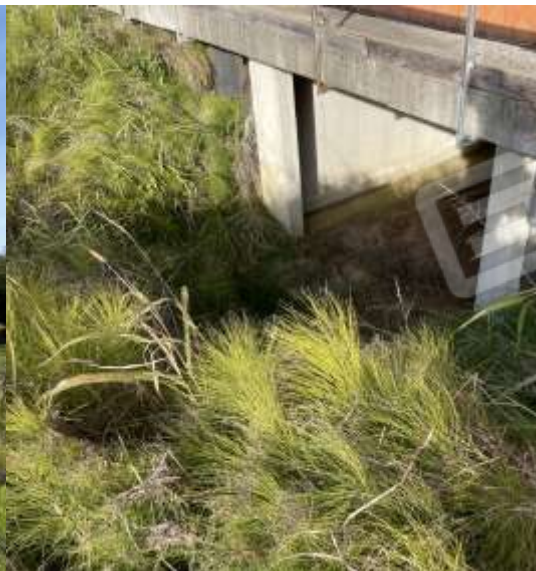
INGRESSO PIANO INTERRATO