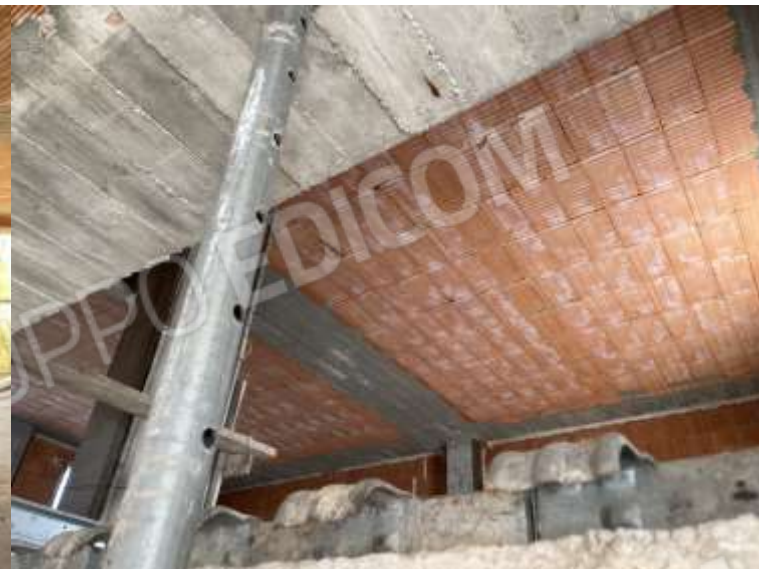
PIANO TERRA - VISTA SUL SOLAIO DEL PIANO PRIMO