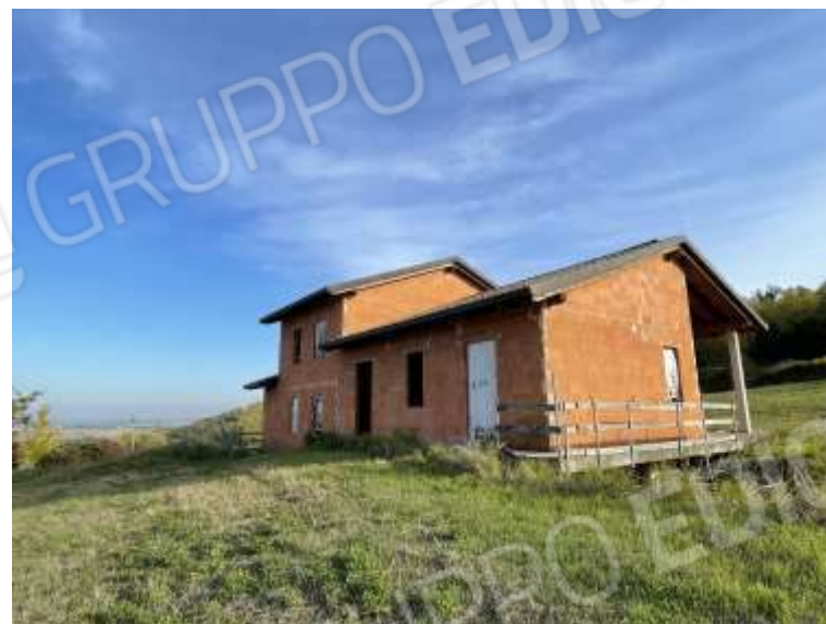
PROSPETTO NORD- OVEST