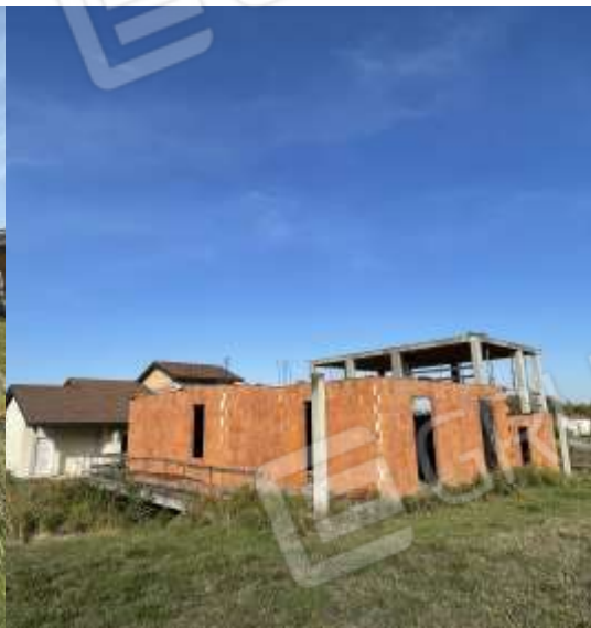
PROSPETTO SUD - OVEST