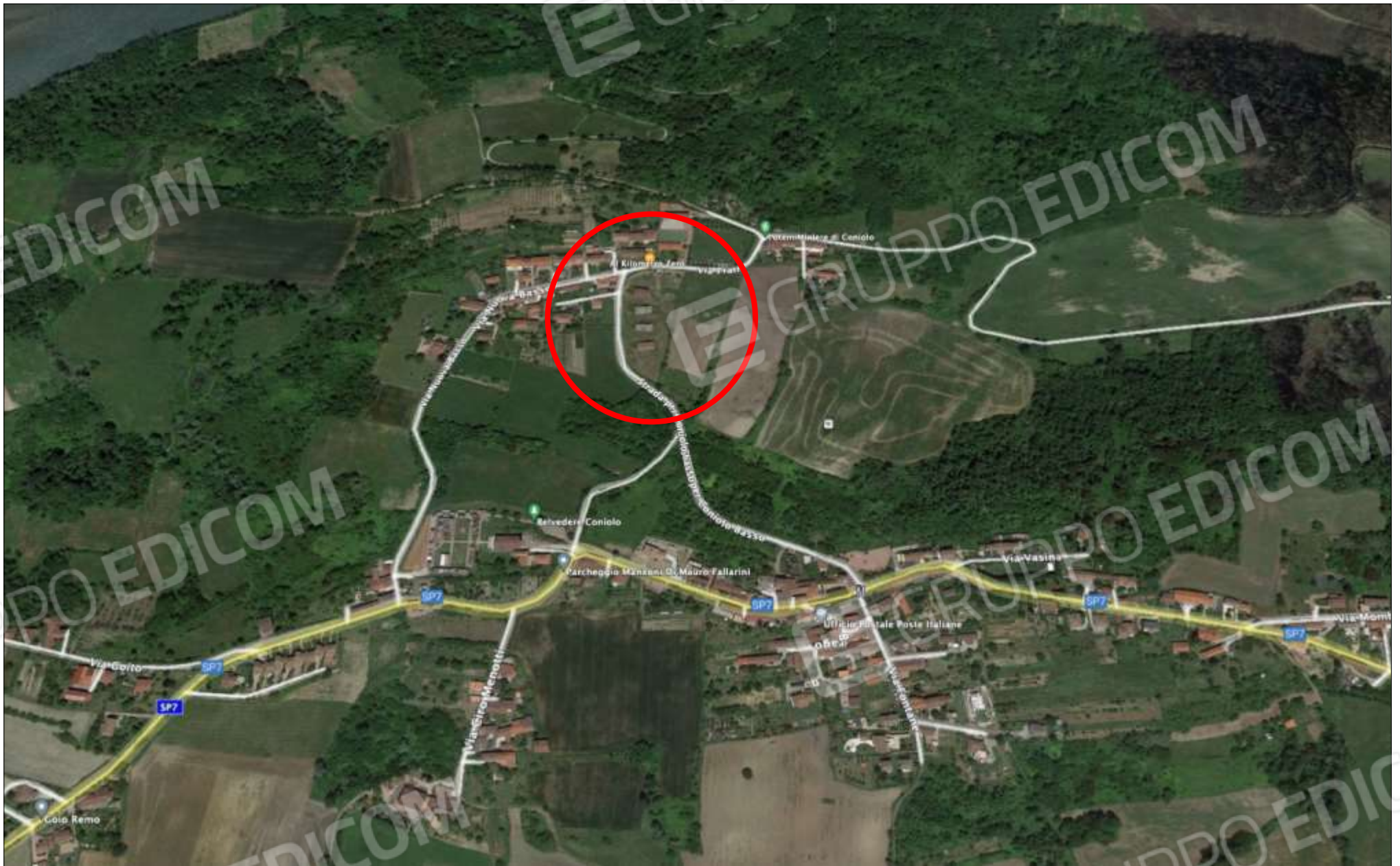
IL COMUNE DI CONIOLO - L'AREA DI INTERESSE