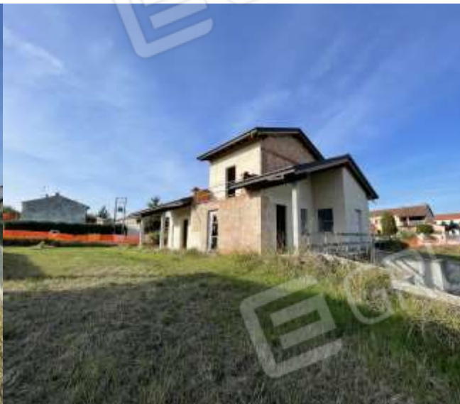
PROSPETTO SUD EST