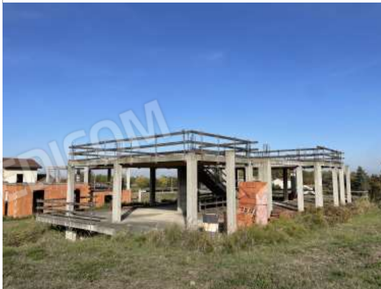
PROSPETTO SUD - OVEST