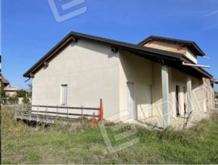
PROSPETTO SUD - OVEST