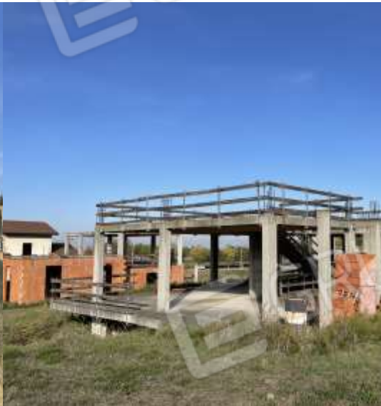
PROSPETTO SUD - OVEST