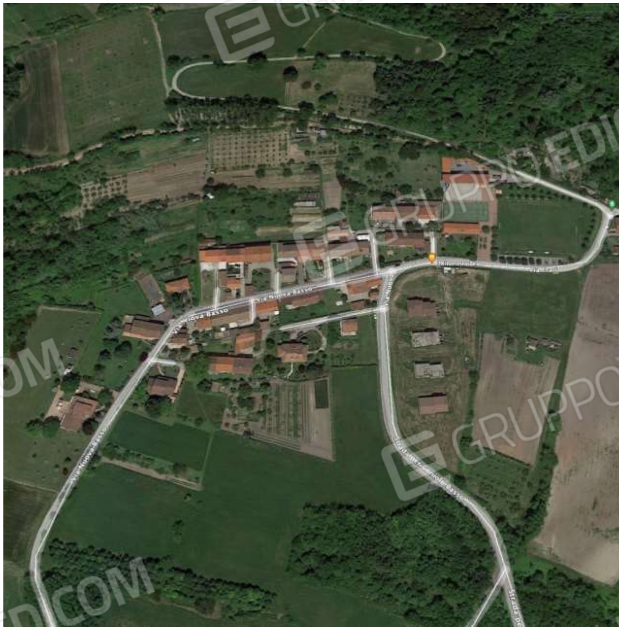
L'AREA DI CONIOLO BASSO