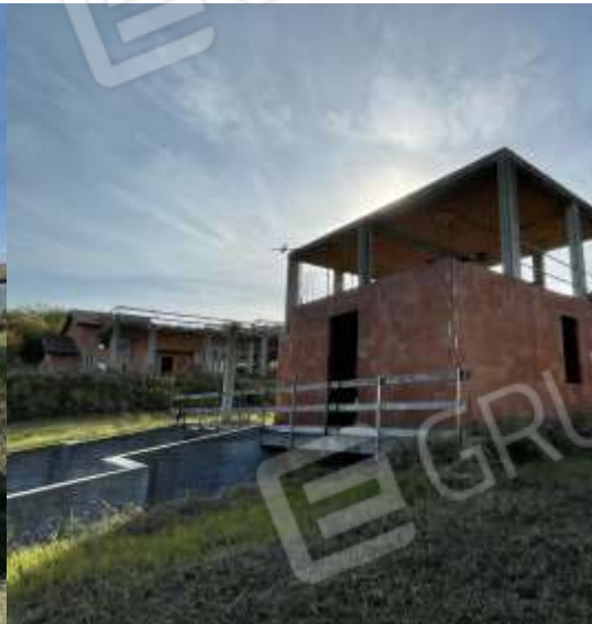
PROSPETTO NORD - EST