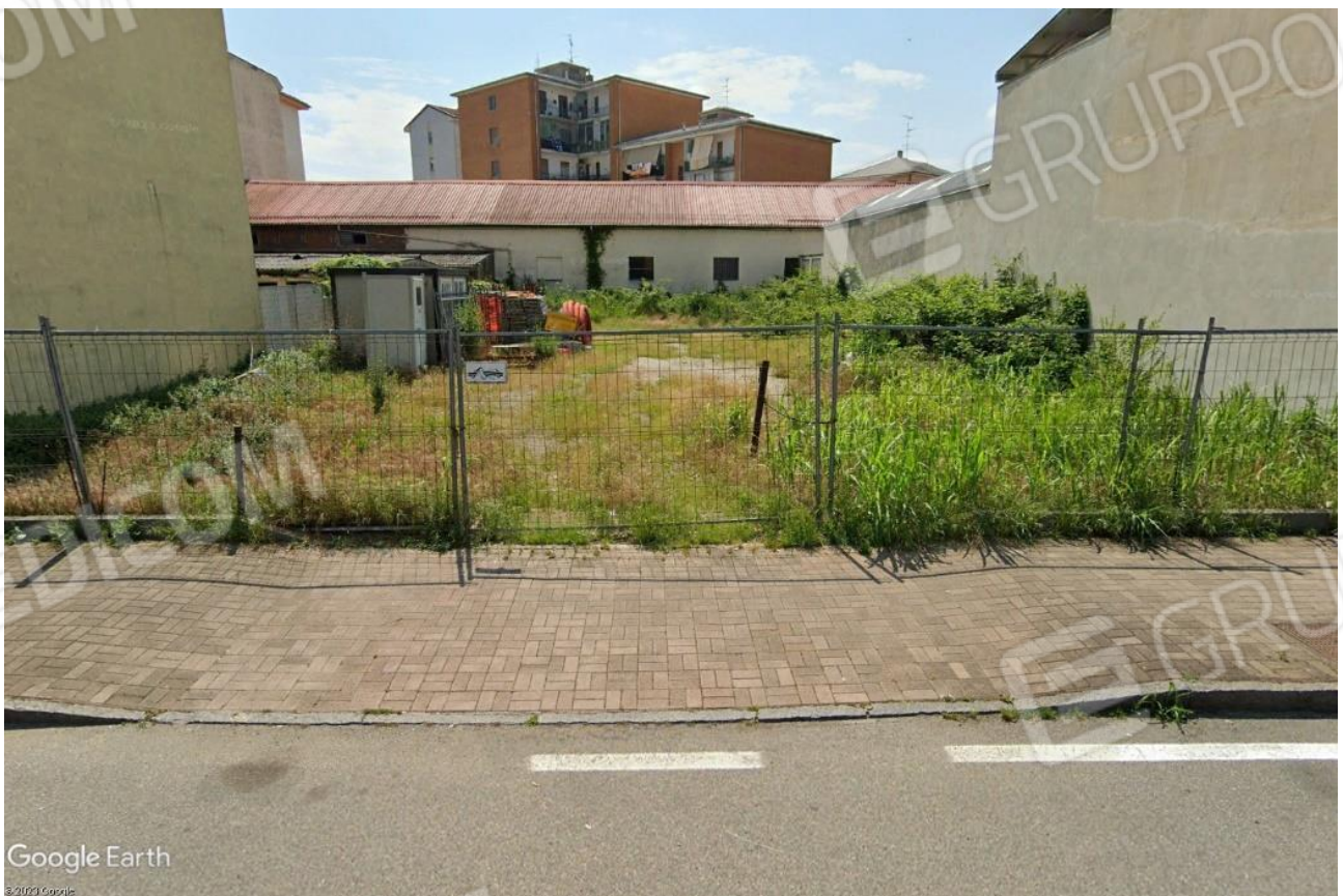
FOTO 2 – Ingresso terreno particella 160 da Corso Randaccio – “LOTTO 2”