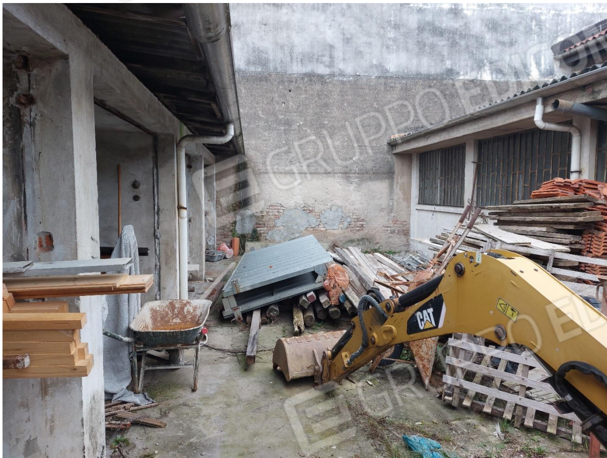
FOTO 7 – Particolare area di manovra tra i due bassi fabbricati – “LOTTO 2”