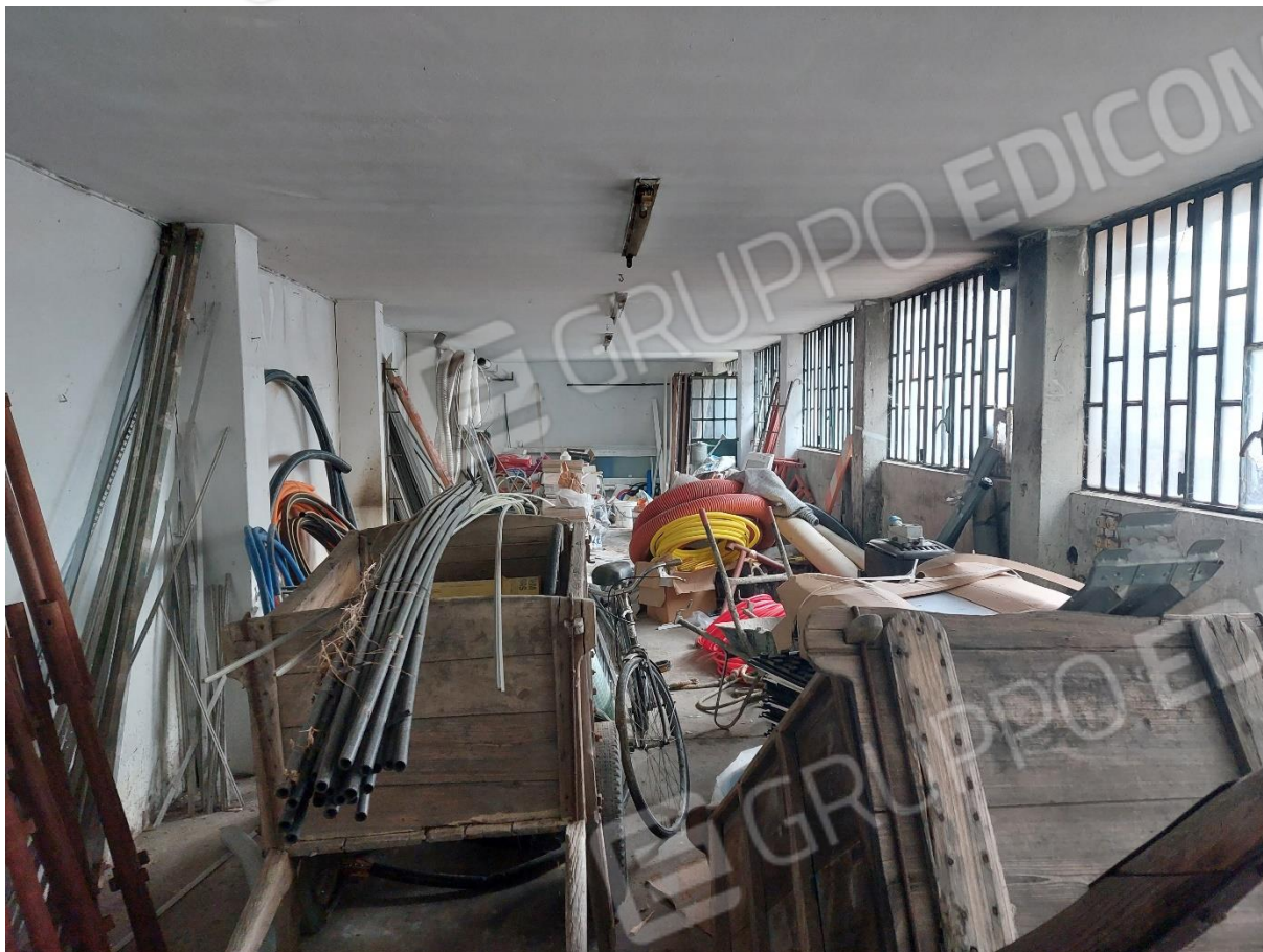
FOTO 15 – Interno magazzino censito al F. 87 part. 200 – “LOTTO 2”