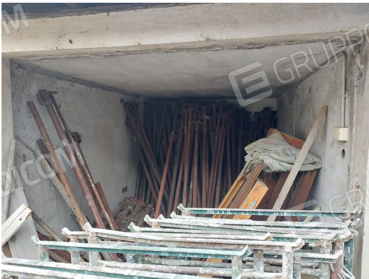
FOTO 4 – Batteria 5 box/magazzini censiti al F. 87 part. 202 subb. 1-6-7-8 e 9 – “LOTTO 2”