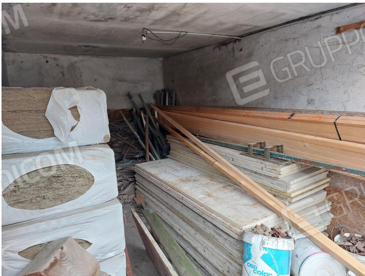
FOTO 6 – Batteria 5 box/magazzini censiti al F. 87 part. 202 subb. 1-6-7-8 e 9 – “LOTTO 2”