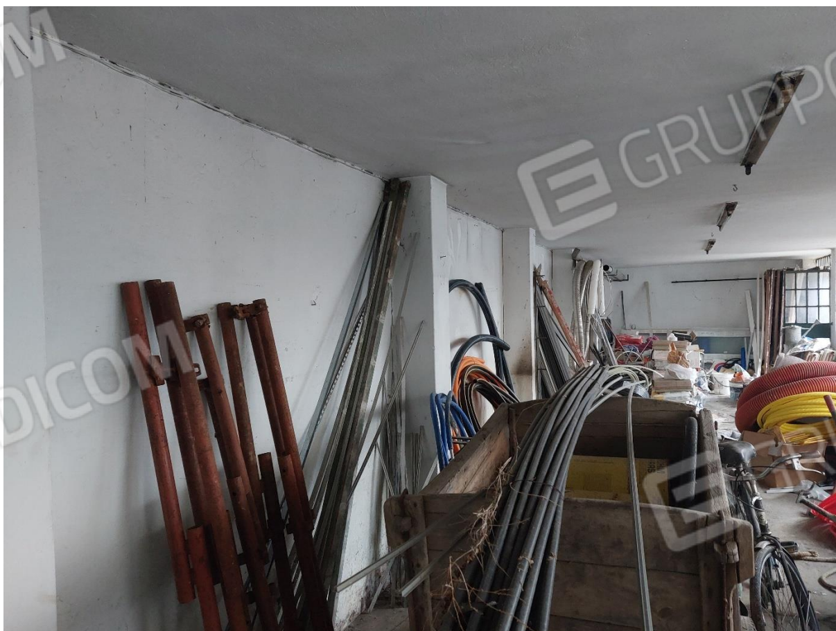
FOTO 18 – Interno magazzino censito al F. 87 part. 200 – “LOTTO 2”