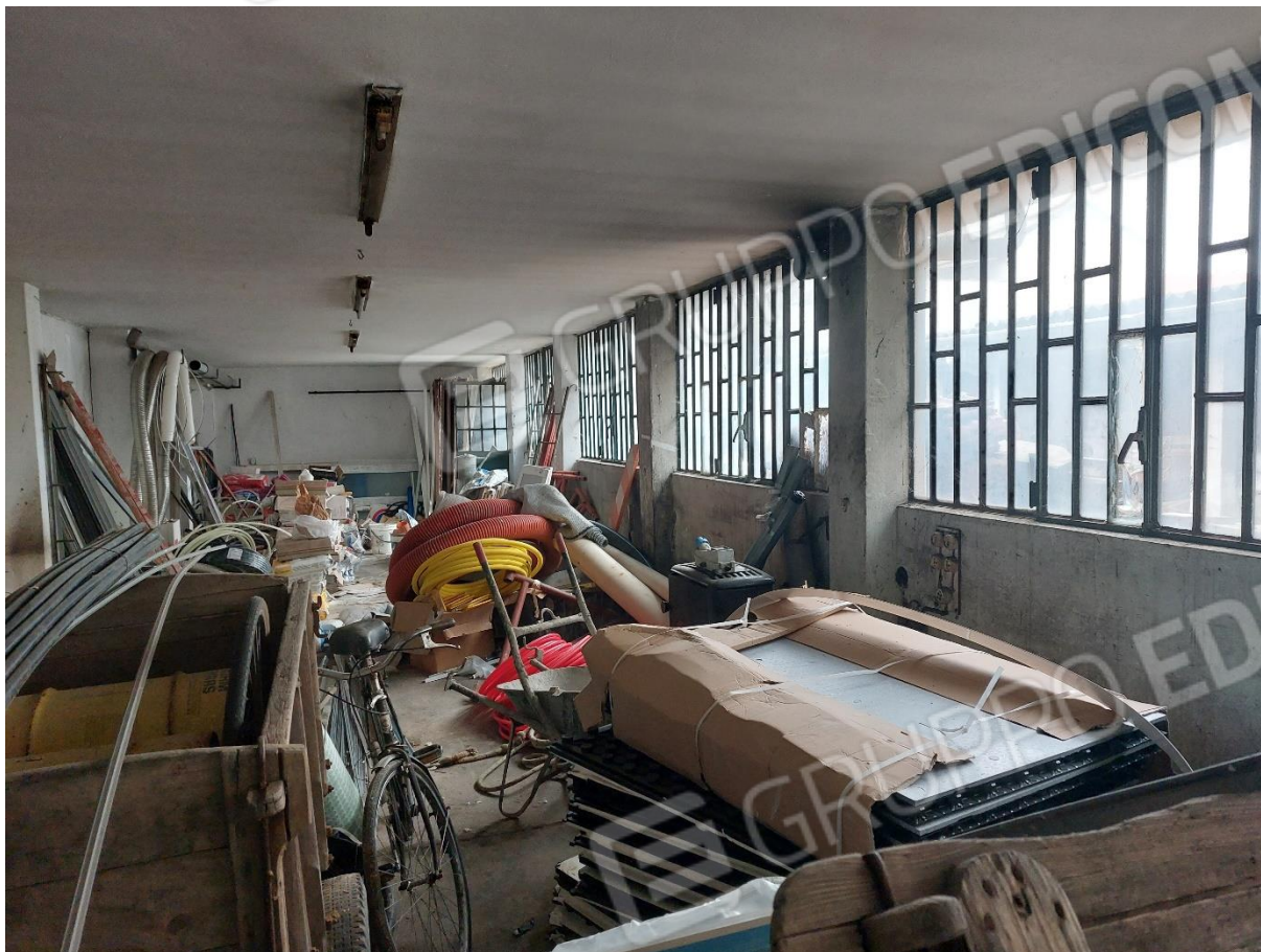
FOTO 17 – Interno magazzino censito al F. 87 part. 200 – “LOTTO 2”