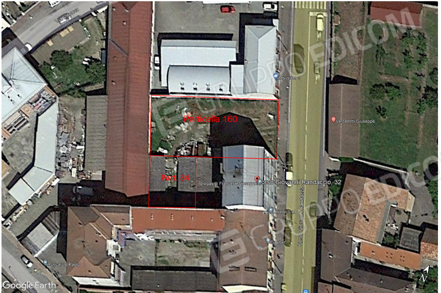
FOTO 1 – Estratto google con indicazione della part. 160 e parte della part. 84 – “LOTTO 2”