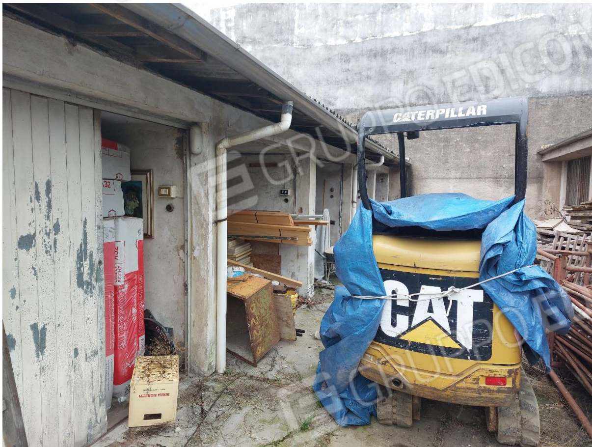
FOTO 5 – Batteria 5 box/magazzini censiti al F. 87 part. 202 subb. 1-6-7-8 e 9 – “LOTTO 2”