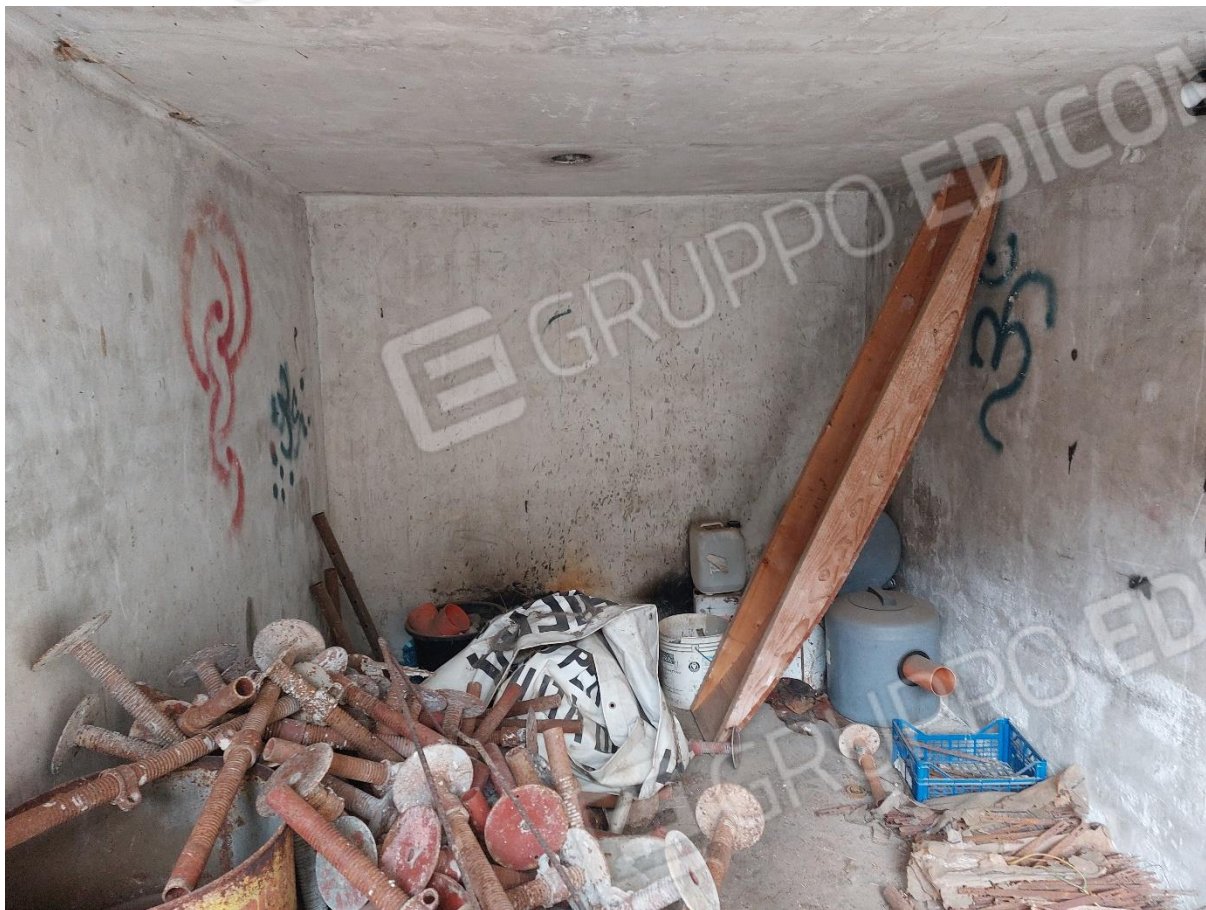
FOTO 9 – Batteria 5 box/magazzini censiti al F. 87 part. 202 subb. 1-6-7-8 e 9 – “LOTTO 2”