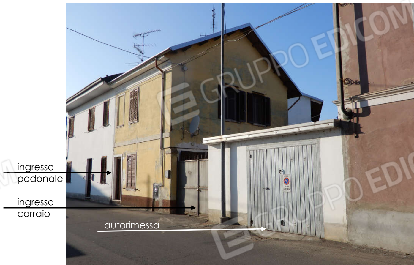
VIA ASIGLIANO - Prospetto Sud