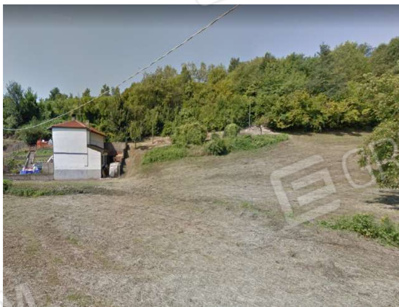
MAPPALI 243 E 396