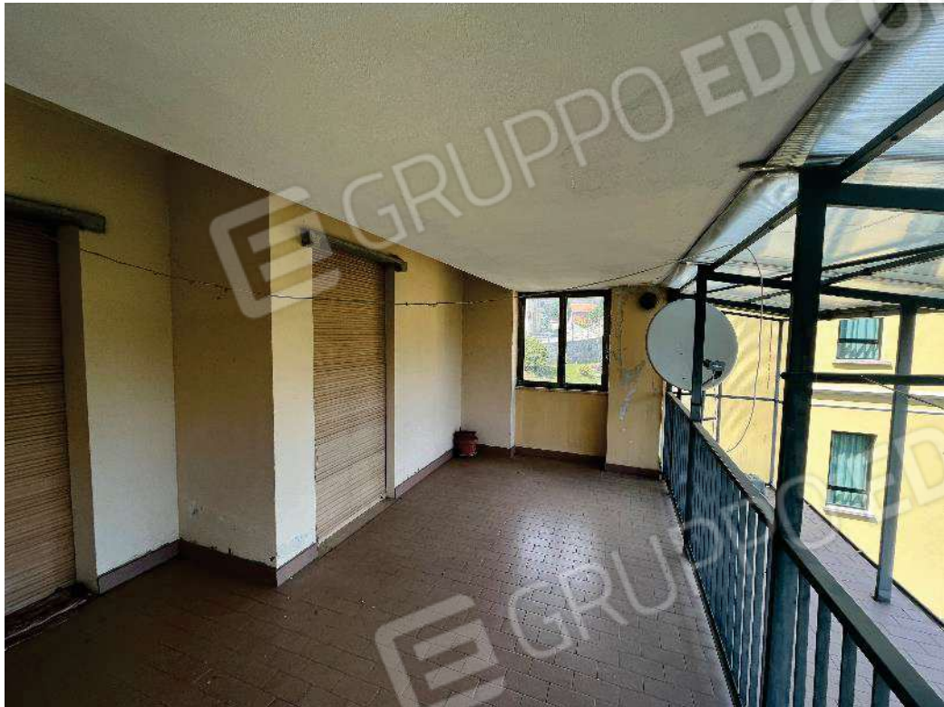
Figura 14: vista del ballatoio comune e del balcone coperto