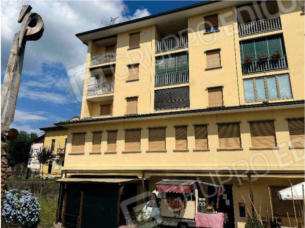
Figura 8: vista della facciata principale del fabbricato e dell'alloggio