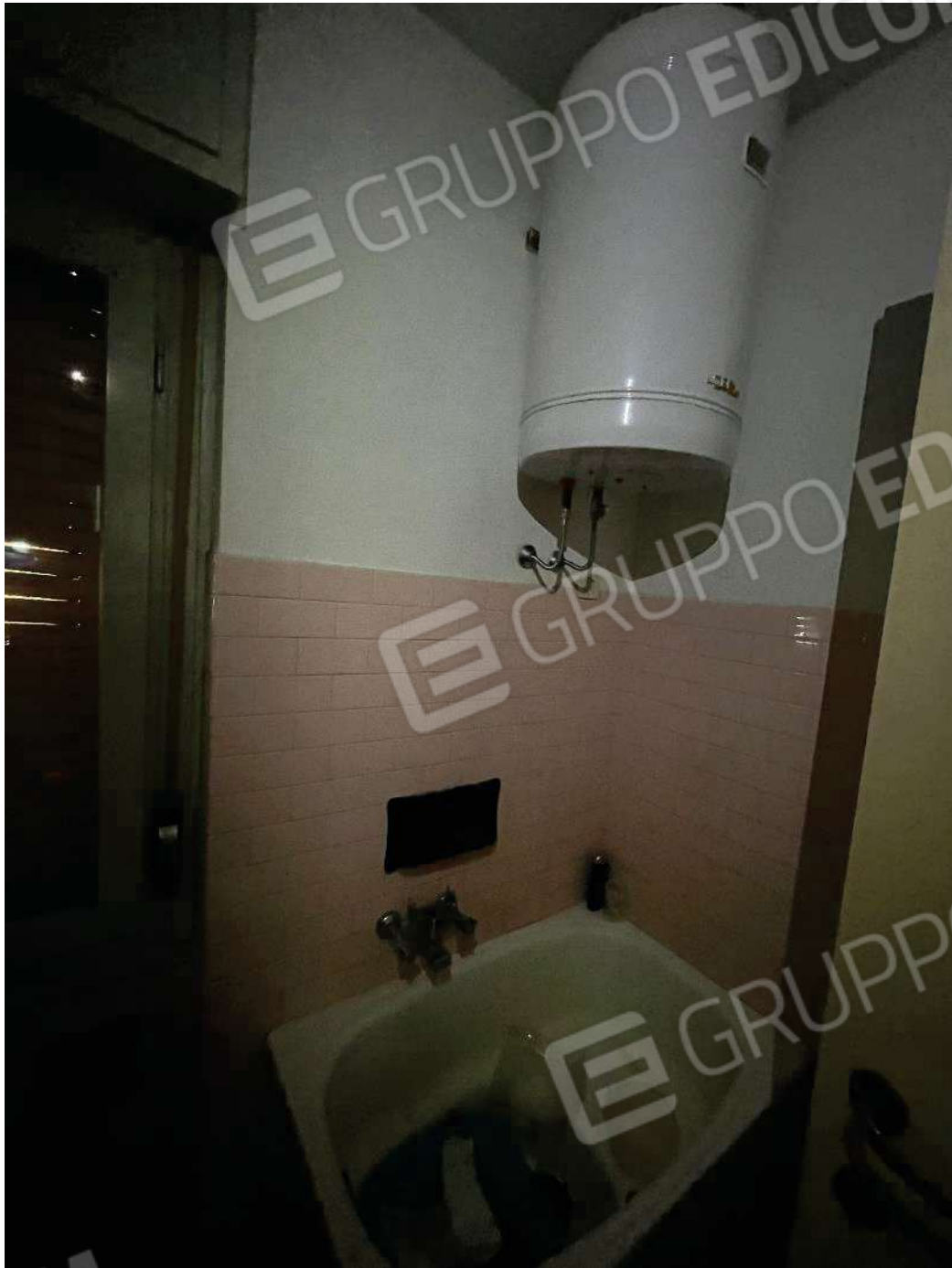
Figura 25: vista del primo bagno