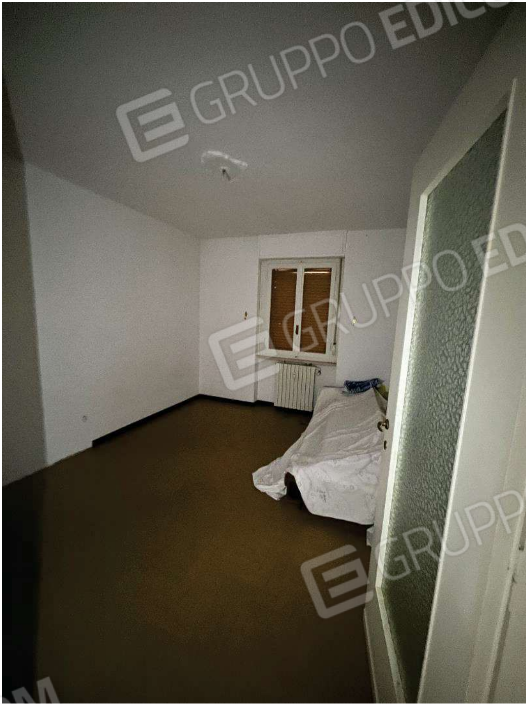
Figura 28: vista della terza camera