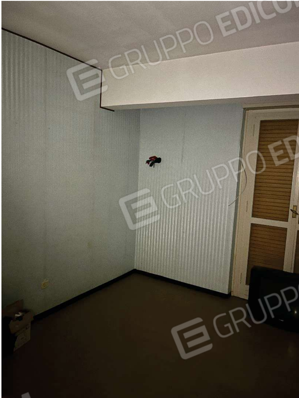
Figura 23: vista della seconda camera