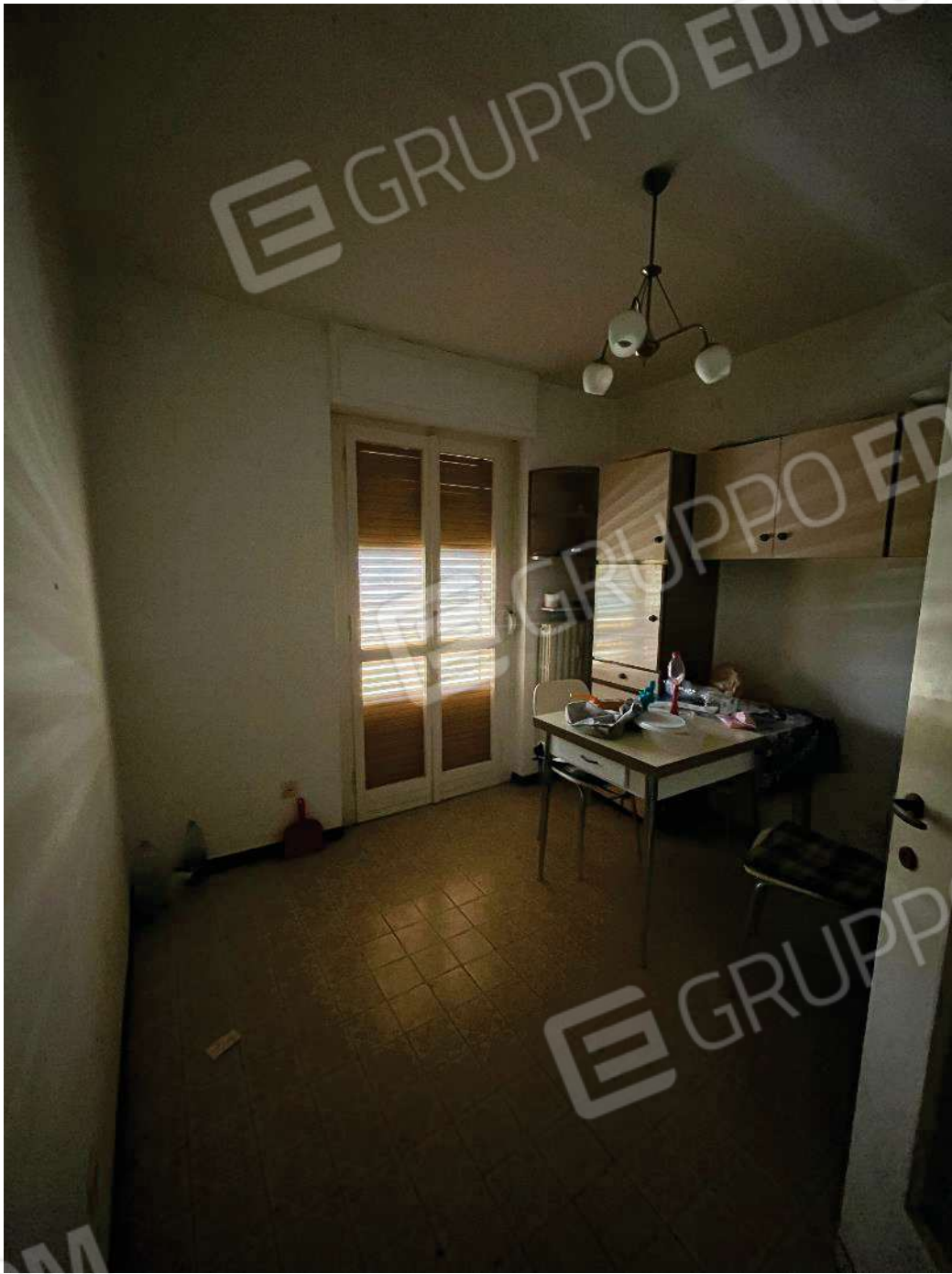
Figura 29: vista della cucina (indicata come camera)