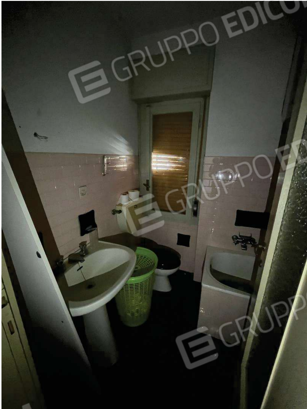
Figura 24: vista del primo bagno