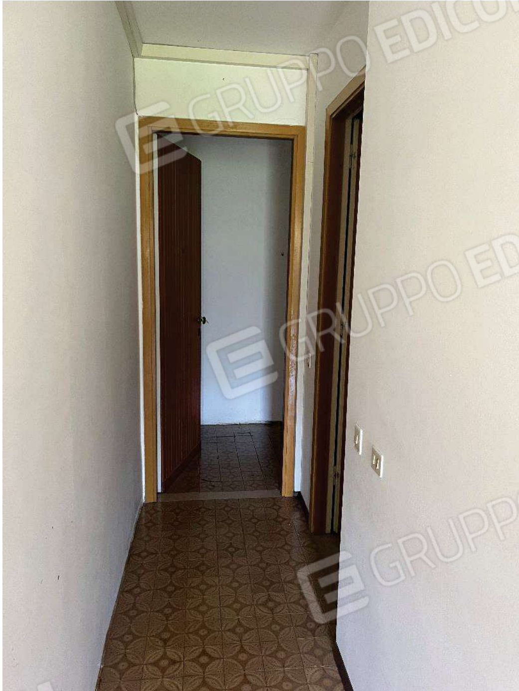
Figura 19: vista del corridoio di ingresso