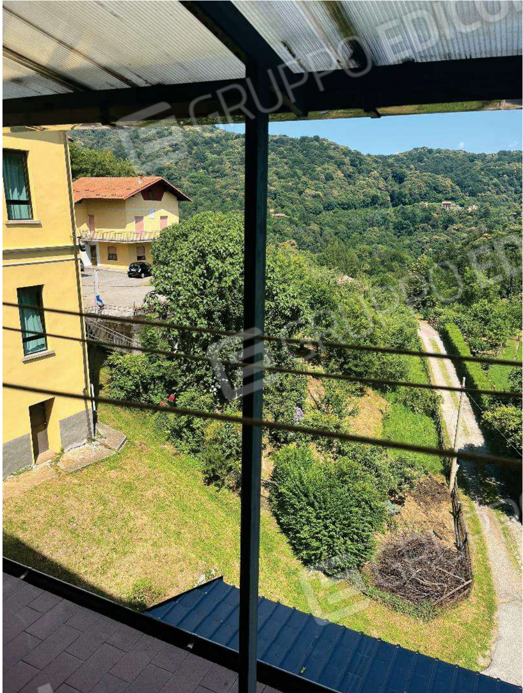
Figura 12: vista sul retro dal ballatoio comune