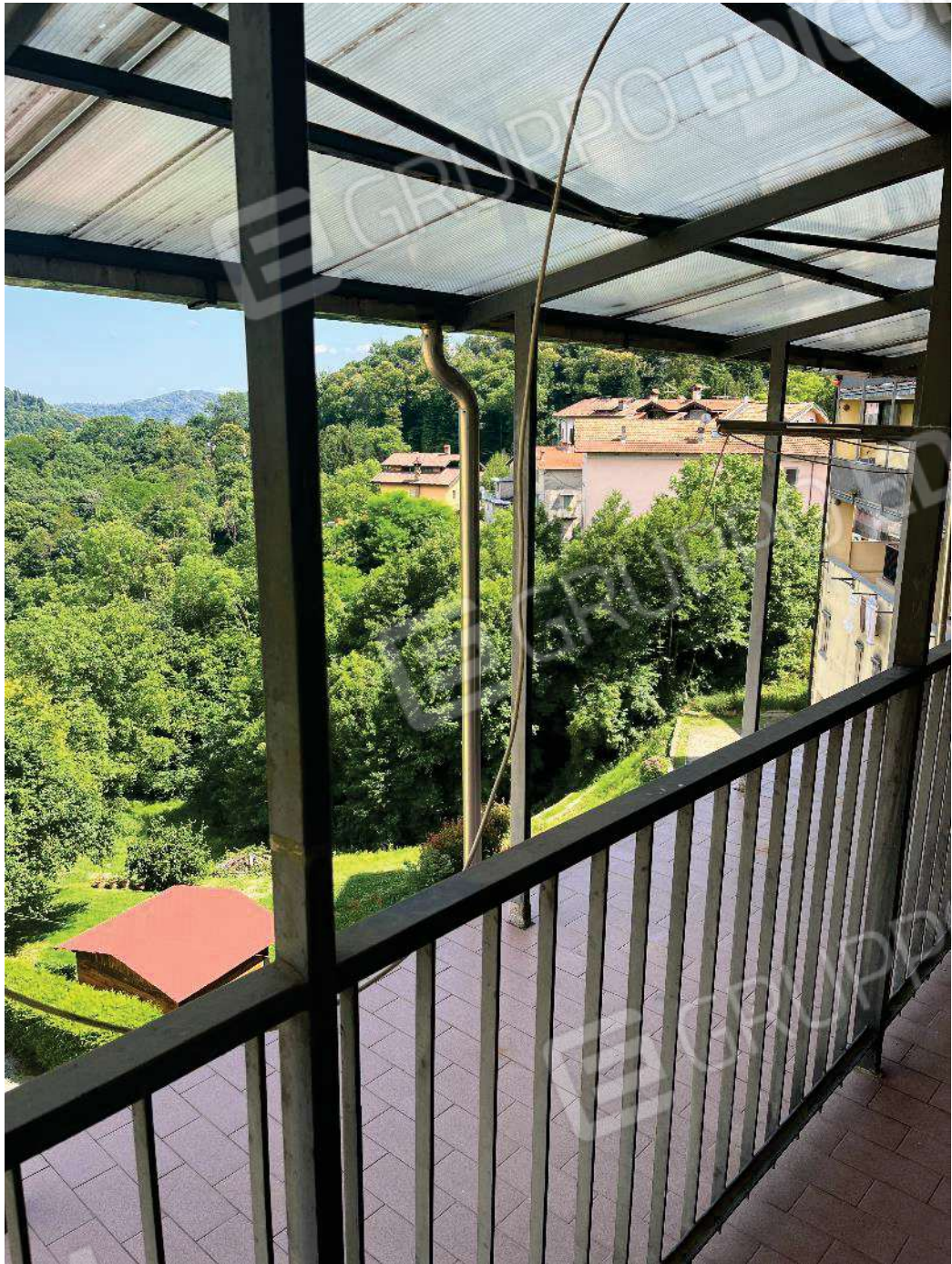
Figura 13: vista sul retro dal ballatoio comune