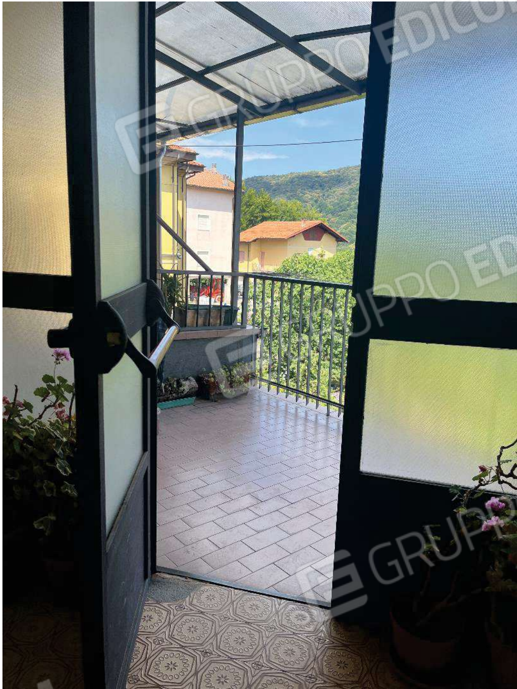
Figura 10: vista dell'accesso al ballatoio comune