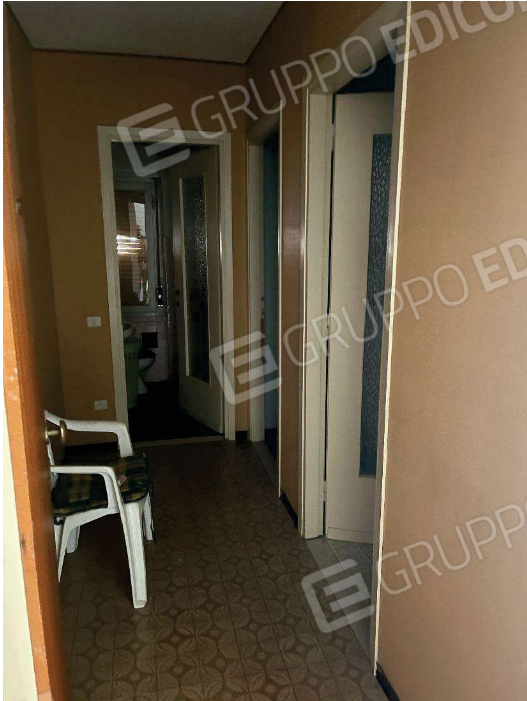
Figura 20: vista del primo corridoio di disimpegno