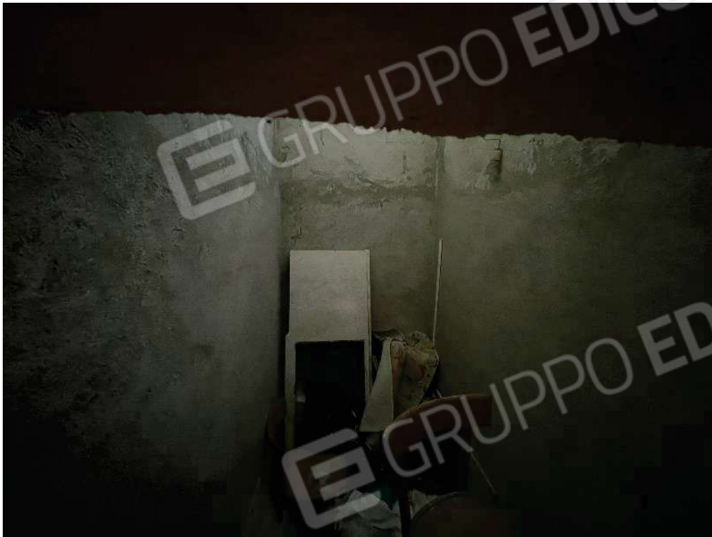
Figura 38: vista della cantina