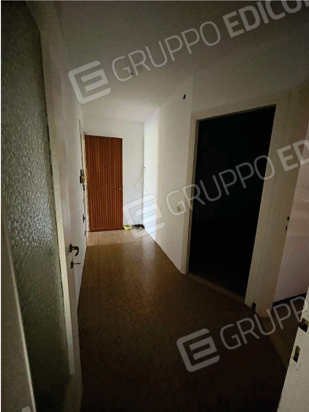
Figura 31: vista del primo corridoio di disimpegno