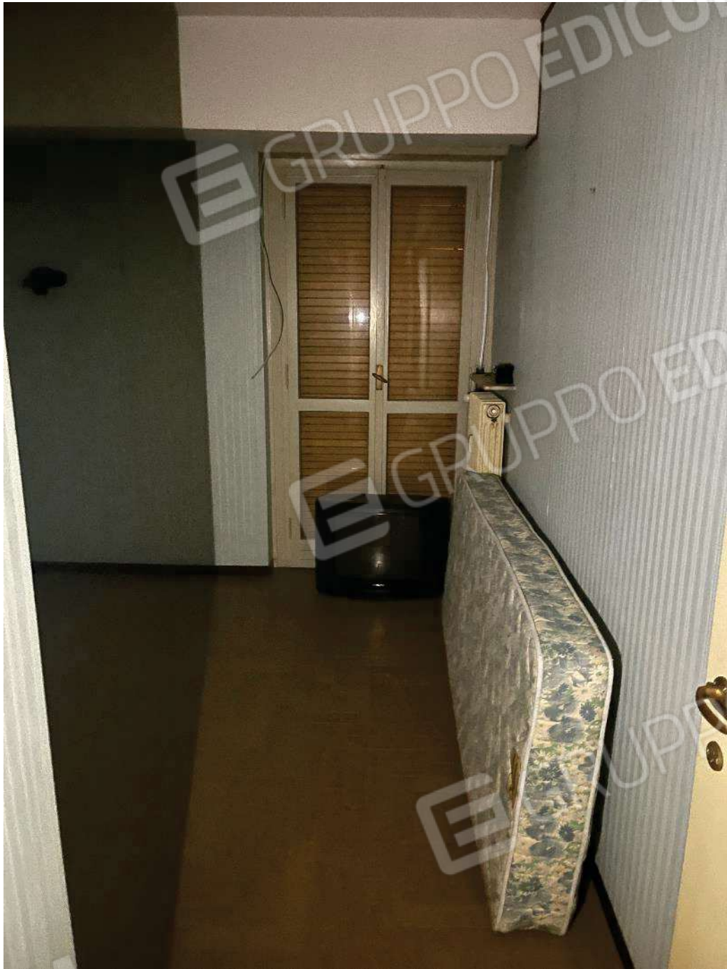
Figura 22: vista della seconda camera