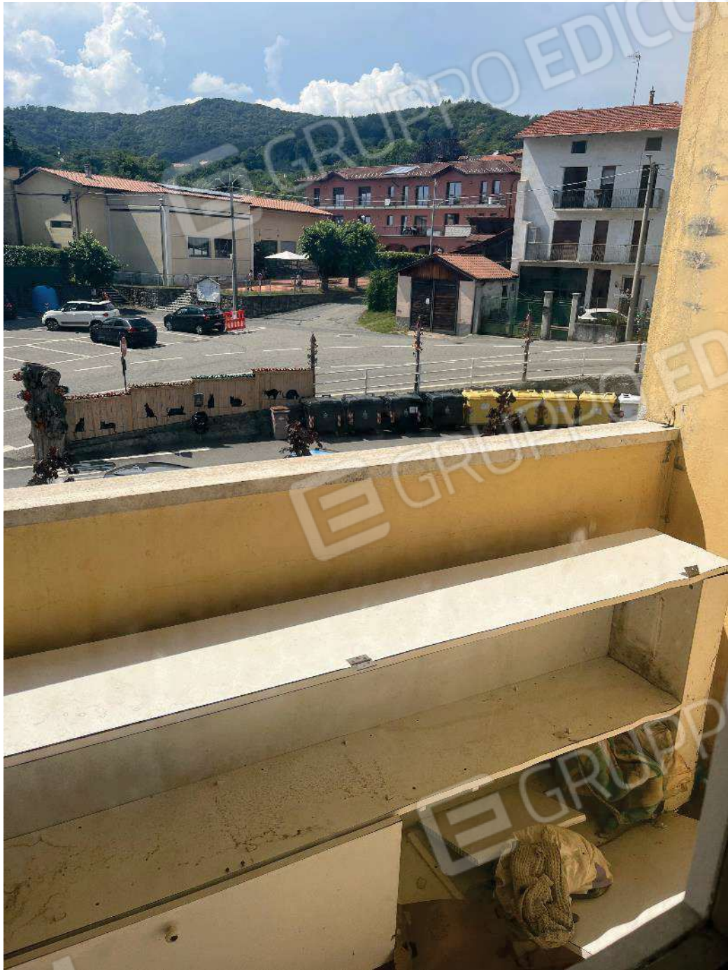
Figura 33: vista dal balcone della cucina su piazza Durio