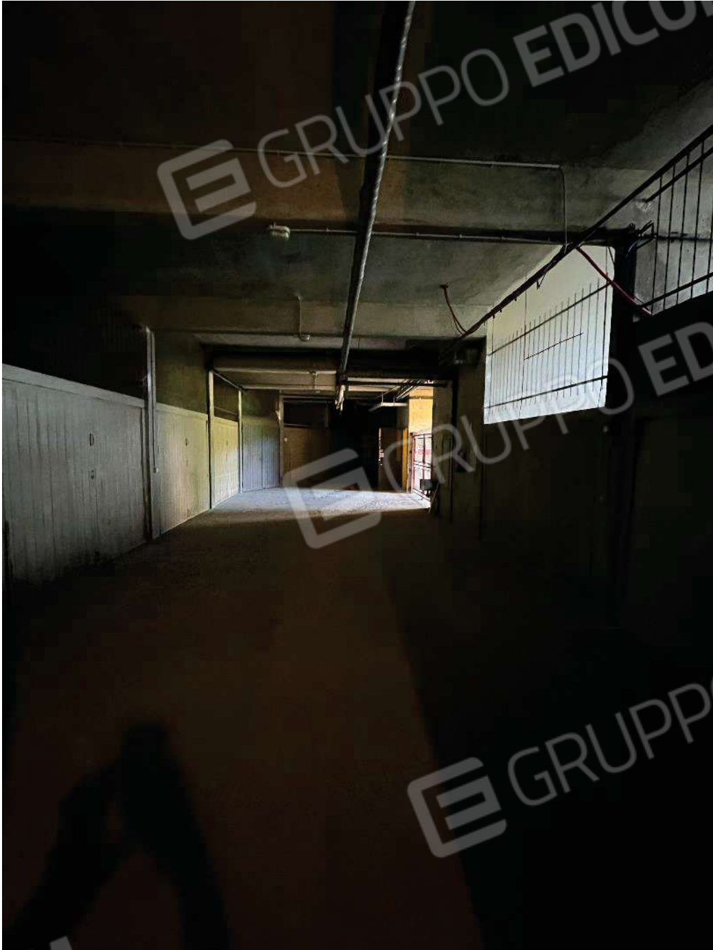
Figura 35: vista del corsello al piano primo interrato