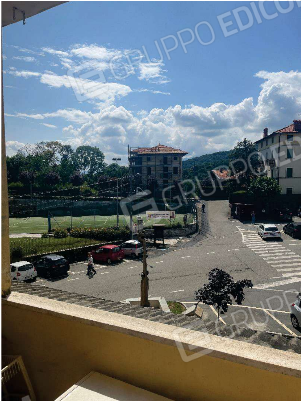
Figura 32: vista dal balcone della cucina su piazza Durio