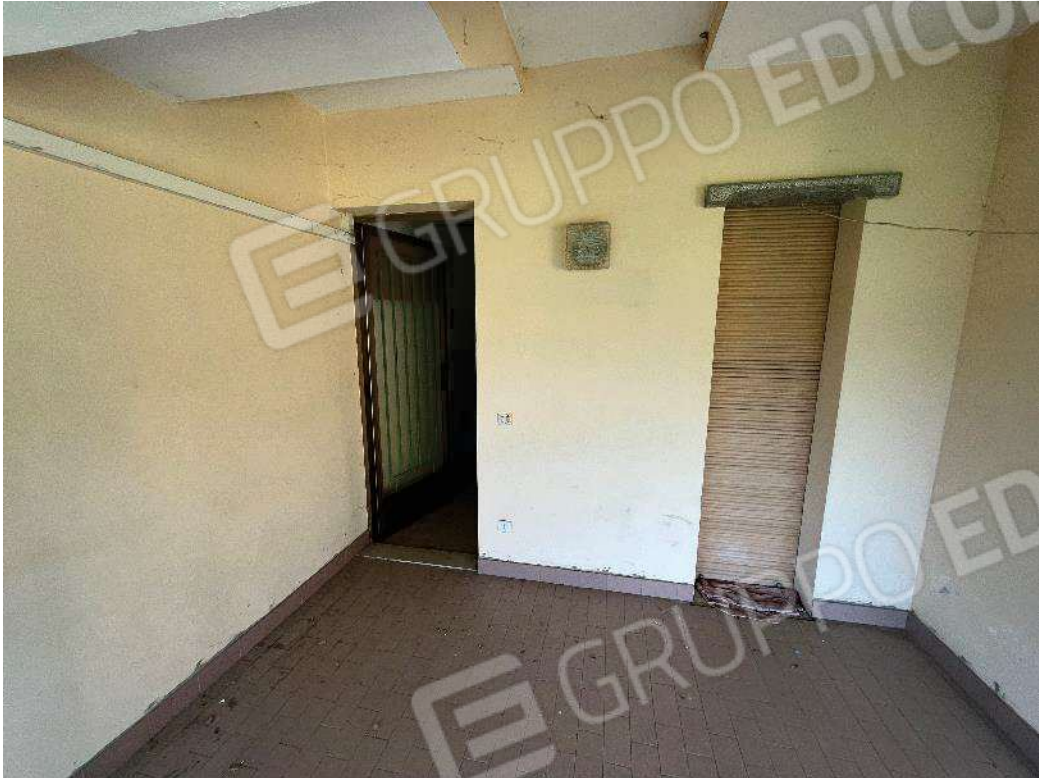
Figura 18: vista dell'ingresso dell'alloggio