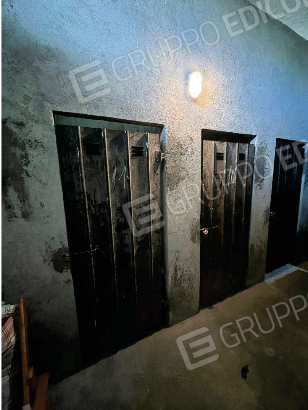
Figura 37: vista dell'ingresso della cantina (porta 10 e 11)