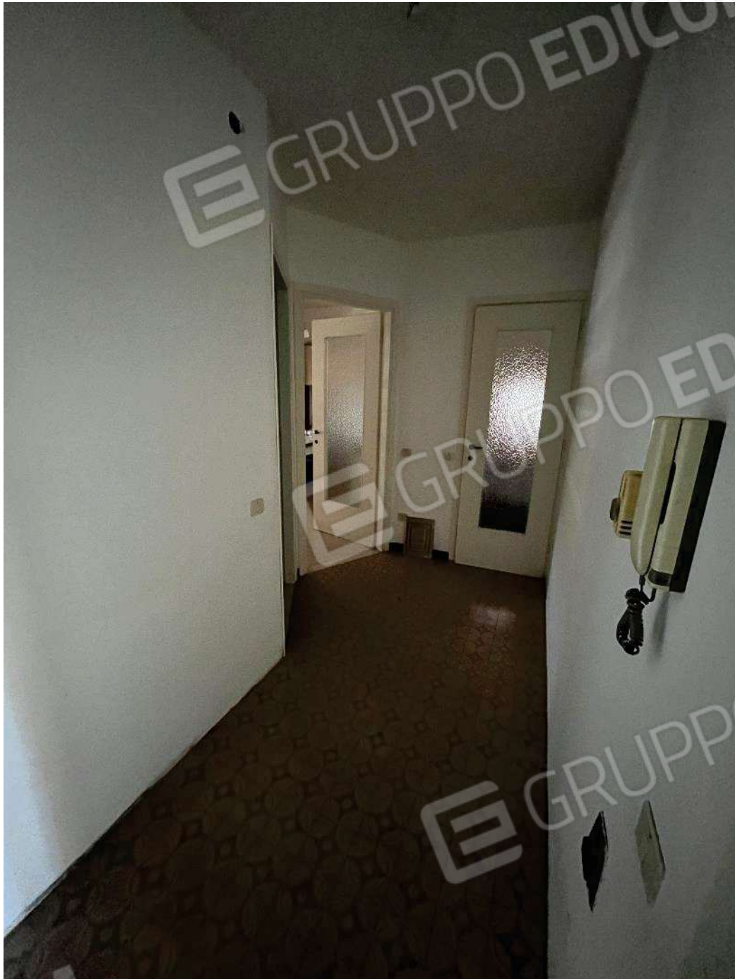
Figura 27: vista del secondo corridoio di disimpegno