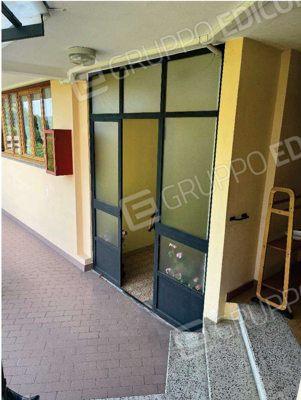
Figura 11: vista dell'accesso al ballatoio comune