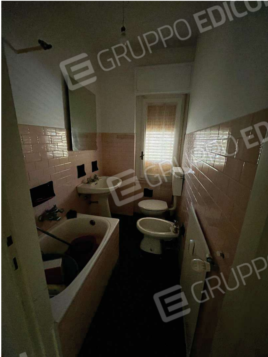
Figura 30: vista del secondo bagno