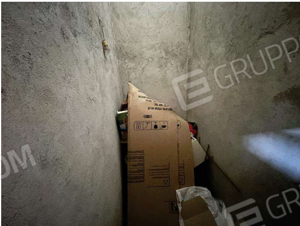
Figura 39: vista della cantina