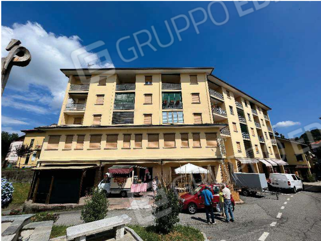
Figura 6: vista sul fabbricato e sull'alloggio dalla piazza Durio