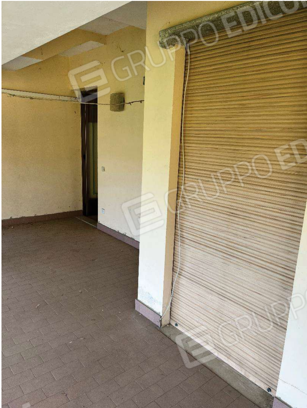
Figura 16: vista del balcone coperto e dell'ingresso dell'alloggio