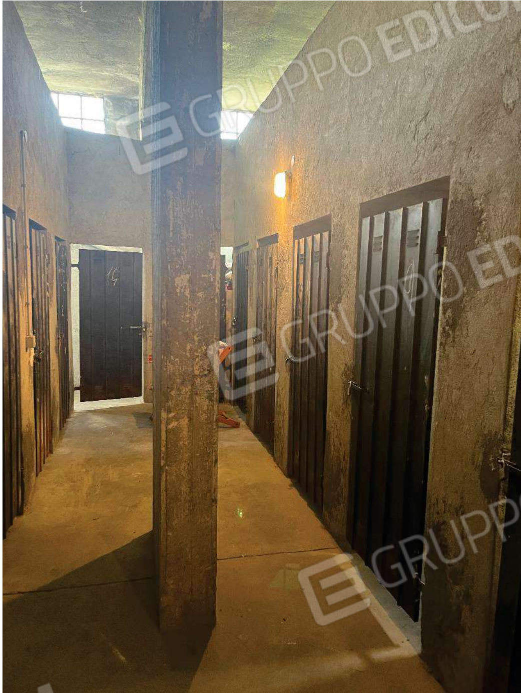
Figura 36: vista dell'accesso comune alle cantine