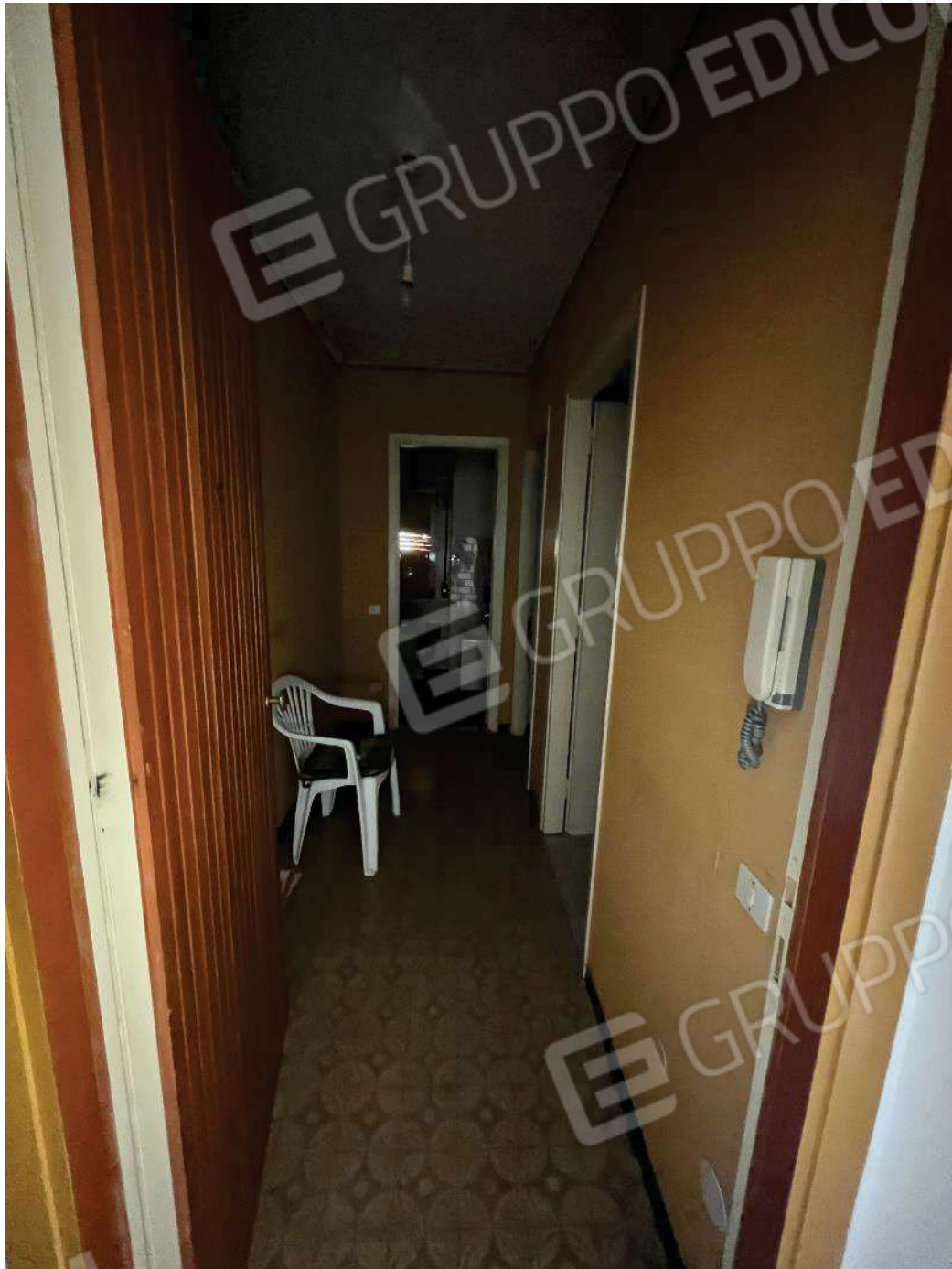
Figura 26: vista del primo corridoio di disimpegno