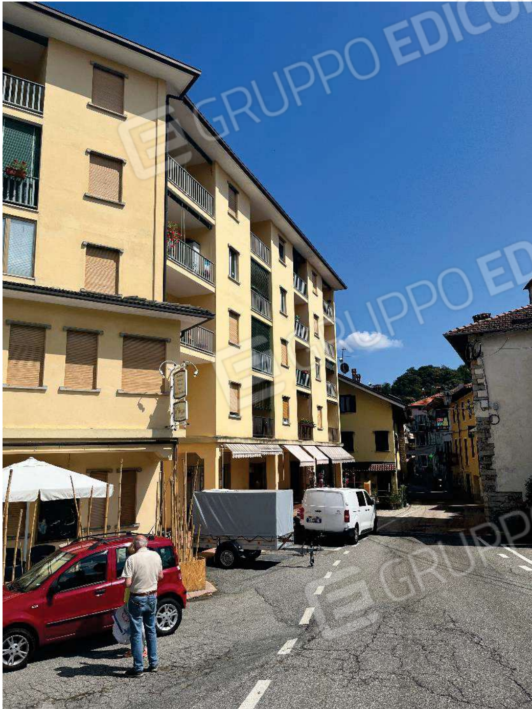
Figura 7: vista della facciata principale del fabbricato