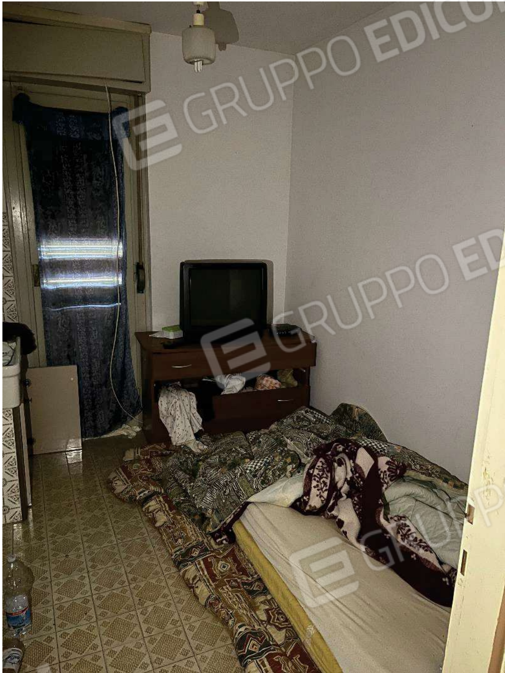
Figura 21: vista della prima camera (indicata come cucina)