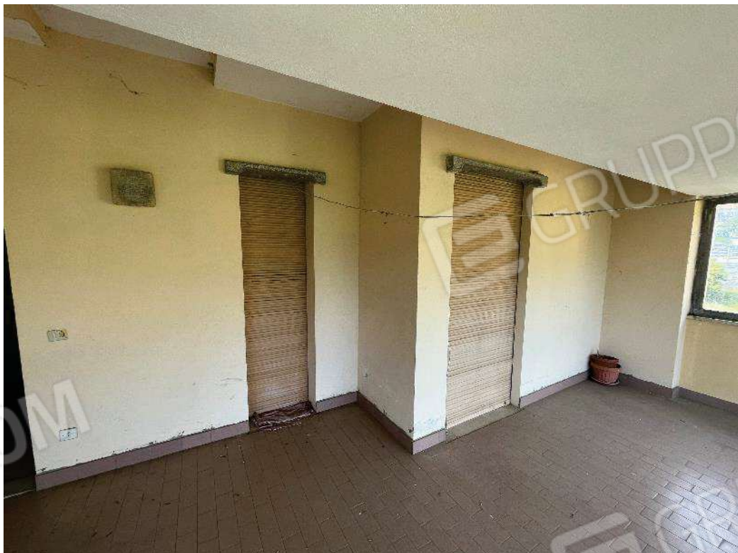
Figura 15: vista del balcone coperto