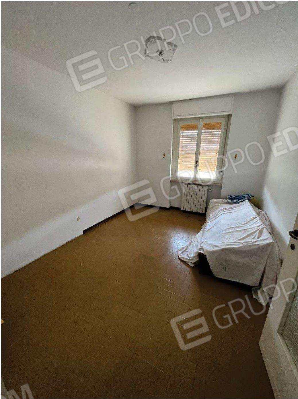
Figura 34: vista della terza camera