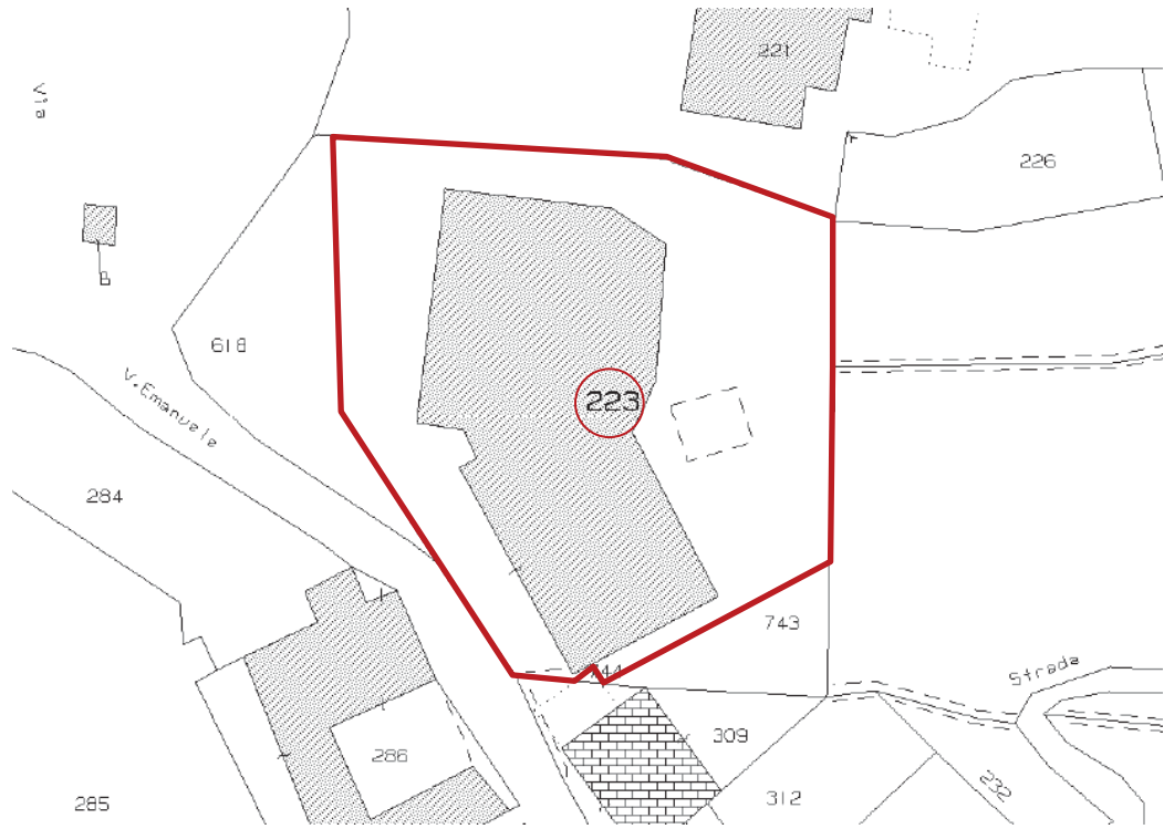
Figura 2: individuazione del fabbricato su estratto di mappa catasto terreni