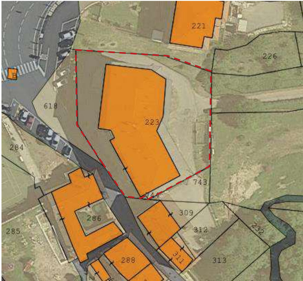
Figura 3: individuazione del fabbricato su base ortofoto, con sovrapposta mappa catastale terreni