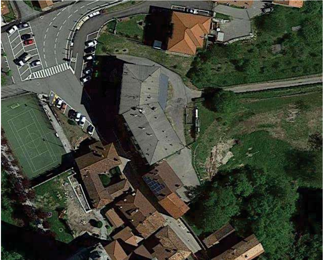
Figura 4: individuazione del fabbricato su base ortofoto