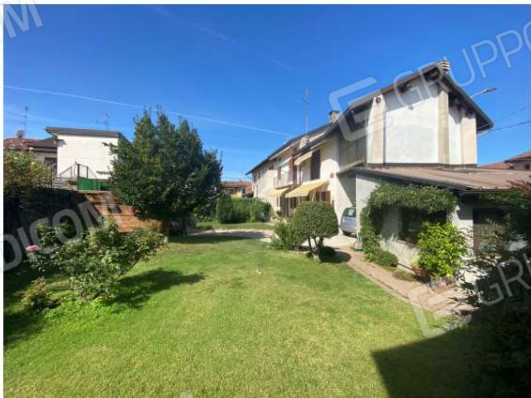
FOTO 20 : VISTA ESTERNA DELL'INTERNO IMMOBILE DA LATO CORTILE ESCLUSIVO