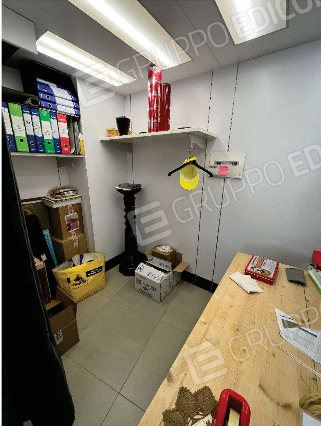
Figura 22: vista retronegozio