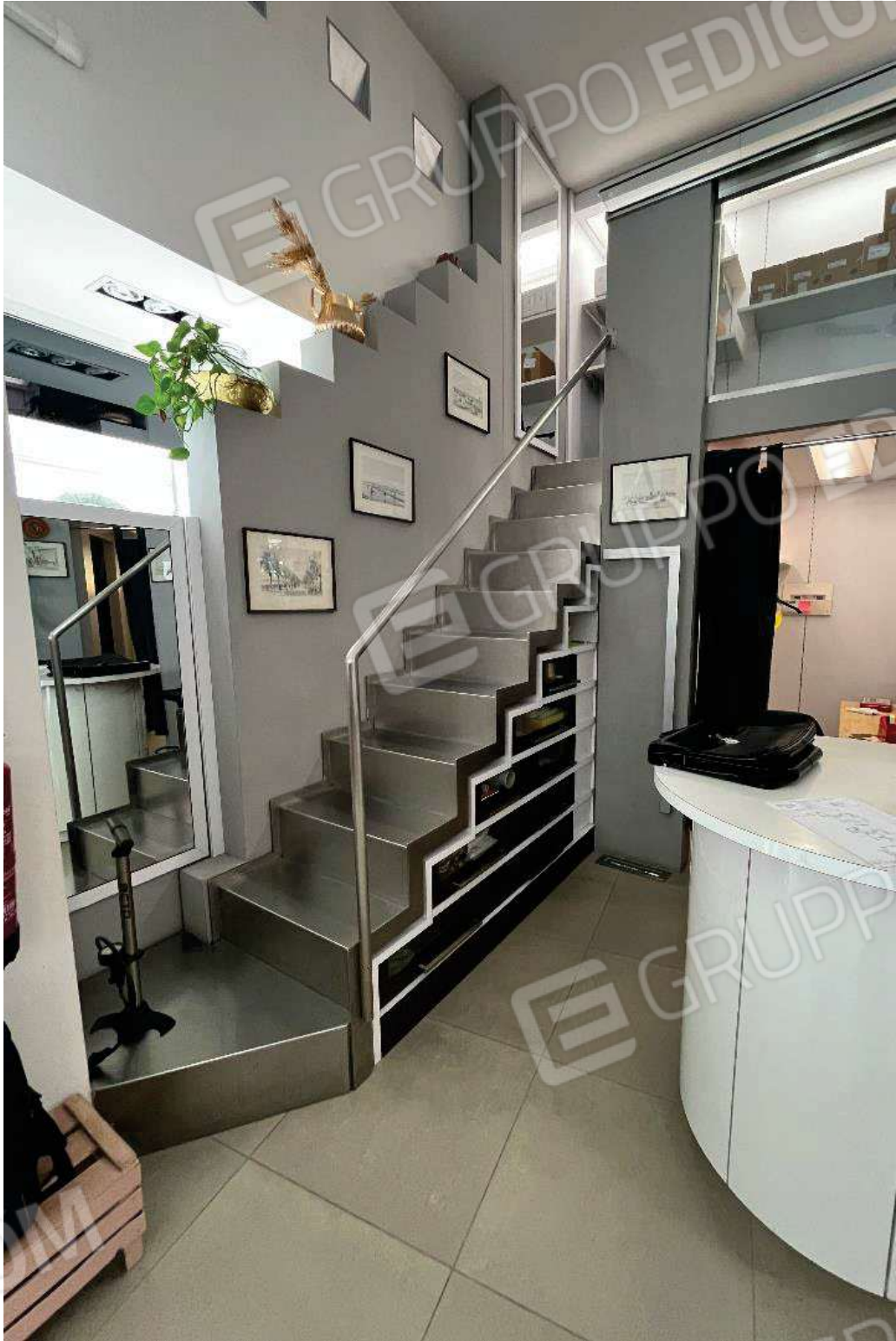
Figura 9: vista del locale principale