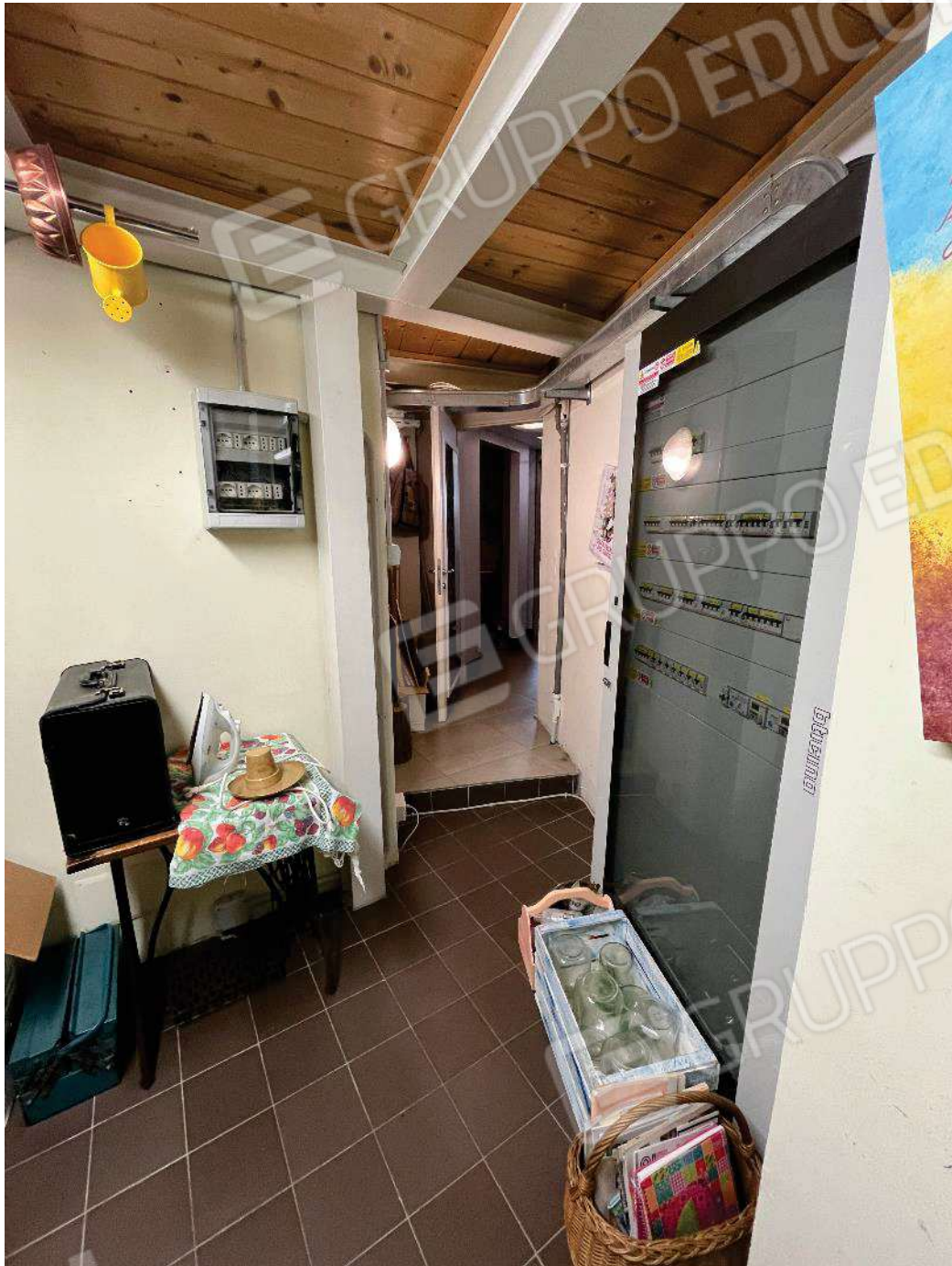
Figura 27: vista retronegozio