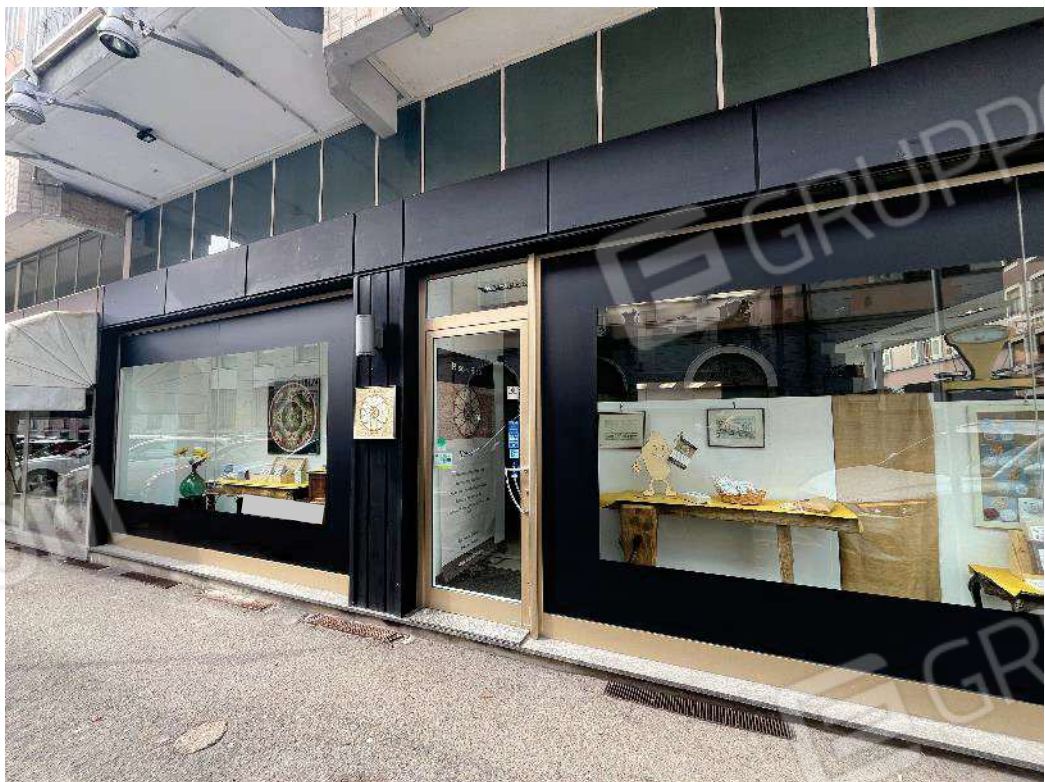
Figura 3: vista della vetrina del negozio e dell'ingresso dalla via Cesare Balbo