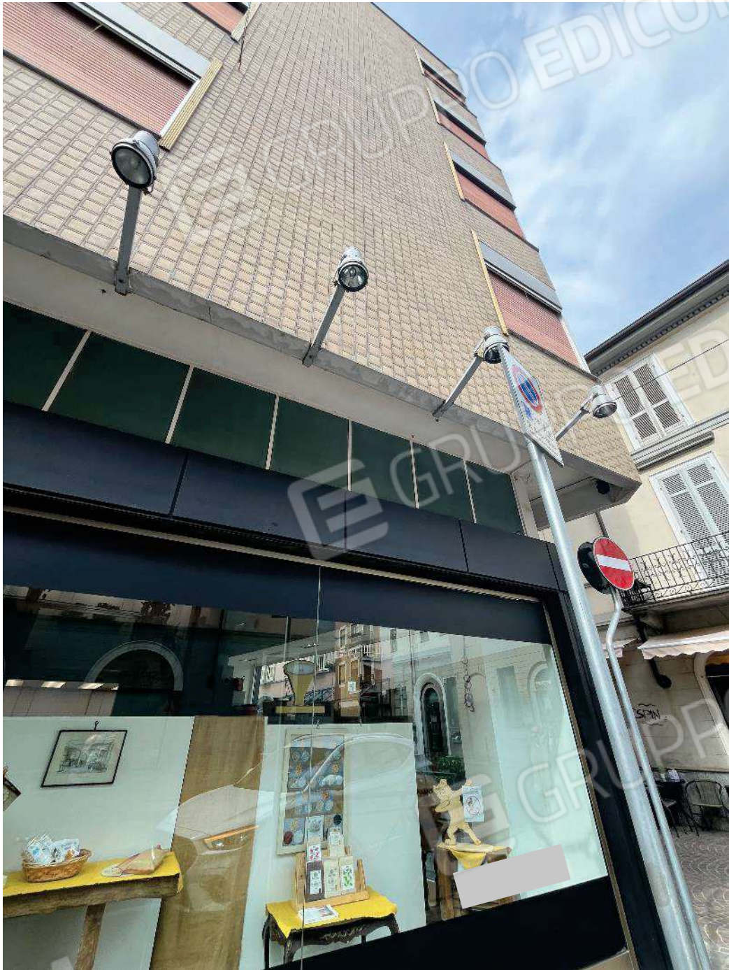
Figura 7: dettaglio vetrina via Cesare Balbo