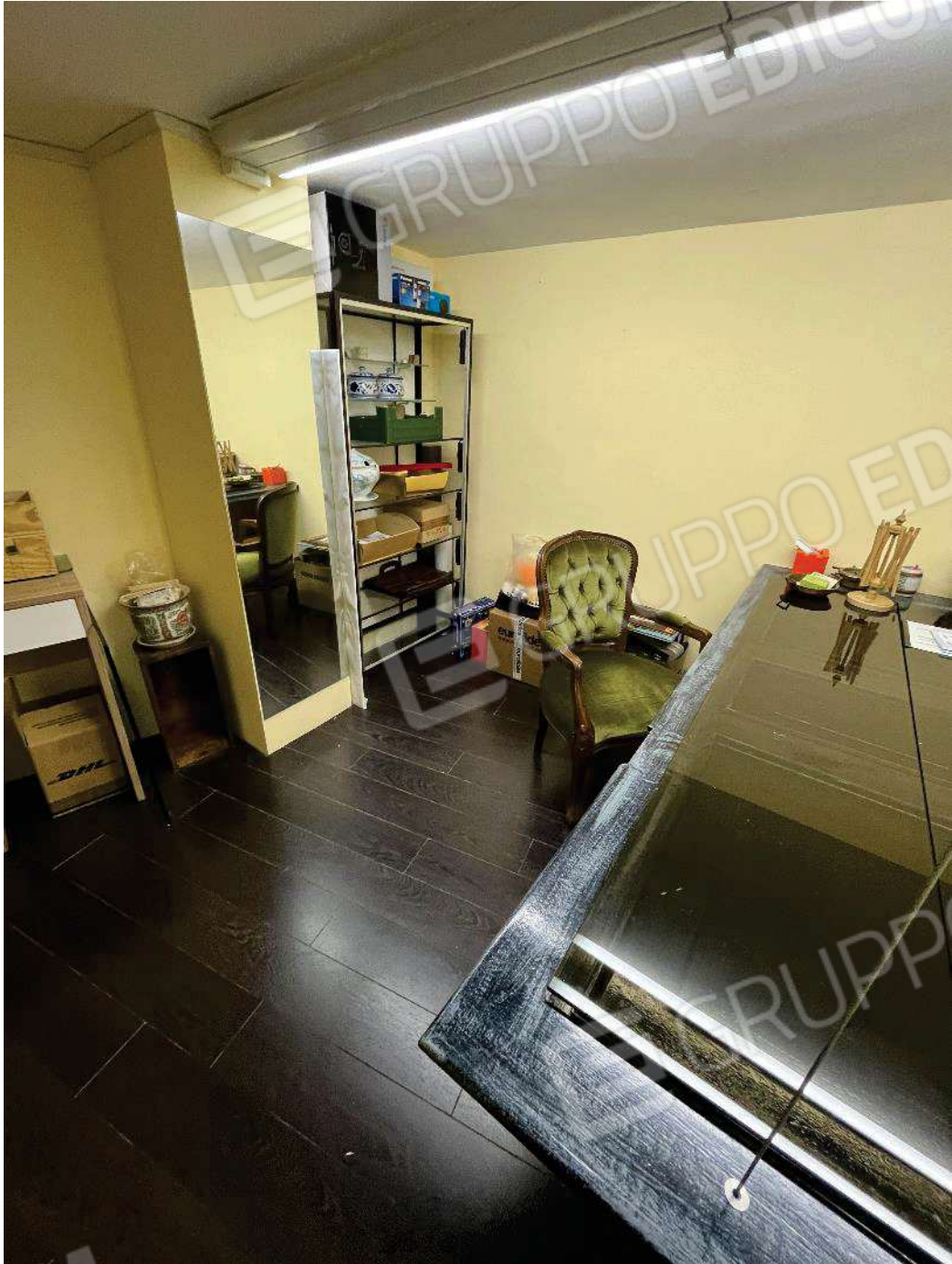
Figura 37: vista locale tecnico