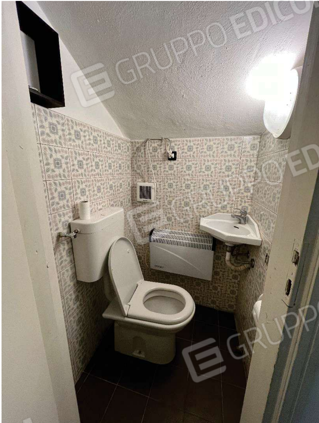
Figura 30: vista gabinetto