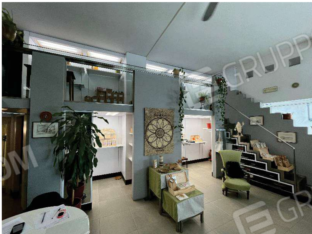
Figura 13: vista del prospetto del fabbricato dalla salita Sant'Anna