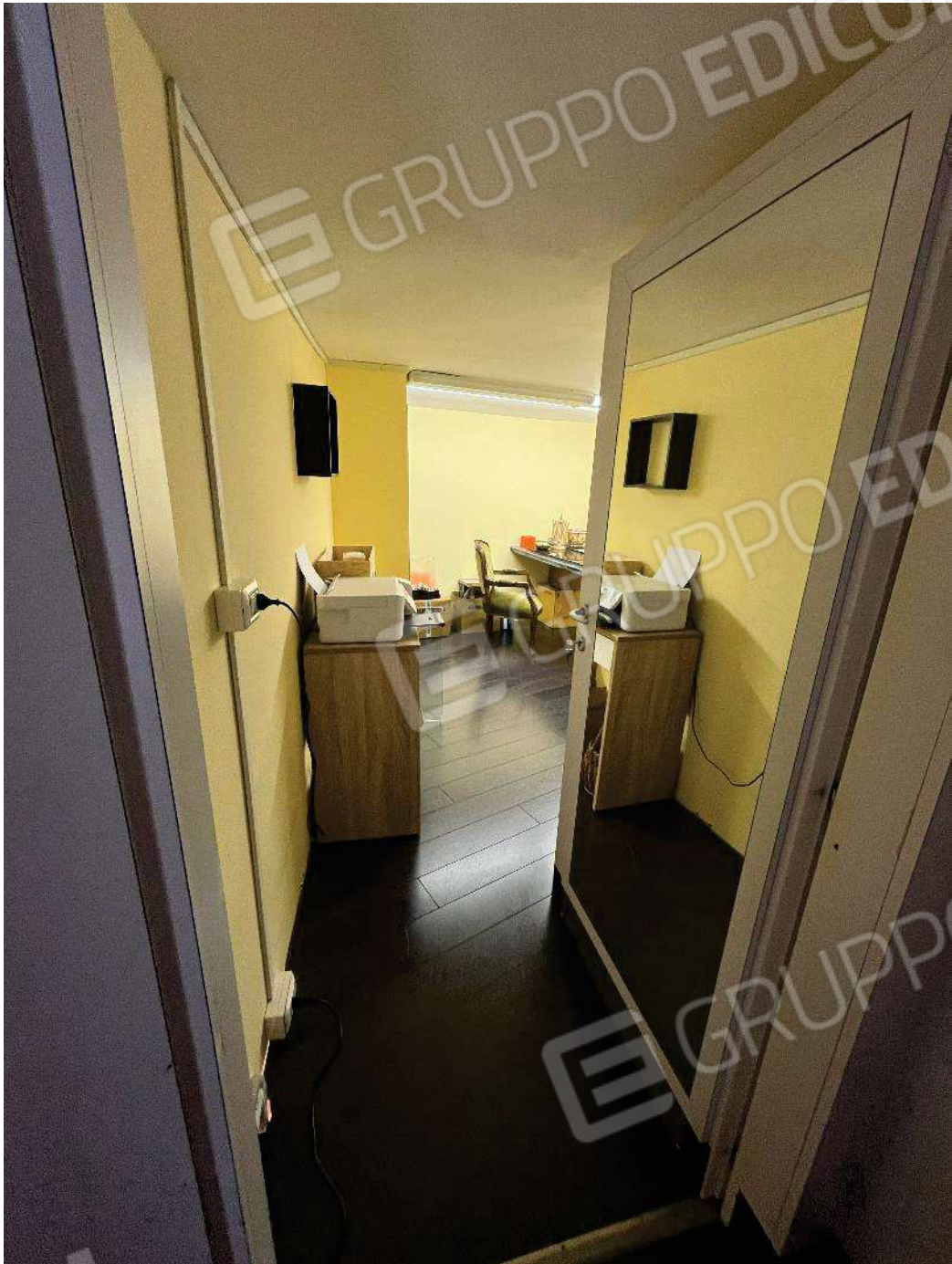
Figura 36: vista locale tecnico