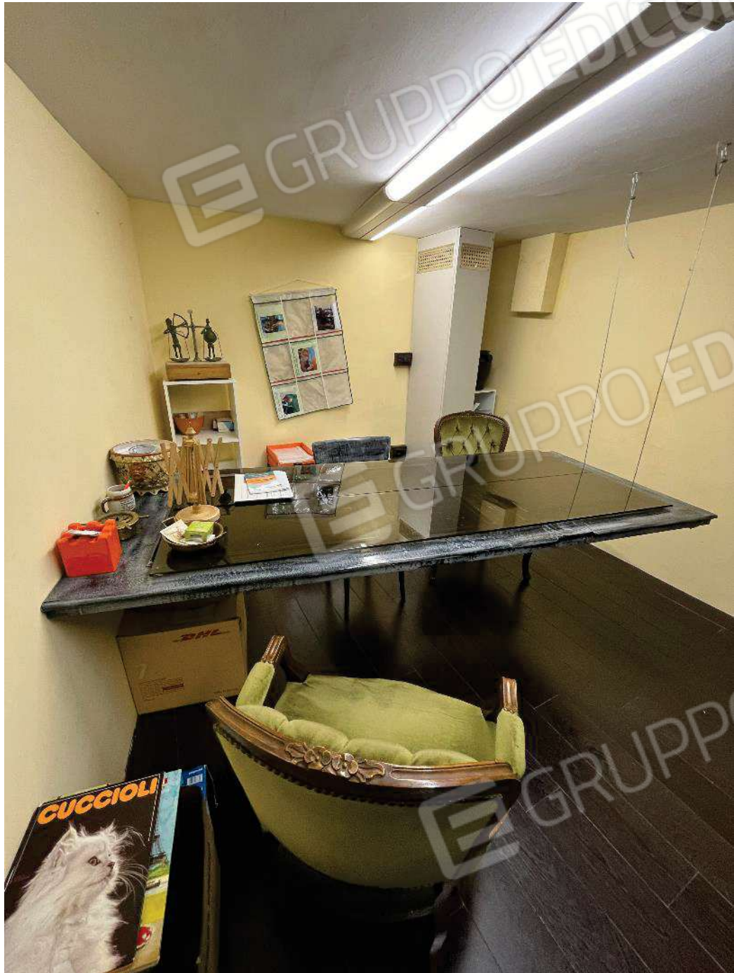
Figura 38: vista locale tecnico