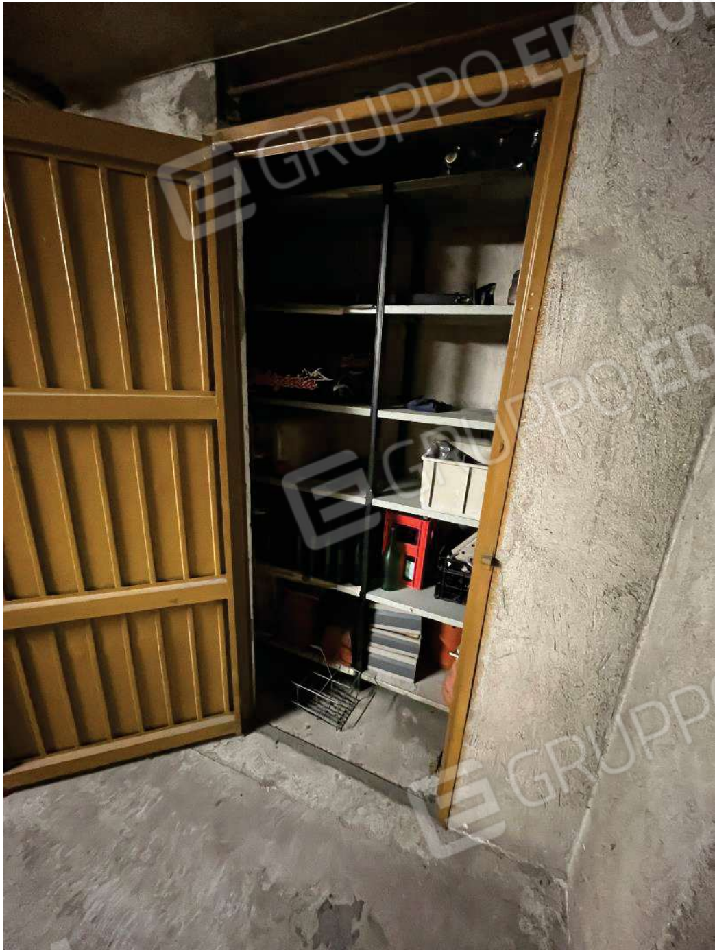
Figura 40: vista cantina