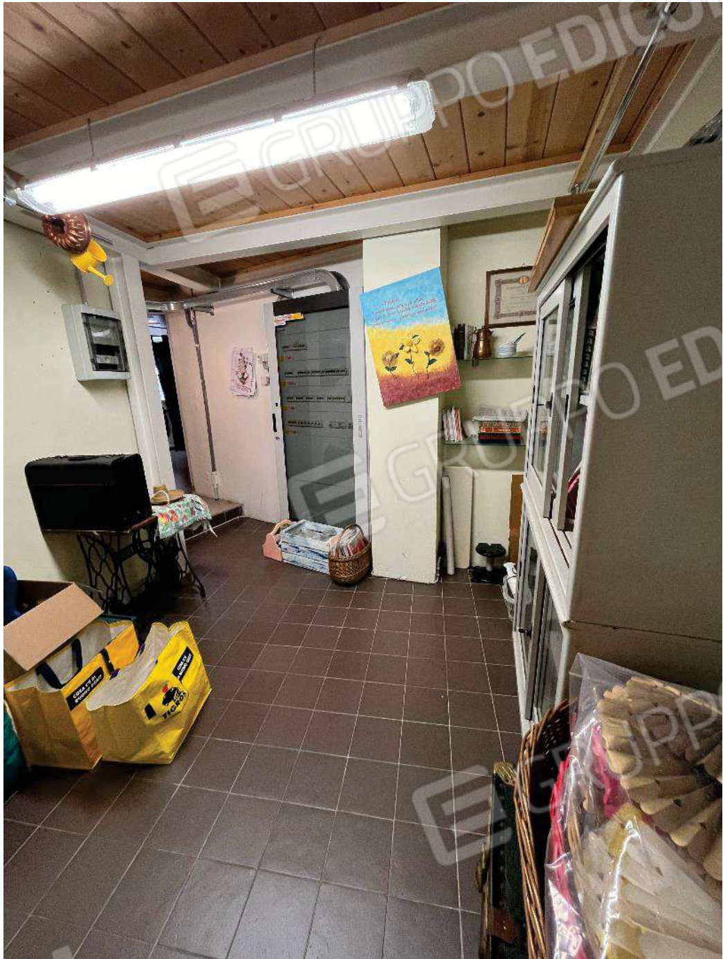
Figura 26: vista retronegozio