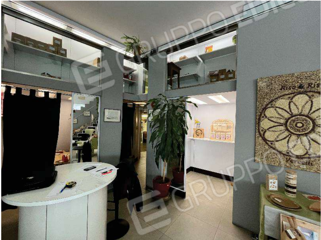
Figura 16: vista del sotto soppalco