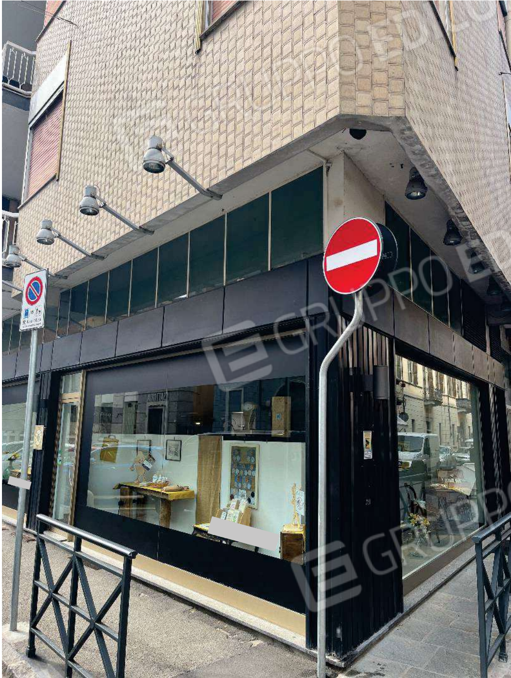
Figura 4: vista della doppia esposizione delle vetrine