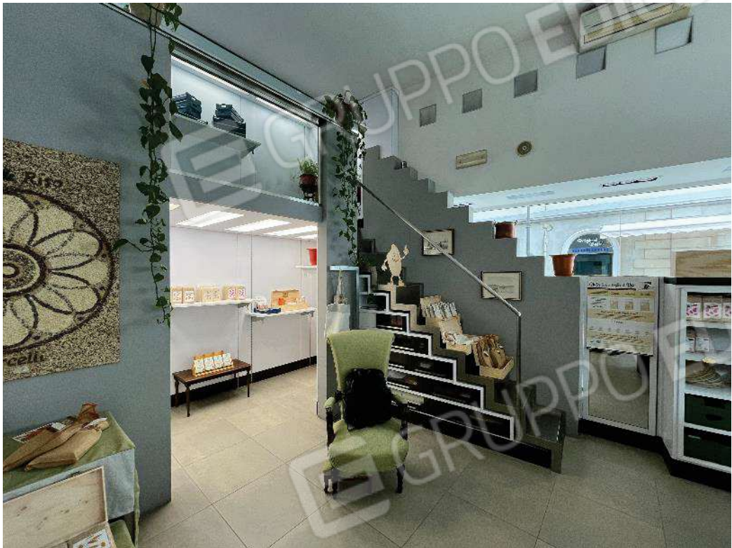
Figura 14: vista del locale principale e scala soppalco