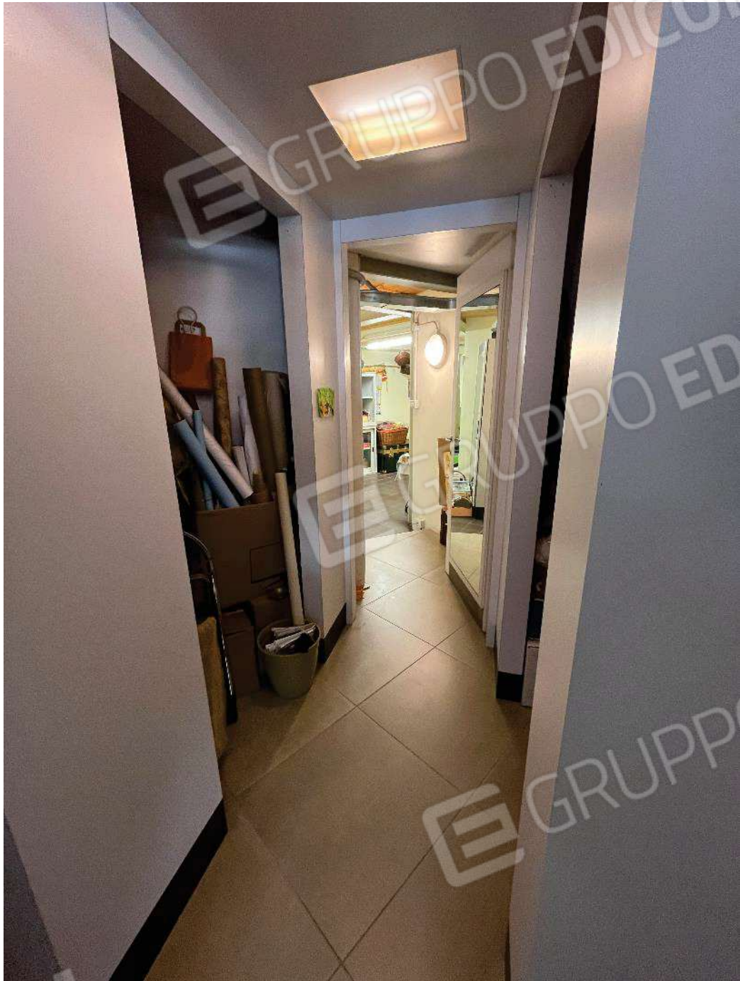
Figura 21: vista retronegozio