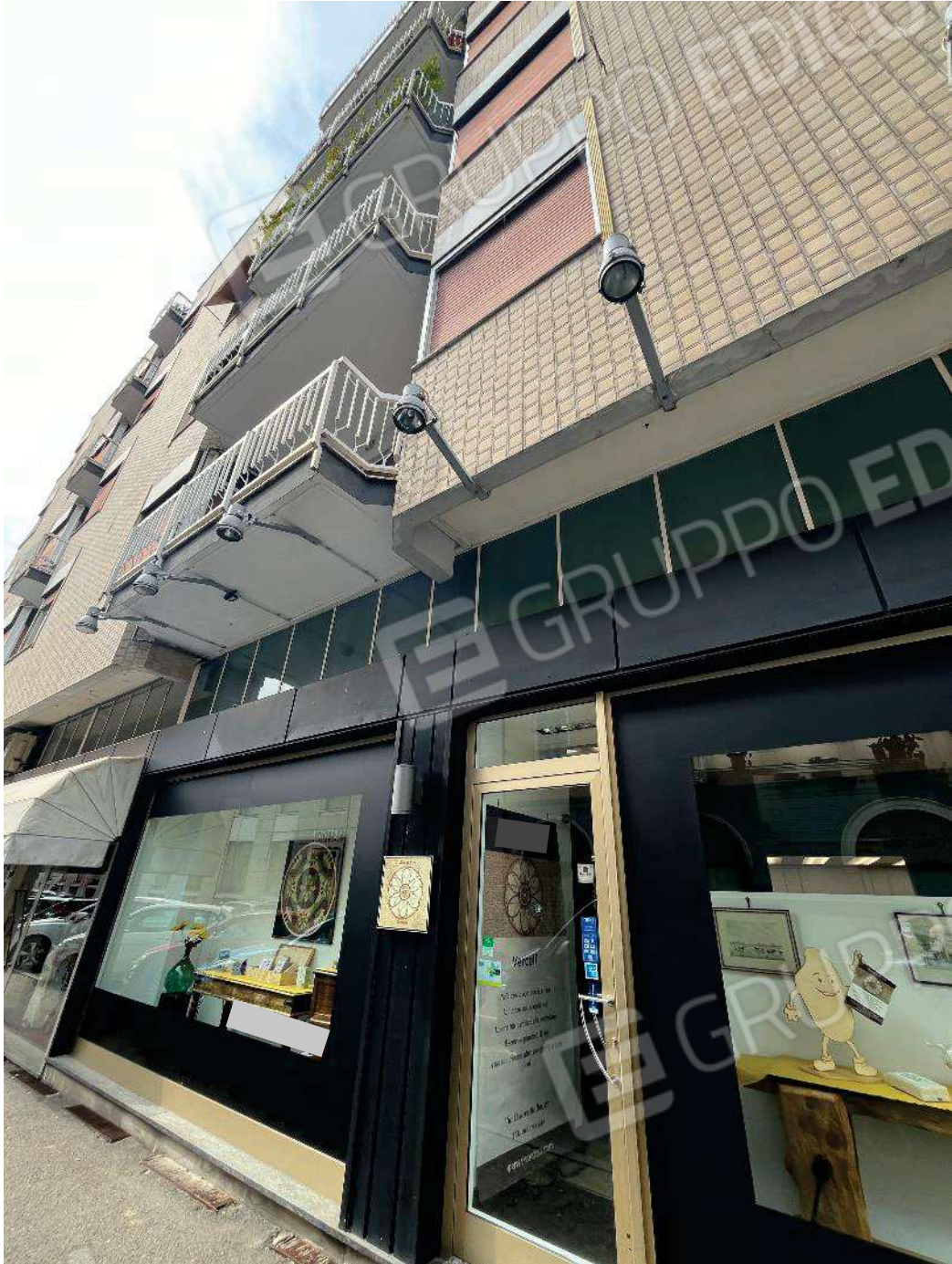
Figura 6: vista d'insieme del bene e suo inserimento nel fabbricato sulla via Cesare Balbo