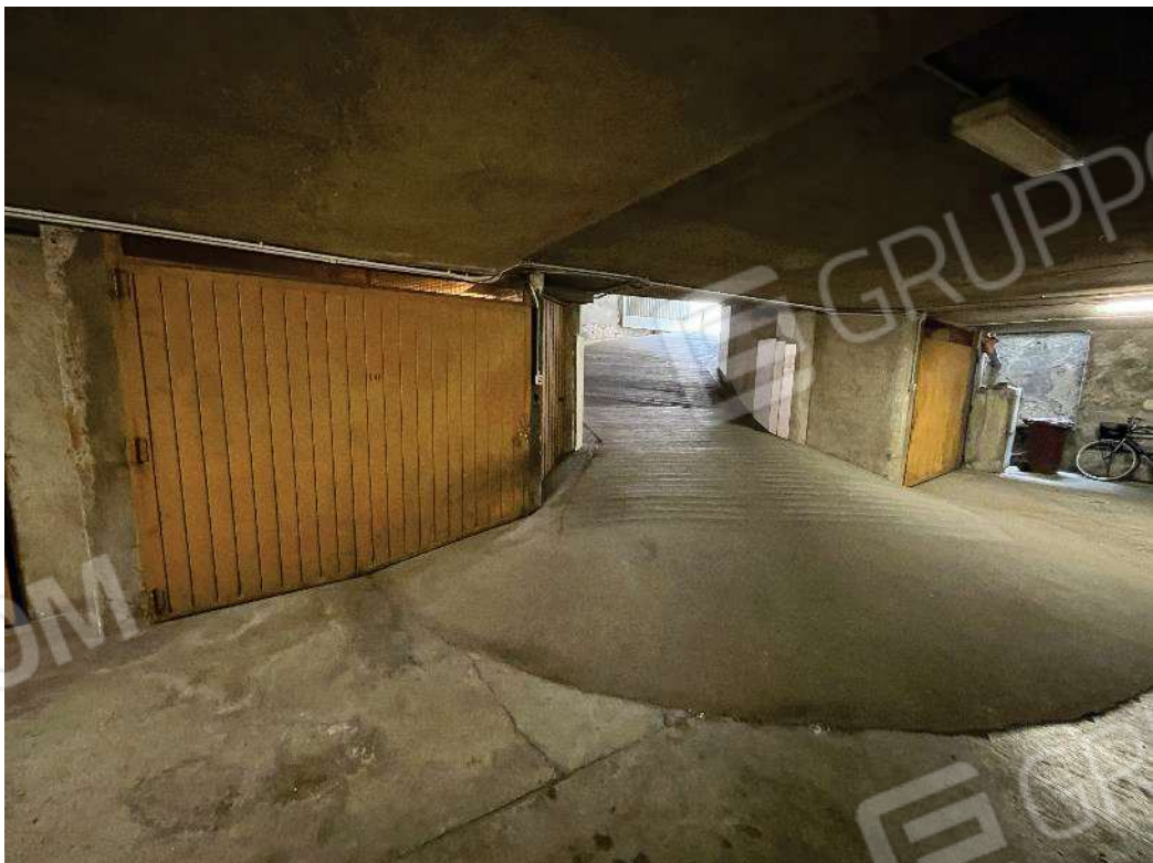
Figura 42: vista area rimesse