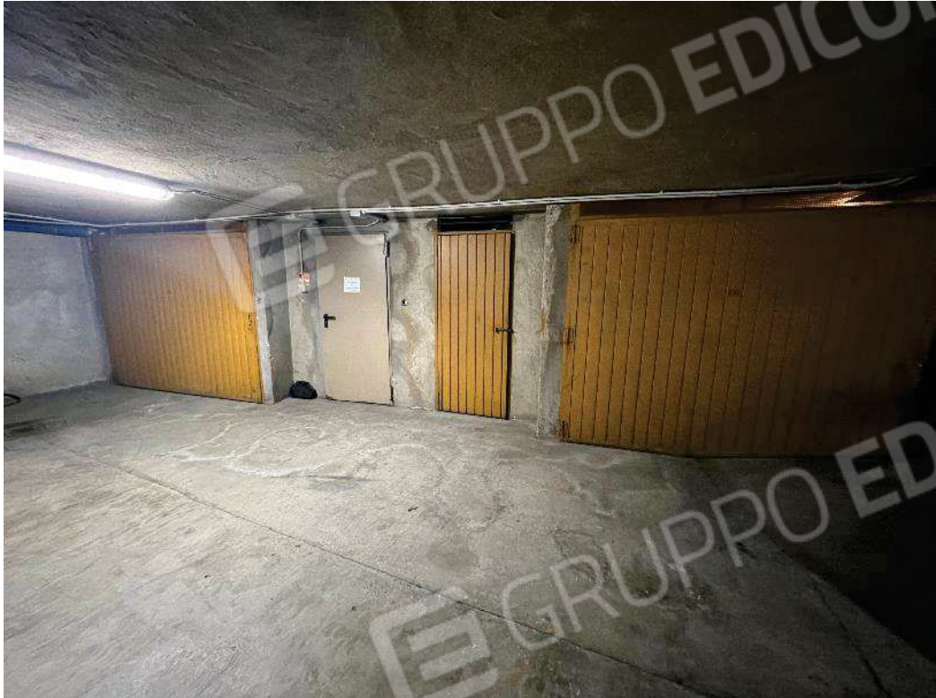
Figura 41: vista cantina