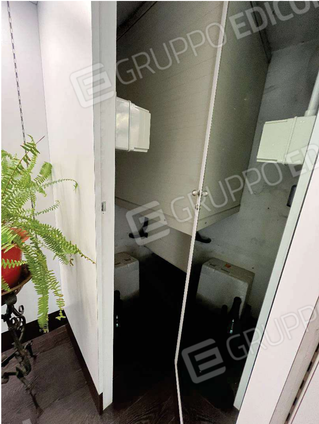
Figura 34: vista soppalco