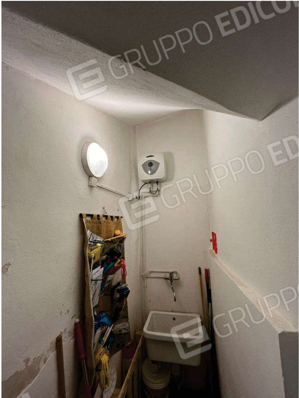
Figura 29: vista ripostiglio