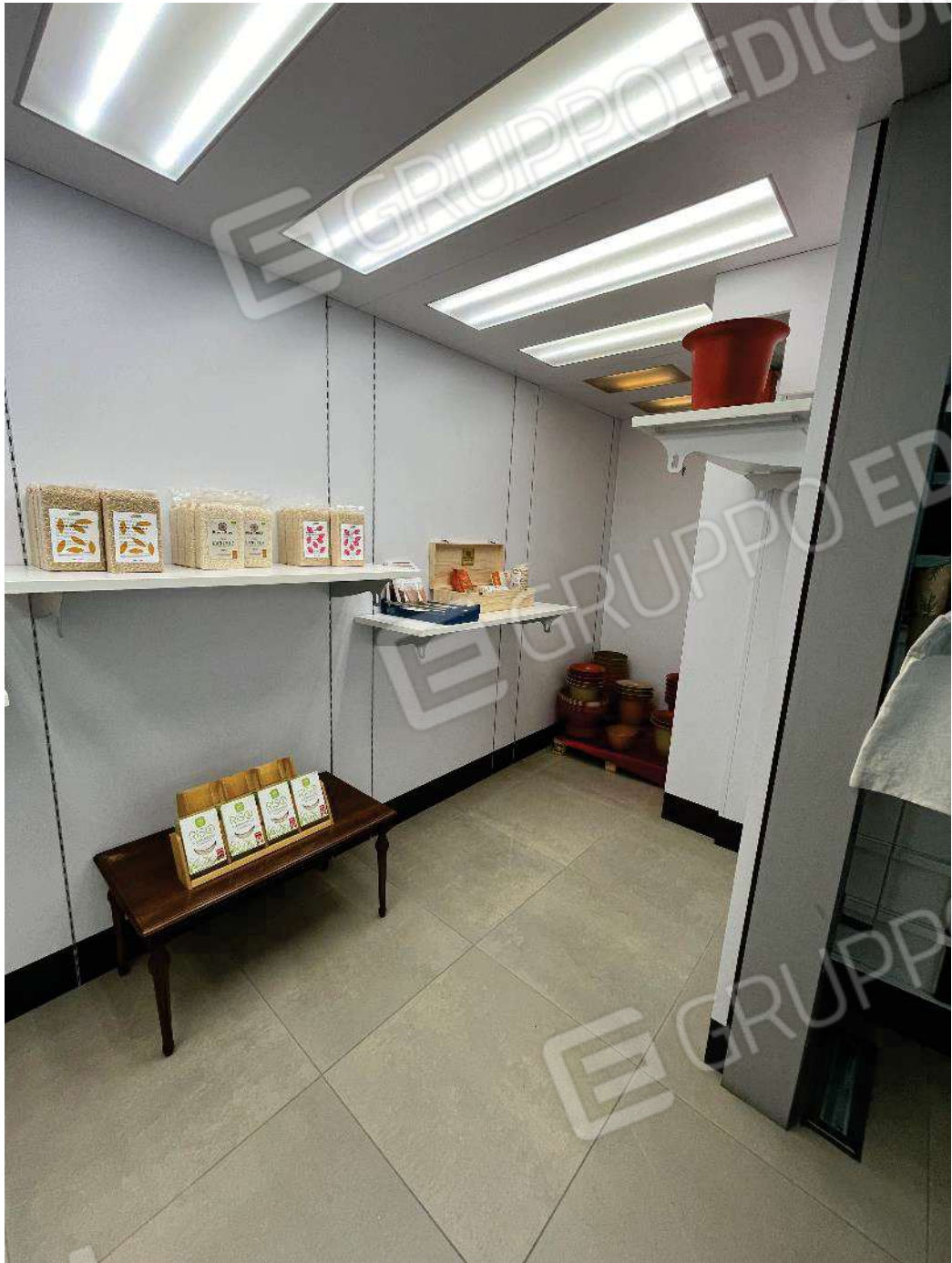
Figura 18: vista sotto soppalco