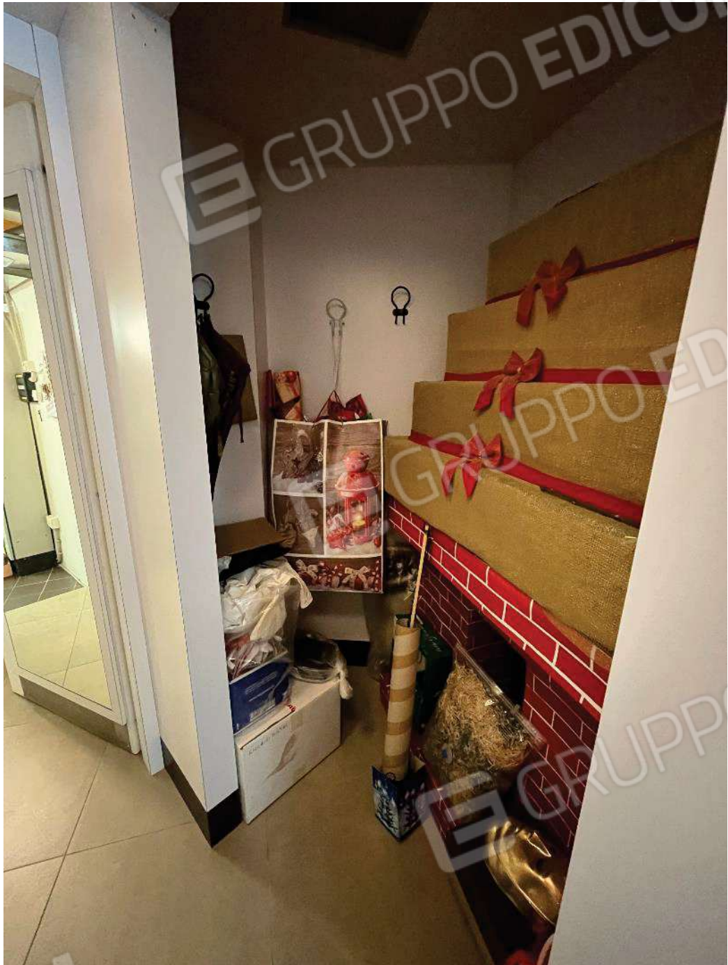
Figura 23: vista retronegozio