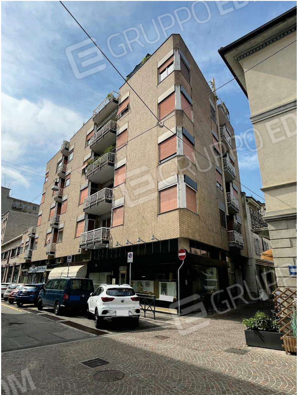
Figura 1: vista del prospetto del fabbricato condominiale