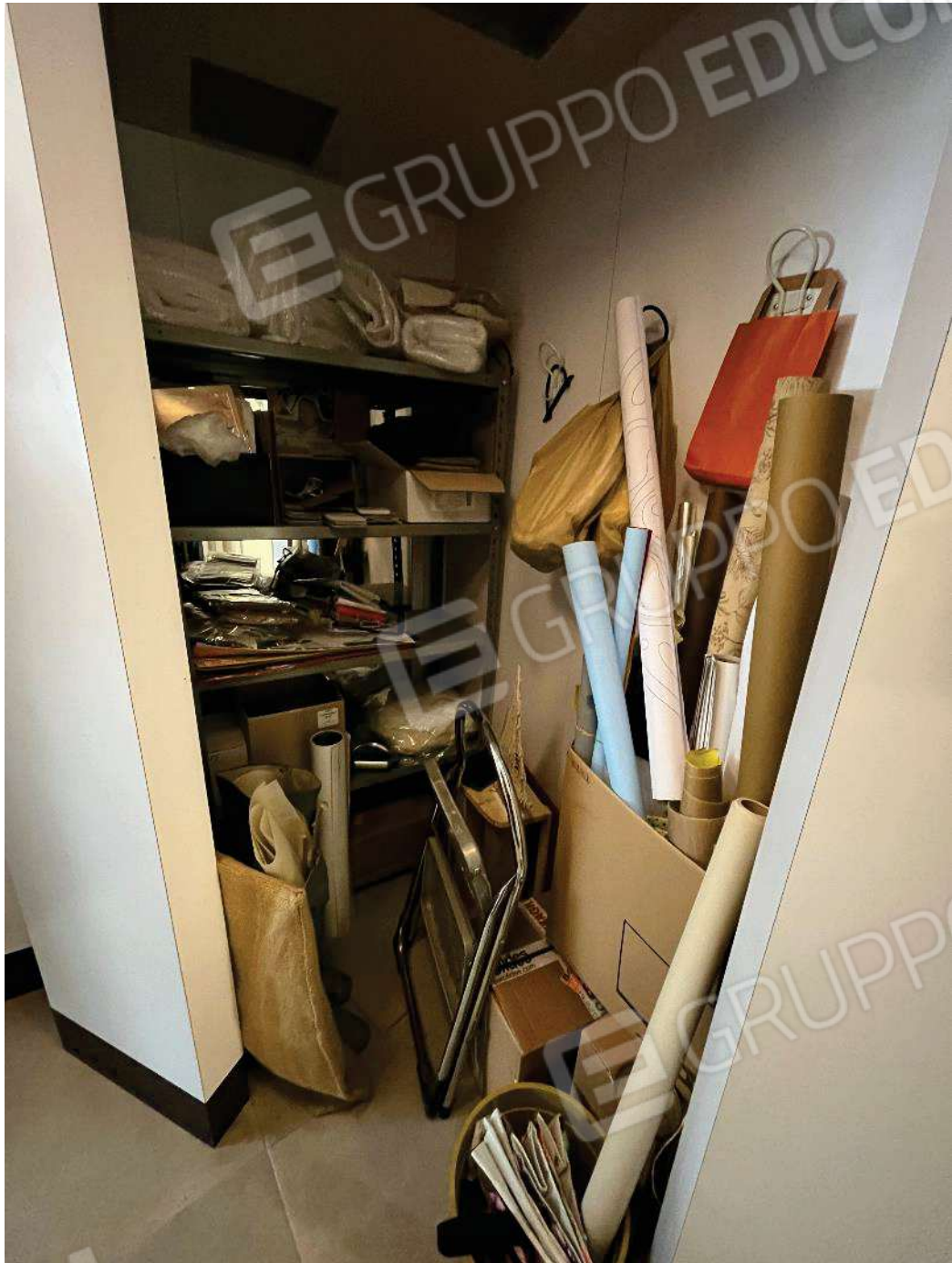
Figura 24: vista retronegozio