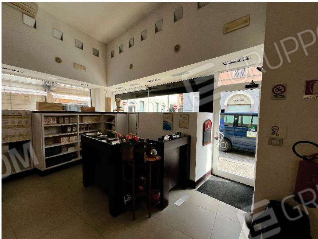
Figura 11: vista del locale principale