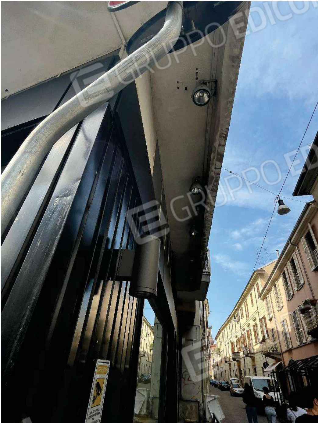
Figura 8: dettaglio illuminazione via Fratelli Laviny