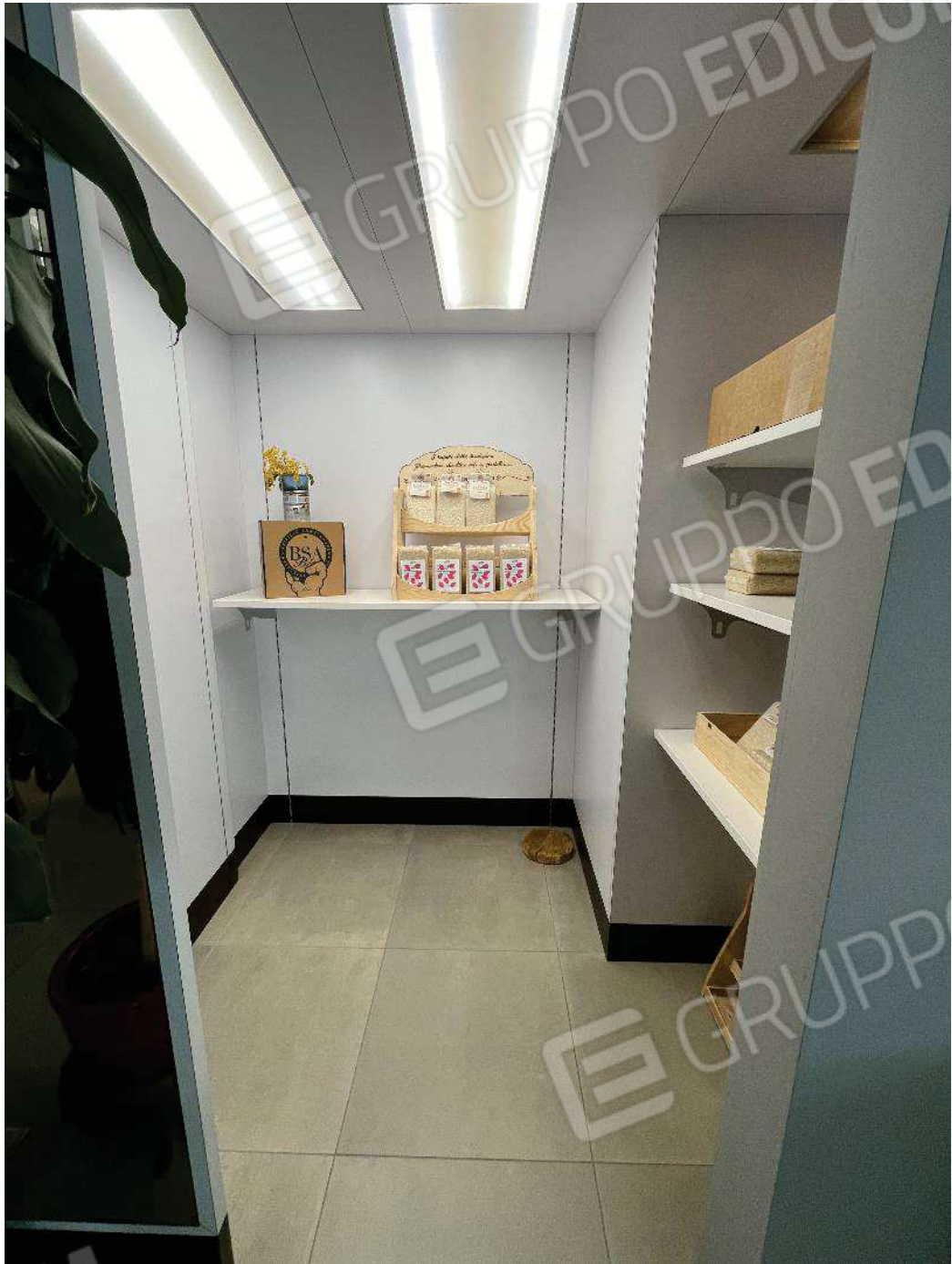
Figura 20: vista sotto soppalco