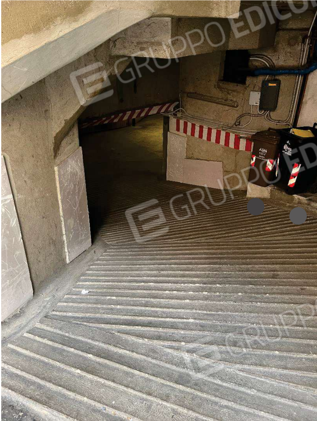
Figura 39: vista rampa ingresso rimesse