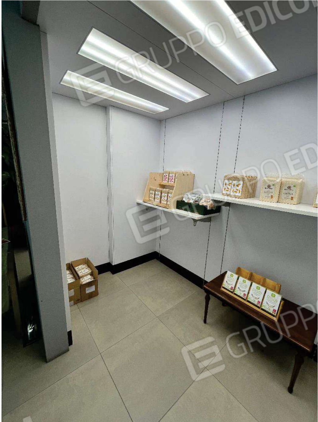
Figura 19: vista sotto soppalco