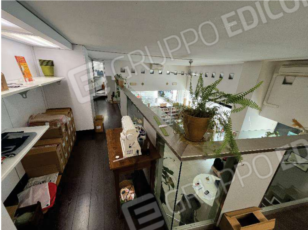
Figura 31: vista soppalco