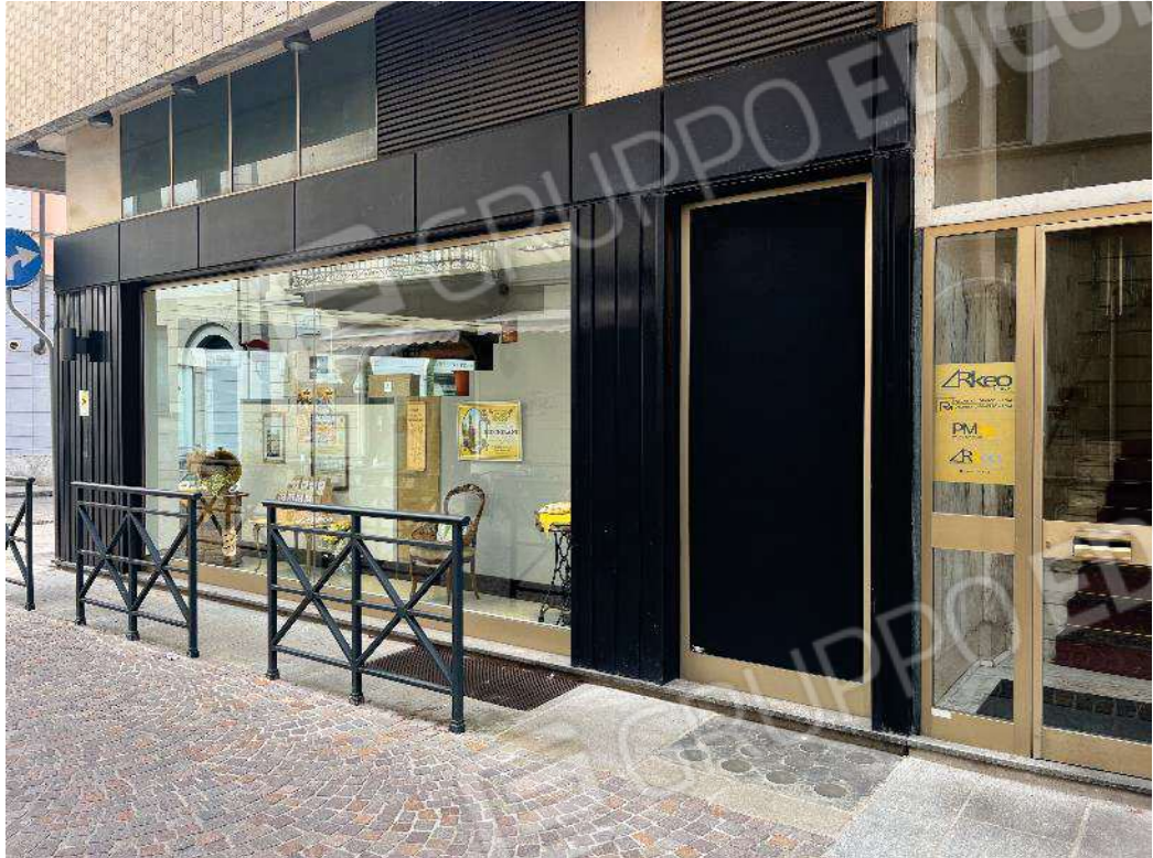
Figura 2: vista della vetrina del negozio dalla via Fratelli Laviny