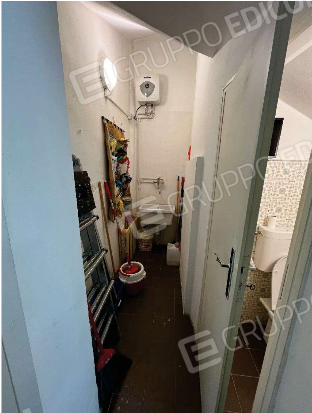
Figura 28: vista ripostiglio