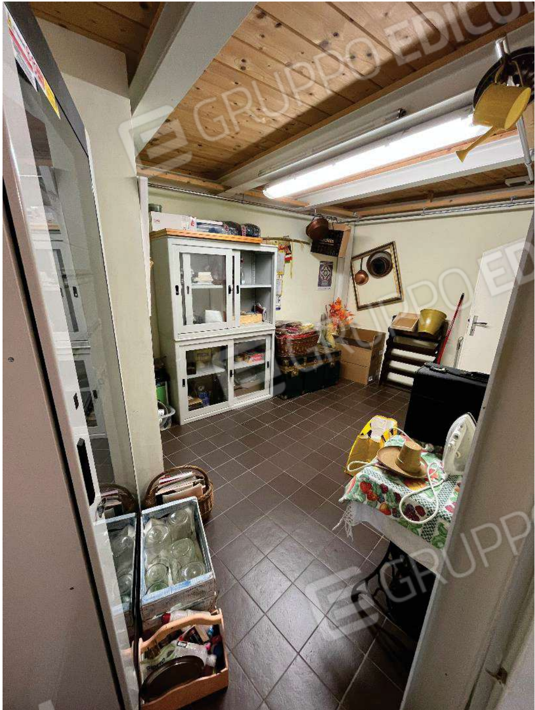
Figura 25: vista retronegozio