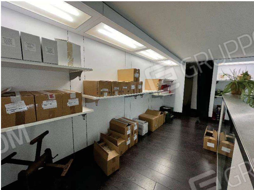
Figura 32: vista soppalco