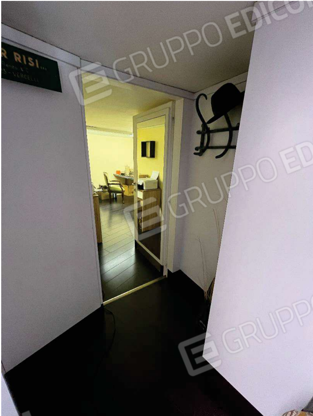
Figura 35: vista soppalco verso locale tecnico