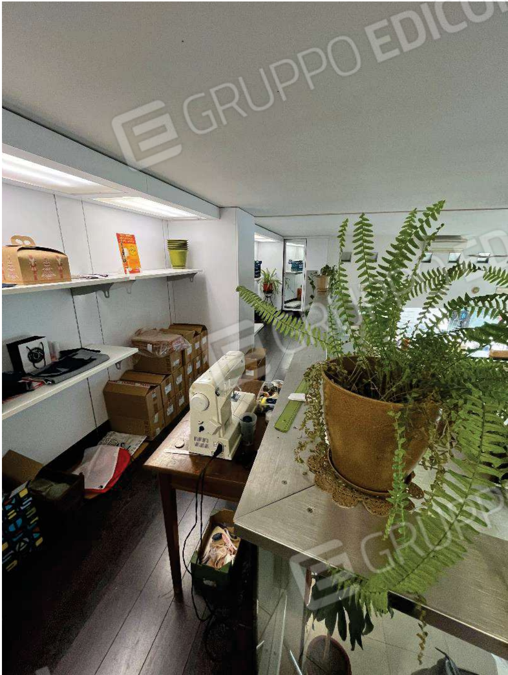
Figura 33: vista soppalco