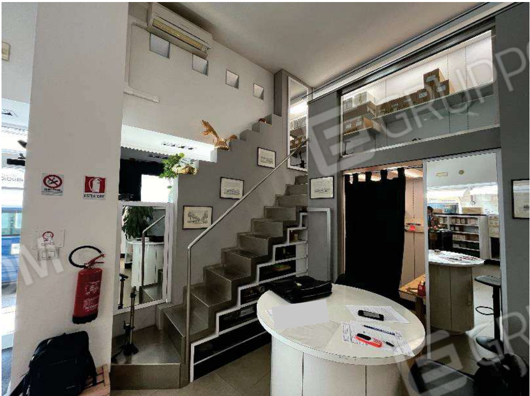
Figura 17: vista scala soppalco