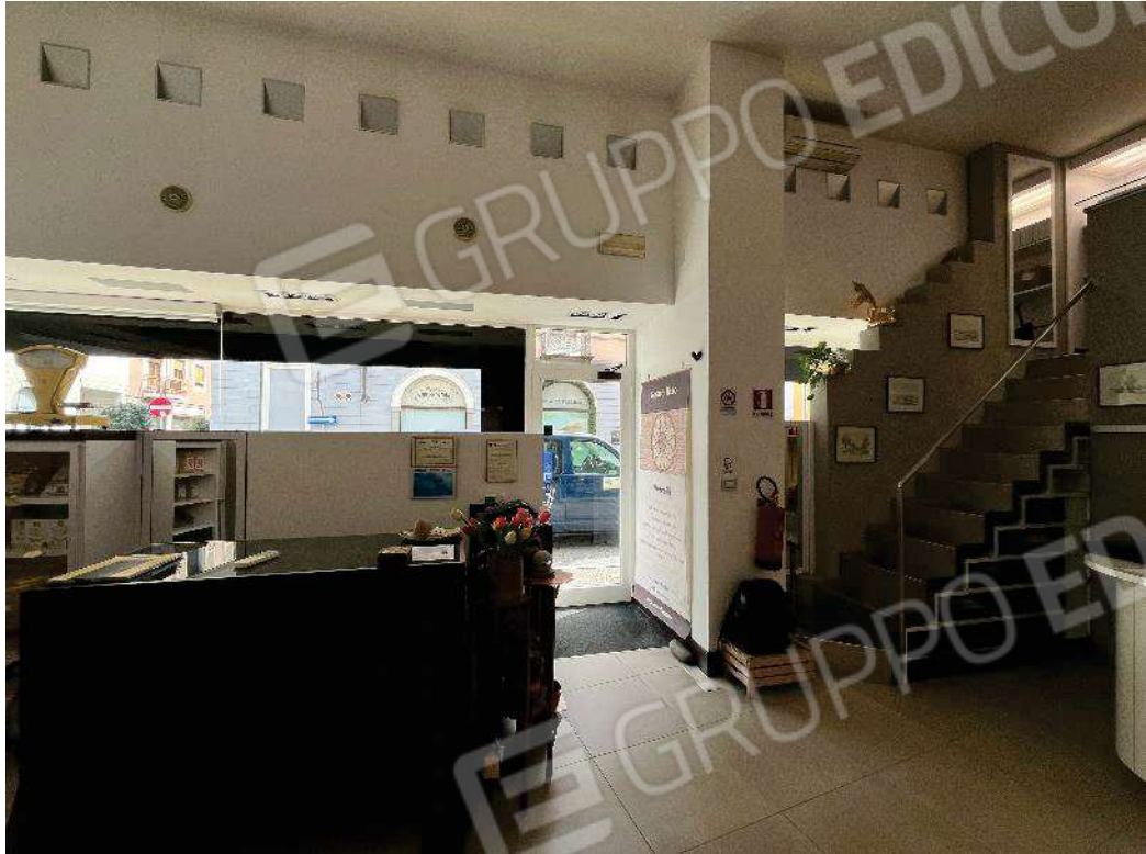
Figura 10: vista del locale principale