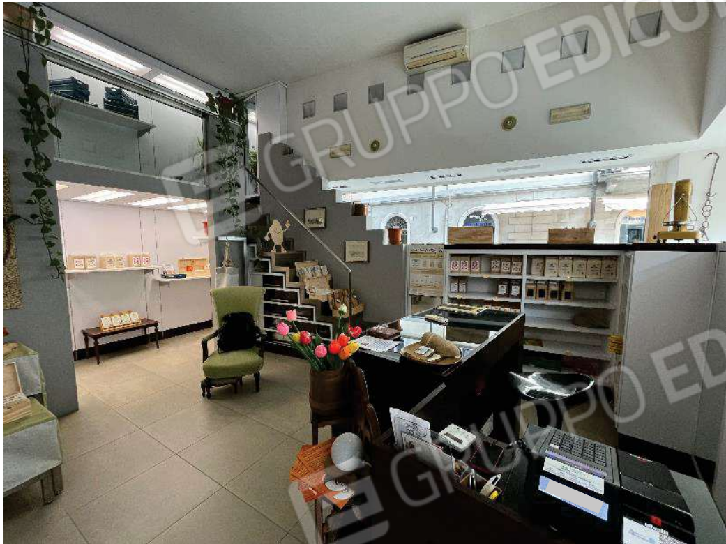
Figura 12: vista del locale principale