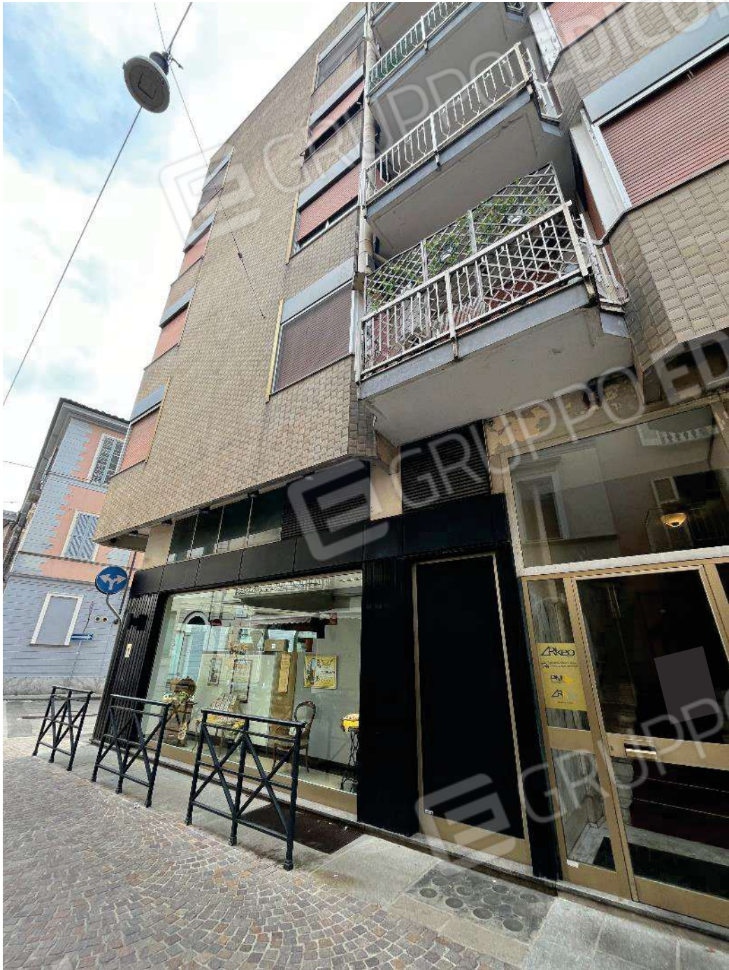
Figura 5: vista d'insieme del bene e suo inserimento nel fabbricato sulla via Fratelli Laviny