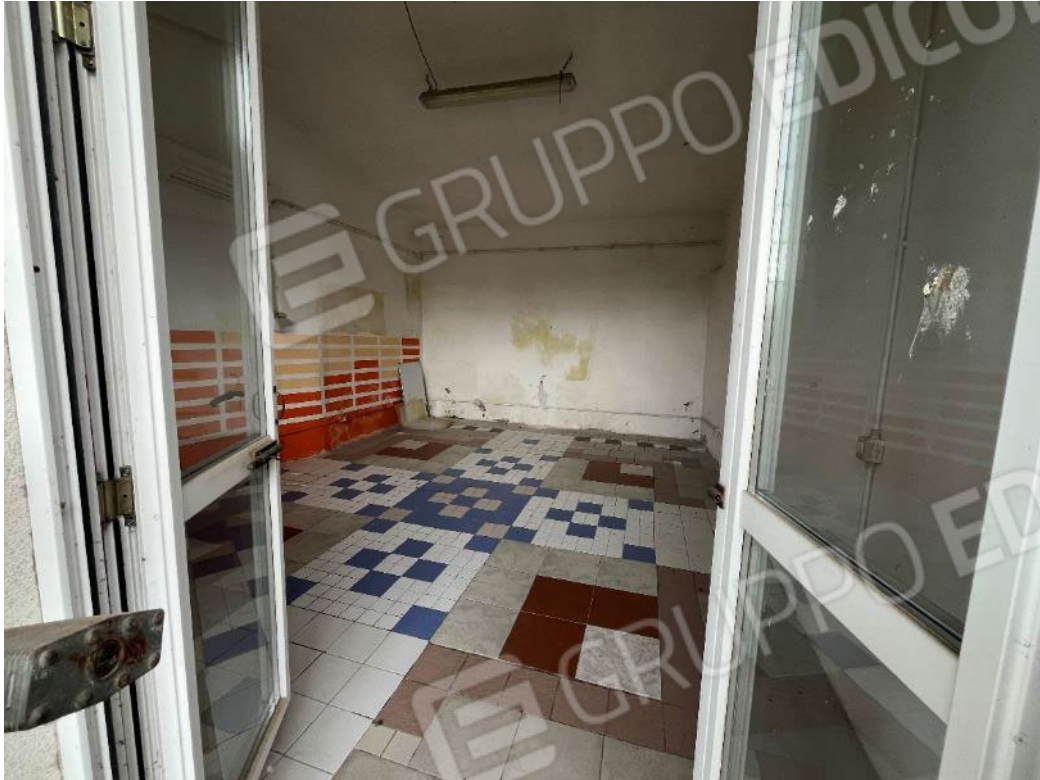
Figura 47: vista del bene 2