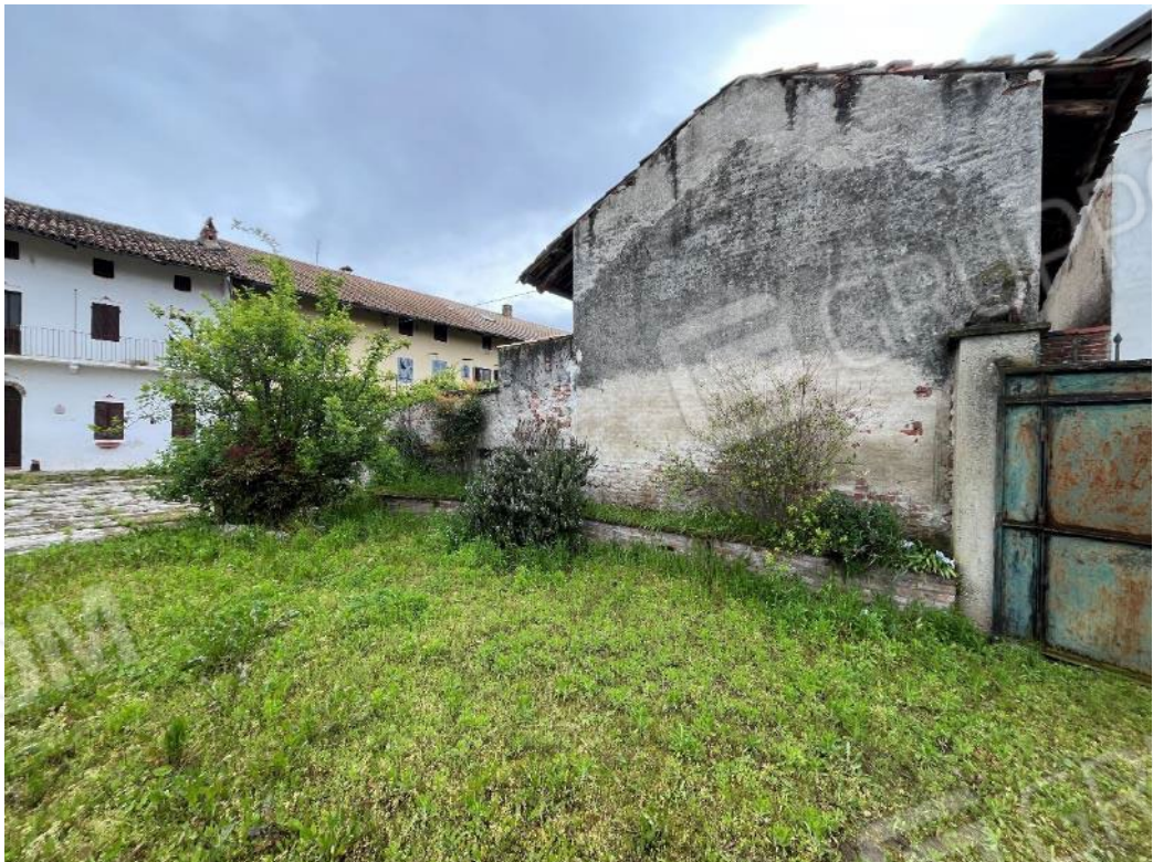
Figura 4: vista sul fabbricato posto lungo il confine sud-ovest