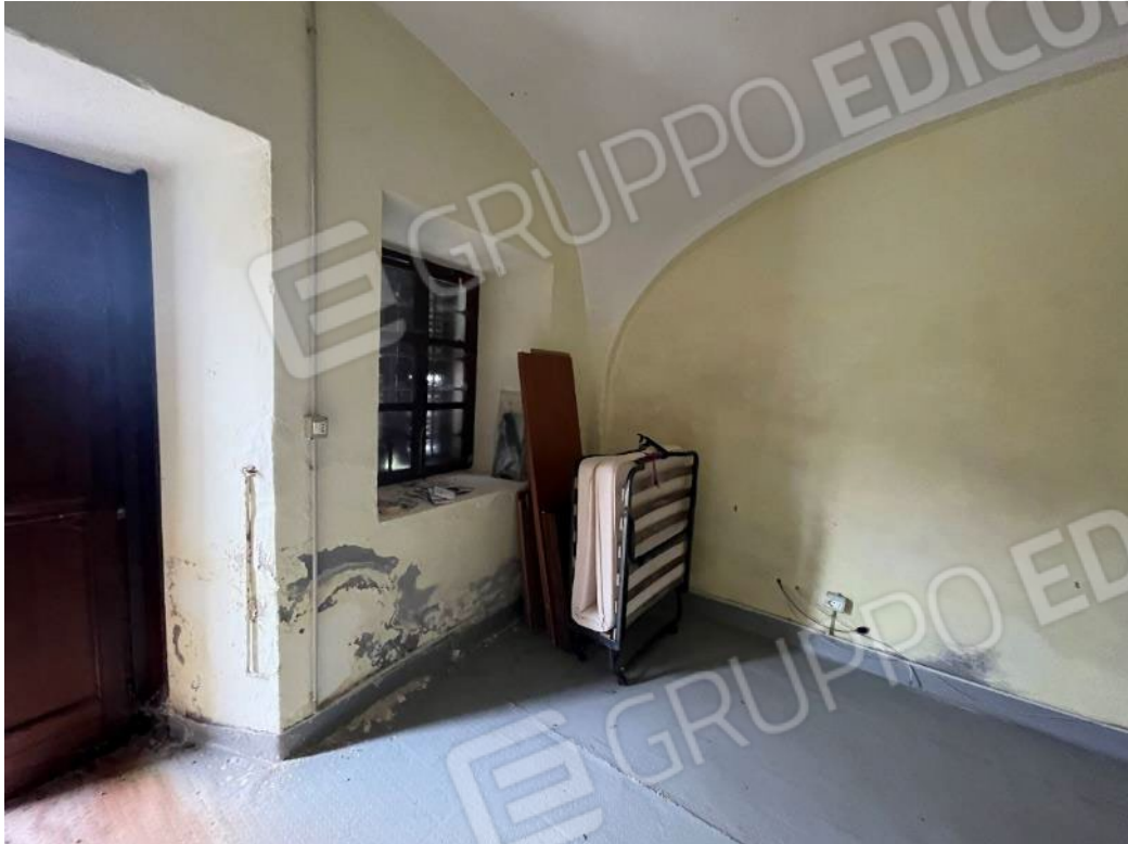
Figura 39: vista del piano terreno del bene 3