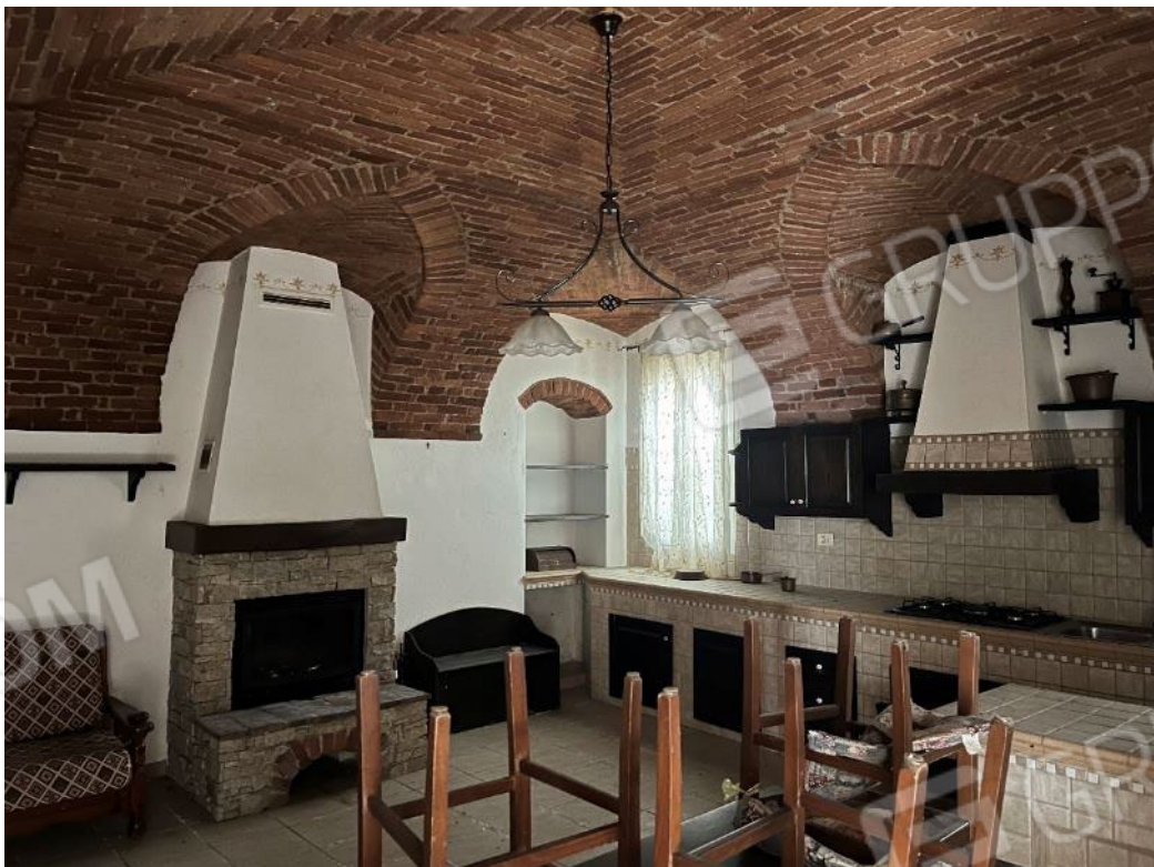
Figura 26: vista del soggiorno-cucina del bene 1