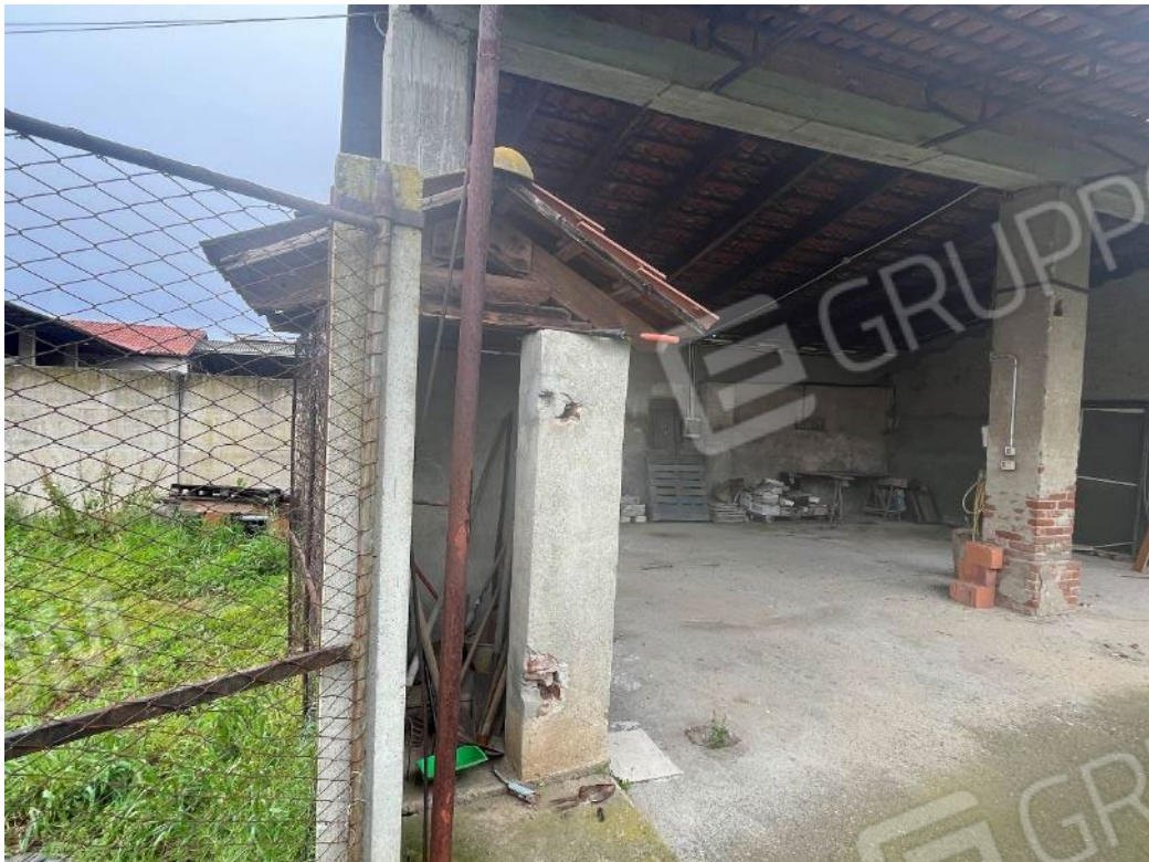
Figura 54: vista del bene 4 (seconda porzione)