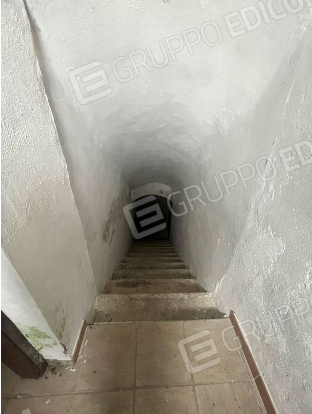
Figura 34: vista della scala verso il piano interrato del bene 1