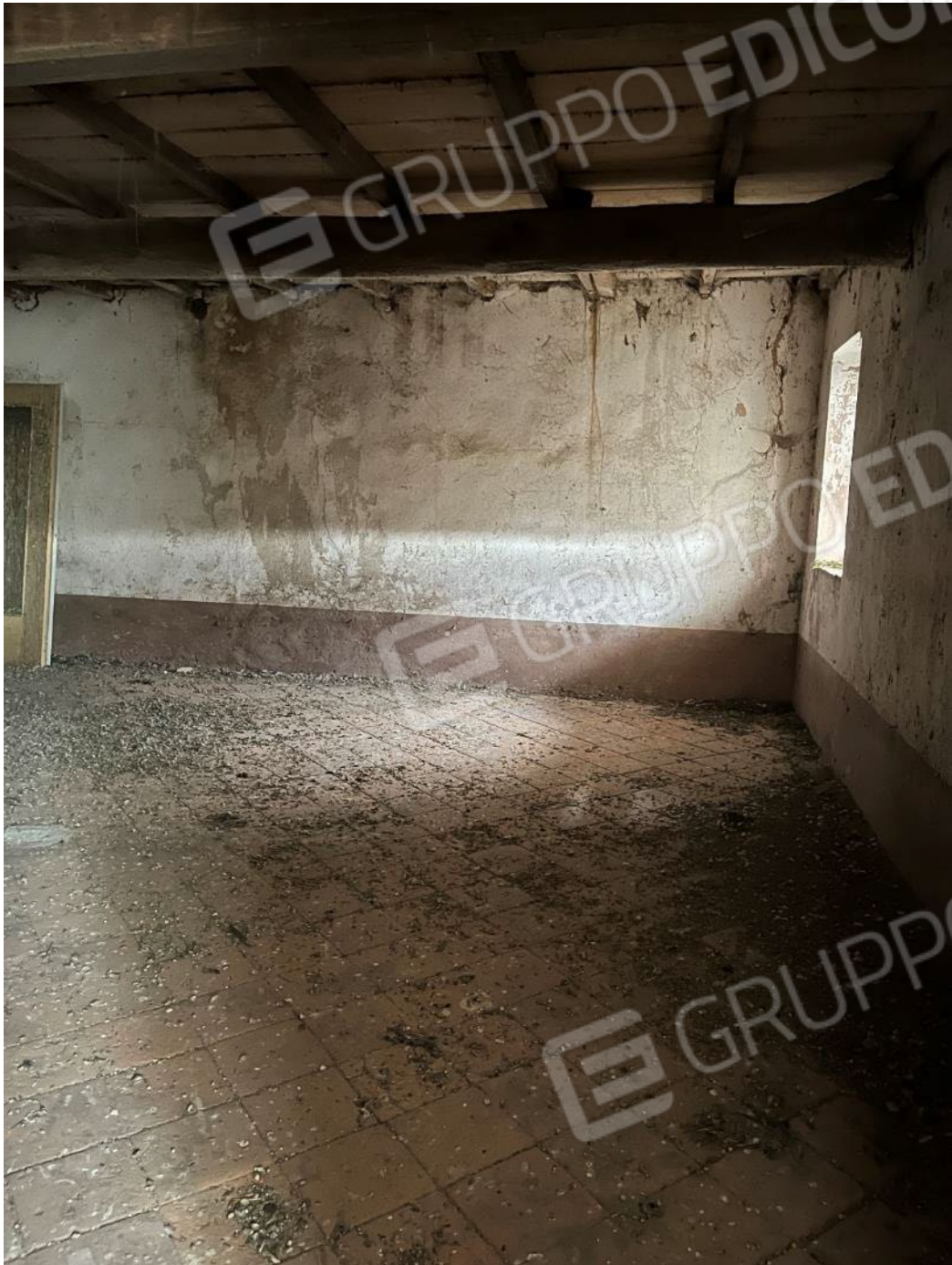
Figura 44: vista del piano primo del bene 3