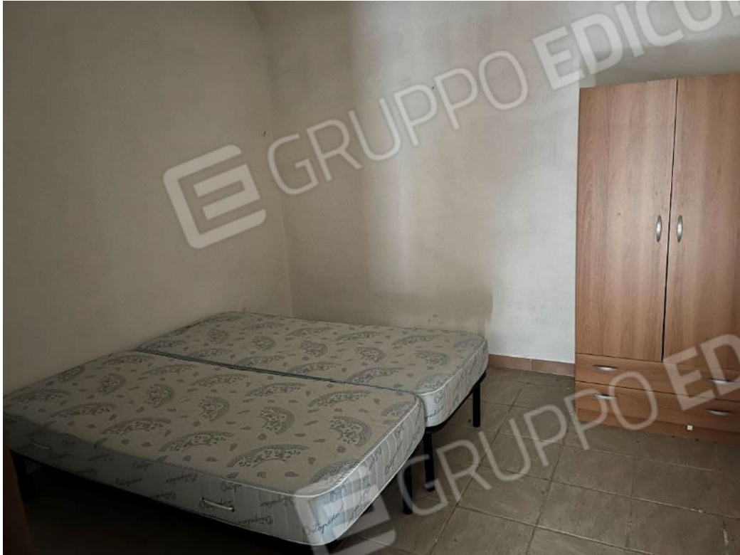
Figura 27: vista della camera al piano terra del bene 1