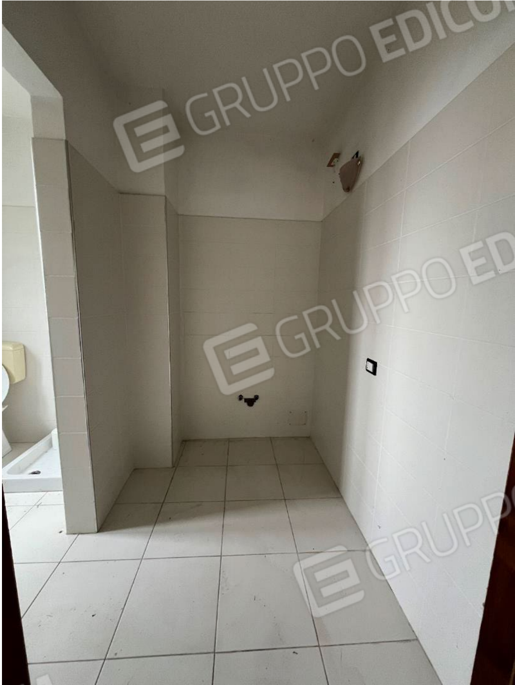
Figura 51: vista del bene 4 (prima porzione)