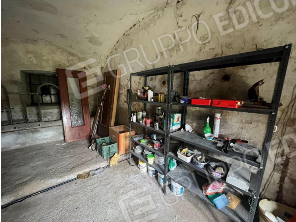
Figura 41: vista del piano terreno del bene 3