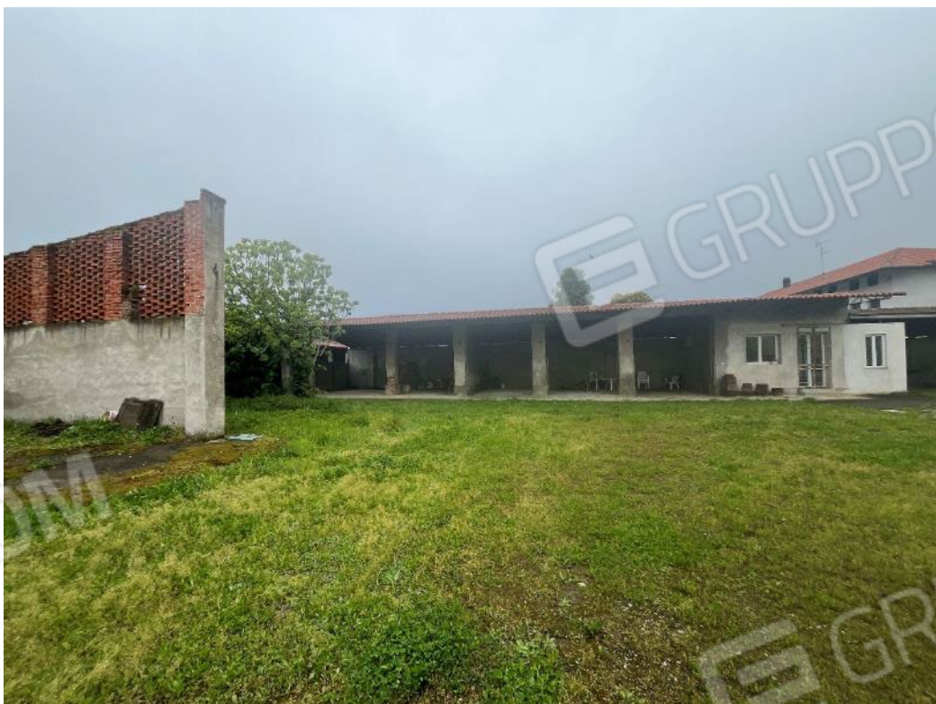
Figura 14: vista d'insieme del bene 2 e del bene 4 (seconda porzione)