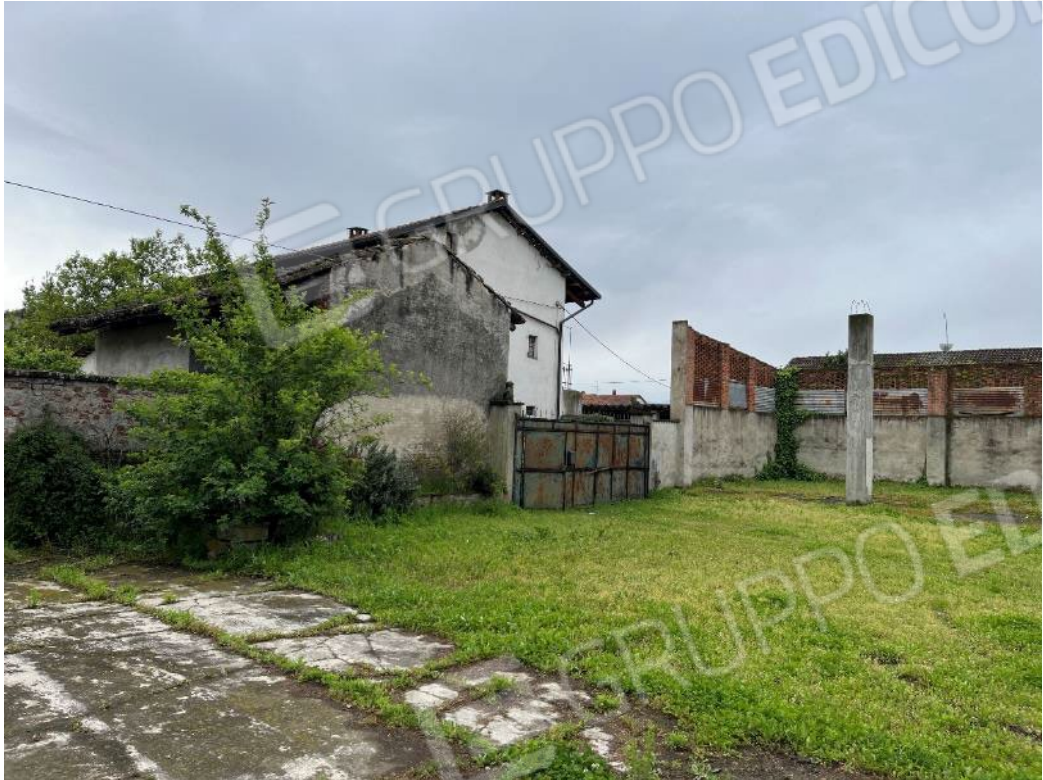
Figura 3: vista d'insieme dell'accesso pedonale e carroia