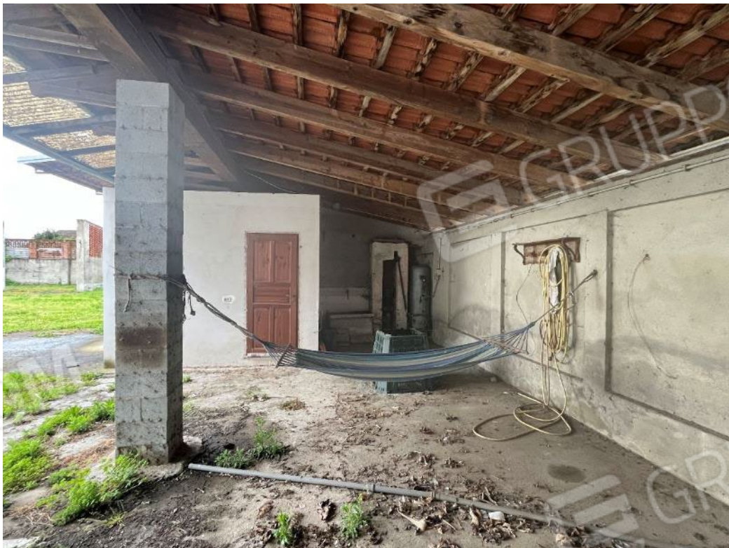
Figura 48: vista del bene 4 (prima porzione), si noti il locale realizzato adibito a servizio igienico