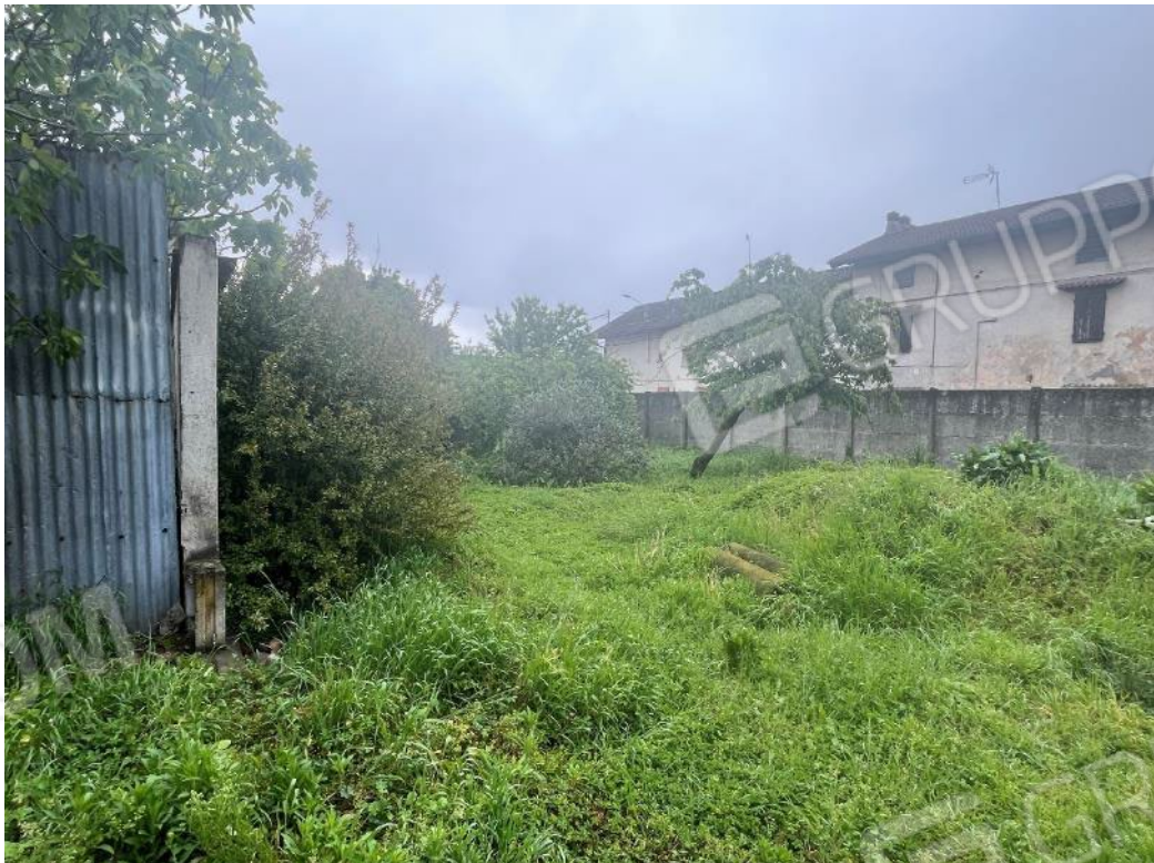
Figura 20: vista sul retro del bene 4 (terza e quarta porzione)