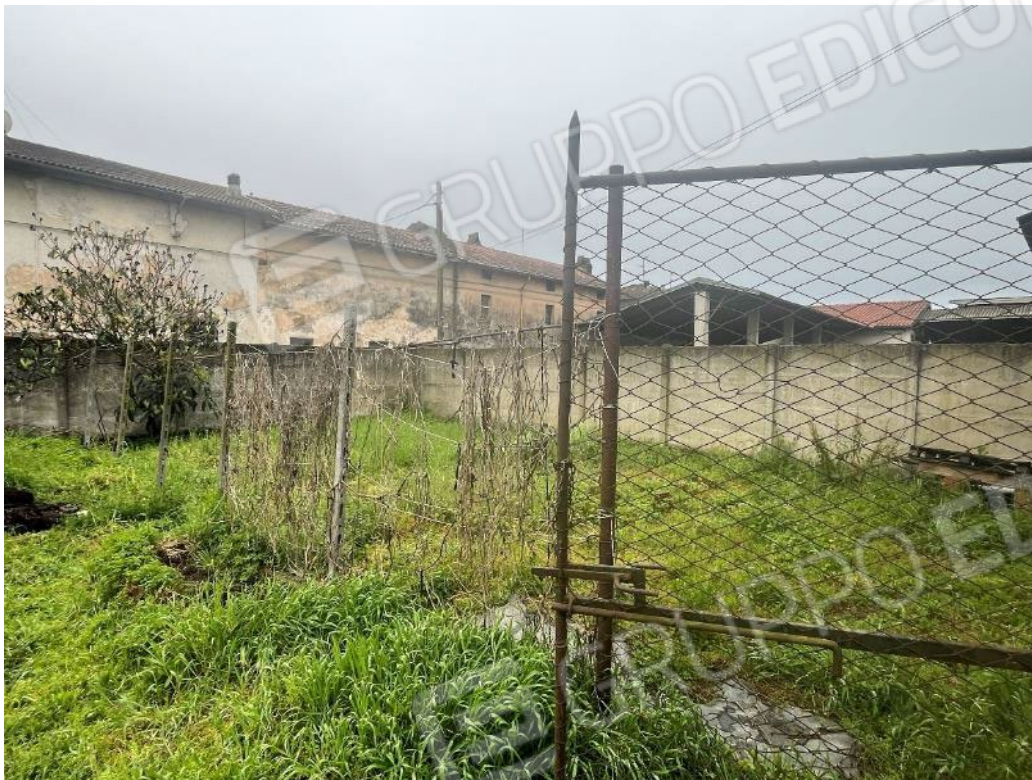
Figura 17: vista dell'area verde e della recinzione perimetrale