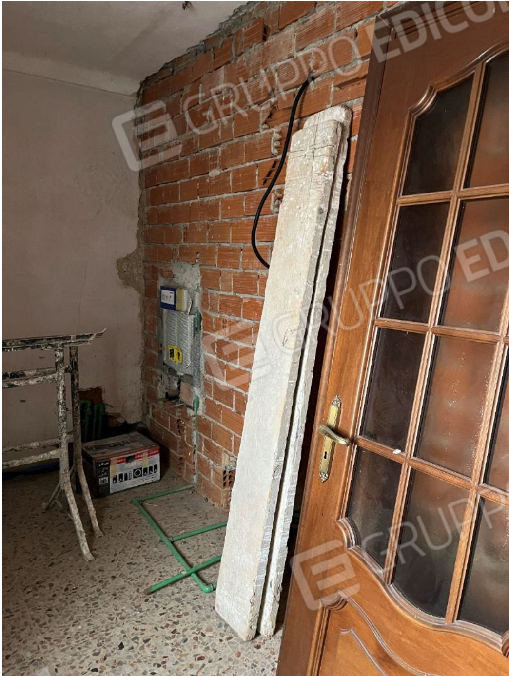
Figura 32: vista del bagno al piano primo del bene 1, si noti come i lavori non siano terminati