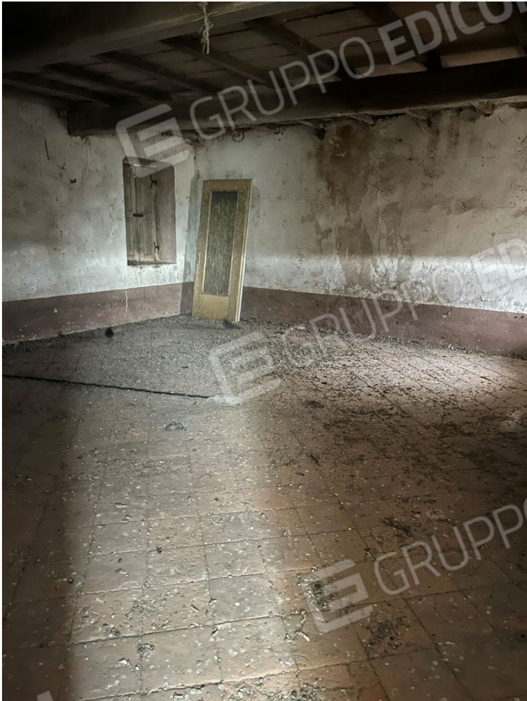
Figura 43: vista del piano primo del bene 3