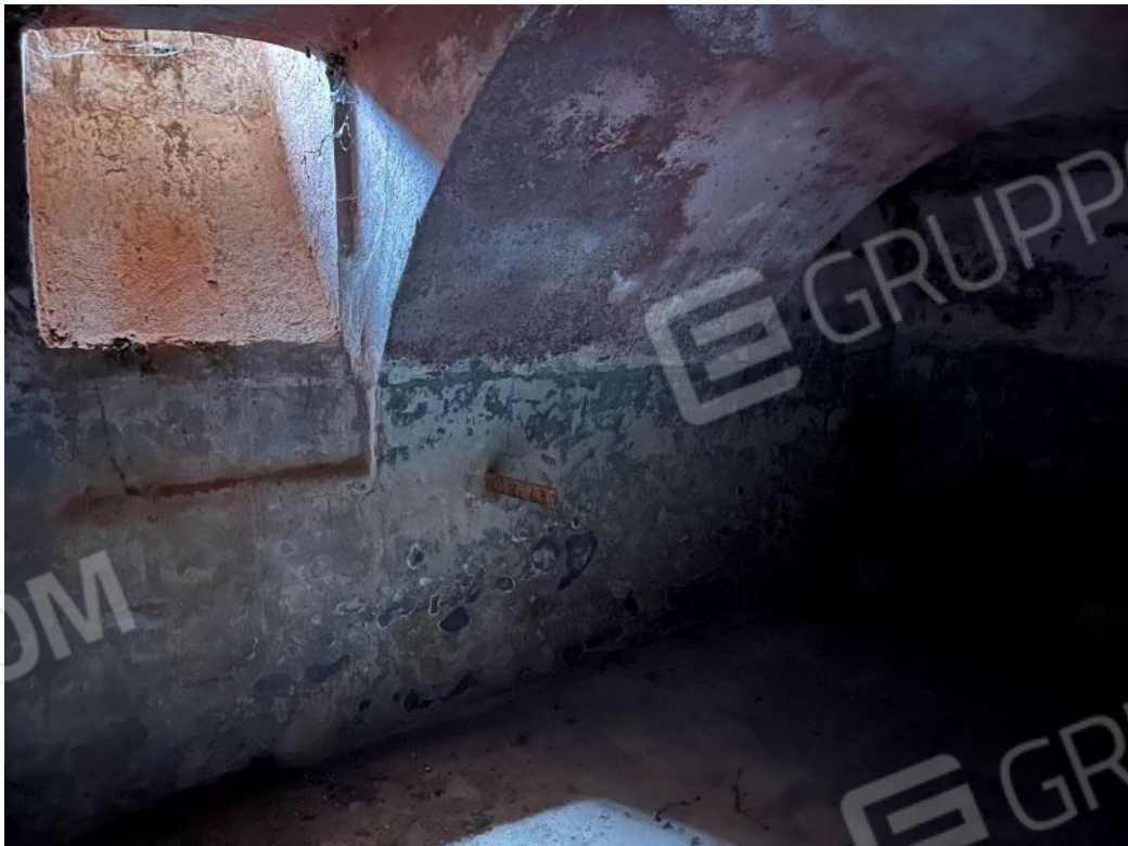
Figura 36: vista della cantina al piano interrato del bene 1