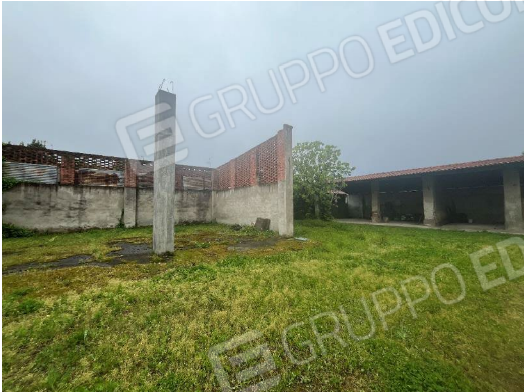
Figura 19: vista del bene 4 (seconda, terza e quarta porzione)