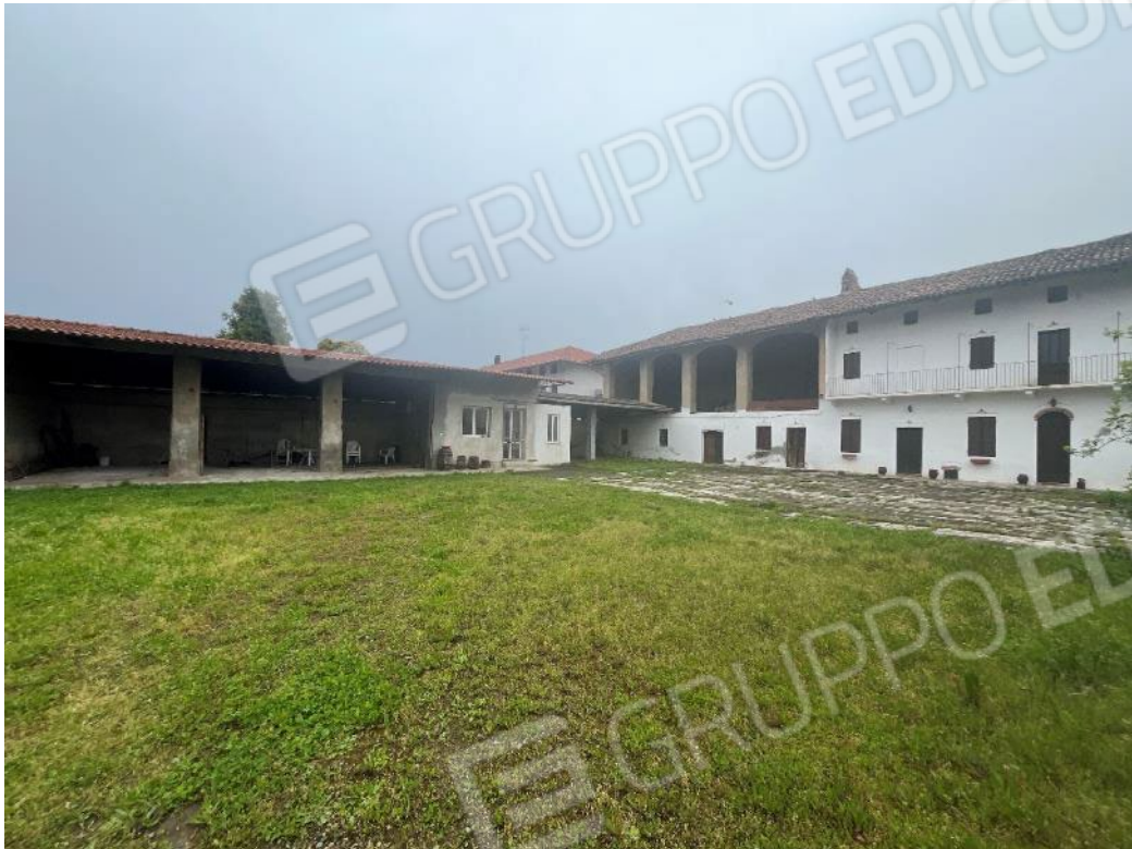
Figura 13: vista d'insieme del bene 1, del bene 2, del bene 3 e del bene 4 (prima, seconda e quinta porzione)