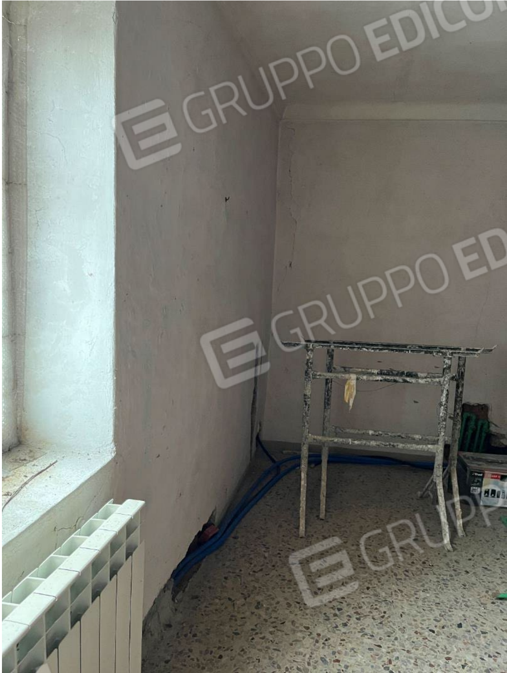
Figura 31: vista del bagno al piano primo del bene 1, si noti come i lavori non siano terminati