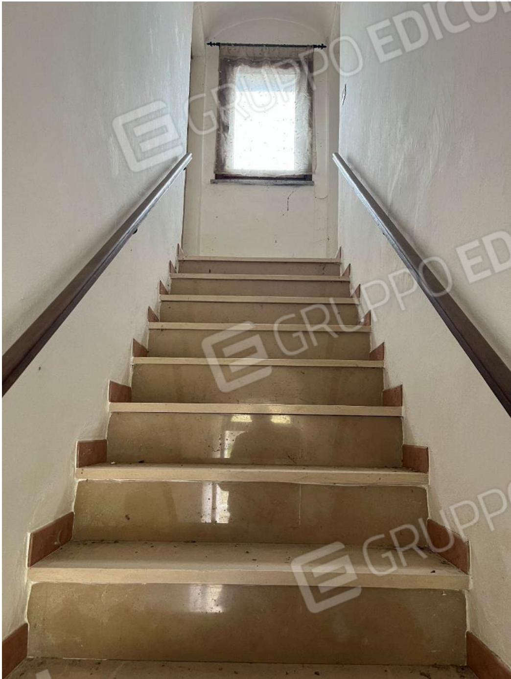
Figura 30: vista della scala che conduce al piano primo del bene 1 e del bene 3