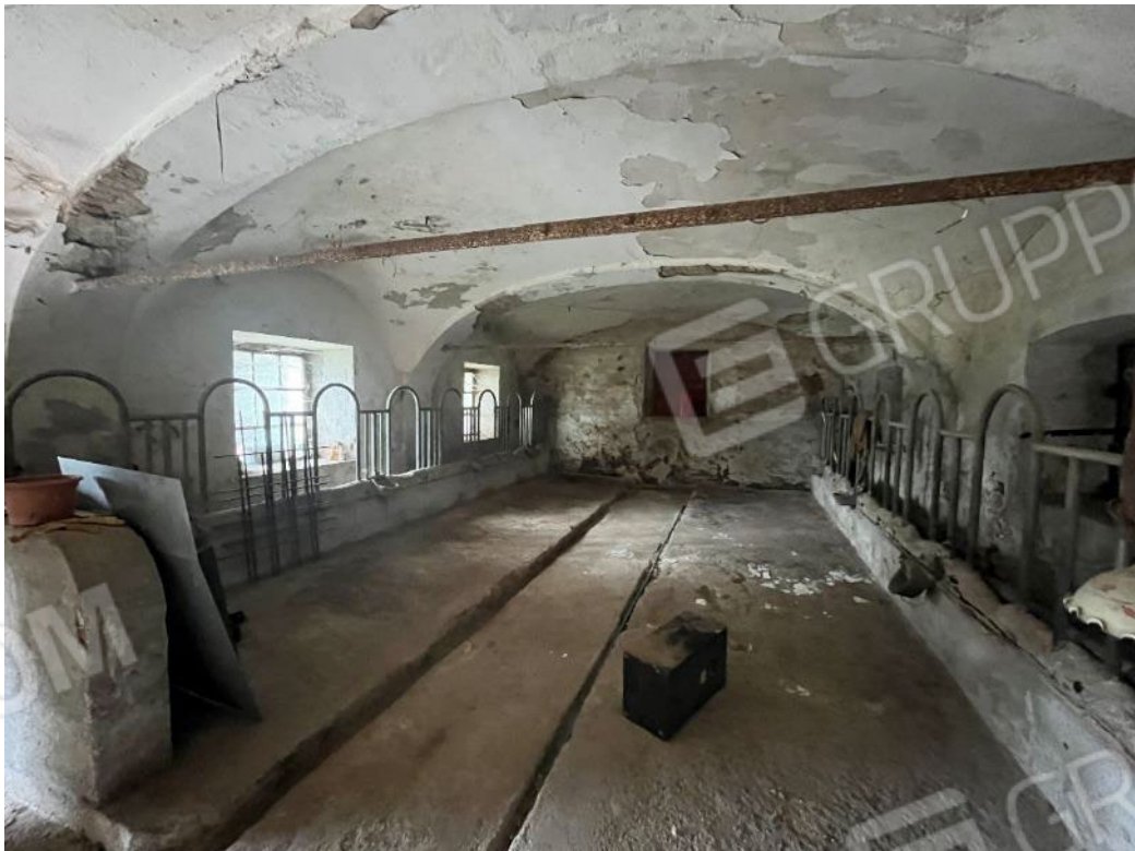
Figura 40: vista del piano terreno del bene 3