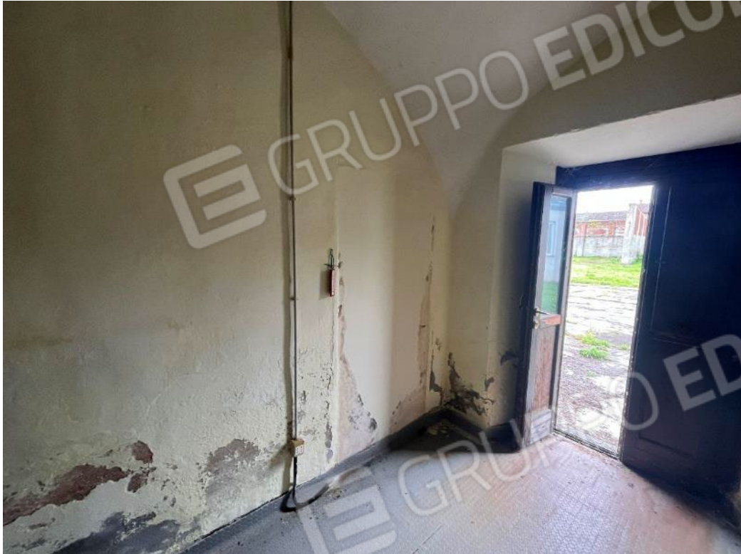
Figura 37: vista del piano terreno del bene 3