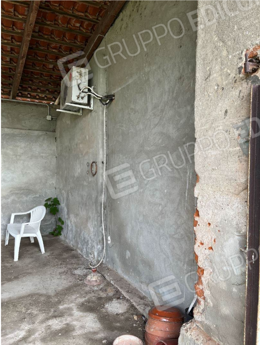
Figura 52: vista del bene 4 (seconda porzione)