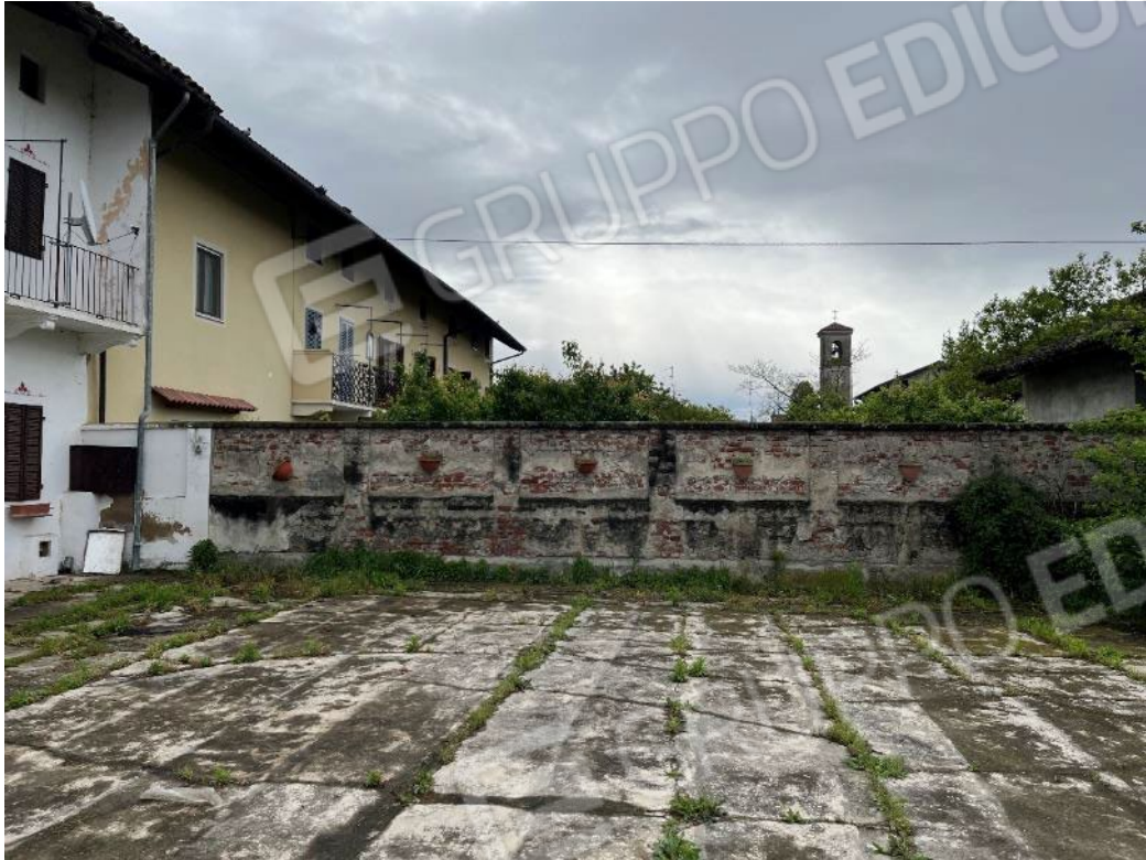
Figura 5: vista del muro di cinta a sud-ovest del lotto