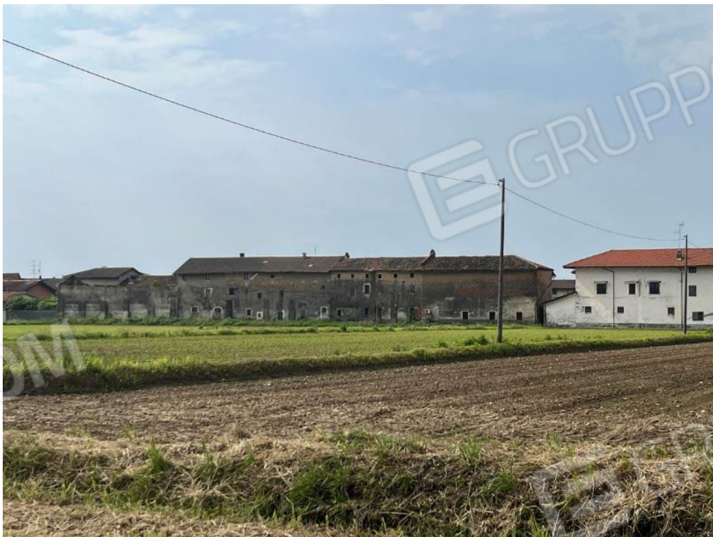
Figura 24: vista d'insieme del compendio dalla via Aosta