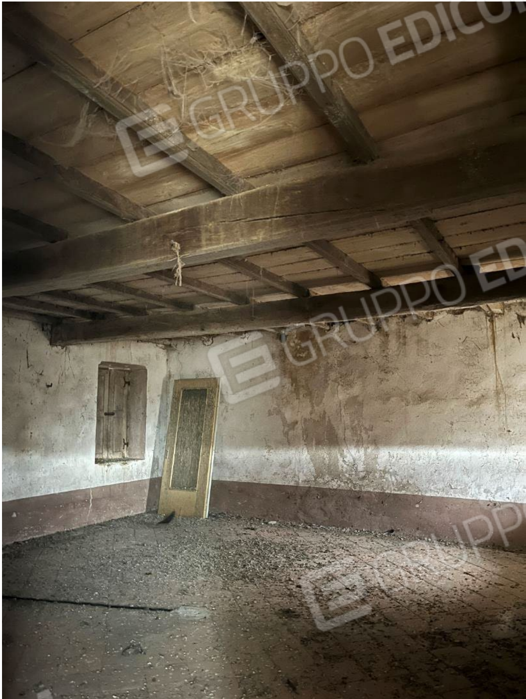
Figura 45: vista del piano primo del bene 3