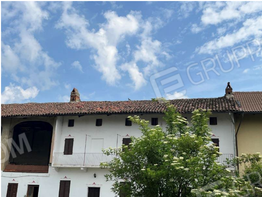
Figura 8: dettaglio del manto di copertura