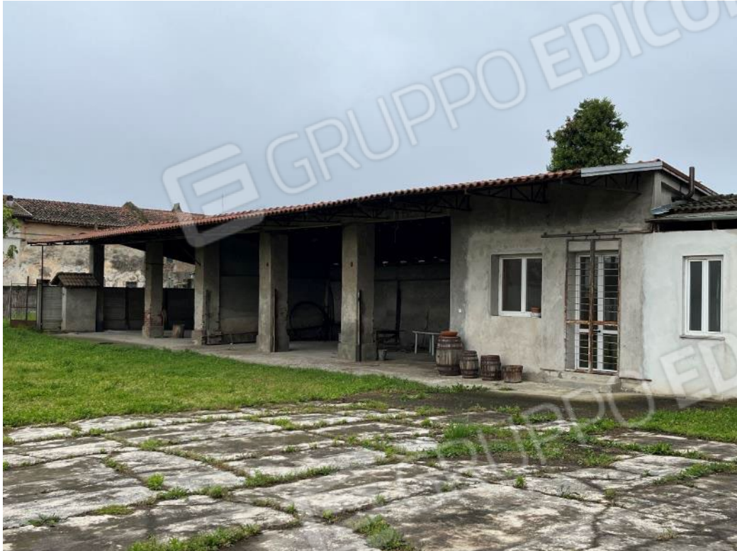
Figura 15: vista del bene 2 e del bene 4 (seconda porzione)