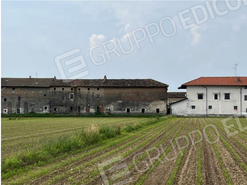
Figura 23: vista d'insieme del compendio dalla via Aosta, si noti il passaggio tra i due fabbricati al fine di raggiungere lo scolatoio