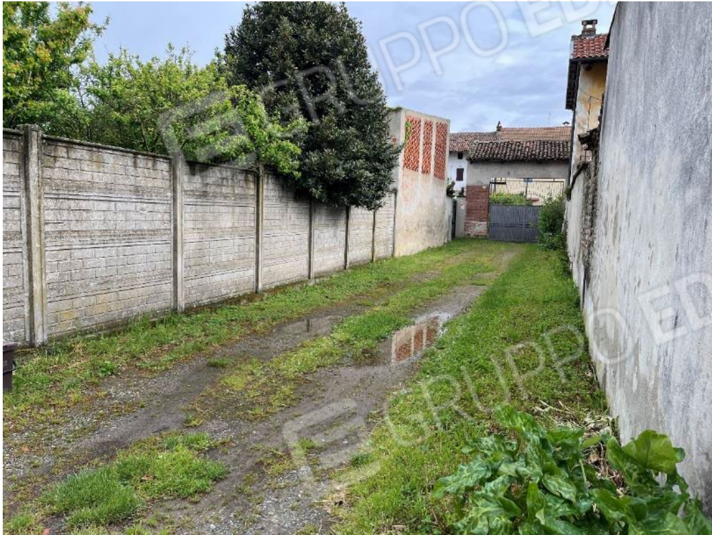
Figura 1: vista della pubblica strada di accesso dalla via Emanuele Filiberto