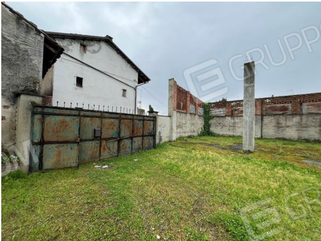
Figura 2: vista dell'accesso pedonale e carroia