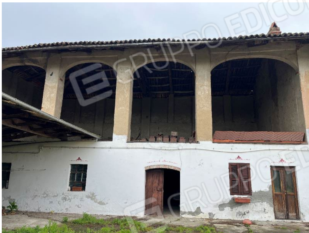
Figura 9: vista del bene 3 e del bene 4 (quinta porzione)