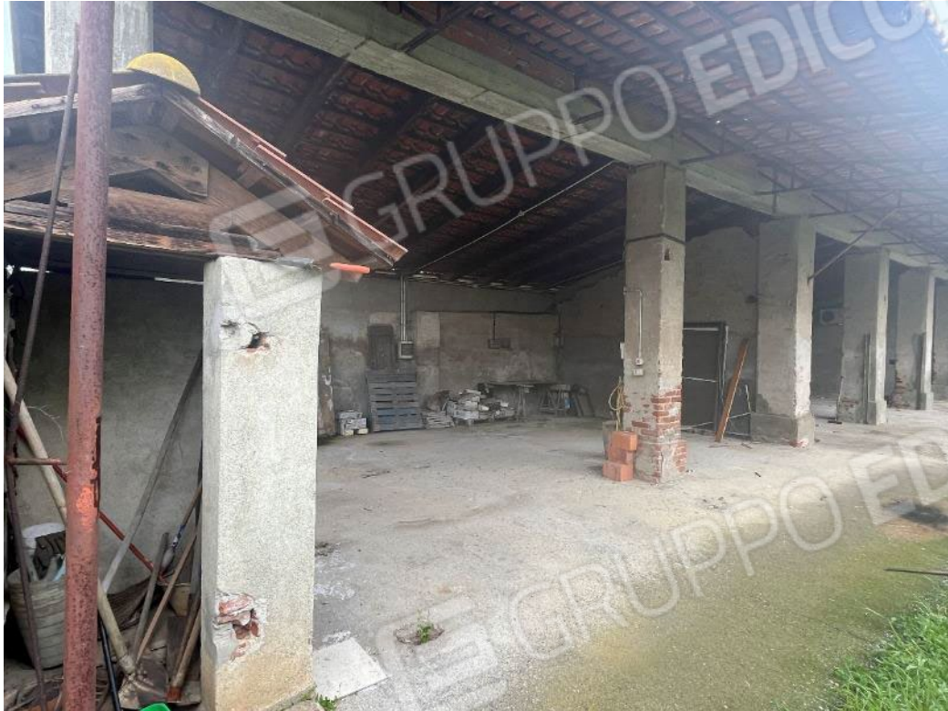
Figura 53: vista del bene 4 (seconda porzione)