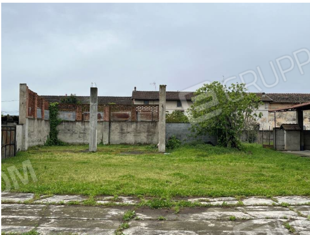
Figura 18: vista del bene 4 (terza e quarta porzione)