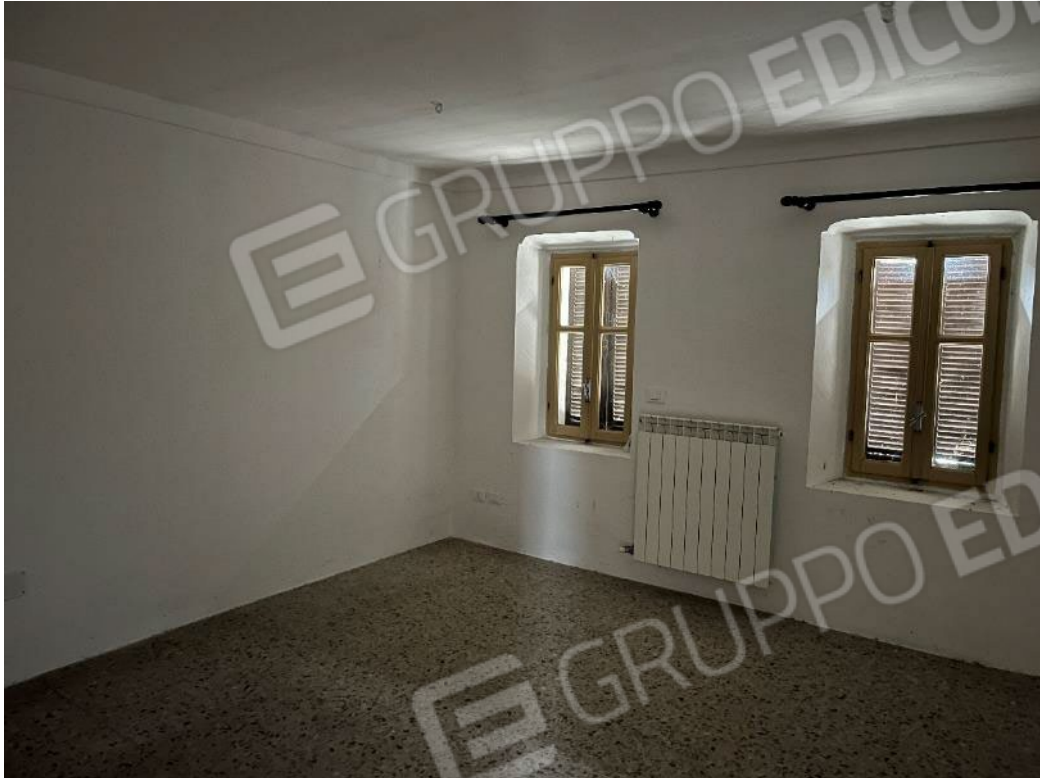
Figura 33: vista della camera al piano primo del bene 1