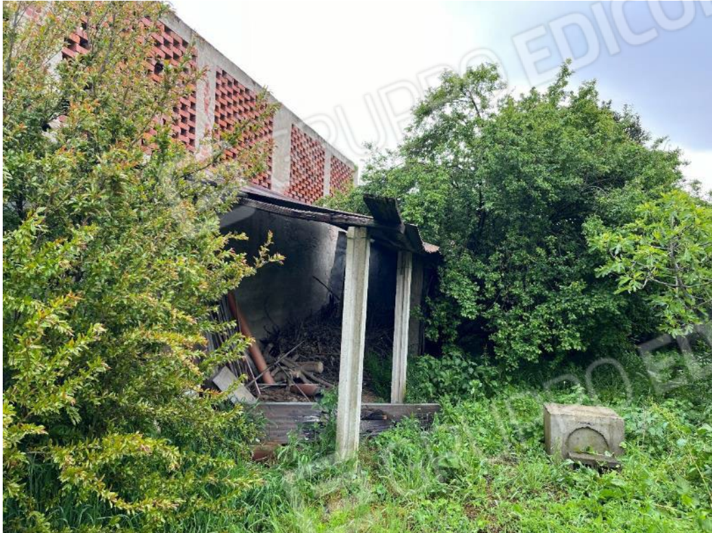
Figura 21: vista sul retro del bene 4 (terza e quarta porzione), si noti l'opera precaria posta in adiacenza