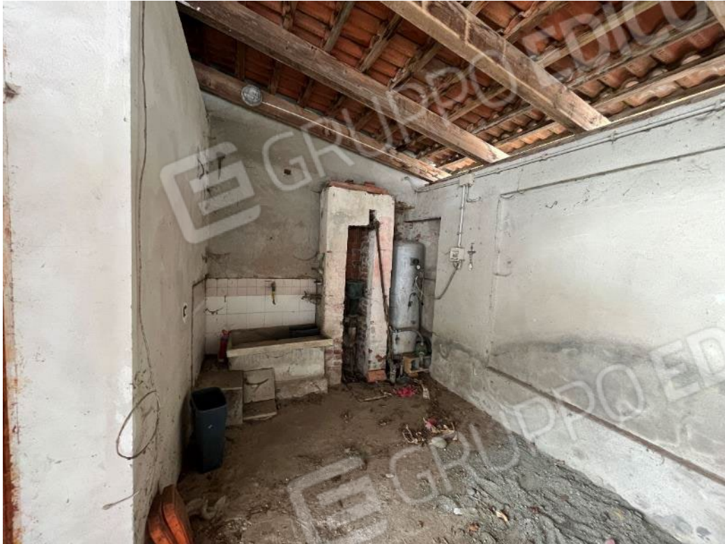
Figura 49: vista del bene 4 (prima porzione)