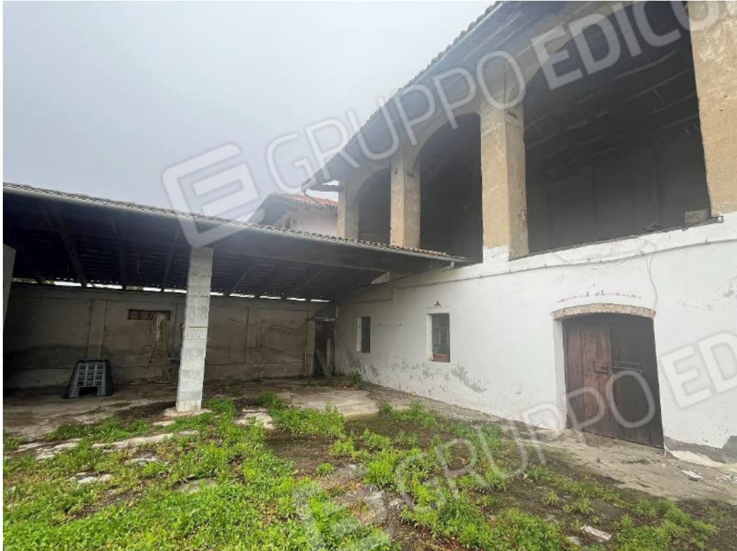
Figura 11: vista del bene 3 del bene 4 (prima e quinta porzione), si noti al centro della ripresa la porta bloccata con delle assi e che conduce allo scolatoio esterno