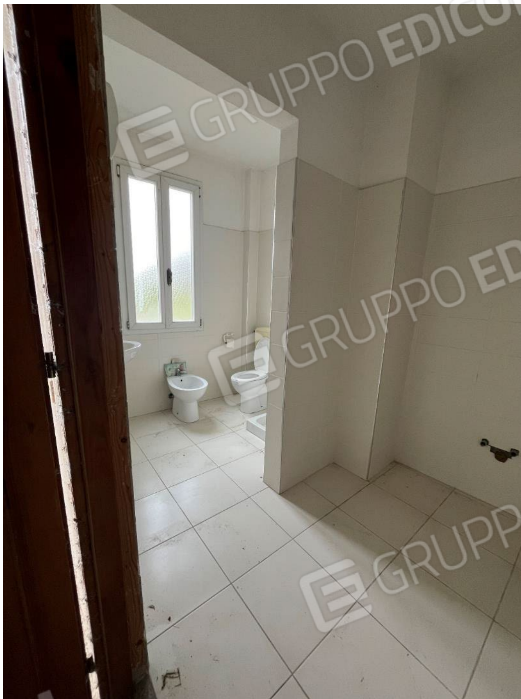
Figura 50: vista del bene 4 (prima porzione)