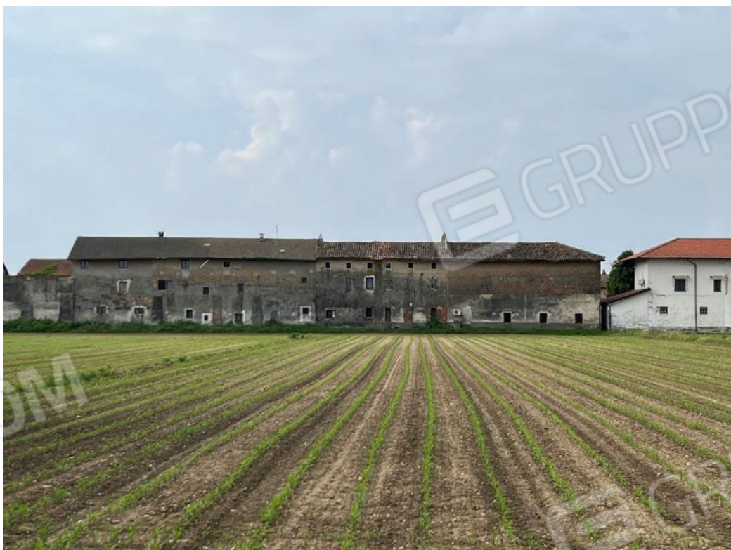
Figura 22: vista d'insieme del compendio dalla via Aosta, si noti il manto di copertura