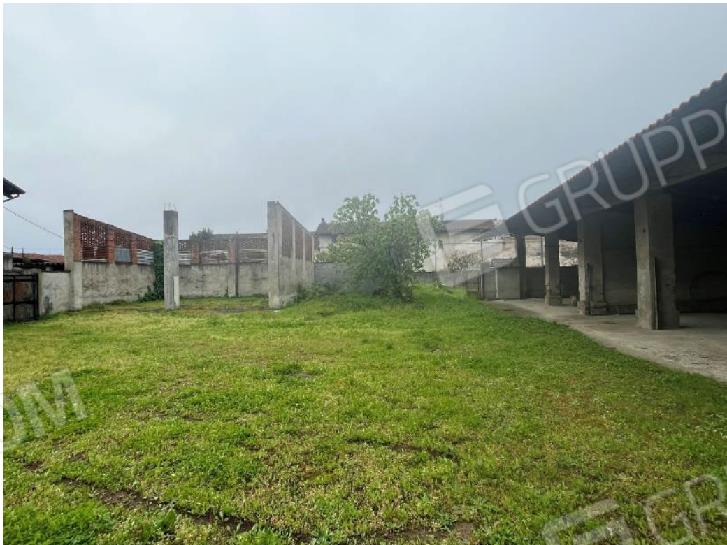
Figura 16: vista del bene 4 (seconda, terza e quarta porzione)