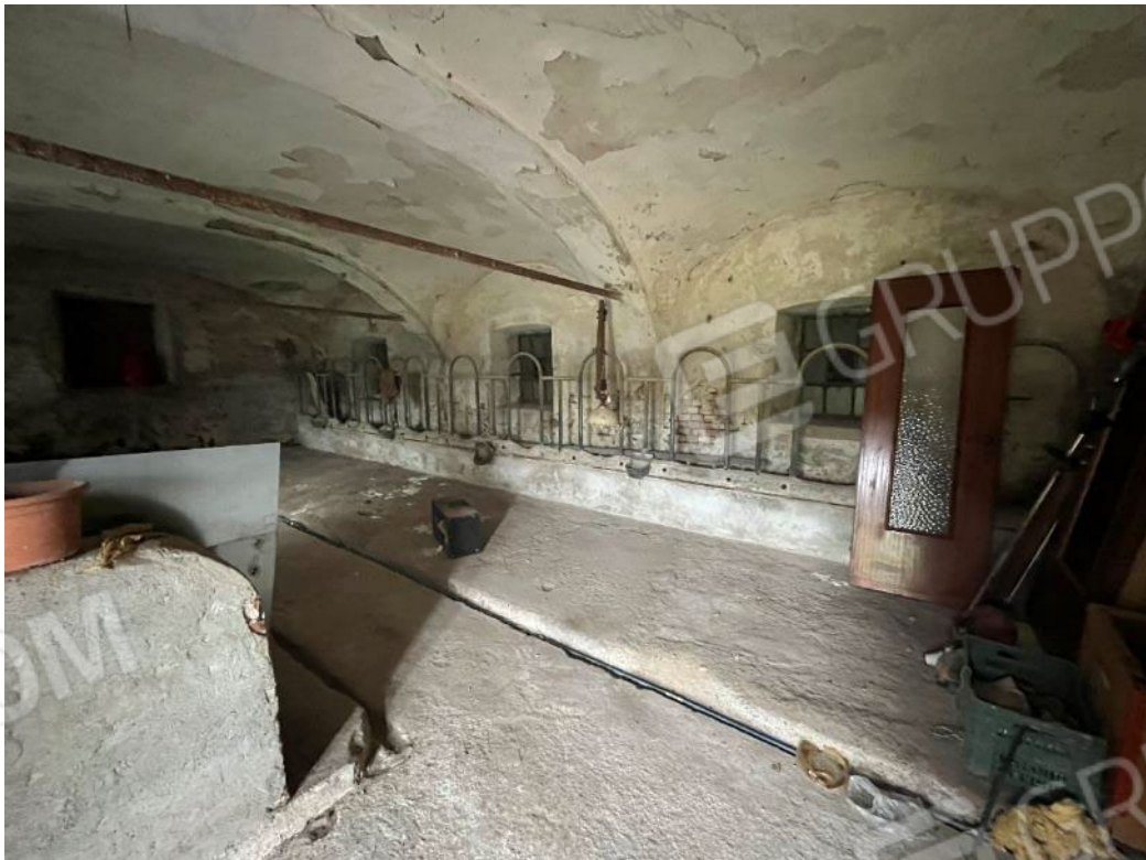
Figura 42: vista del piano terreno del bene 3