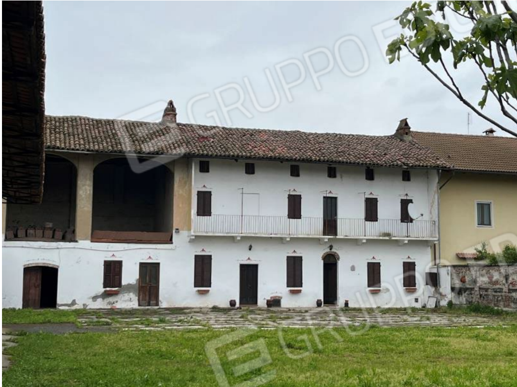
Figura 7: vista d'insieme del bene 1, del bene 3 e del bene 4 (quinta porzione)