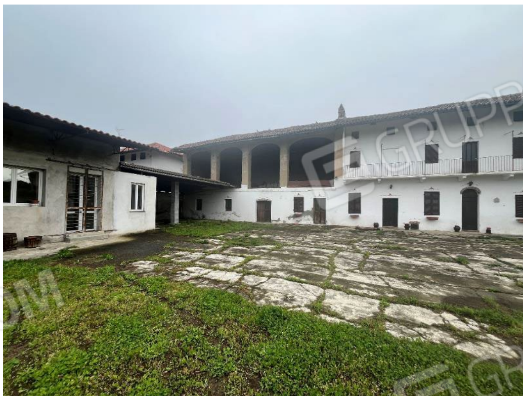
Figura 10: vista d'insieme del bene 1, del bene 2, del bene 3 e del bene 4 (prima e quinta porzione)