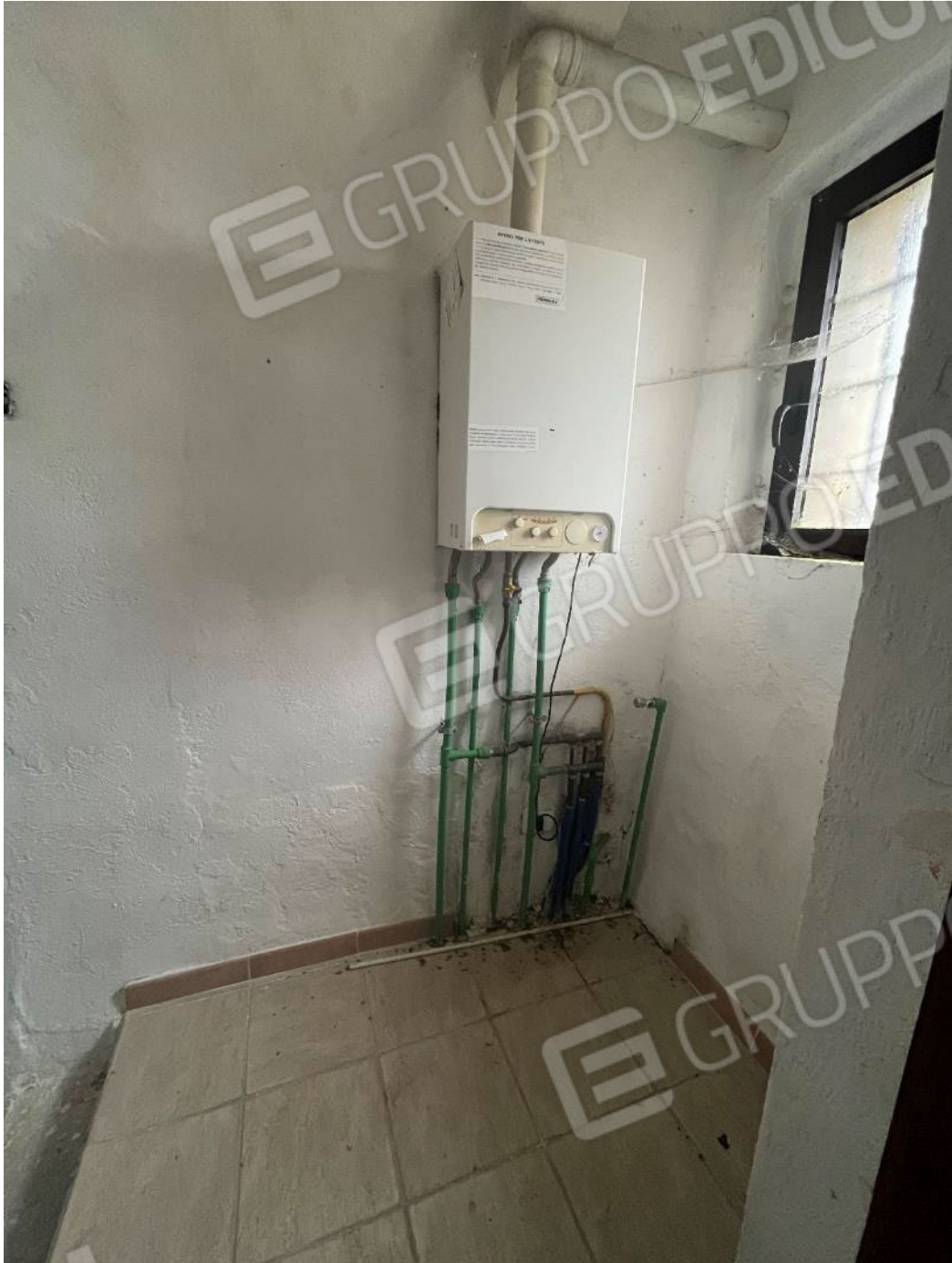
Figura 29: vista del disimpegno al piano terra del bene 1