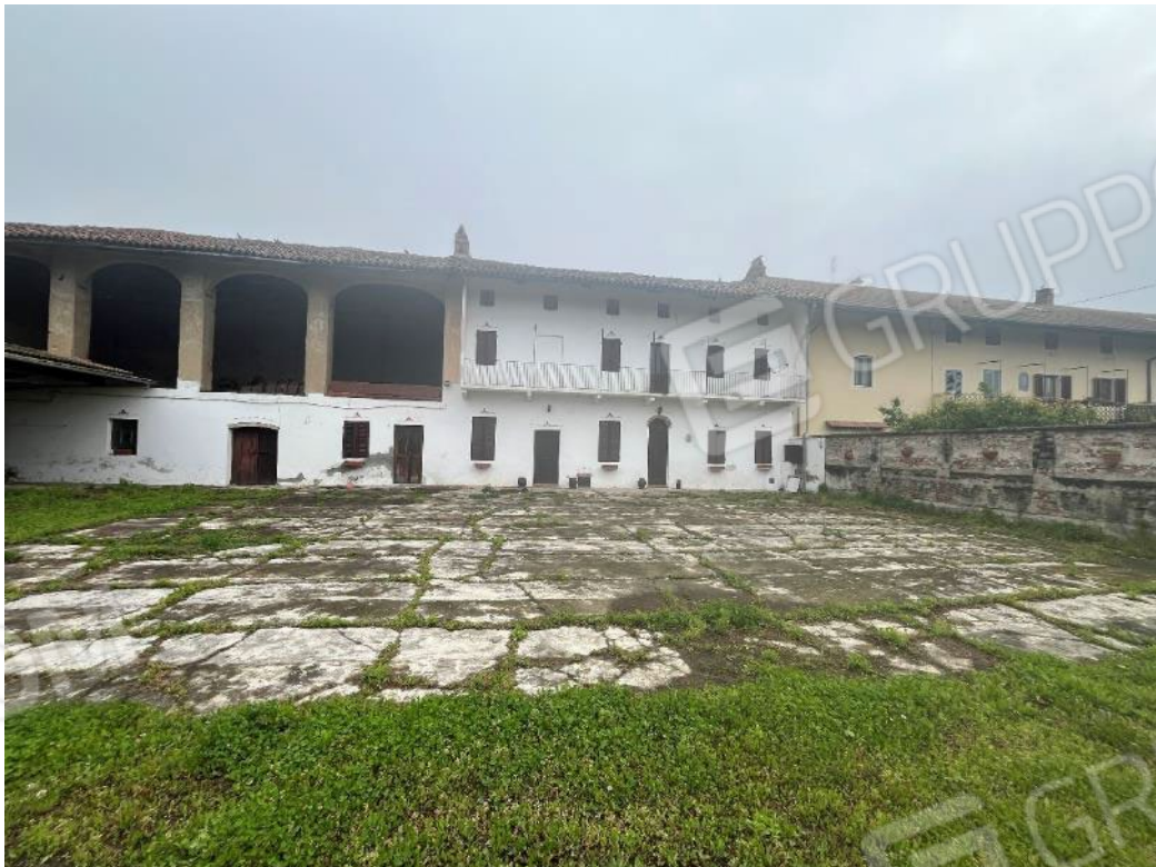
Figura 6: vista d'insieme del bene 1, del bene 3 e del bene 4 (quinta porzione)