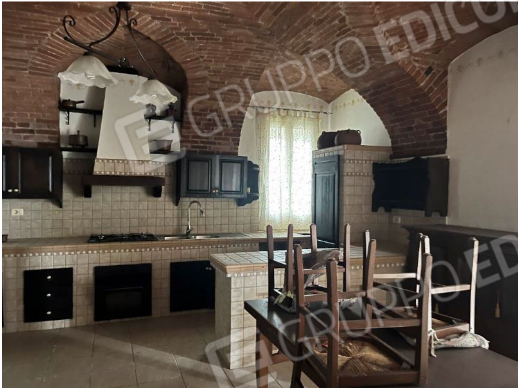
Figura 25: vista del soggiorno-cucina del bene 1