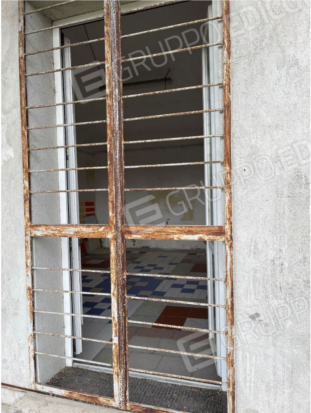
Figura 46: vista del bene 2