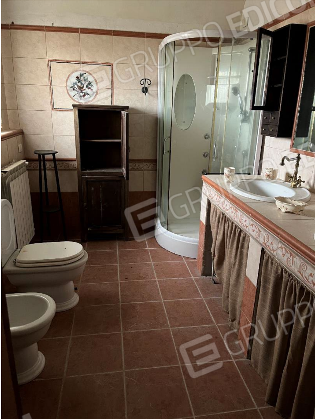
Figura 28: vista del bagno al piano terra del bene 1