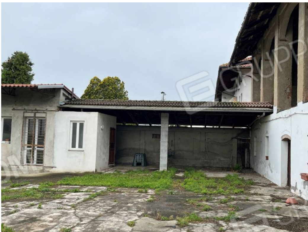
Figura 12: vista del bene 2 del bene 4 (prima e quinta porzione)