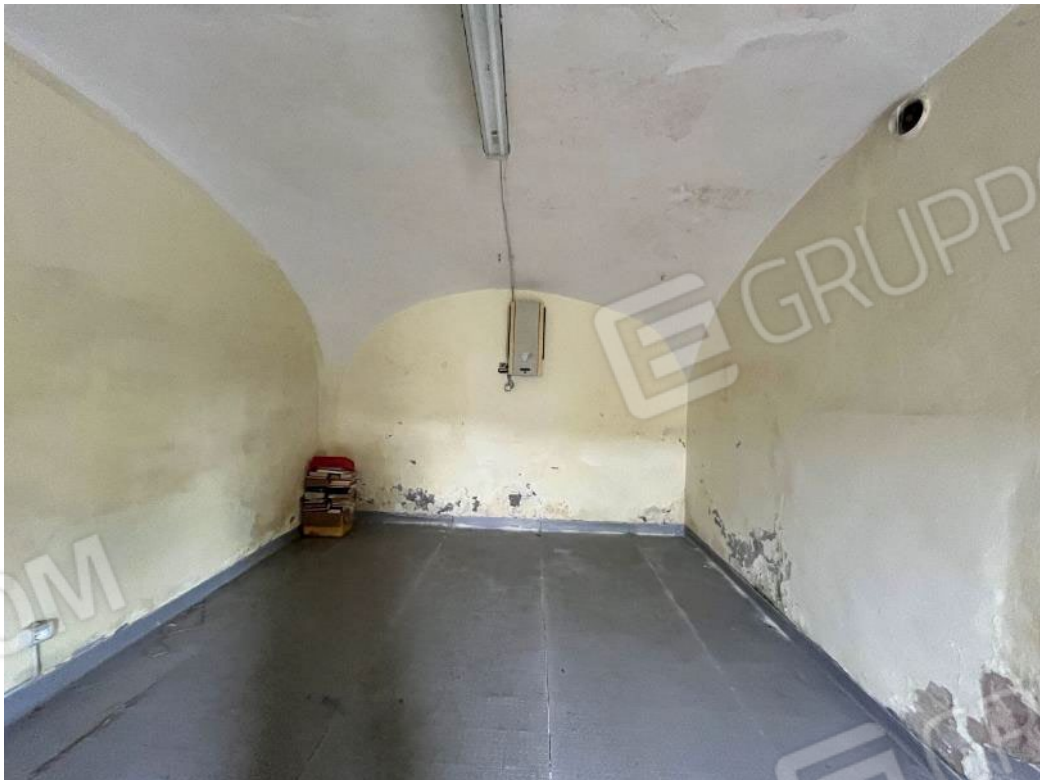
Figura 38: vista del piano terreno del bene 3