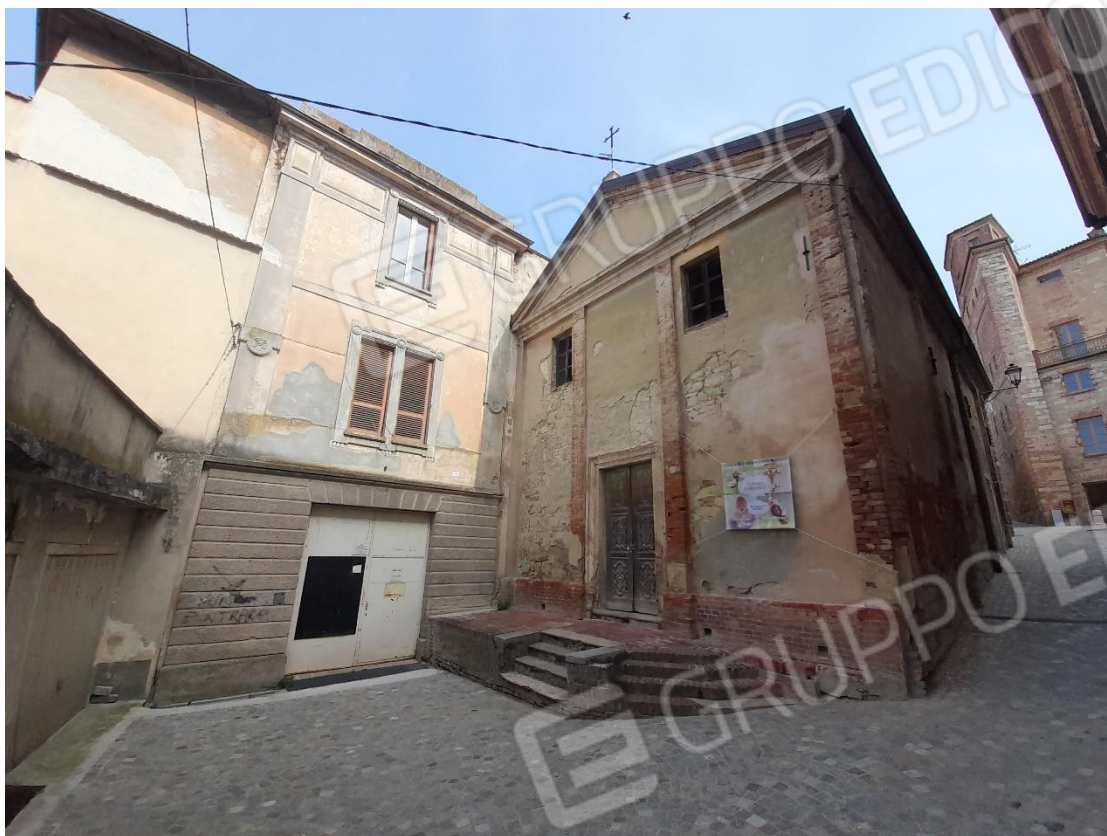
Foto 1 - Ingresso principale da Via Aldo Bergamaschino n.23