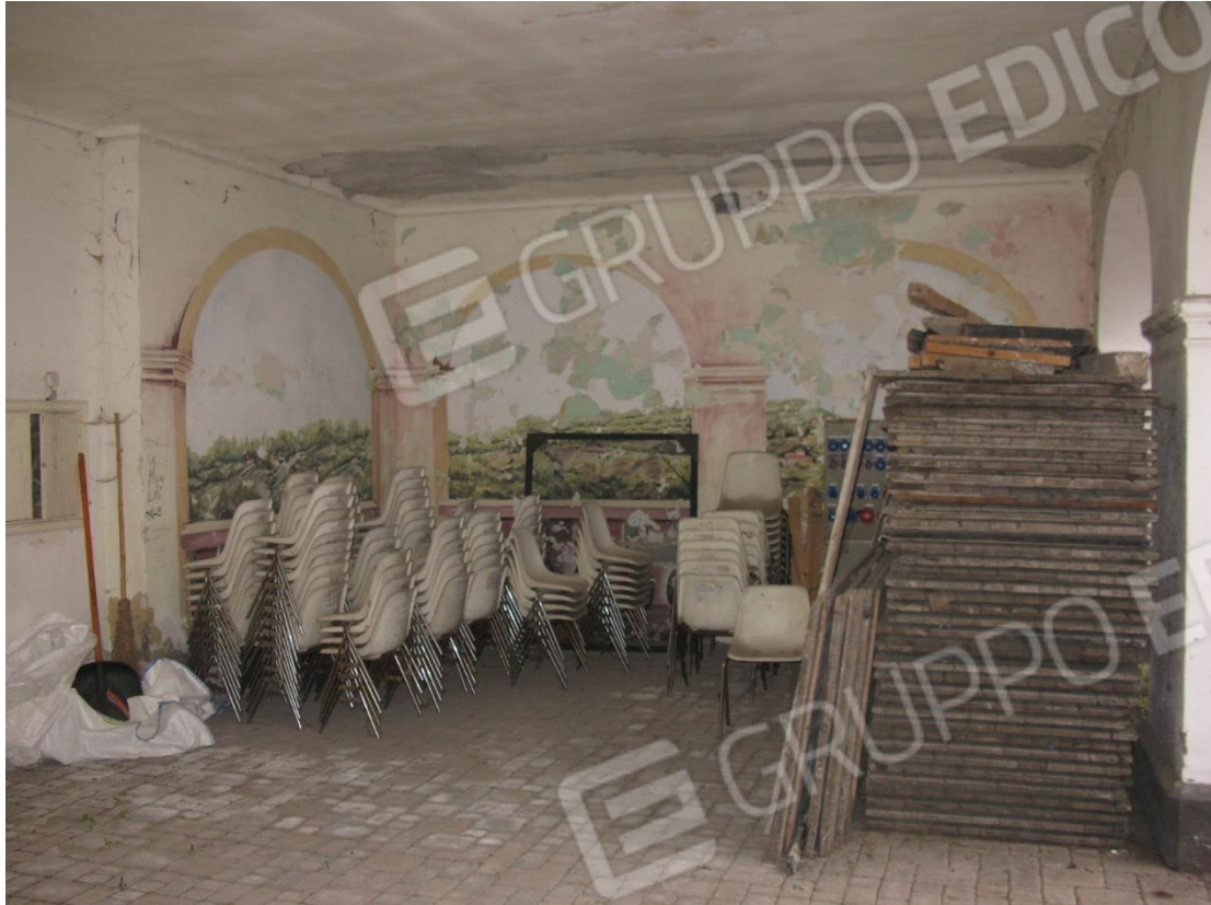
Foto 9 – Sala comune al piano terreno con accesso da via Aldo Bergamaschino n.23