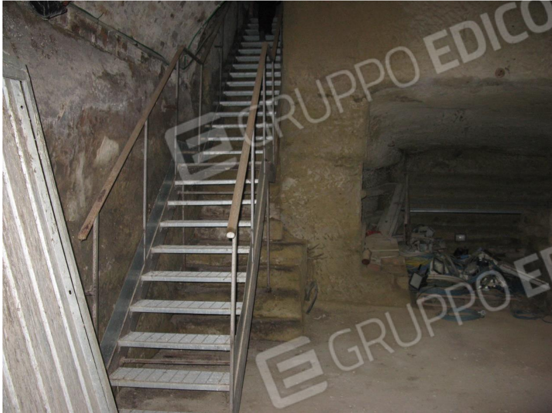
Foto 39 – Scala di accesso al piano terreno del locale dichiarato sala riunione