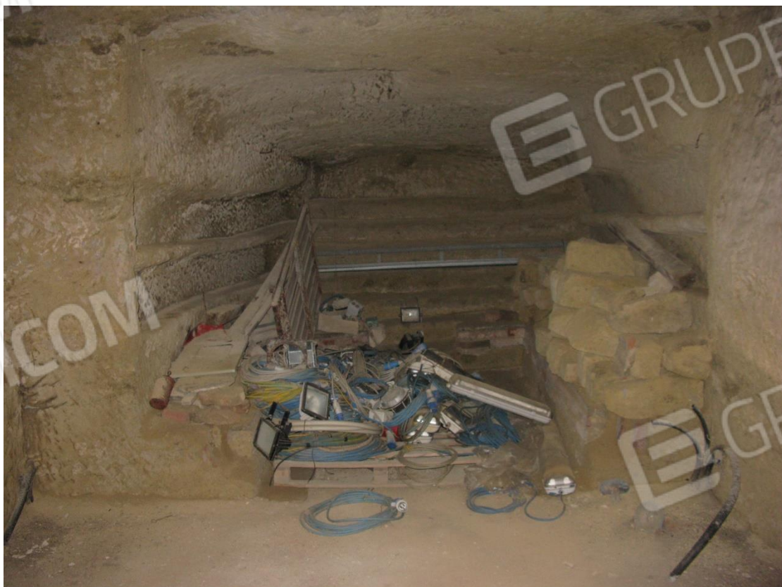
Foto 40 – Infernot locale aula riunione al piano seminterrato, terreno su via G. Garibaldi