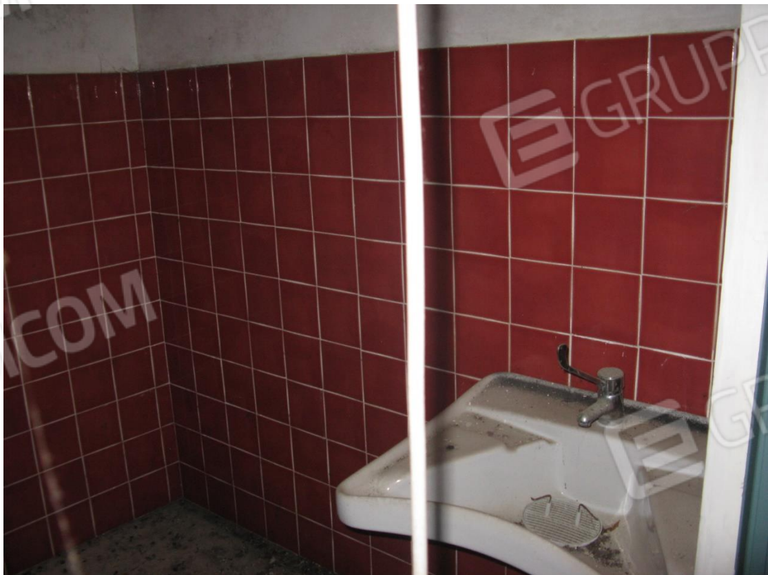
Foto 44 – Bagno disabili al piano seminterrato, terreno su via G. Garibaldi