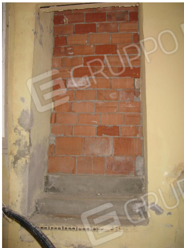
Foto 13 – Porta murata di accesso al vestibolo della Chiesa dei Battuti