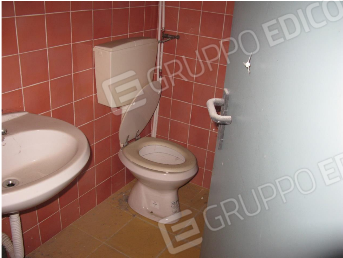
Foto 43 – Bagno al piano seminterrato, terreno su via G. Garibaldi