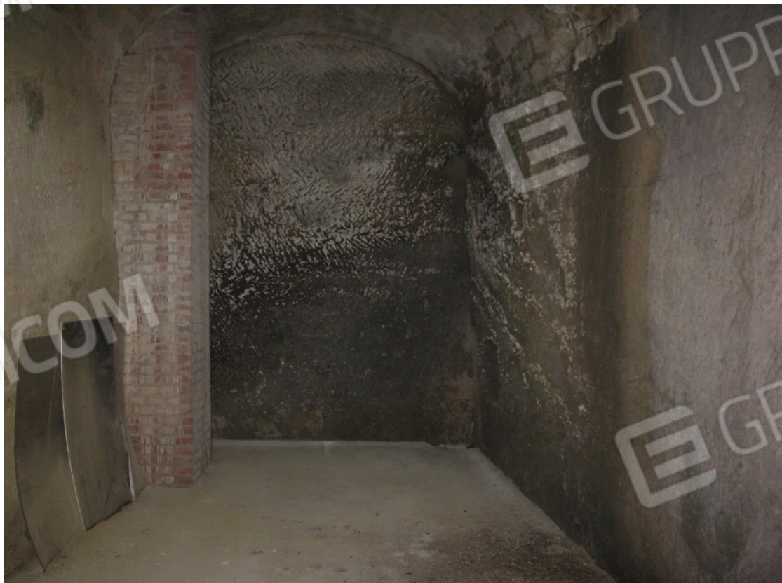
Foto 42 – Locale disimpegno al piano seminterrato, terreno su via G. Garibaldi