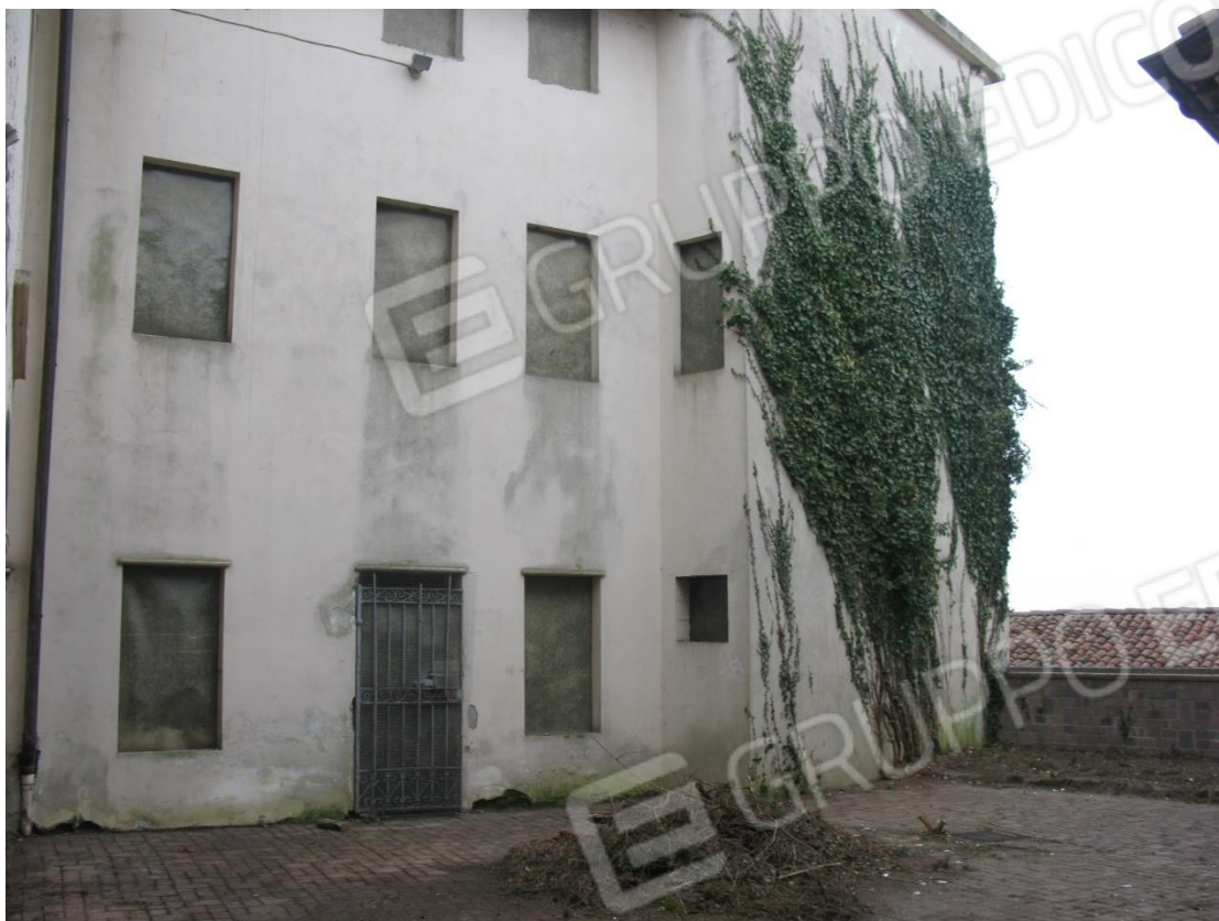
Foto 7 – Facciata nord altra proprietà (particella 578) con diritto di passaggio