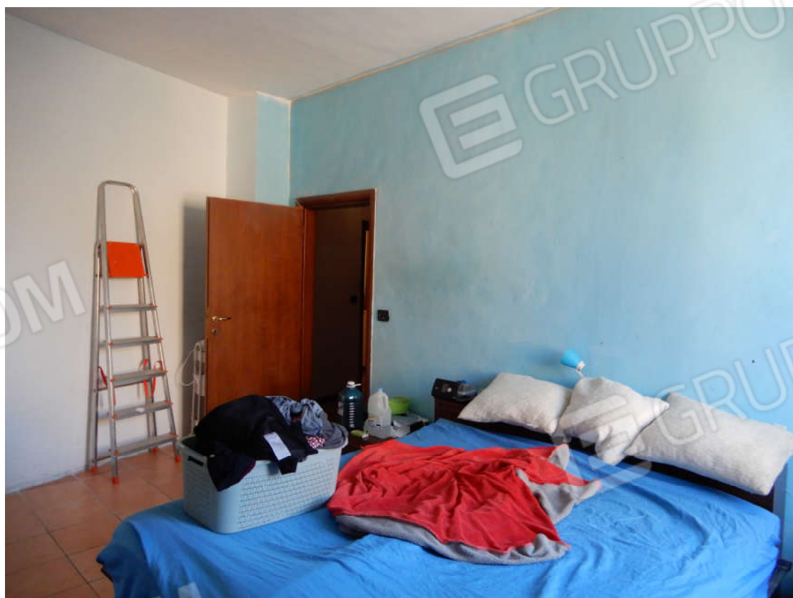
Piano primo - Camera matrimoniale