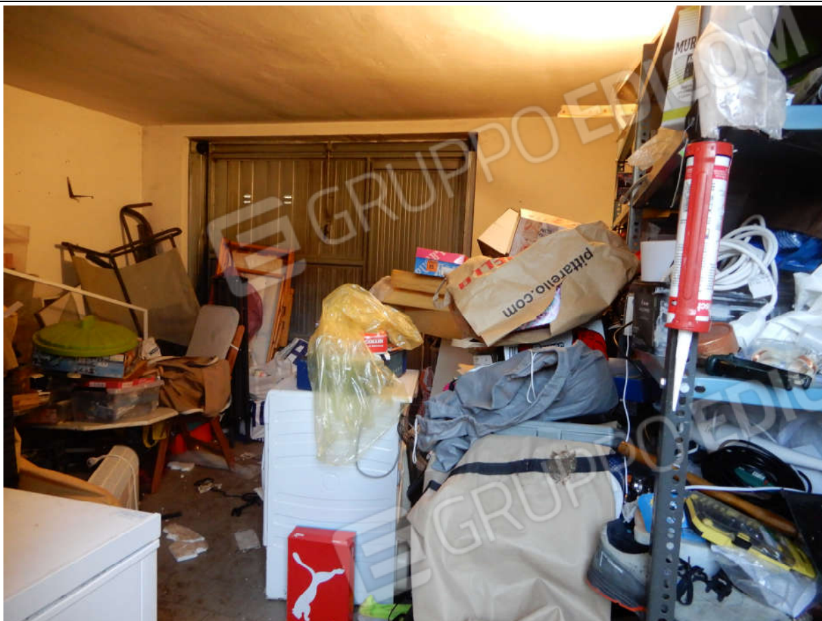
Piano terra – autorimessa - vista dall'ingresso posto all'interno dell'area cortilizia