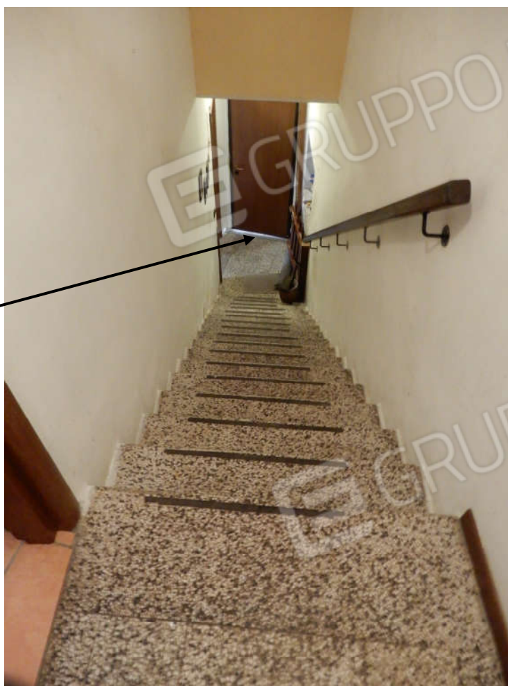
Porta d'ingresso da Via Asigliano