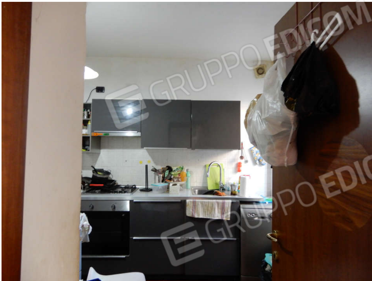
Piano terra - cucina