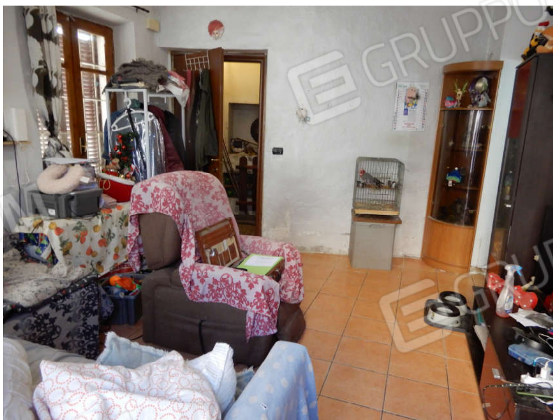
Piano terra - soggiorno