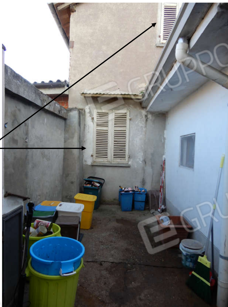
Piano terra – cortile Interno