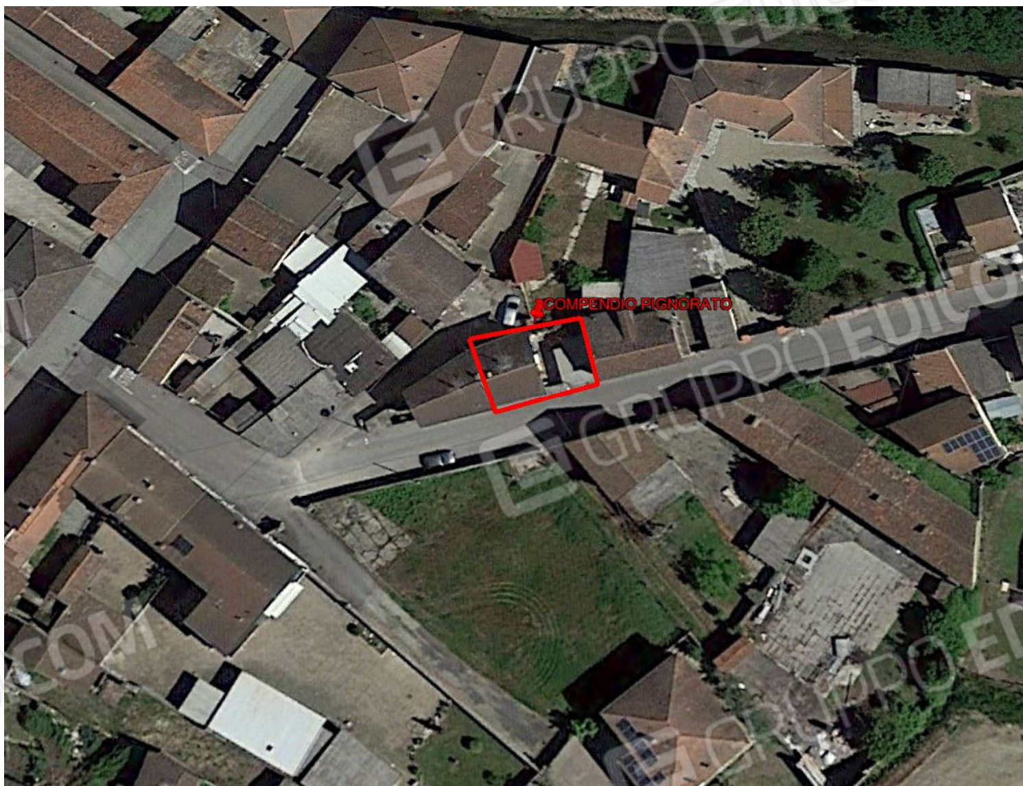
Vista satellitare ed inquadramento del bene oggetto di perizia