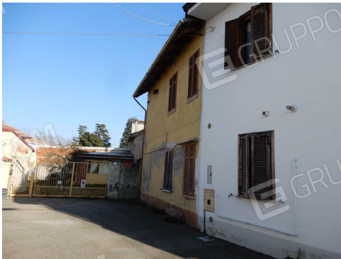
VICOLO COMUNALE - Prospetto Nord