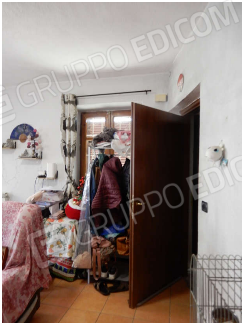
Piano terra abitazione Ingresso al soggiorno