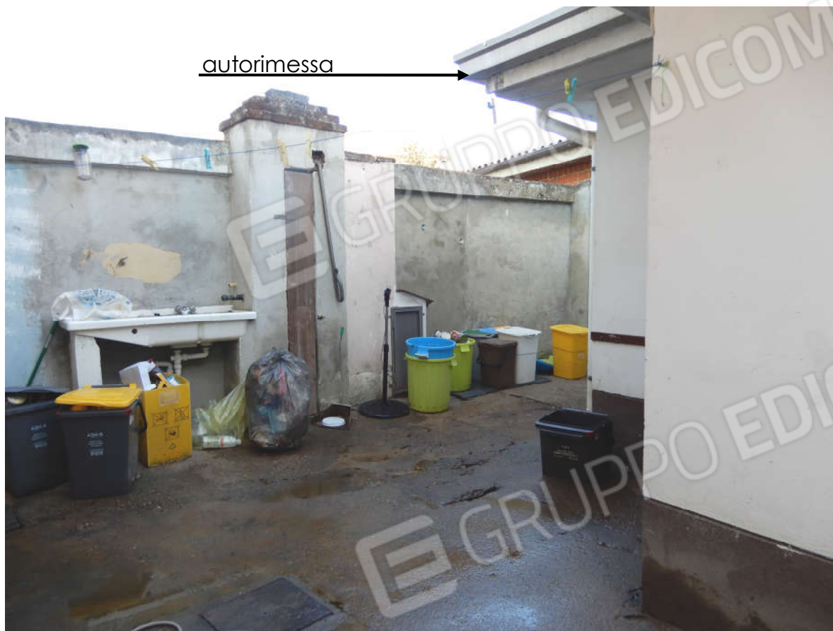
Piano terra – cortile Interno visto da ingresso carraio prospiciente Via Asigliano