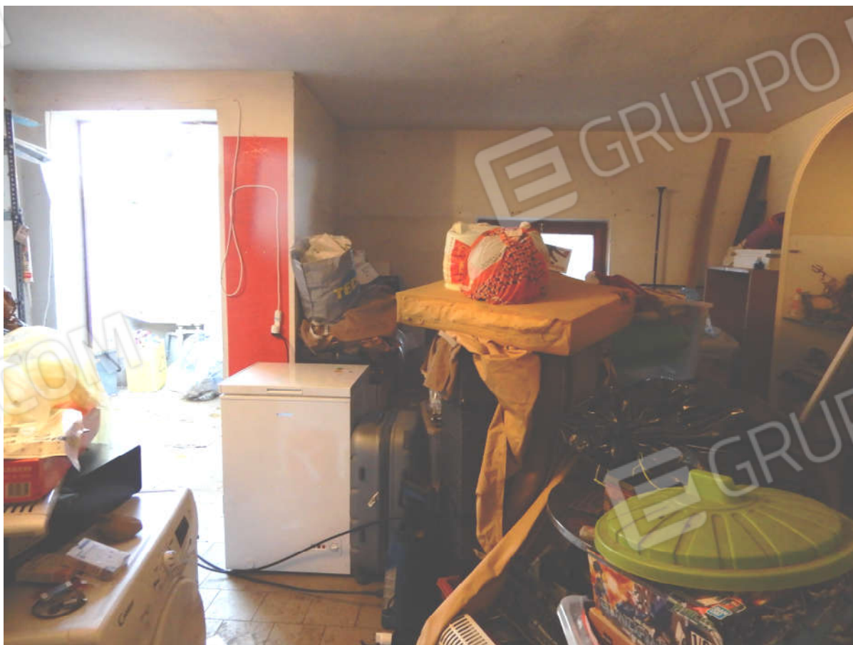
Piano terra – autorimessa