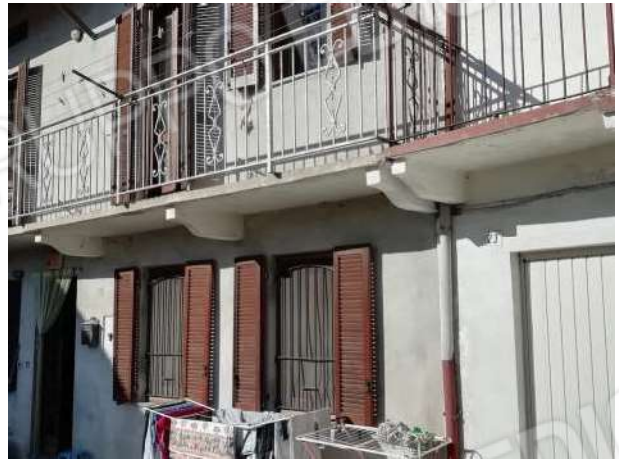
Abitazione vista fronte principale