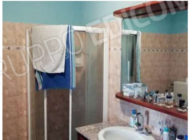
Bagno piano primo