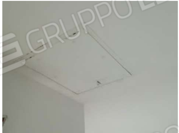
Botola accesso sottotetto