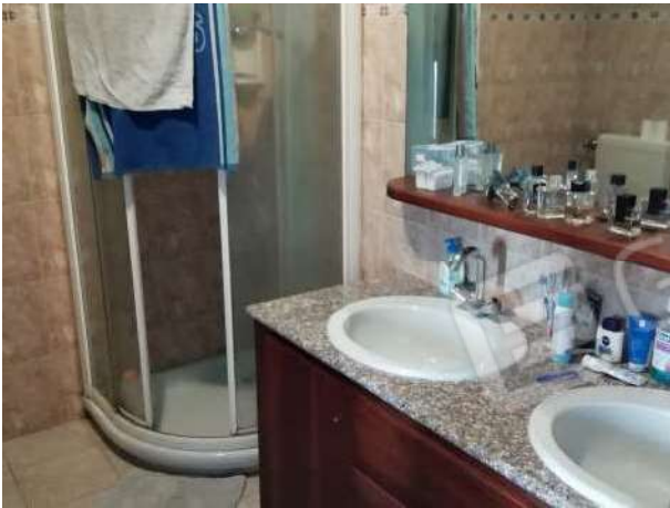
Bagno piano primo