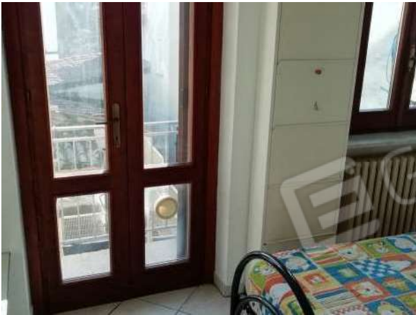
Camera piano primo