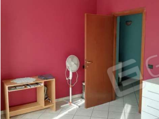
Camera piano primo