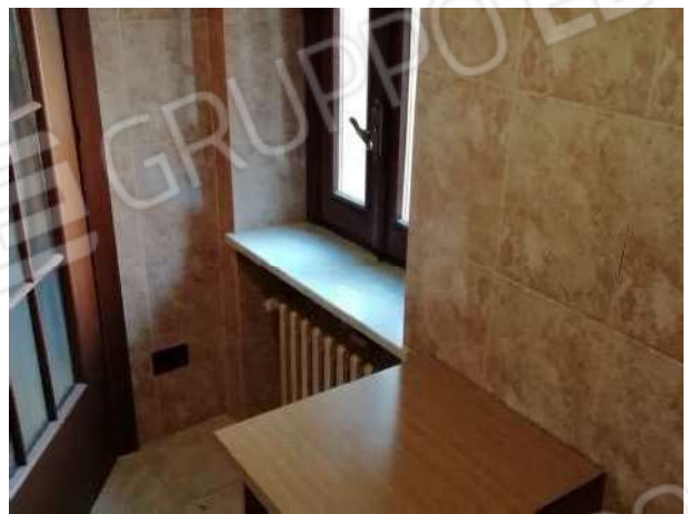
Bagno piano primo