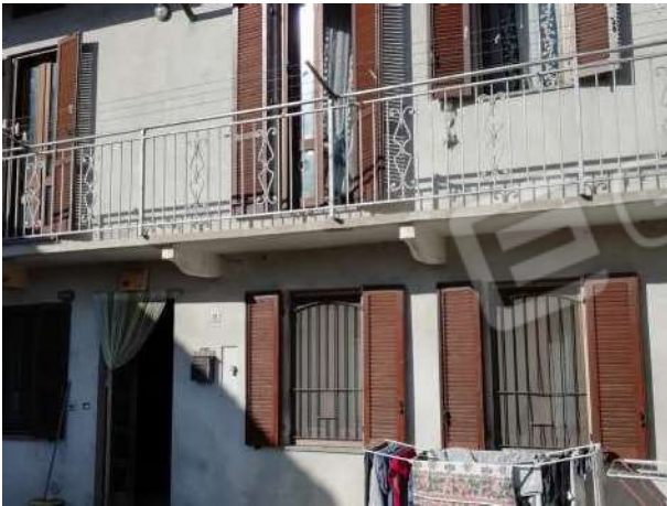
Abitazione vista fronte principale