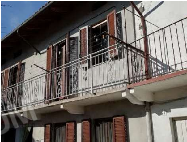
Abitazione vista fronte principale