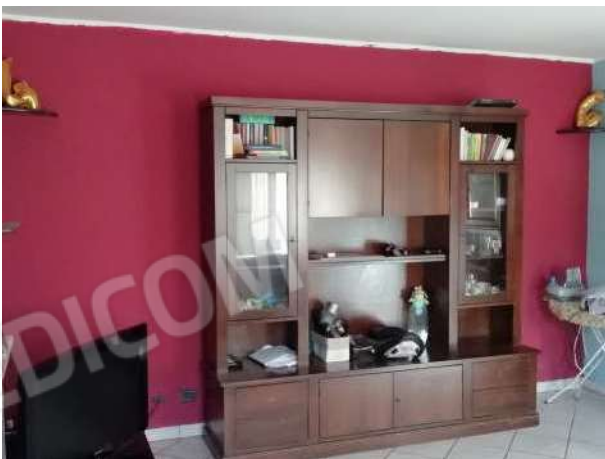
Soggiorno piano terreno