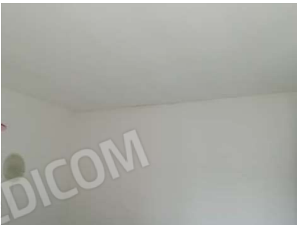
Camera piano primo