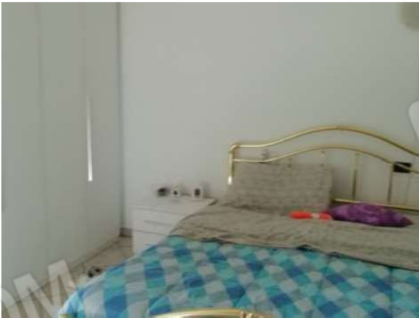
Camera piano primo