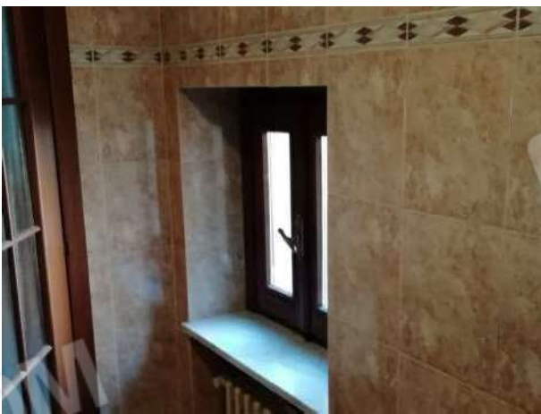
Bagno piano primo