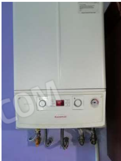
Particolare caldaia gas