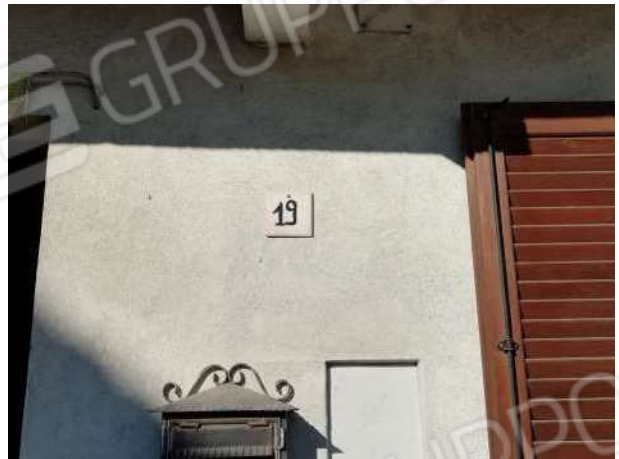
Abitazione vista fronte principale