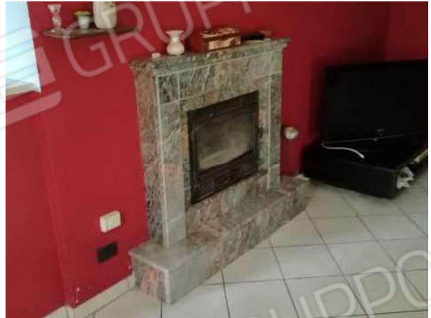
Caminetto piano terreno