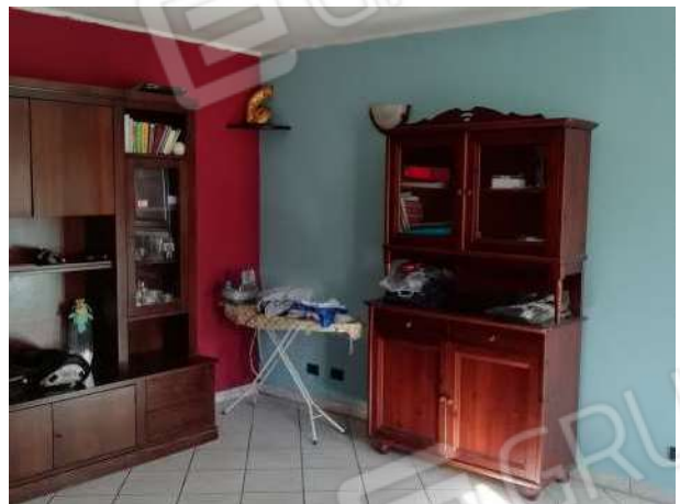
Soggiorno piano terreno