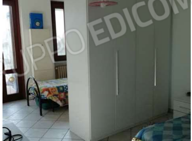
Camera piano primo