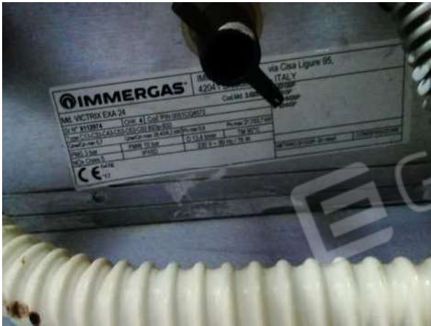
Particolare caldaia gas