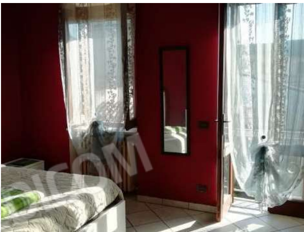
Camera piano primo