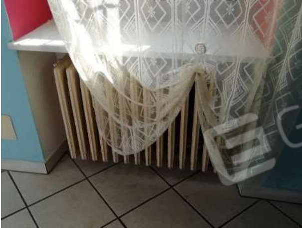
Particolare piano terreno impianto riscaldamento