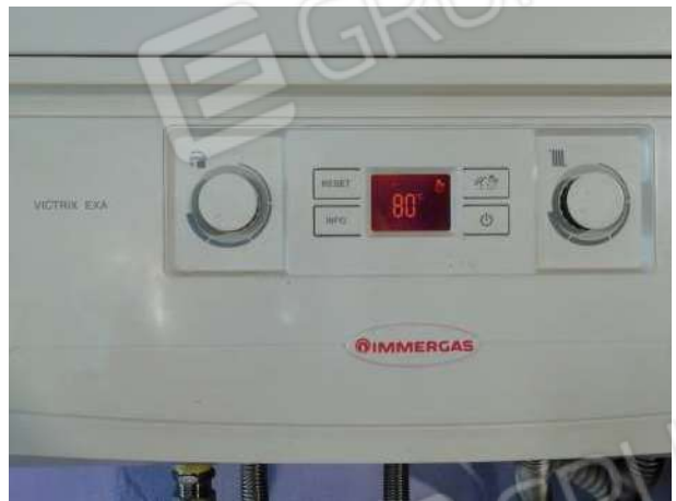
Particolare caldaia gas