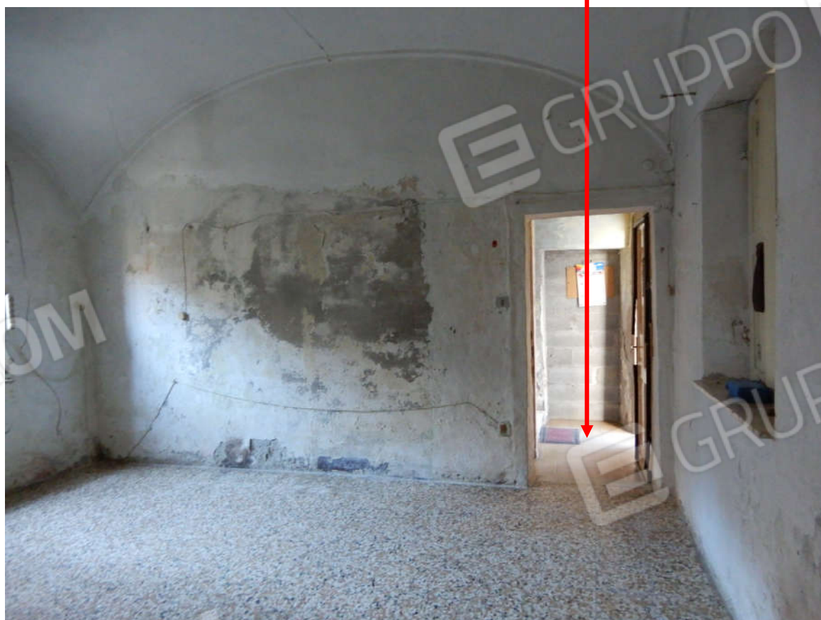
Piano terra – ingresso/cucina