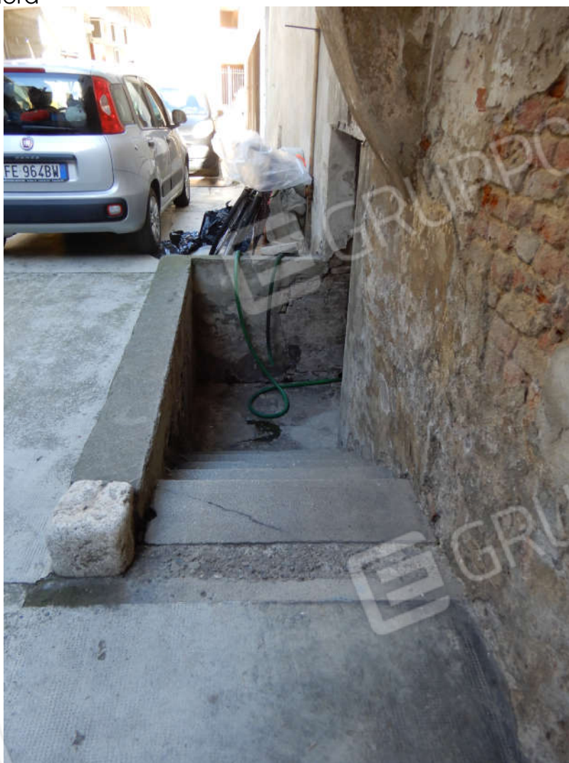
Piano terreno, scala di accesso alla cantina