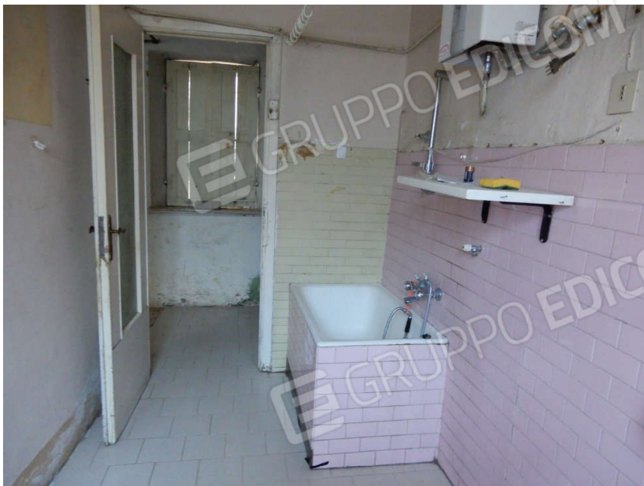
Piano terra – bagno