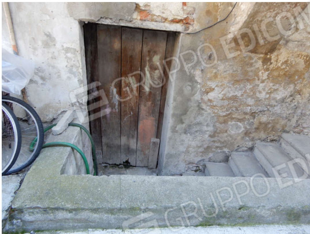
Porta di ingresso alla cantina