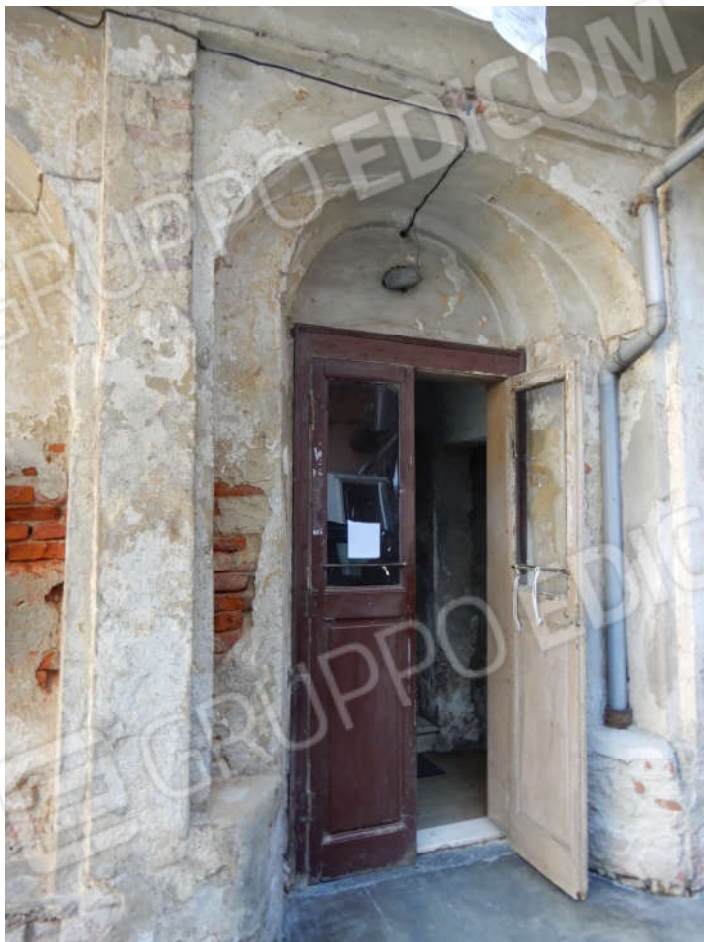
Ingresso comune agli appartamenti dei piani superiori