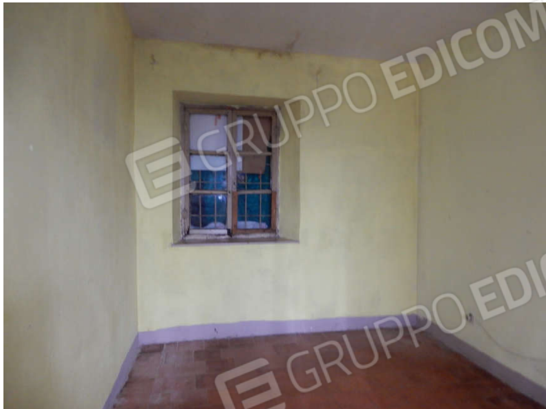
Piano rialzato - camera