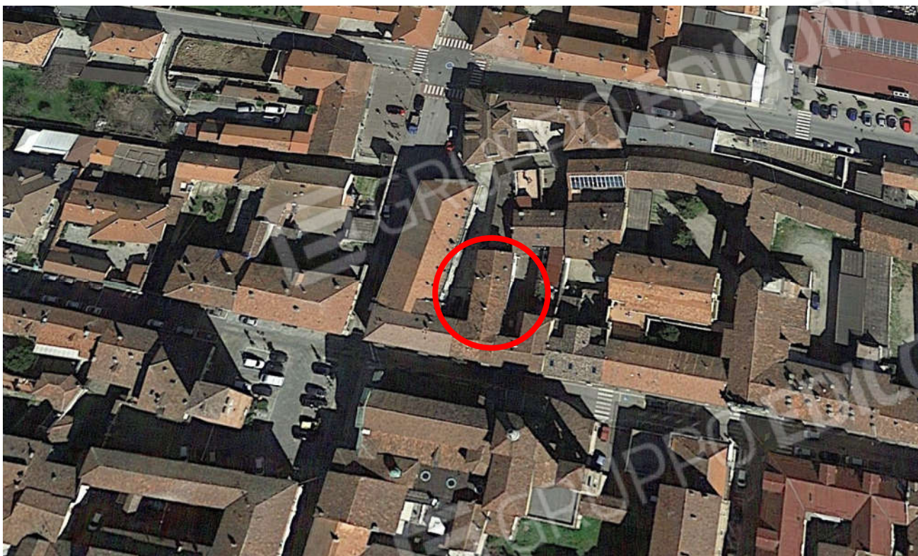
Vista satellitare ed inquadramento del bene oggetto di perizia