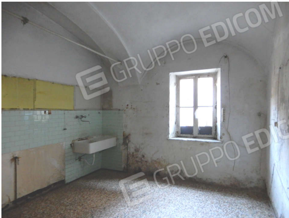
Piano terra – ingresso/cucina