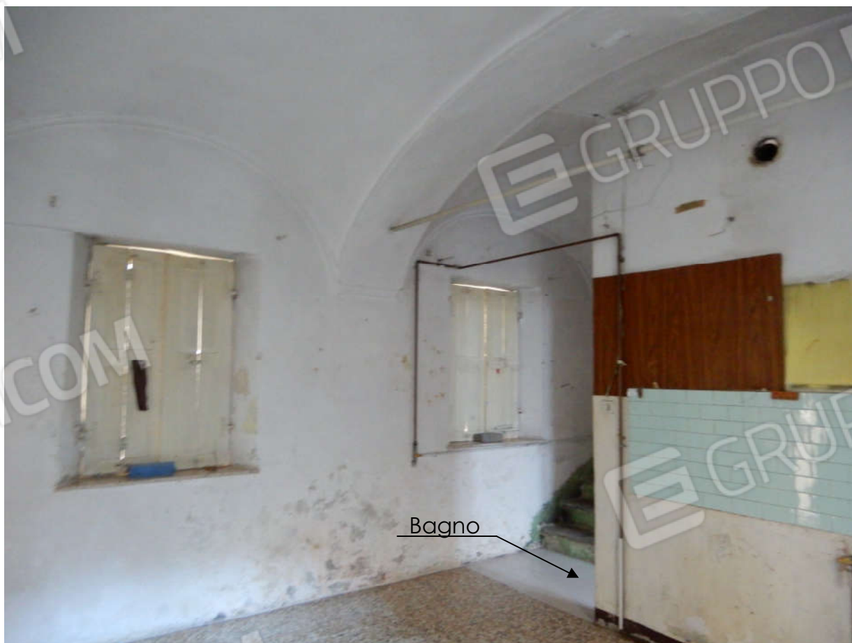
Piano terra – ingresso/cucina