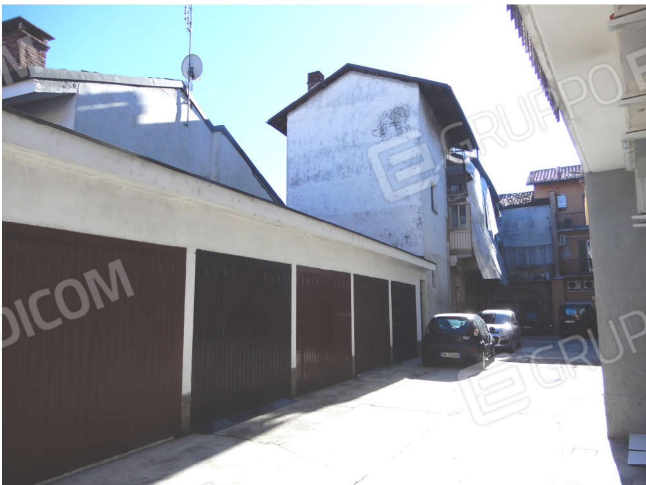
Vista da Via Mazzini – cortile su cui insiste l'ingresso al compendio pignorato